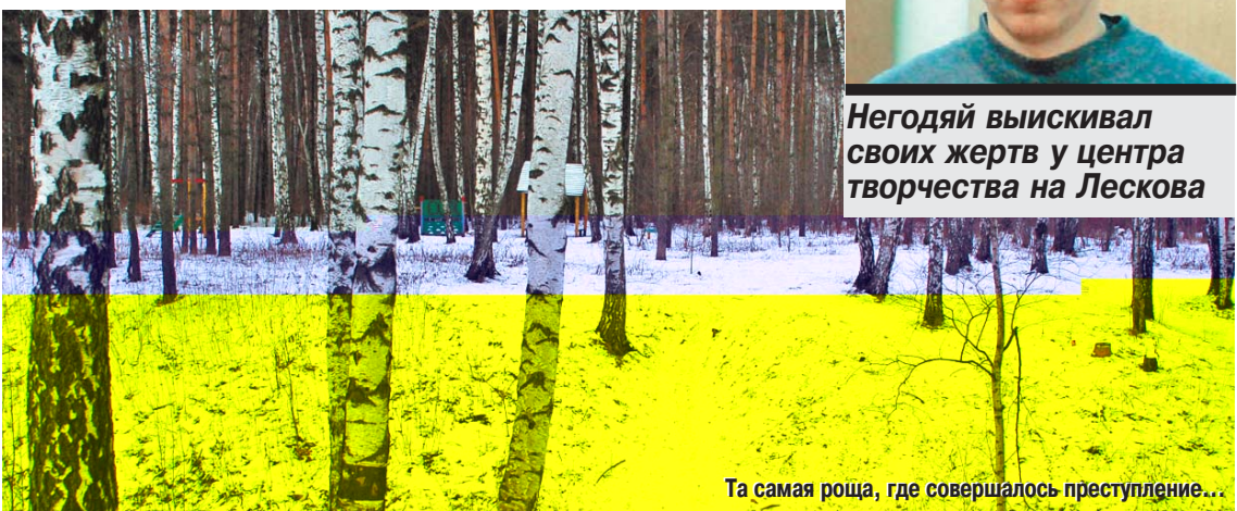
Та самая роща, где совершалось преступление...