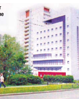
Таким будет новое здание

В уникальной школе будет два концертных зала, на 500 и 200 мест, пять репетиционных классов, 50 классов для индивидуальных занятий,