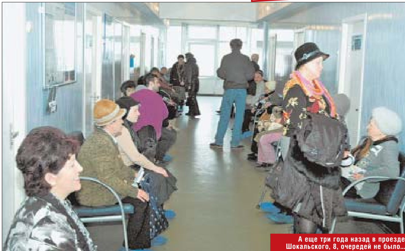
А еще три года назад в проезде Шокальского, 8, очередей не было...