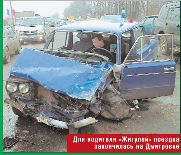
Для водителя «Жигулей» поездка закончилась на Дмитровке