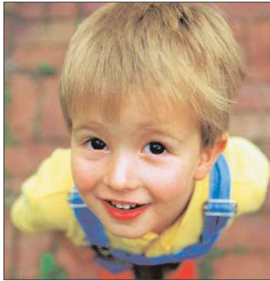
Дорогие читатели! Присылайте нам фотографии своих детей и интересные истории о них: 129090, г. Москва, просп. Мира, 18.