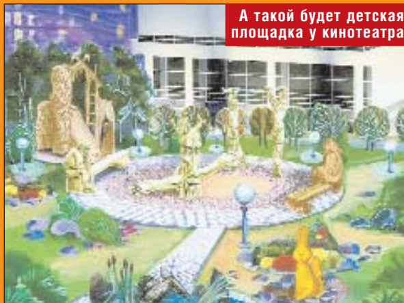
А такой будет детская площадка у кинотеатра