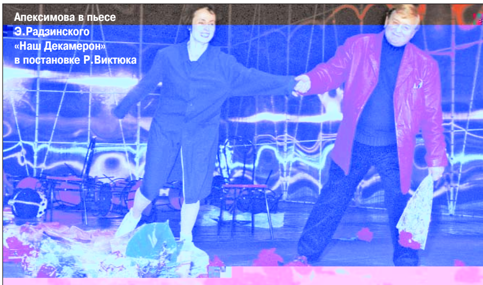
Апексимова в пьесе Э. Радзинского «Наш Декамерон» в постановке Р. Виктюка