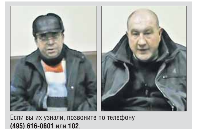
Если вы их узнали, позвоните по телефону (495) 616-0601 или 102.

Документы, которыми должны руководствоваться контролёры, перечислены на сайте ГКУ «Организатор перевозок» ( www.orgpmos.ru ).