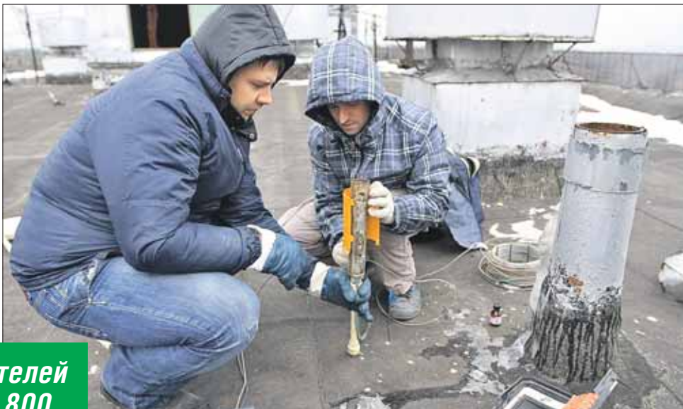
На крыше дома 1а на улице Академика Комарова. Заглушку на унитаз ставят через канализационный коллектор

Ещё совсем недавно, приняв такой звонок, диспетчер отвечала: «Ждите, мастер будет!» А теперь переспрашивает: «Какой, вы говорите, адрес? Минуточку... Нет, это не засор, это вам заглушку на канализацию поставили за долг по коммунальным платежам».