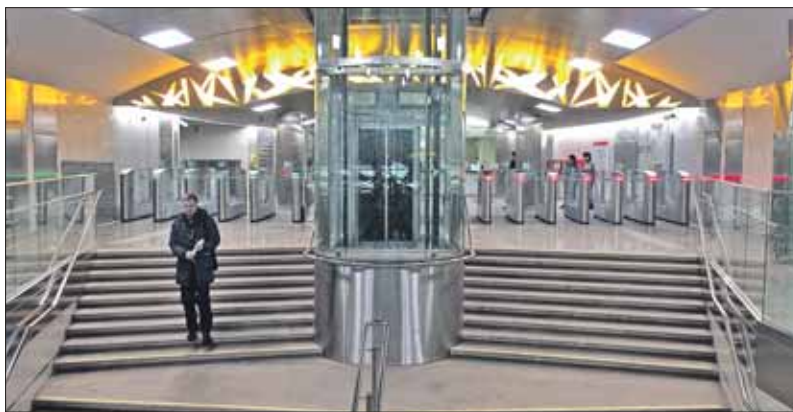
Новая станция — «Тропарёво»

— Главное, что этот участок возьмёт на себя большой поток людей, ко-