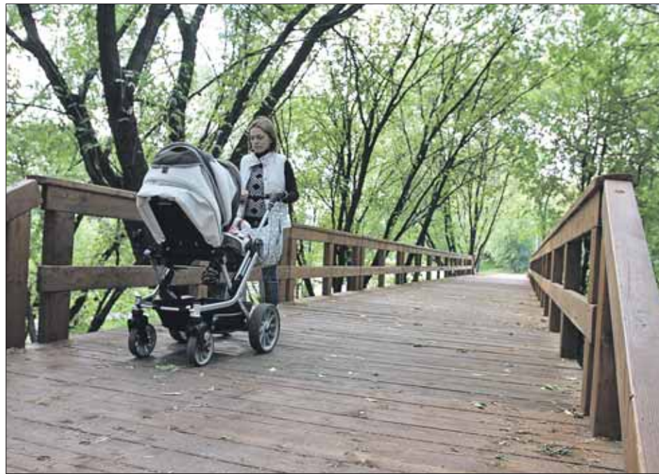
Благоустроенная зона отдыха в пойме реки Чермянки

Дмитровской линии метрополитена. Речь идёт о железнодорожных станциях Окружная, Владыкино, Ботаническая, Ярославская и о станциях метро «Фонвизинская», «Бутырская» и «Окружная».