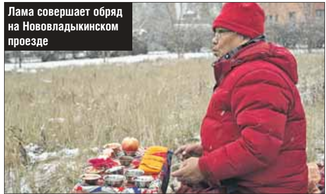
Лама совершает обряд на Нововладыкинском проезде