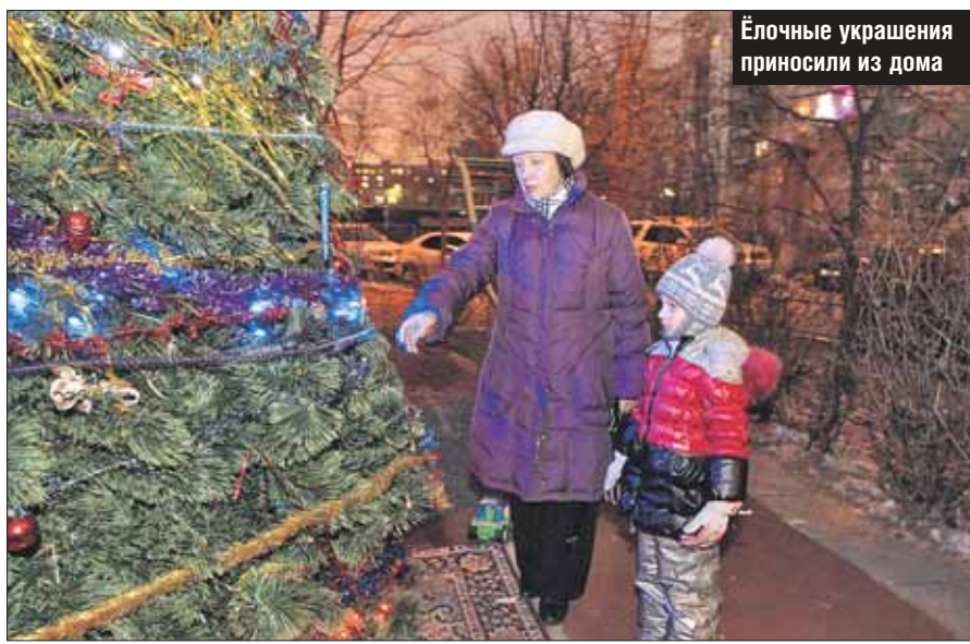
Ёлочные украшения приносили из дома