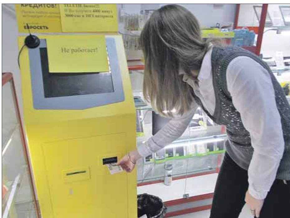
Платёжный терминал с лишней щелью на улице Декабристов, 156

Корреспондент «ЗБ» решил лично проверить конструкцию этого платёжного терминала. Действительно, под купюроприёмником зияла щель в полсантиметра. Увидеть её можно, лишь нагнувшись, и то если знаешь, что искать. Моя сторублёвка так же легко, как у читателя, отправилась в указанную щель.