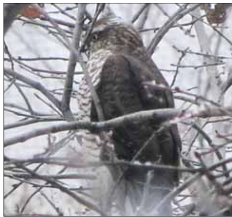
Жительница Бибирева сфотографировала птицу напротив своего окна