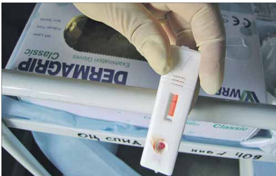
Если экспресс-тест показывает одну полоску — всё в порядке, если две — есть подозрение на ВИЧ

К кабинету анонимного обследования на ВИЧ-инфекцию ведёт отдельный вход с улицы. Вся процедура занимает минут десять: медсестра берёт кровь из вены. При этом посетителю присваивается номер, а вот ни имя, ни адрес, ни полис, ни даже телефон не спрашивают. Записывается только пол и год рождения. Предварительный результат можно уз-