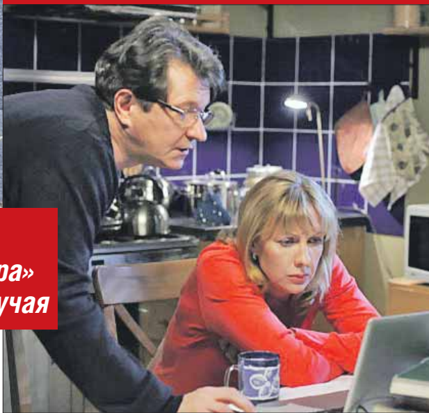
Кадр из сериала «Каменская»

— Ваши родители не имели отношения к теа-