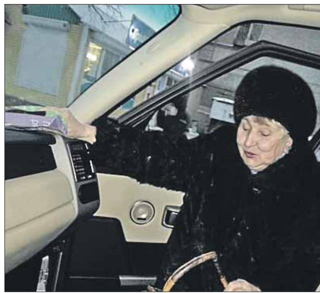
Льготное место зарезервировано в маршрутках «Автолайн»

У остальных компаний-перевозчиков договора с