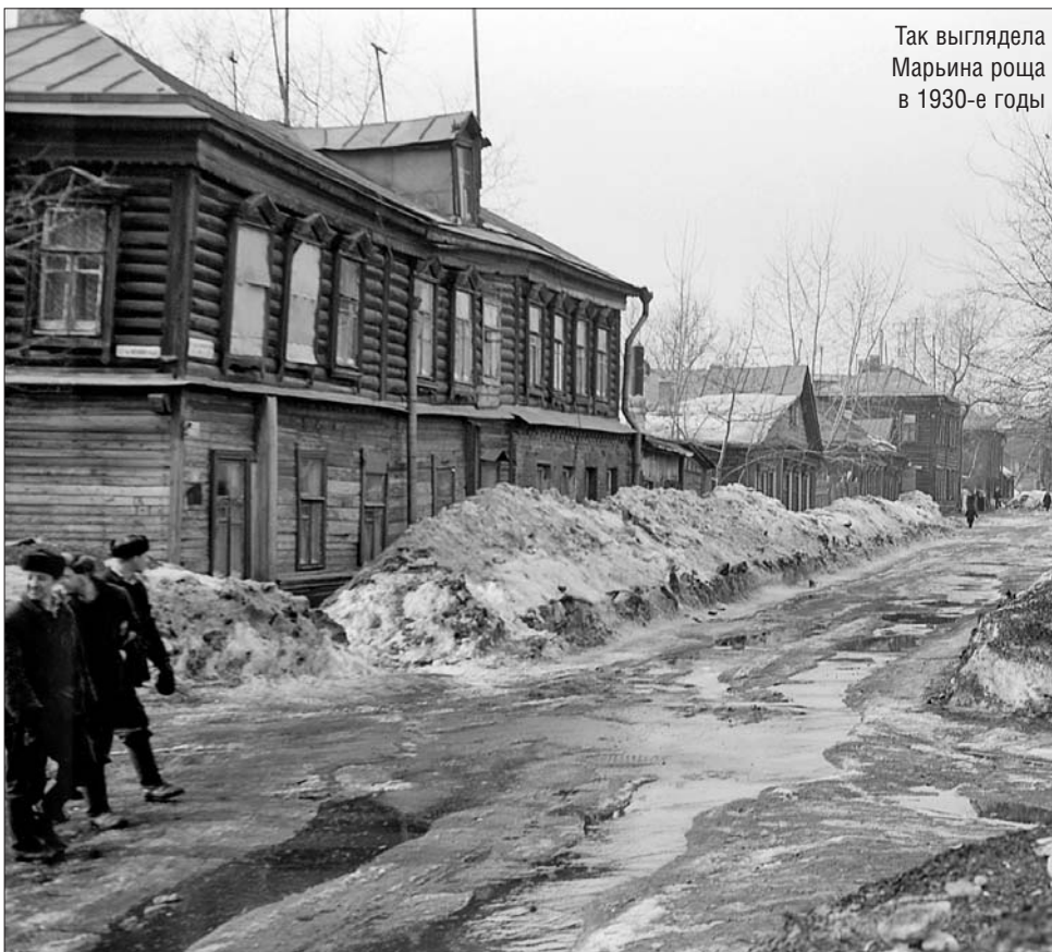
Так выглядела Марьиная роща в 1930-е годы

В Марьиной роще в конце 30-х годов жил Осип Мандельштам