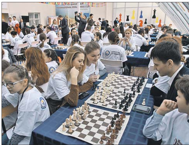
Урок может теперь попасть в Книгу рекордов Гиннеса