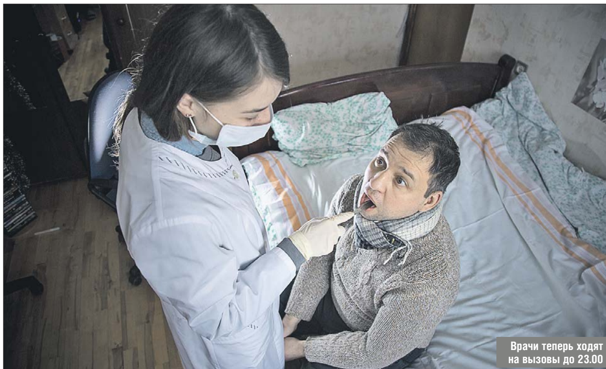
Врачи теперь ходят на вызовы до 23.00

Также увеличено время, в течение которого можно вызвать врача на дом. Теперь это можно сделать до 21.00, то есть специалист может приехать к больному до 23.00.