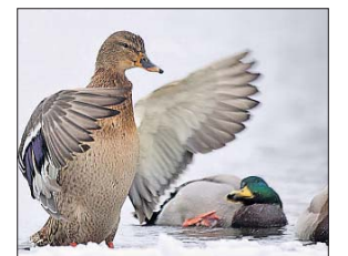
В округе зазимовали 3700 водоплавающих