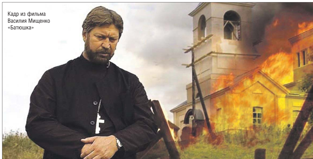
Кадр из фильма Василия Мищенко «Батюшка»

А вот усиленно молиться заболевшему человеку священники рекомендуют. Немало хороших молитв для этого легко найти в любом православном молитвослове. Среди них, например, и знаменитый 90-й псалом «Живый в помощи Вышняго», который издавна считается надёжной защитой от многих бед, в том числе и эпидемий.