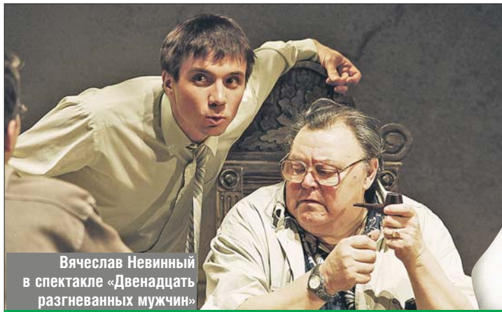
Вячеслав Невинный в спектакле «Двенадцать разгневанных мужчин»