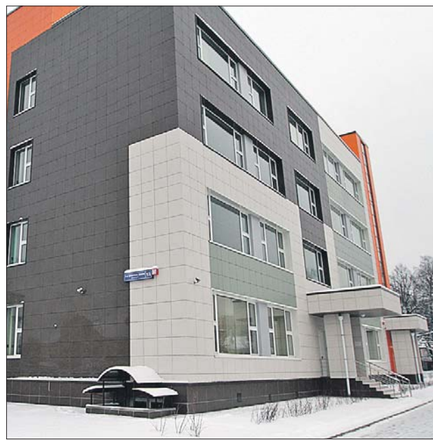
Новая школа в районе Северный