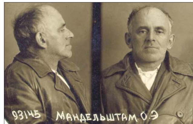
Заключённый Мандельштам скончался в лагере на Дальнем Востоке