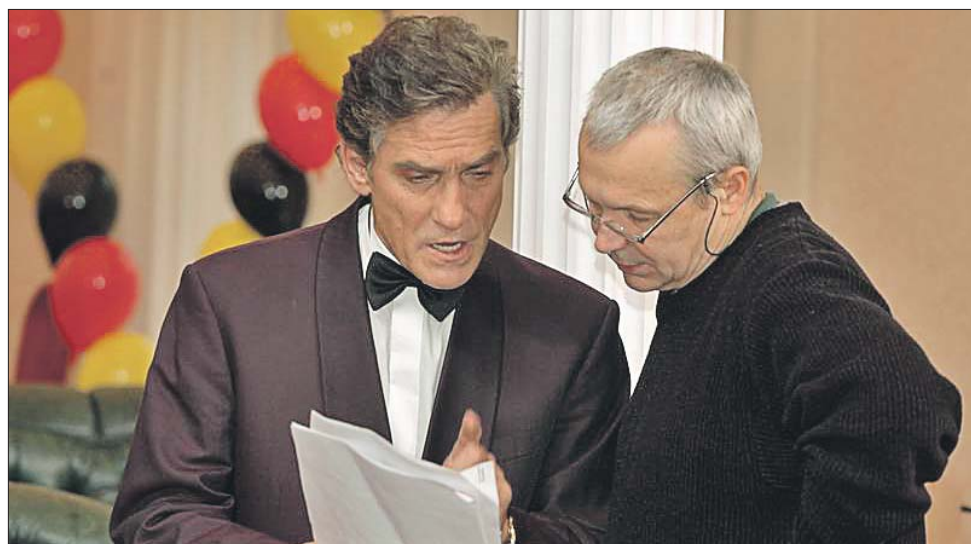
С Валерием Гаркалиным на съёмках фильма «Национальное достояние»

ми, у которых корона выросла после участия в сомнительном сериале. Но, слава богу, есть и хорошие примеры. Посмотрите, сколько молодёжи занято в спектаклях «Современника»! У Галины Борисовны Волчек, художественного руководителя нашего театра, требовательный подход к молодёжи, которую принимают в труппу. Но актёры имеют возможность по-настоящему раскрыться.