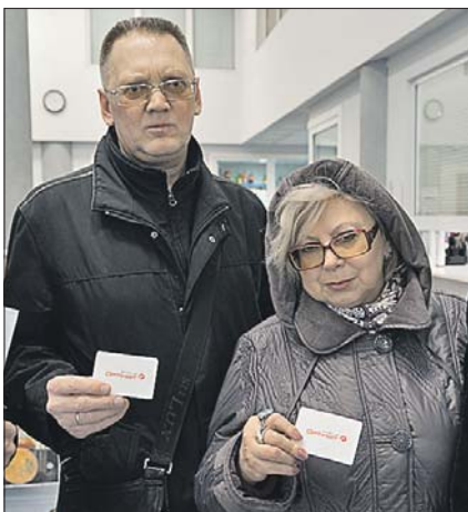
Клуб исчез, оставив клиентам на память абонементы

Десятки жителей Алексеевского района в связи с предстоящим открытием фитнес-клуба купили «со скидкой» годовые абонементы. Но клуб так и не открылся.