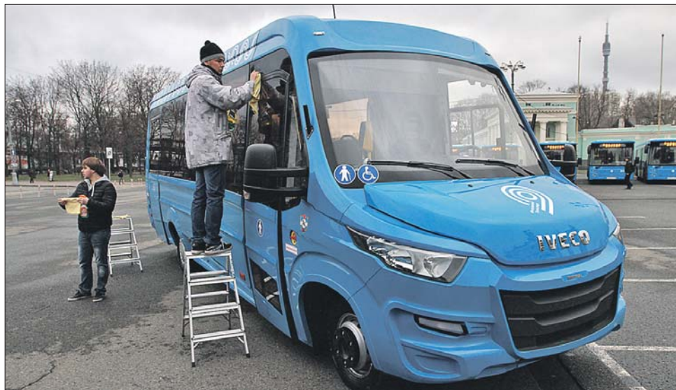
Узнать маршрутные такси нового образца можно по синему цвету

Самое главное новшество: в маршрутках нового образца, независимо от размера машин и от того, какая организация будет выпускать их на линию, смонтируют обычные валидаторы — такие же, как в автобусах ГУП «Мосгортранс». Это значит, что и проездные документы в них будут действовать те же: например, карта «Тройка» или соцкарта для льготников. Провалидировать билет — это, конечно, удобнее, чем передавать водителю деньги во время движения. Во многих случаях пассажиру удастся ещё и существенно сэкономить, как при использовании тарифа «90 минут» в случае пересадки с метро на маршрутку. А все тарифы на новых маршрутках тоже станут общими с городскими автобусами. Главное же — пен-