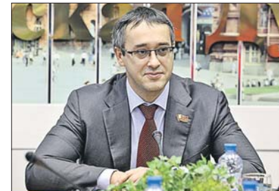
Председатель Мосгордумы Алексей Шапошников

26 января на расширенном заседании президиума МГРО партии «Единая Россия» обсудили Федеральный закон от 29 декабря 2015 года №399, дающий право регионам расширить список получающих льготы на оплату капитального ремонта.