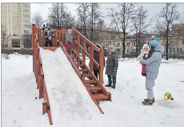
Идея установить на бульваре горку принадлежит жителям района

Как сообщили «ЗБ» в организации, с просьбой установить в этом месте горку в управу района и префектуру округа обрати-