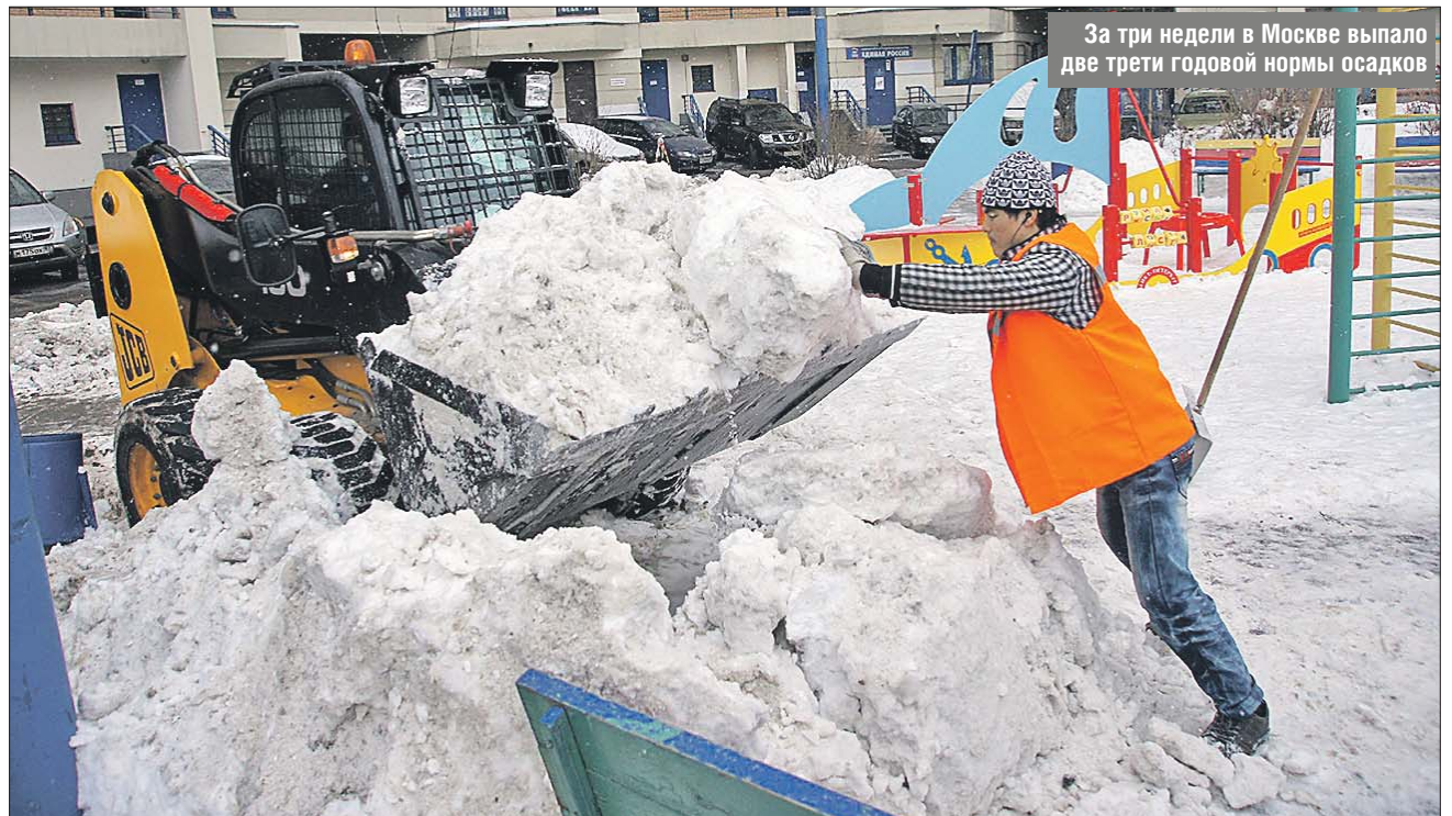
За три недели в Москве выпало две трети годовой нормы осадков

Справляться со стихией быстро и эффективно удаётся благодаря принципиаль-