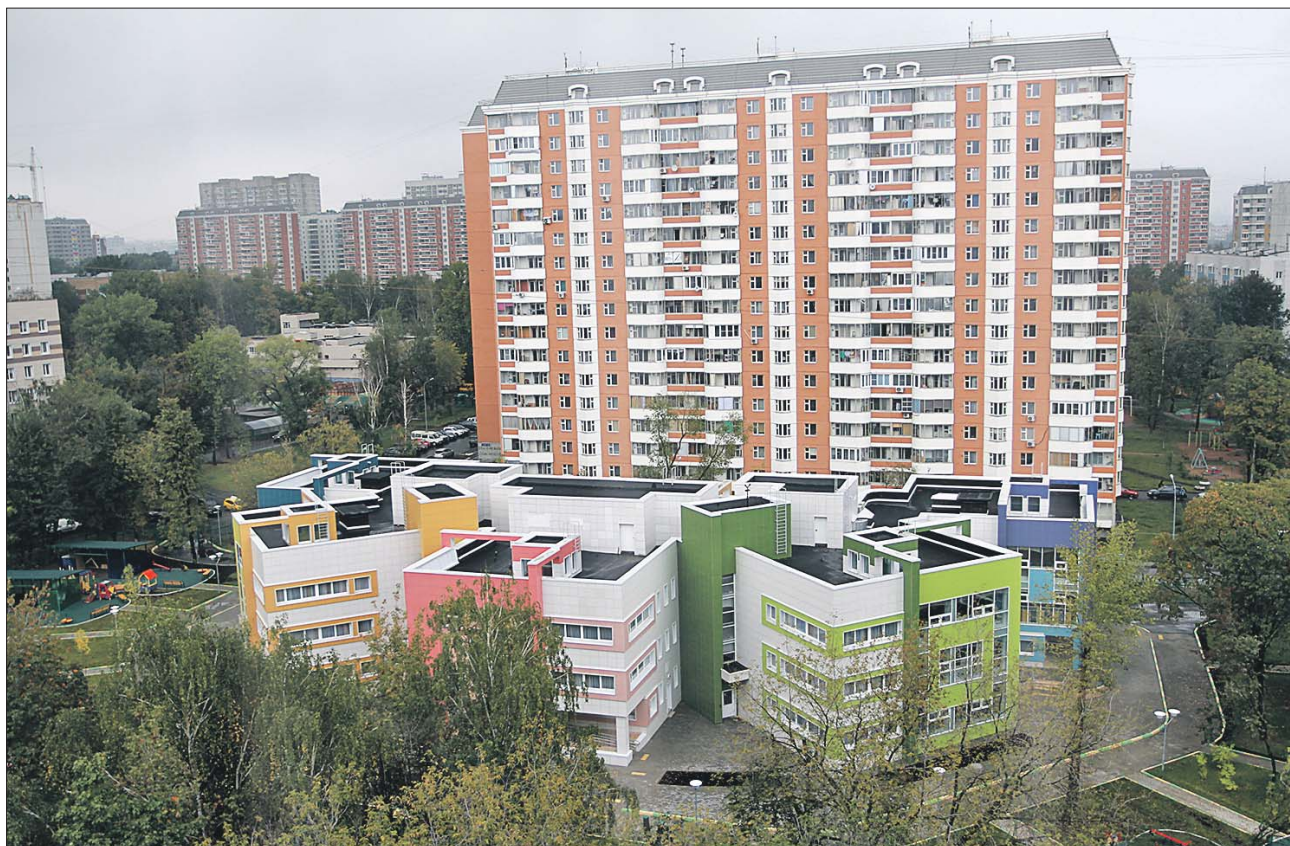
На Ясном проезде ввели в строй детский сад на 125 мест

— В условиях сложившейся экономической ситуации очень важно сохранить то, что было сделано в предыдущие годы, — подчеркнул Визаулин.