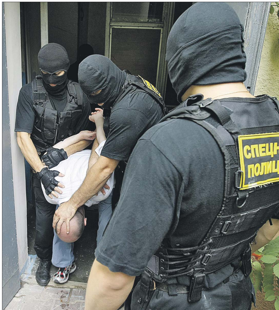
Полиция обнаруживает нарколаборатории в квартирах, гаражах и сараях