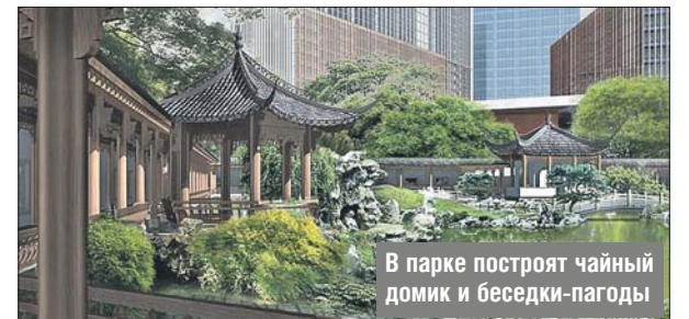
В парке построят чайный домик и беседки-пагоды

По информации Ассоциации ландшафтных архитекторов России, парк будет оформлен в китайском стиле, посадят даже деревья и кустарники, произрастающие в Китае. По-