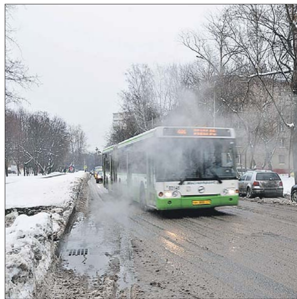
Энергетики пообещали устранить проблему за две недели