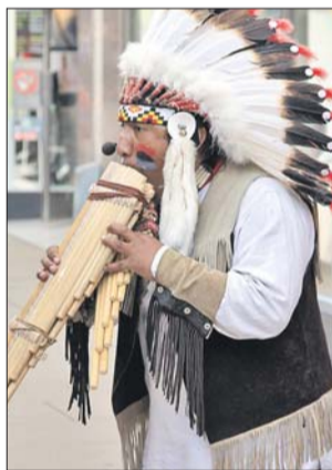
Приём заявок на выступление уже начался

Приём заявок на сайтах парков уже начался. Согласно правилам артисты смо-