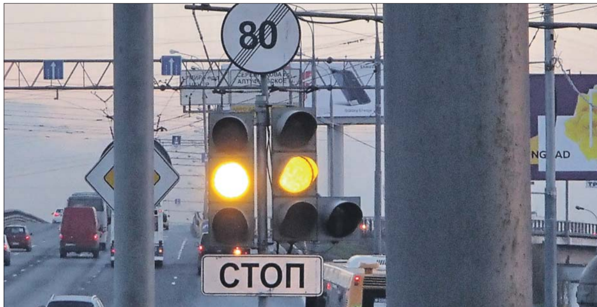
Знак перед въездом на Северянинский путепровод чётко показывает, где надо снизить скорость

Раньше после путепровода (недалеко от моста МКЖД) висел знак, снова вводивший разрешённую скорость 80 км/ч, а у дома 167 (перед въездом на Ростокинский мост) — знак, этот режим отменяющий. Именно на его исчезновение и обратила внимание читательница. Но дело в том, что месяца полтора назад знак у моста МКЖД убрали. Соответственно, и