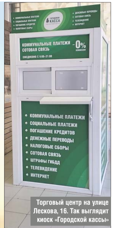
Торговый центр на улице Лескова, 16. Так выглядит киоск «Городской кассы»

Клиентов привлекали возможностью оплатить ЖКУ без комиссии