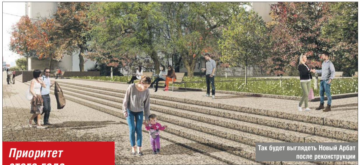
Так будет выглядеть Новый Арбат после реконструкции

Здесь будут созданы комфортные и безопасные условия для будущих пас-