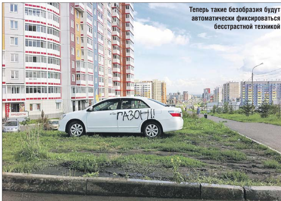
Теперь такие безобразия будут автоматически фиксироваться беспристрастной техникой

Пешие сотрудники МАДИ будут фиксировать нарушения с помощью программно-аппаратных комплексов «Мобильный инспектор» в автоматическом режиме — так же как и парковку под знаками, запрещающими остановку и стоянку. Данные комплексов «Мобильный инспектор» будут передаваться в информационную систему МАДИ для последующего формирования постановлений по делам об административных правонарушениях.