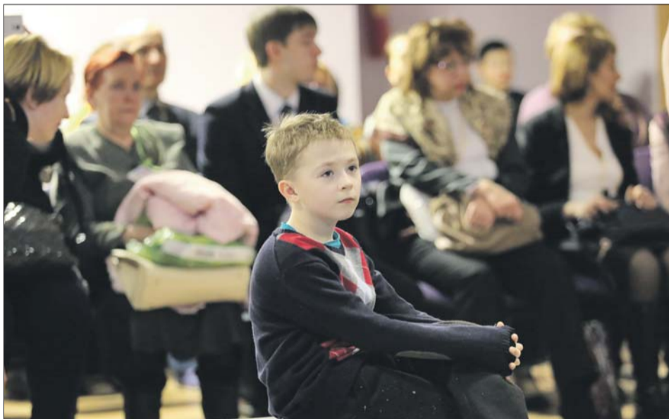
Обсуждения проходили на 17 дискуссионных площадках

Предложения активных родителей будут услышаны