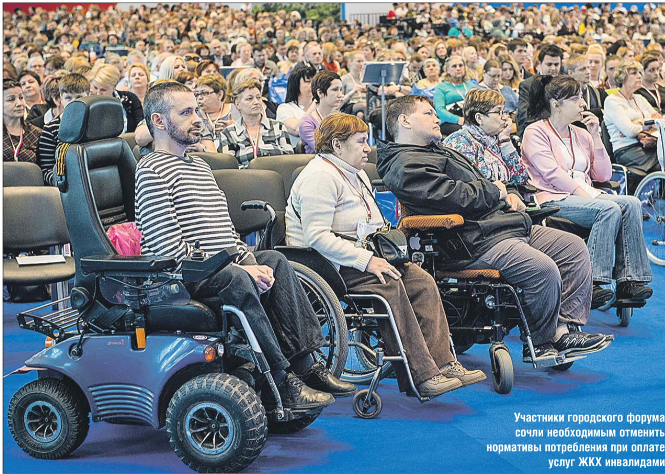
Участники городского форума сочли необходимым отменить нормативы потребления при оплате услуг ЖКХ инвалидами

Обсуждение продолжилось на масштабном город-