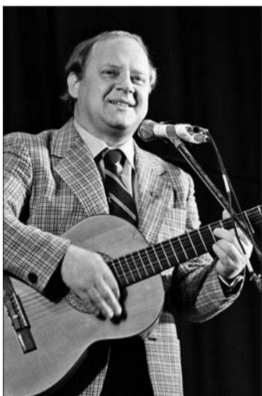
Знаменитый бард Юрий Визбор для своей внучки стал словно героем из книжек Хемингуэя