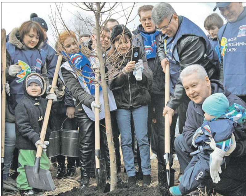
Вместе с москвичами мэр принял участие в работе

23 апреля во время общегородского субботника масштабные работы развернулись на Северо-Западе столицы в парке Братцево.