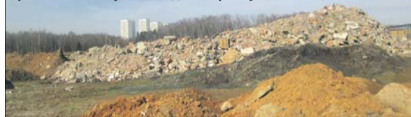
Грязь из этой кучи попадает в реку