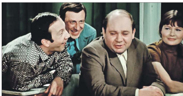
Кадр из фильма «Большая перемена».

За 70 лет в школе сменилось несколько поколений учеников. В 1946 году сюда пришли доучиваться фронтовики. Потом учи-