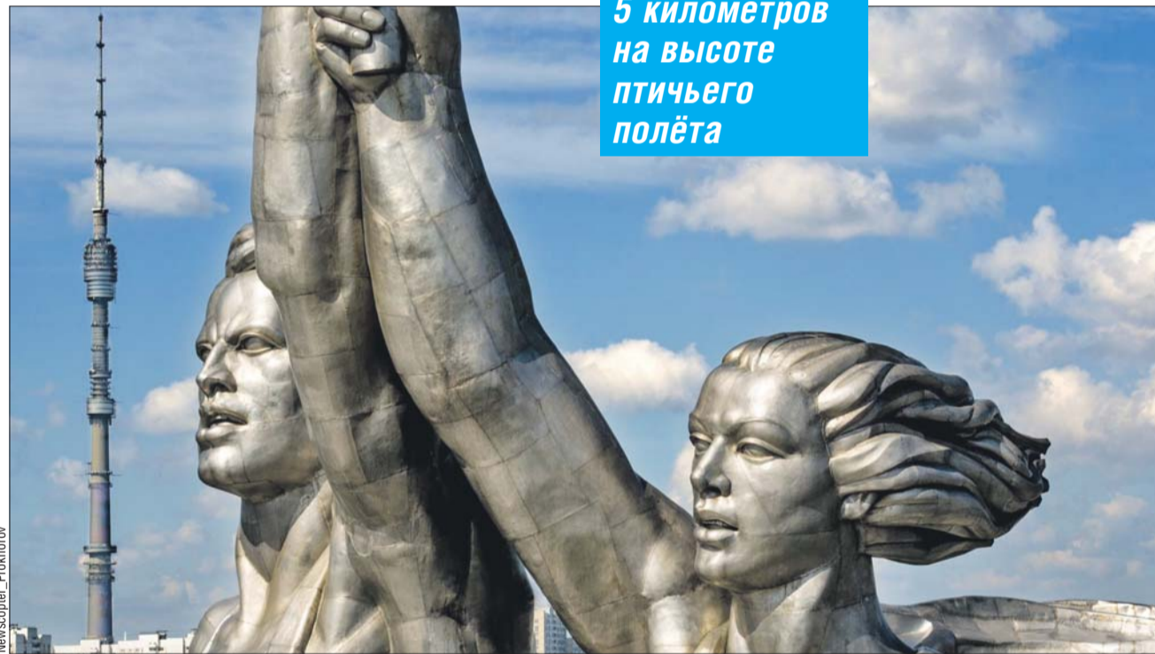
Так «Рабочего и колхозницу» может снять только беспилотник

РАБОТА рядом с домом РАБОТА рядом с домом РАБОТА рядом с домом РАБОТА рядом с домом