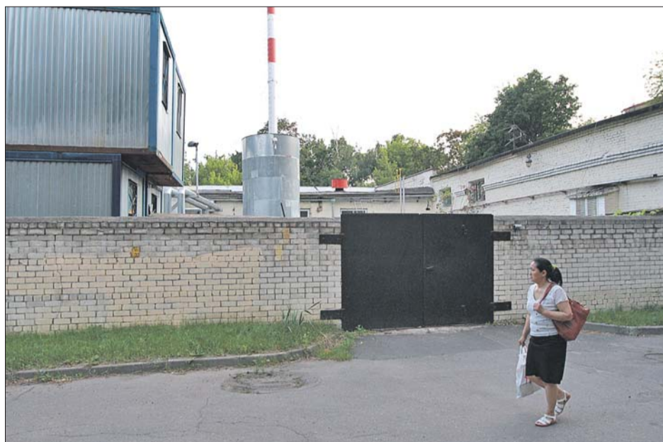
Директор котельной отказался что-либо объяснять ничего не понимающим людям

Ситуацию прояснили в управе Бабушкинского района. Речь идёт о девяти домах на улице Лётчика Бабушкина и на Анадьрском проезде. Это бывшие ведомственные дома, которые в своё время были подключены к одной котельной. Однако в лихие девяностые