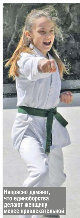
Напрасно думают, что единоборства делают женщину менее привлекательной

Бабушкинский парк: ул. Менжинского, 6, стр. 3