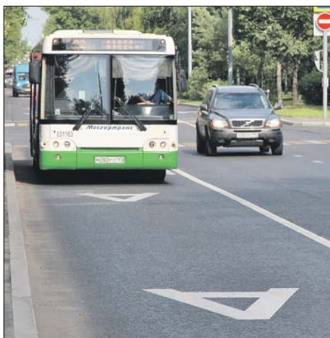
На Череповецкой улице уже нанесли разметку