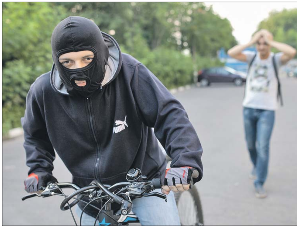
Двухколёсный транспорт угоняют на улицах и даже из подъездов

На прошлой неделе в Бутырском районе задержали ранее судимого мужчину, который похитил дорогой велосипед. К моменту задержания он уже успел продать его через сайт «Авито» всего за 5 тыс. рублей. Покупателя отыскали. Разуме-