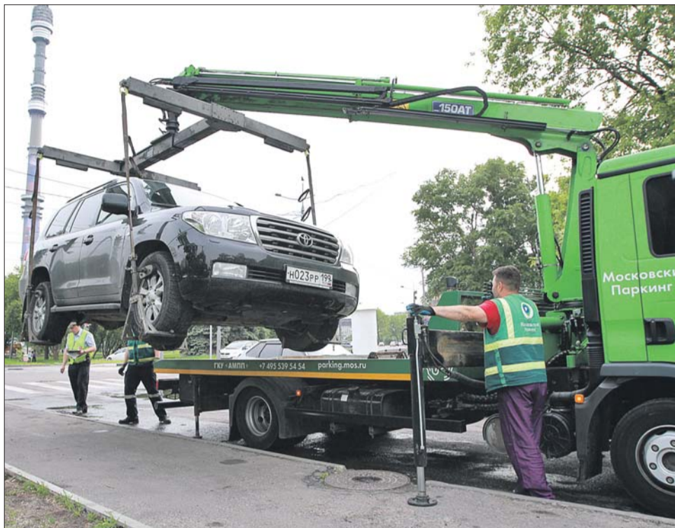
Раньше владельцу эвакуированного авто приходилось сначала оплачивать расходы на перемещение и хранение машины