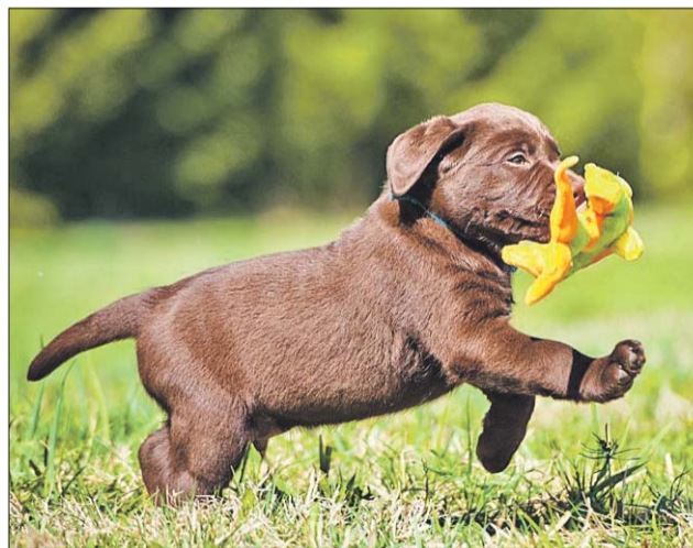
Вакцинировать животных от бешенства нужно каждый год

Выездные прививочные пункты, где можно будет бесплатно сделать домашнему питомцу прививку от бешенства, возобновят работу в августе: в течение месяца ветеринары будут работать в четырёх районах округа.