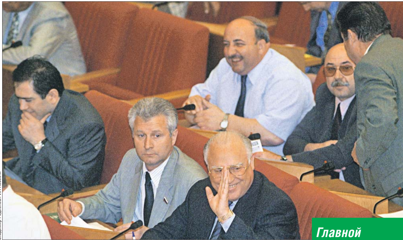
За время работы третьей Думы было принято восемь кодексов, в том числе Земельный и Налоговый