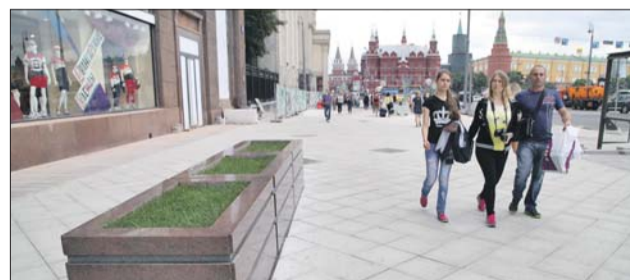
На некоторых участках улицы уже можно пройти по новому тротуару

По словам Гезе, серый гранит привезут из Санкт-Петербурга. Также было очень важно правильно подобрать деревья, которые справлялись бы с суровым климатом.