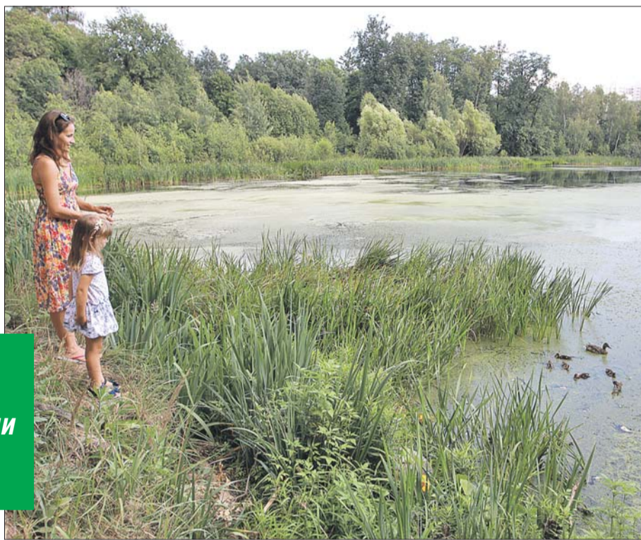
Любимое место отдыха жителей района потихоньку зарастает тиной и осокой

— Раз в год мы совместно с экологами Мосприроды и волонтерами проводим мероприятия по очистке пруда. Убираем мусор, чистим от заболачивания береговую линию, — говорит