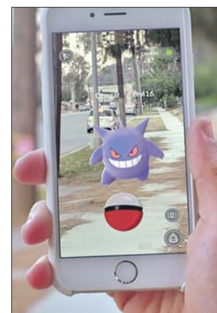
Эти маленькие существа свели с ума весь мир

Охранники попытались стащить мужчину с автомобиля, однако тот закричал, что машина — его собственная, а сам он ловит покемона. От вызова скорой помощи ловца спасли прохожие,