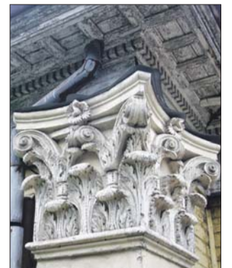
Здание было построено в 1910-х годах, но стилизовано под барочные дворцы времён Петра I