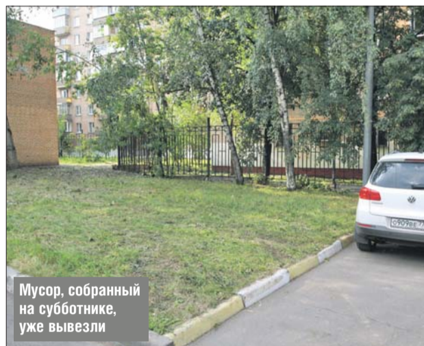
Мусор, собранный на субботнике, уже вывезли

Решить возникшую проблему с вывозом собранного мусора помогли в префектуре СВАО, предоставив медцентру несколько