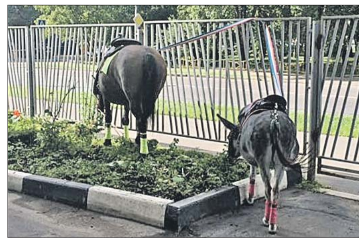
До ценных растений нарушители не дотянулись