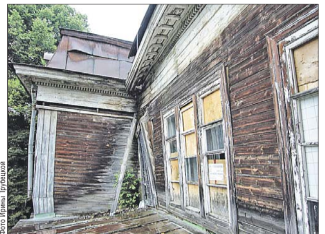
Сейчас здание разрушается