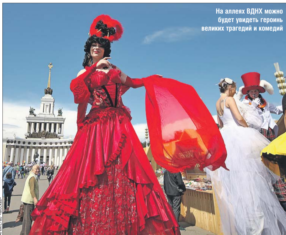
На аллеях ВДНХ можно будет увидеть героинь великих трагедий и комедий

— Откроет фестиваль концерт «Большая мечта обыкновенного человека», который проведёт 29 июля в 21.00 в Зелёном театре актёр Данила Козловский. Звезда фильмов «ДухLess», «Легенда №17», «Экипаж» исполнит лучшие произведения Фрэнка Синатры, Нэта Кинг Коула, Дина Мартина, Тони Беннетта и Сэмми Дэвиса-младшего под аккомпанемент симфонического оркестра, — рас-