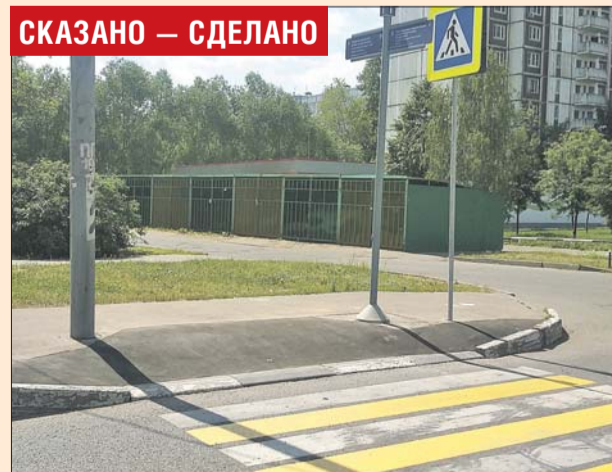
На дорогу нанесли разметку, рядом установили знак

После поручения Валерия Виноградова окружной Комиссии по безопасности дорожного движения ГБУ «Автомобильные дороги СВАО» были выполнены работы по обустройству пешеходного перехода: нанесена горизонтальная дорожная разметка и установлены дорожные знаки «Пешеходный переход».