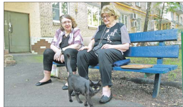
Если не положить на такую лавку подушечку, колени окажутся на уровне груди