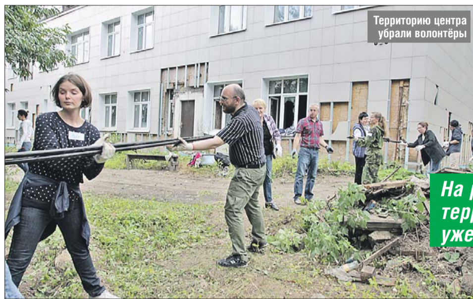
Территорию центра убрали волонтеры

На расчищенной территории уже высадили цветы