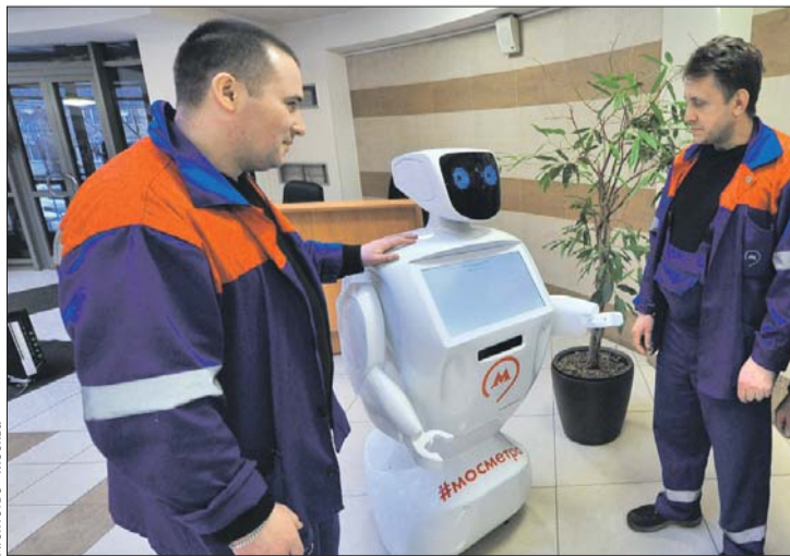
У Метроши — голубые глаза и экран на груди