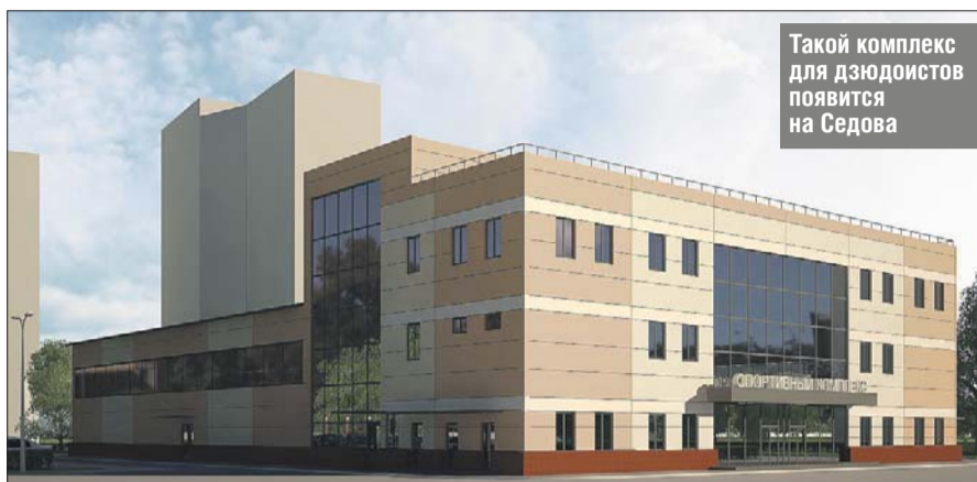
Такой комплекс для дзюдоистов появится на Седова

Как отметили в компании «Большая спортивная арена «Лужники», в зале для занятий разместят четыре ковра, на каждом из которых одновременно