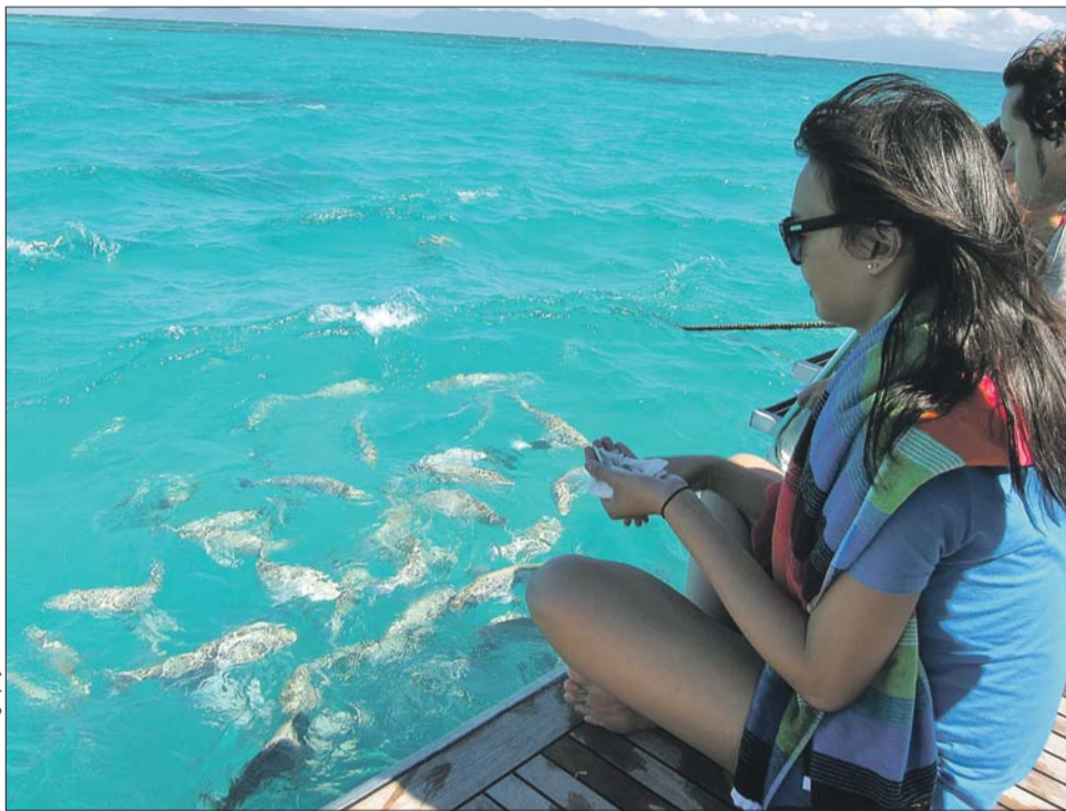
В некоторых странах эта идиллическая картинка сразу привлечёт внимание стражей закона

О том, что нельзя делать в той или иной стране, нас обязаны информировать туристические компании. В тот самый момент, когда мы