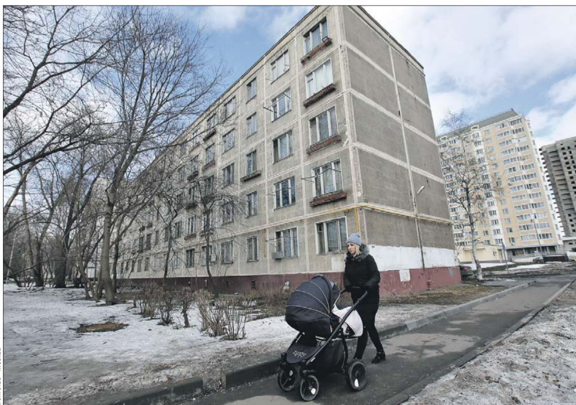
Большинство пятиэтажек физически и морально устарели уже в конце 1980-х годов

Из старых пятиэтажек жители будут переезжать сразу в новые квартиры