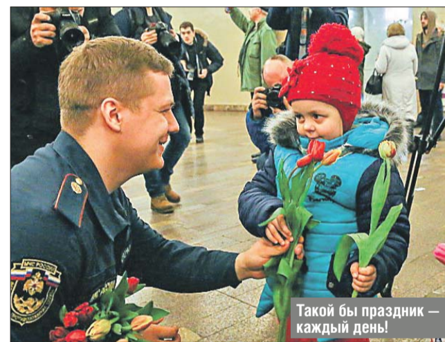
Такой бы праздник — каждый день!