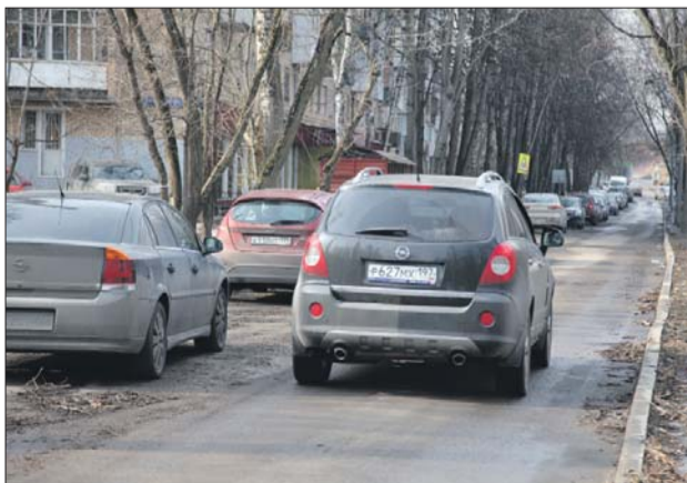
Сейчас на узкой Мезенской разъехаться непросто