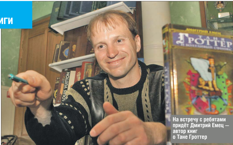
На встречу с ребятами придёт Дмитрий Емец — автор книг о Тэне Гроттер

А любители живописи смогут посетить мастер-класс по линогравюре, который пройдёт 30 марта в 17.00.