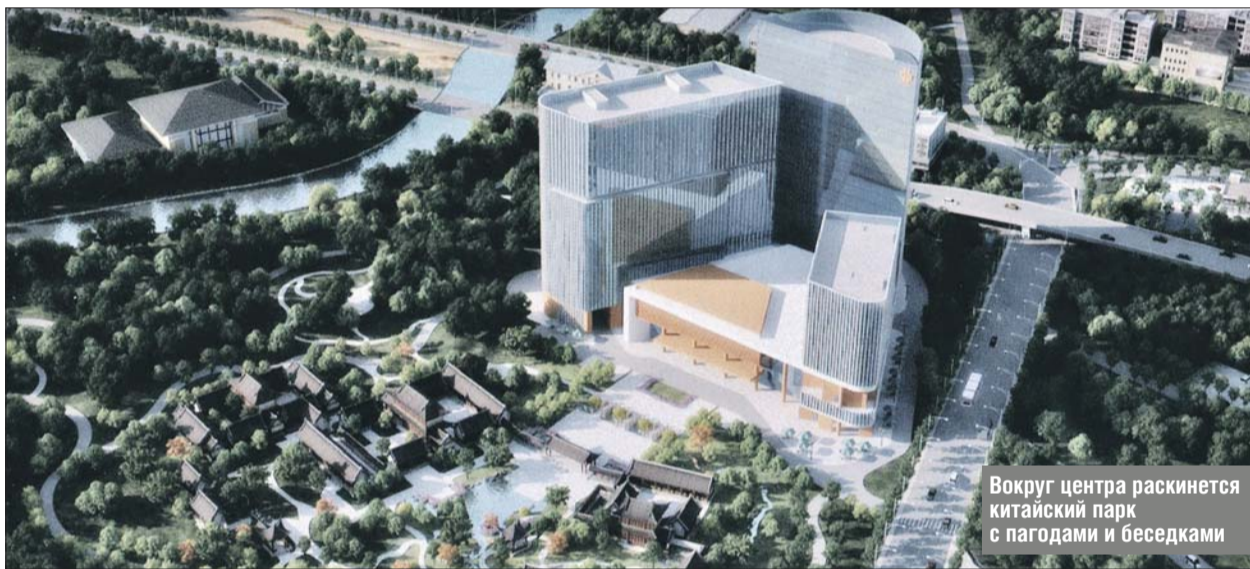
Вокруг центра раскинется китайский парк с пагодами и беседками

Главный корпус достроят уже к сентябрю этого года