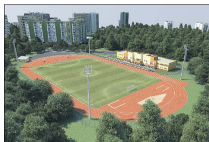
А это — футбольное поле на Студёном проезде