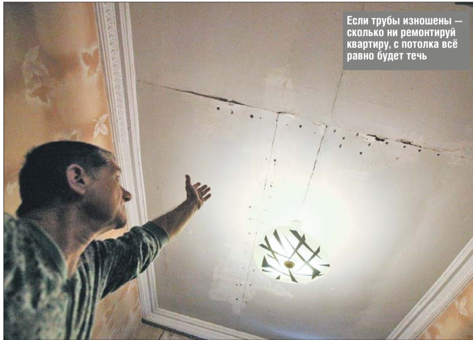
Если трубы изношены — сколько ни отремонтируй квартиру, с потолка всё равно будет течь

В ходе встречи столичный градоначальник рассказал руководству Госдумы об основных задачах программы реновации пятиэтажного жилищного фонда. Эта про-