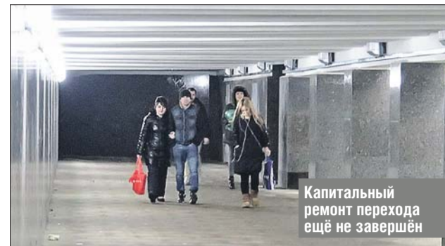
Капитальный ремонт перехода ещё не завершён