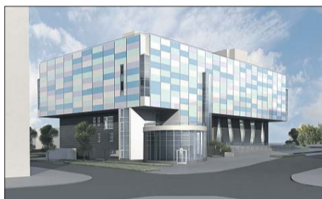
Такой станет «Академия льда» с бассейном