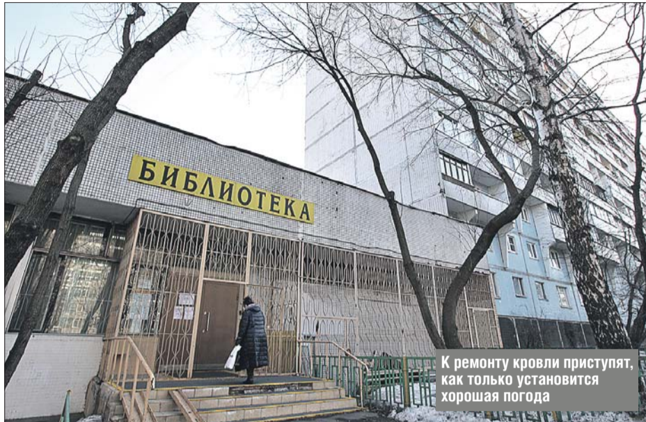
К ремонту крыши приступят, как только установится хорошая погода

— В управе и «Жилищнике» нам говорят, что отремонтировать крышу удастся только после таяния снега, — говорит она. — Дело в том, что наша библиотека находится в пристройке к