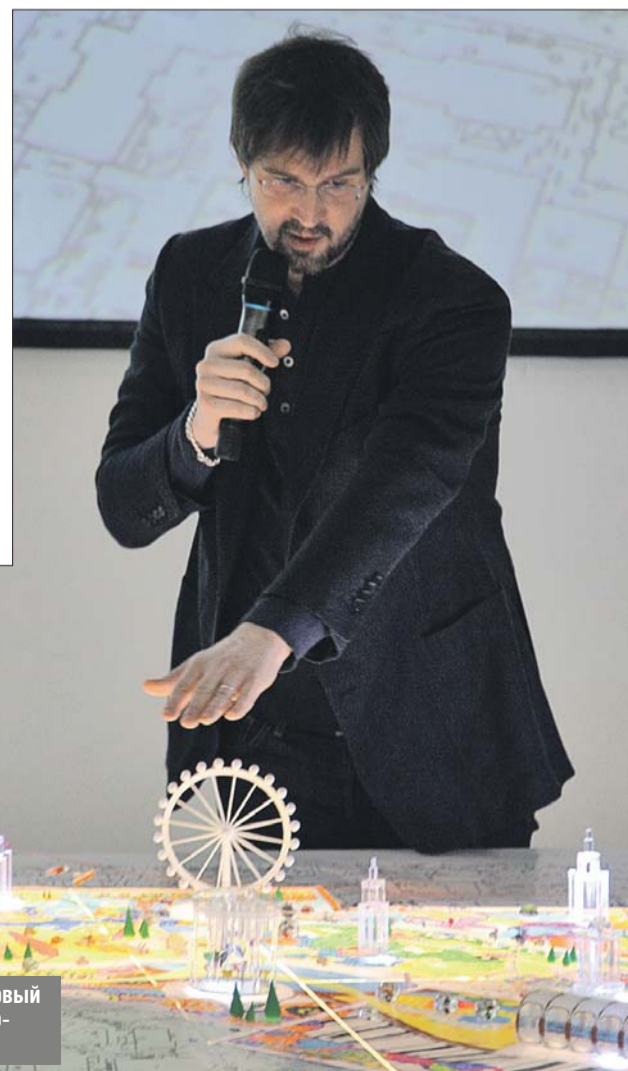
По словам Андрея Болтенко, новый парк станет миром фантазийно-утопического будущего