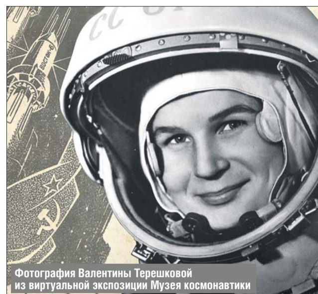
Фотография Валентины Терешковой из виртуальной экспозиции Музея космонавтики