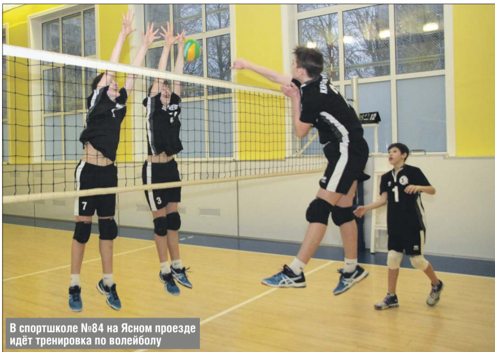
В спортшколе №84 на Ясном проезде идёт тренировка по волейболу

Тренеры обращают внимание на рост — он должен быть около 140 сантиметров. Однако ещё учитывают ловкость, быстроту, выносливость, уровень развития координации. И если ребёнок в полной мере обладает ими, но ему не хватает сантиметров 10-15 роста, его всё равно возьмут в секцию: в перспективе из него может получиться хороший