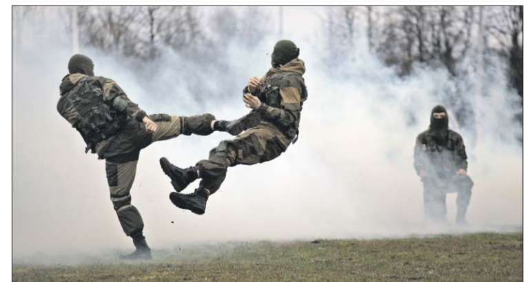
Своё мастерство призывникам продемонстрировали бойцы разведроты