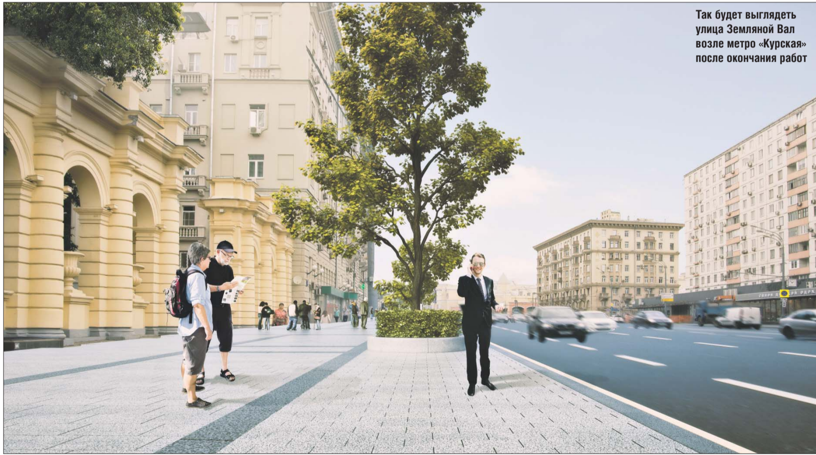
Так будет выглядеть улица Земляной Вал возле метро «Курская» после окончания работ

Жалобы граждан будут рассмотрены в течение восьми дней