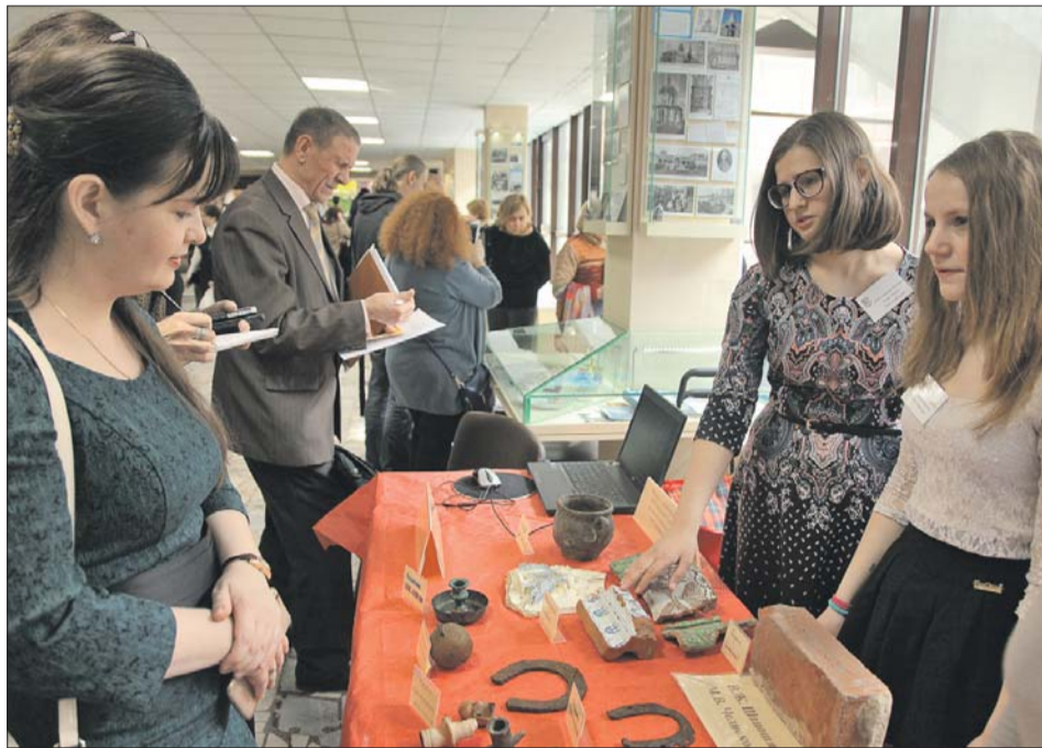
Общественным краеведческим организациям есть что рассказать о своей работе и есть что показать