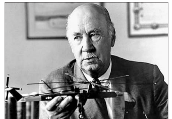
Великий конструктор и богослов Игорь Сикорский верил, что мы можем быть не одни во Вселенной

А в минувшем веке любознательную версию высказал великий конструктор Игорь Сикорский, который, кроме легендарных самолётов и вертолётов, создал и несколько удивительных богословских трудов. По его предположению, Земля может быть маленьким участком, где ещё не утвердились законы счастливой и гармоничной жизни, которые торжествуют во всей Вселенной, то есть — в раю. «Мы можем представить себе, — писал он в 1941 году, — сонмы умных и могущественных существ — представителей высшего уровня жизни, живущих в своём мире совершенно свободно, но тем не менее в абсолютной гармонии, когда с Творцом их объединяет сила добра и любви. Именно в этот мир позвал нас Иисус Христос».