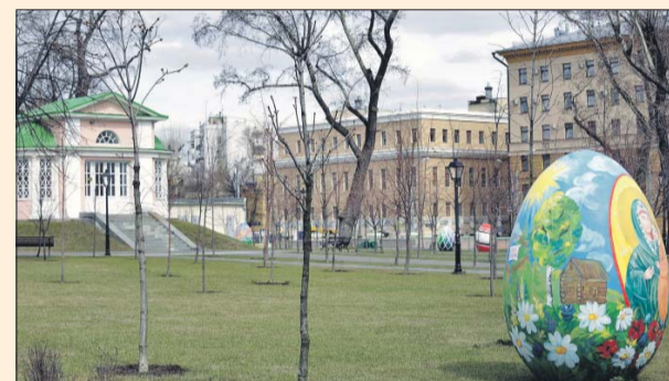
В день открытия парка здесь были выставлены работы победителей конкурса по росписи пасхальных яиц