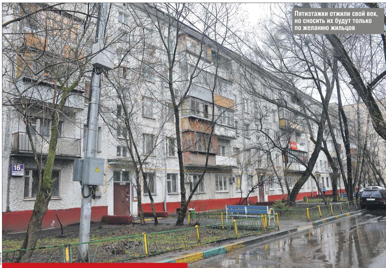
Пятиэтажки отжили свой век, но сносить их будут только по желанию жильцов

— Голосование скоро будет запущено на портале «Активный гражданин» и в письменном виде в центрах госуслуг