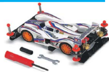
Модели собирают в масштабе 1:32

Занятия в секции бесплатные. А её воспитанники участвуют в чемпионатах. В