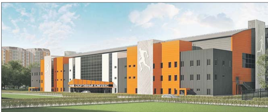
Так будет выглядеть легкоатлетический манеж на улице Инженерной