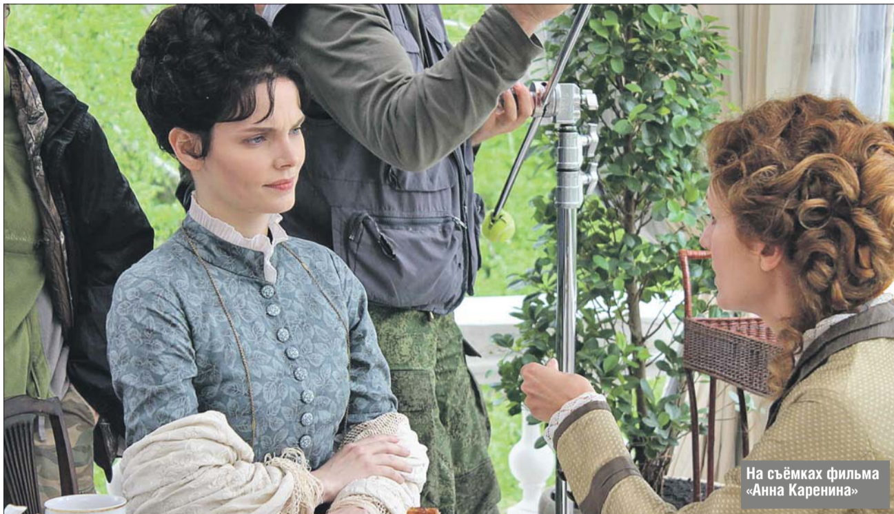
На съёмках фильма «Анна Каренина»