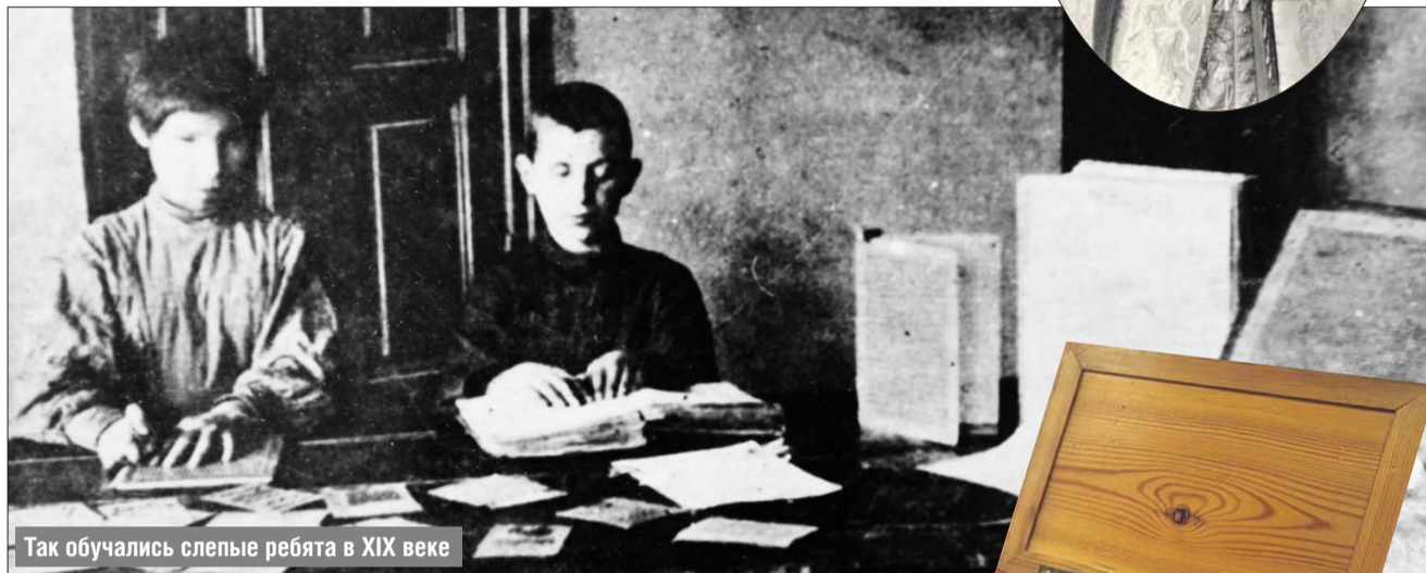
Так обучались слепые ребята в XIX веке