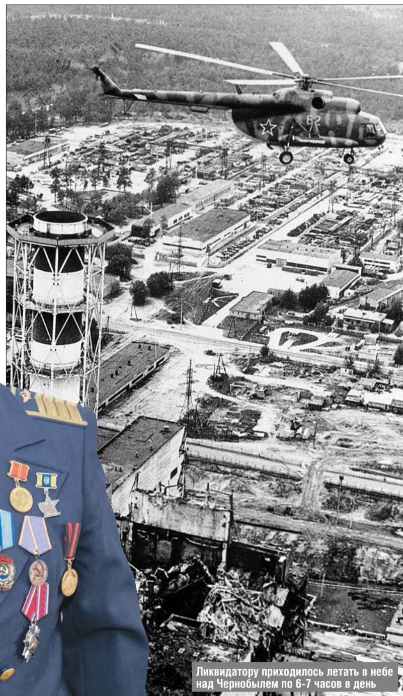
Ликвидатору приходилось летать в небе над Чернобылем по 6-7 часов в день