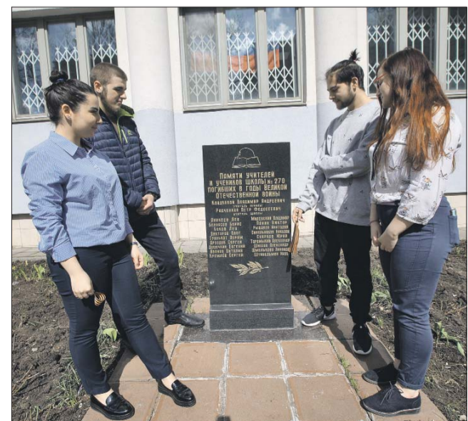
Стелу в честь погибших учеников и учителей установили 10 лет назад