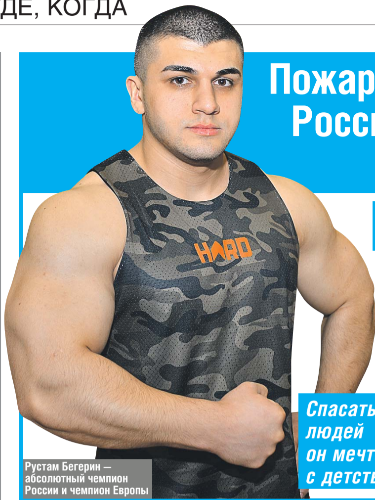
Рустам Бегерин — абсолютный чемпион России и чемпион Европы

☑ Телефон вызова пожарной охраны и спасателей 01 или 101. При вызове с мобильных телефонов — 112. Телефон доверия ГУ МЧС России по г. Москве (495) 637-2222