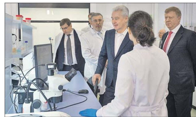
Сергей Собянин дал старт работе технологического центра