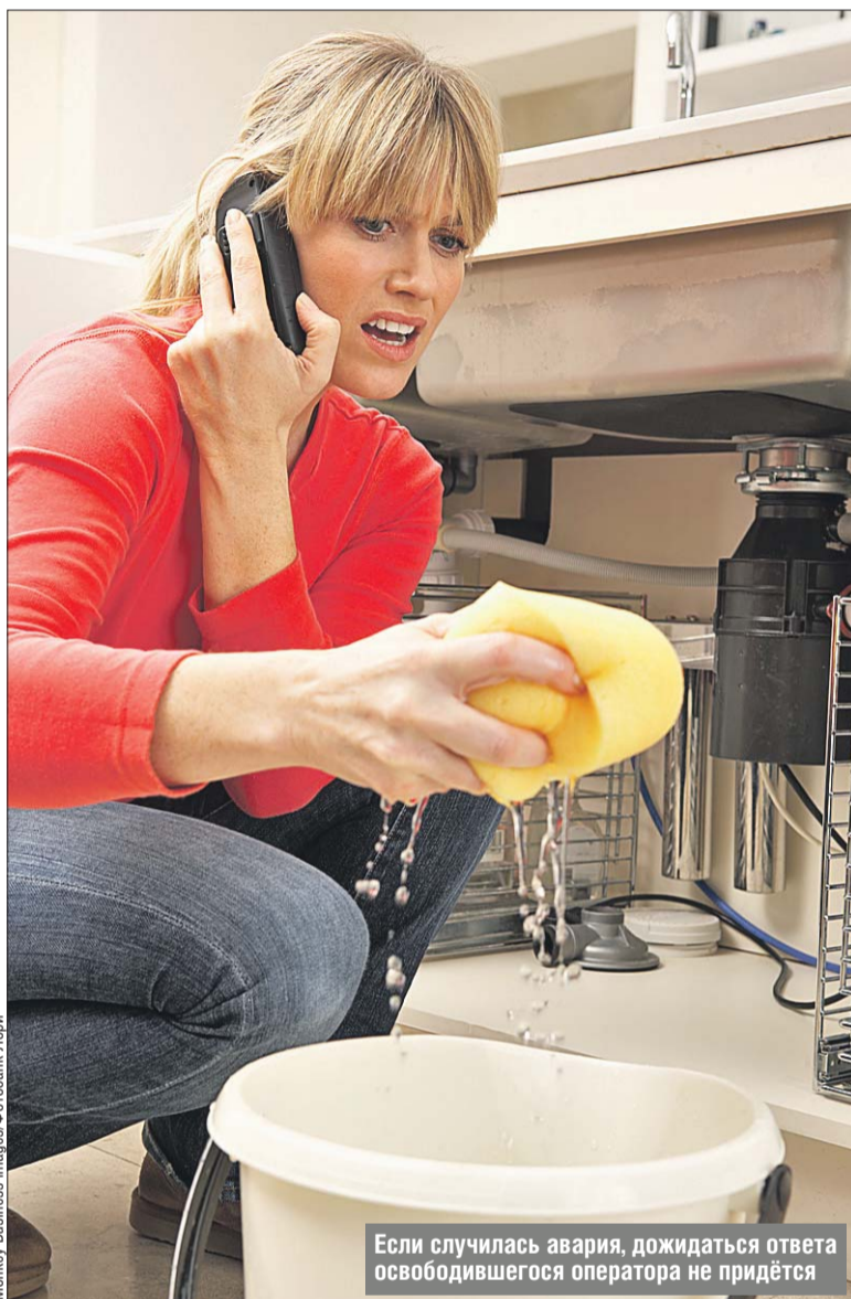
Если случилась авария, дожидаться ответа освободившегося оператора не придётся

Все районные диспетчерские переключат на единый колл-центр