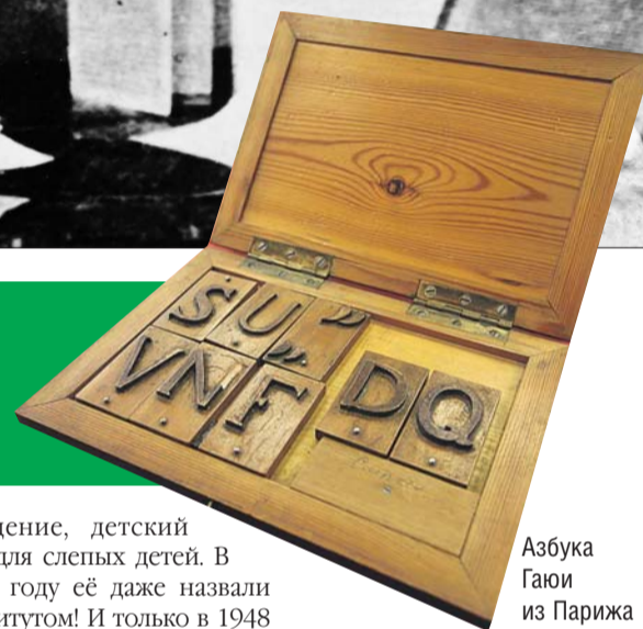
Азбука Гаюи из Парижа

играл на музыкальных инструментах, объехал полмира и открыл школы для слепых на Востоке. Всемирно известный учёный, один из крупнейших математиков XX века Лев Понтрягин тоже учился здесь.