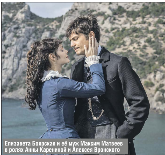
Елизавета Боярская и её муж Максим Матвеев в ролях Анны Карениной и Алексея Вронского