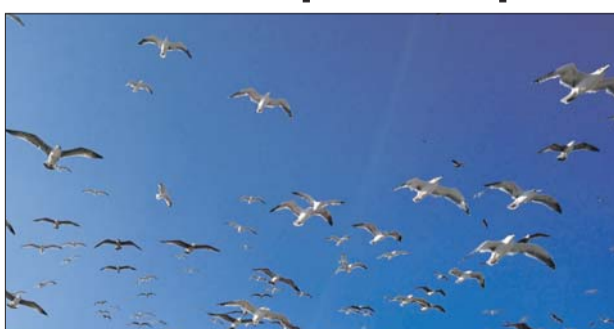
Эти озёрные птицы уже давно селятся рядом с человеком

— Озёрная чайка уже давно селится рядом с человеком — так ей легче пролететь. Прохожие вызвали спасателей, на место происшествия выехала дежурная смена ОПСО «СпасРезерв». — Оказалось, что птица запуталась в рыболовной леске — наверное, «прихва-