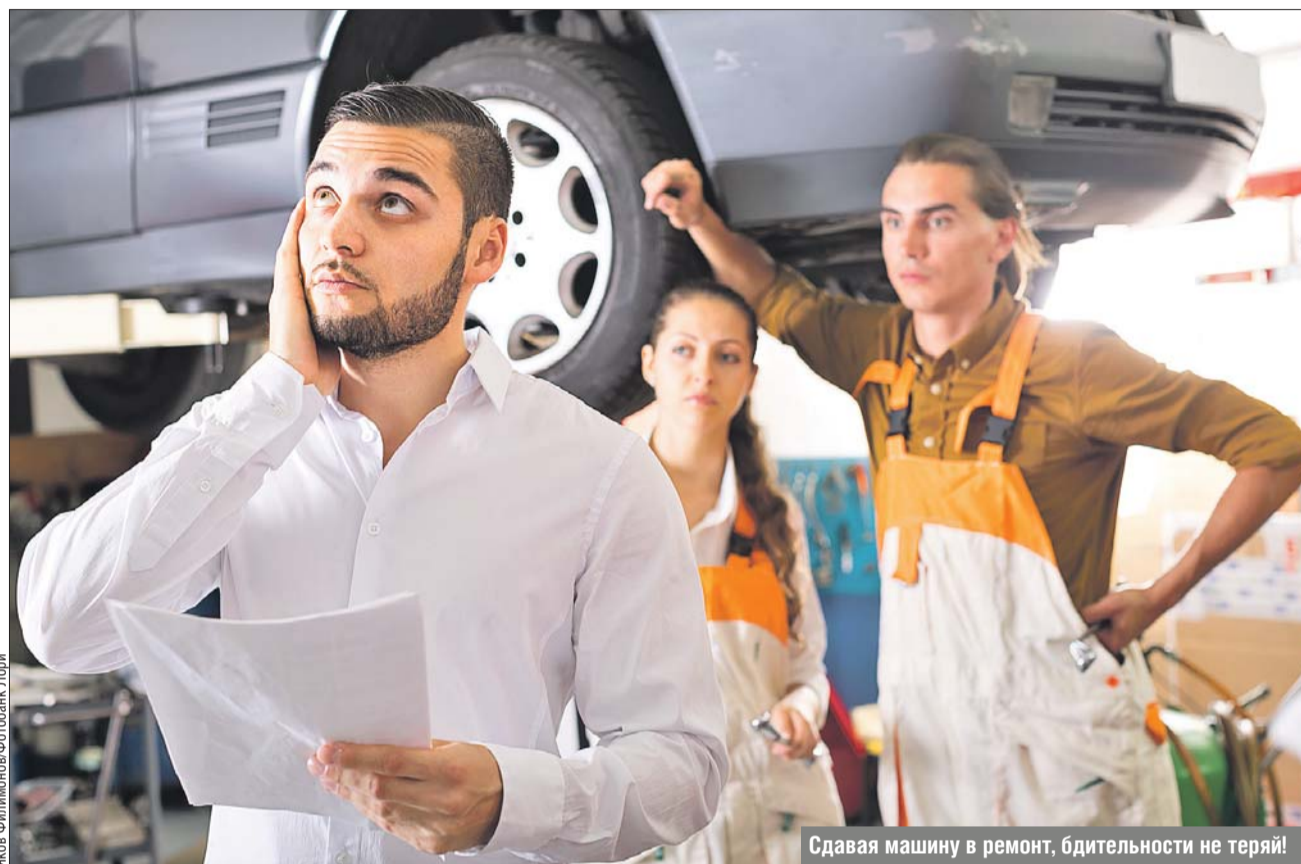
Сдавая машину в ремонт, бдительности не теряй!

Но как быть, если автовладелец не сильно сведущ в