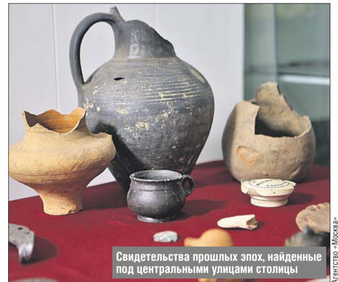
Свидетельства прошлых эпох, найденные под центральными улицами столицы