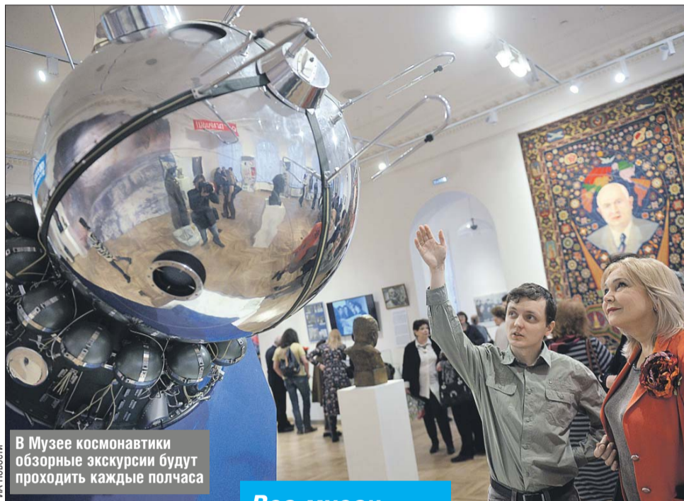
В Музее космонавтики обзорные экскурсии будут проходить каждые полчаса

Музейный комплекс «Рабочий и колхозница» (просп. Мира, 123б) станет ареной спектакля-перформанса «Бо-