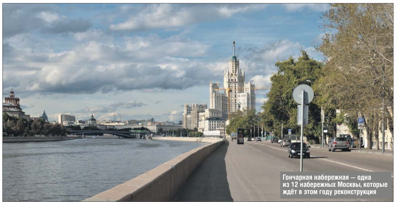
Гончарная набережная — одна из 12 набережных Москвы, которые ждёт в этом году реконструкция

— В шахматном слоне, выточенном из кости, были спрятаны 10 серебряных монет ручной чеканки. Общая