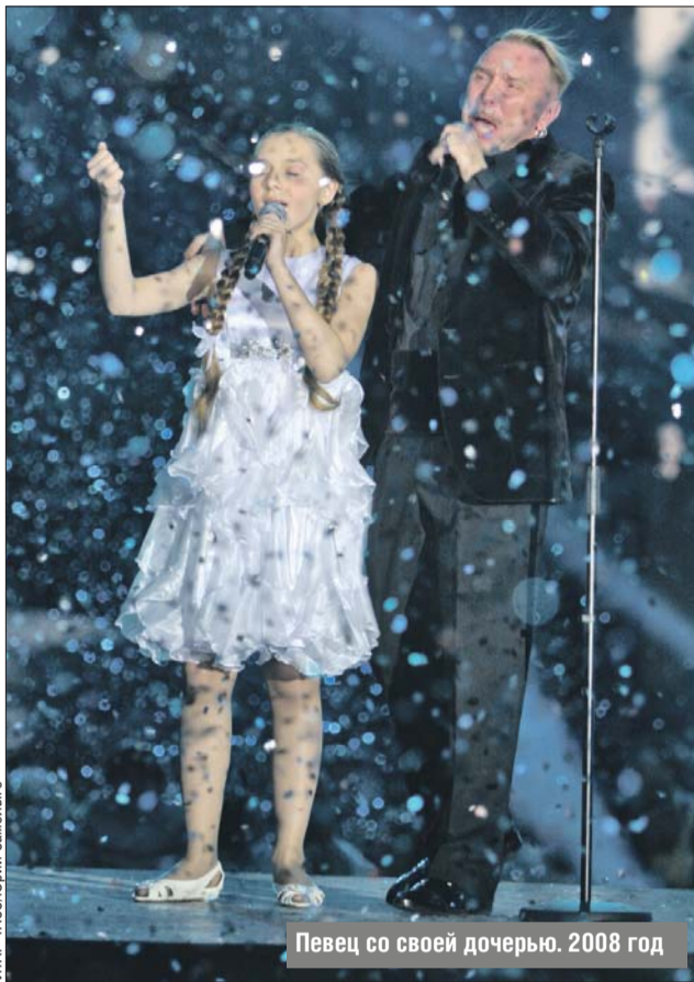
Певец со своей дочерью. 2008 год

— Конечно, счастье. С её рождением всё изменилось: я стал настоящим семьянином, начал много времени