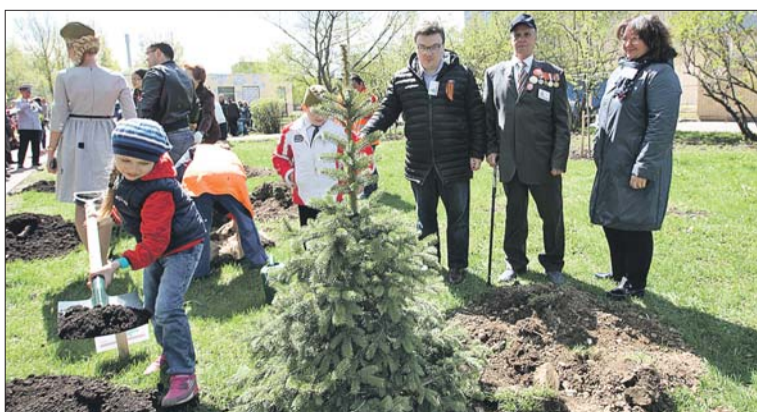
В посадках приняли участие и дети, и ветераны

Торжественные мероприятия в честь празднования 72-й годовщины Победы в Великой Отечественной войне прошли во всех районах округа. Одной из самых массовых стала акция «Марш Победы» в Бибирево. Сотни жителей района, ветераны, школьники и представители общественных организаций собрались на митинг у мемориала погибшим воинам из деревень Бибирево, Подушкино, Алтуфьево, Юрлово, а затем колонной «Бессмертного полка» прошествовали до Этнографической деревни.