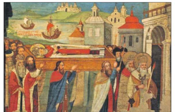
Фреска «Перенесение мощей Николая Чудотворца»

И вот в этом году мощи впервые покинут Италию, чтобы побывать в Москве.