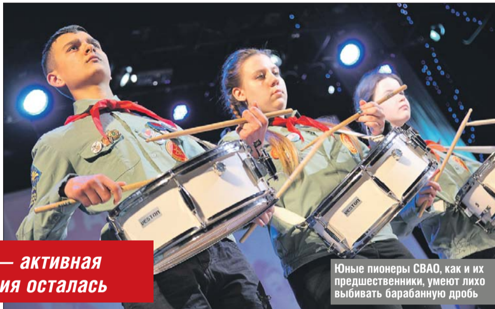
Юные пионеры СВАО, как и их предшественники, умеют лихо выбивать барабанную дробь

Сегодня пионеры помогают ветеранам, ходят на общегородские субботники и