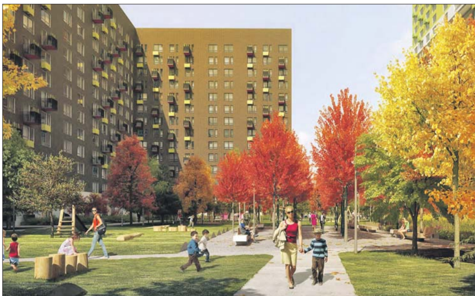
Во дворах появятся газоны и цветники, мощёные дорожки, будут высажены кустарники и деревья

Каждый заинтересованный житель сможет увидеть адреса и макеты новых домов и высказать по ним свои замечания и предложения