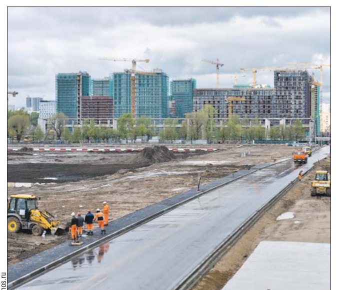
Здесь появится район на 77 тысяч жителей