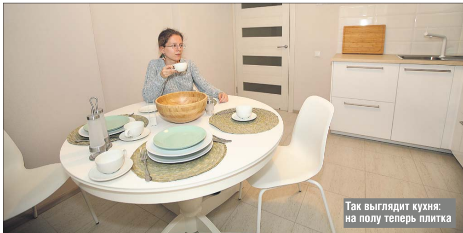
Так выглядит кухня: на полу теперь плитка