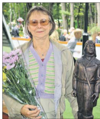
Скульптура выполнена из бронзы