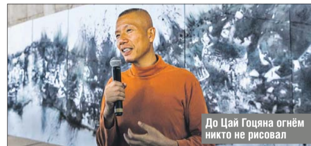
До Цай Гоцяна огнём никто не рисовал

Перформанс известного современного китайского художника из Нью-Йорка Цай Гоцяна прошёл на ВДНХ, в павильоне №22. Мастер создал произведение «Река» в технике пороховой живописи. На холсте размером 20х3 метра он разместил трафарет, по контурам которого насыпал