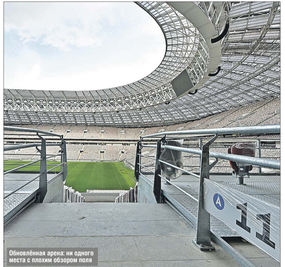
Обновлённая арена: ни одного места с плохим обзором поля

При этом мэр отметил, что работы на внешнем периметре безопасности Большой спортивной арены «Лужники» завершат досрочно.