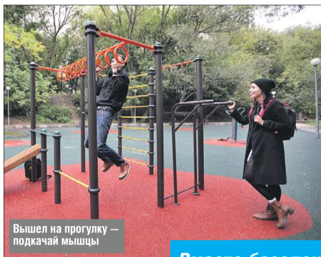
Вышел на прогулку — подкачай мышцы