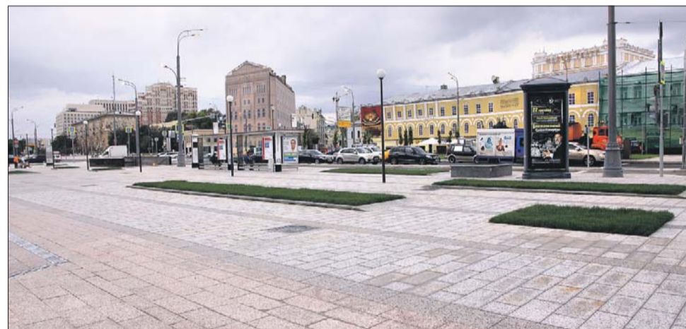
Валовую улицу выложили плиткой, установили новые фонари и остановочные павильоны

Ширину проезжей части всего кольца унифицировали: по пять полос в каждом направлении. Это позволило, с одной стороны, ликвидировать эффект бутылочных горлышек на проезжей части, а с другой, расширить тротуары в среднем от 5 до 15 метров