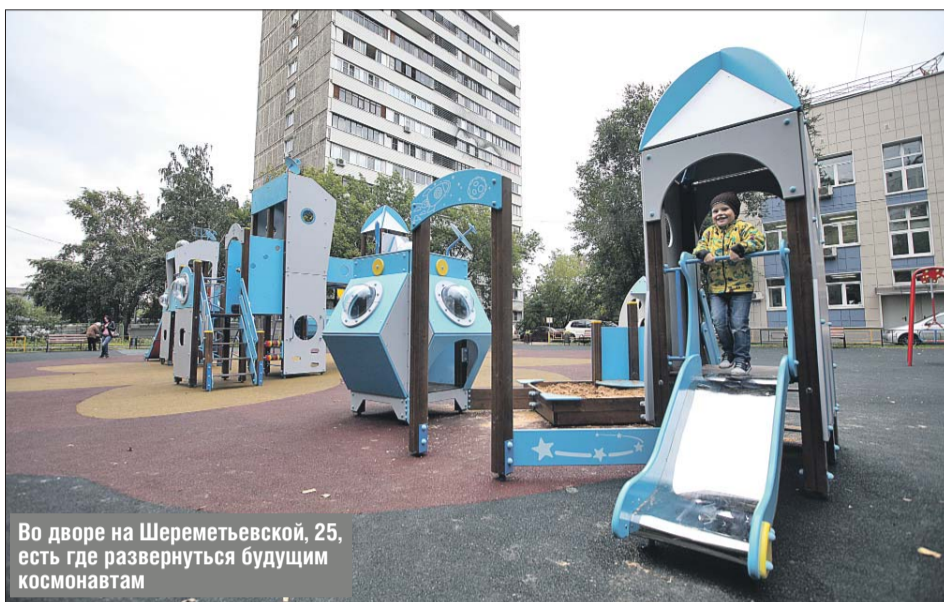
Во дворе на Шереметьевской, 25, есть где развернуться будущим космонавтам

— Жители сами решили, что здесь должна быть площадка памяти великого спортсмена, проголосовав за неё на портале «Ак-