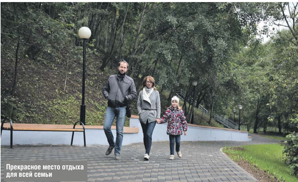
Прекрасное место отдыха для всей семьи