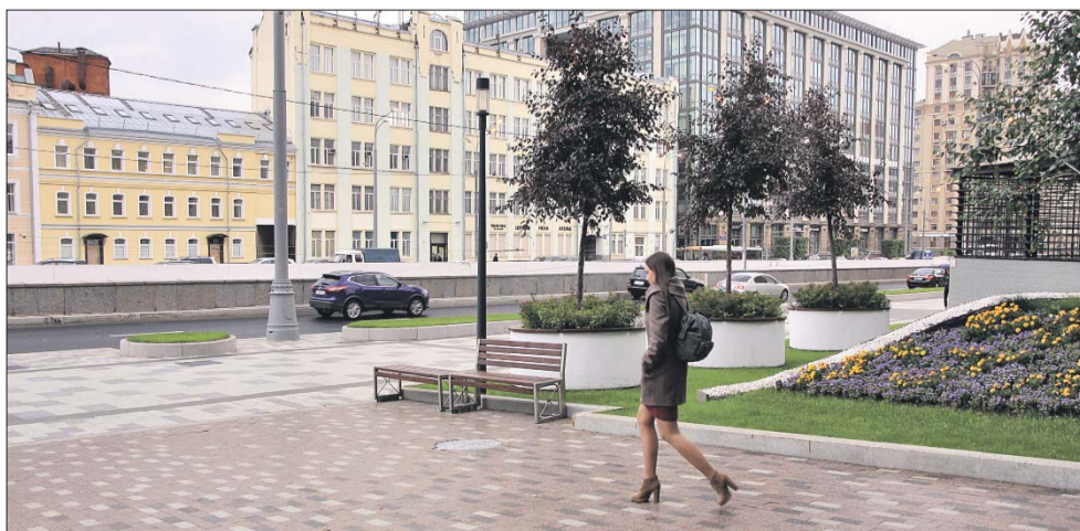
После благоустройства пропускная способность Валовой улицы увеличилась на треть