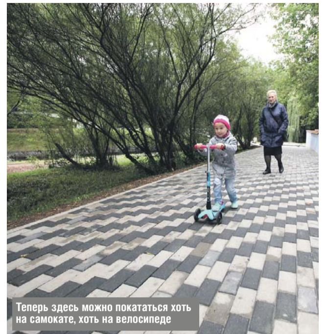
Теперь здесь можно покататься хоть на самокате, хоть на велосипеде

Н овый знаковый объект появился в Отрадном. Жители района смогут отдохнуть и заняться спортом в обновлённом парке «Отрада», который протянулся вдоль Лихоборки, между Алтуфьевским шоссе и улицей Хачатуряна. Благоустройство его шло три летних месяца. Сегодня здесь появились новые спортивные площадки, детский городок и даже сад камней.