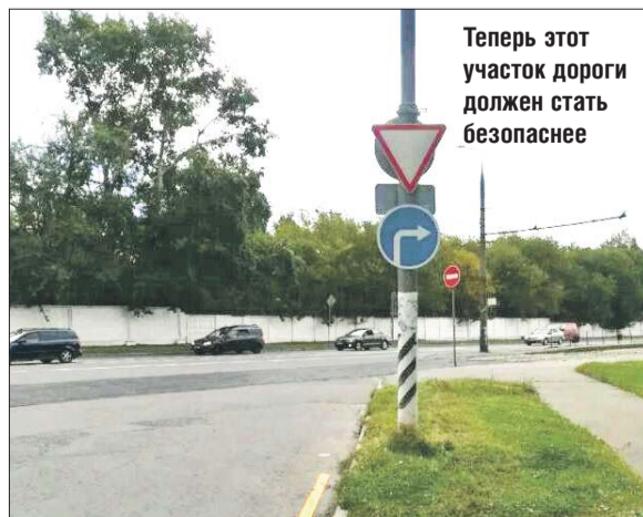
Теперь этот участок дороги должен стать безопаснее