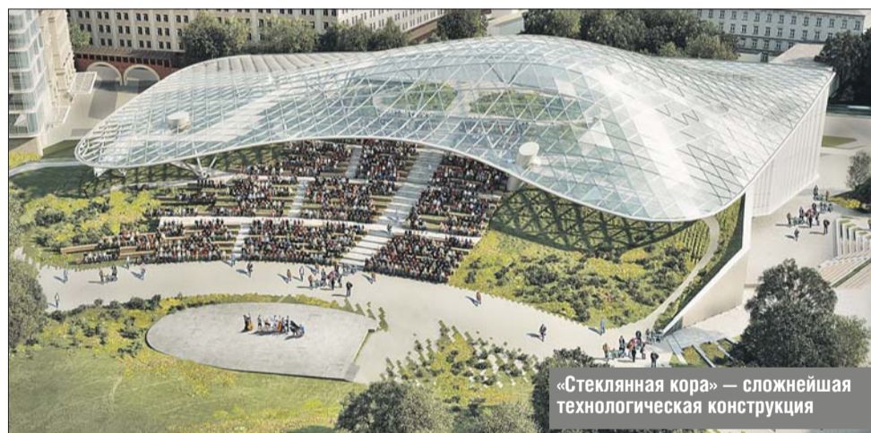
«Стеклянная кора» — сложнейшая технологическая конструкция