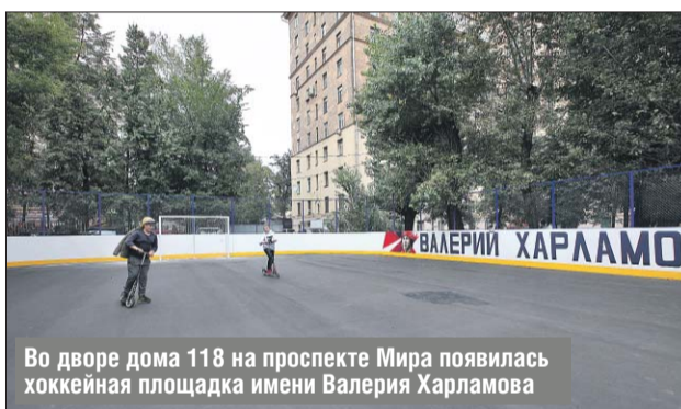
Во дворе дома 118 на проспекте Мира появилась хоккейная площадка имени Валерия Харламова

Благоустройство дворов ведётся за счёт средств от платных парковок