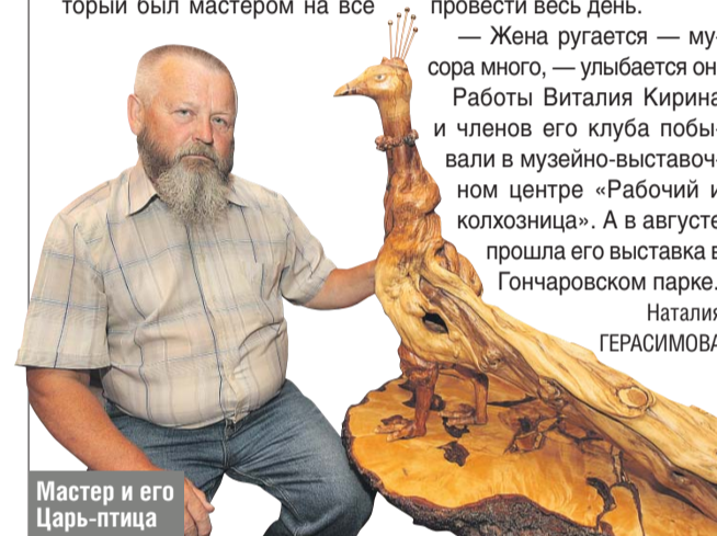
Мастер и его Царь-птица