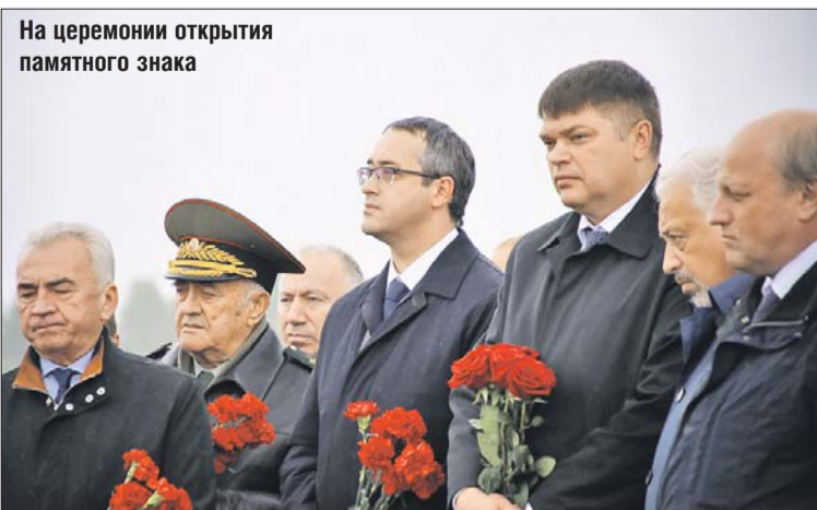
На церемонии открытия памятного знака