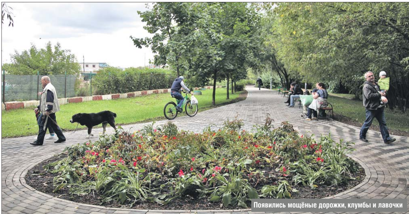
Появились мощёные дорожки, клумбы и лавочки