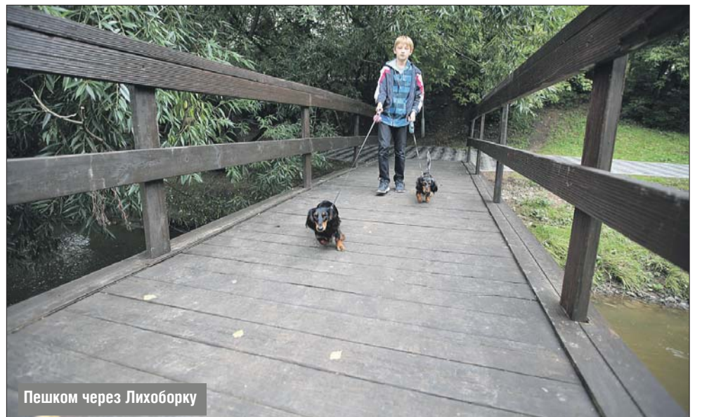
Пешком через Лихоборку