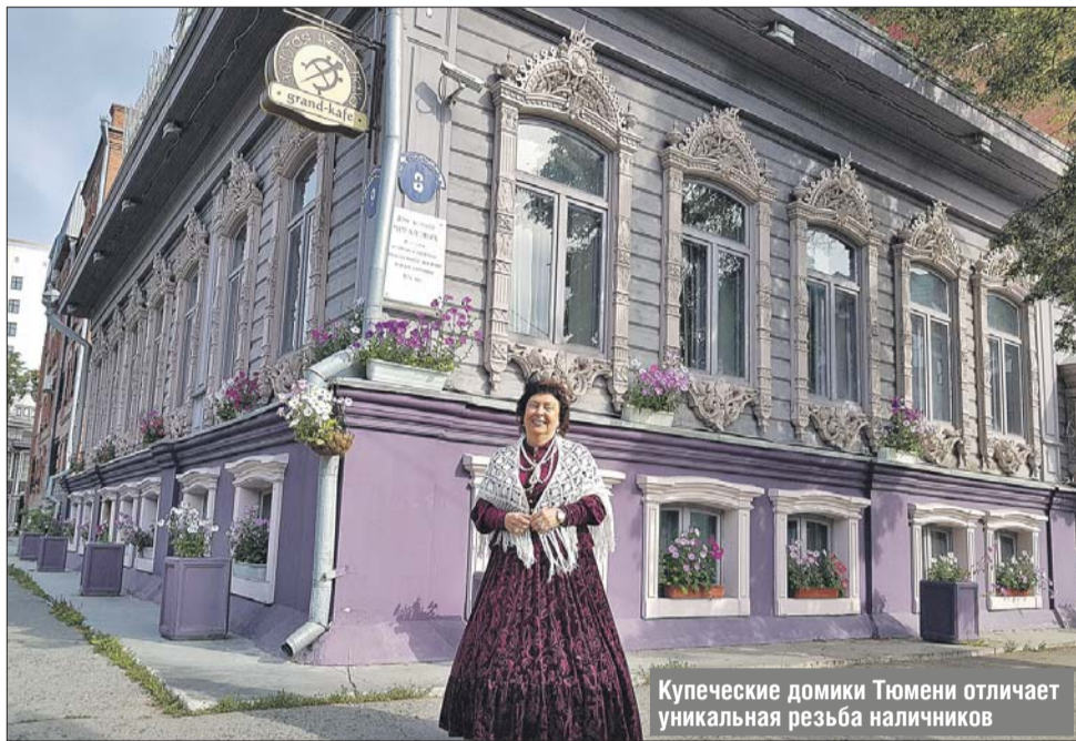
Купеческие домики Тюмени отличает уникальная резьба наличников

Корреспондент «ЗБ» разгадывала тайны Тюмени и её окрестностей