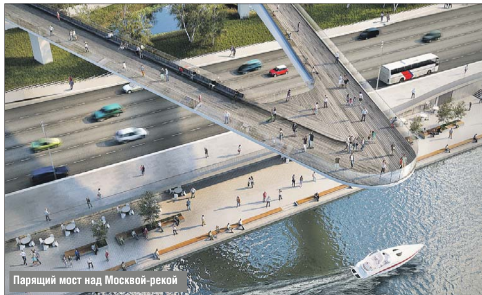
Парящий мост над Москвой-рекой

Найденные в ходе реконструкции археологические артефакты стали экспозицией подземного интерактивного археологического музея «Зарядье», который открылся в парке, в подземном переходе у Москворецкой набережной. Это предметы быта, монеты, изразцы и другие предметы конца XVI — начала XVIII века.