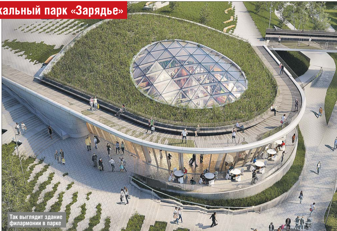
Так выглядит здание филармонии в парке

Ну а гастрономический центр «Зарядье» позволит гостям познакомиться с кухней восьми гастрономических зон России.