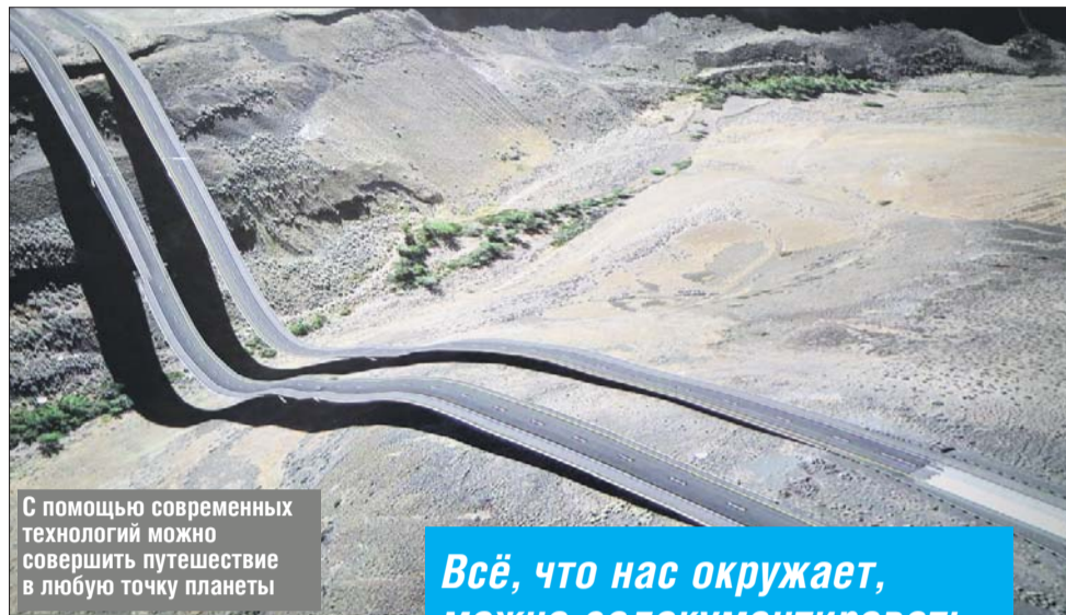
С помощью современных технологий можно совершить путешествие в любую точку планеты

В мире цифровых технологий никому не гарантирована и личная безопасность. Из экспозиции технохудожника Егора Цветкова Youg face is big data можно узнать, как через социальные сети