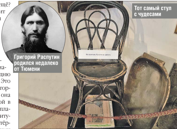
Григорий Распутин родился недалеко от Тюмени