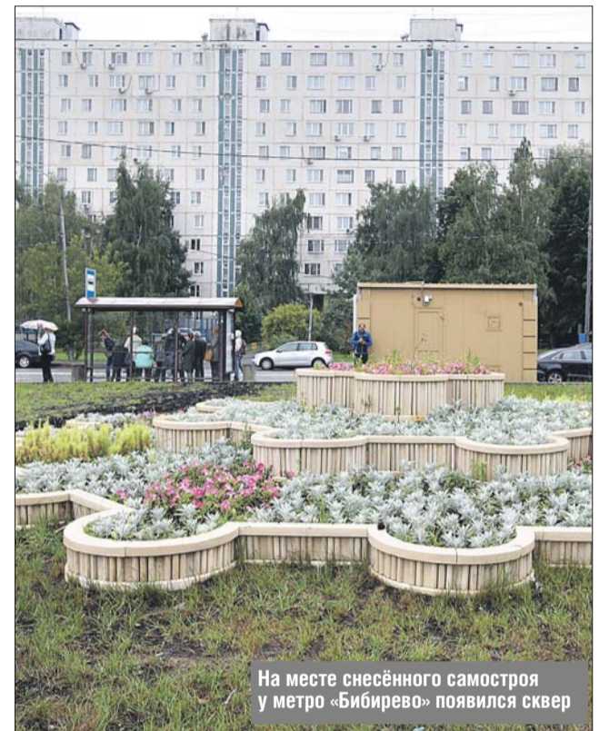
На месте снесённого самостроя у метро «Бибирево» появился сквер