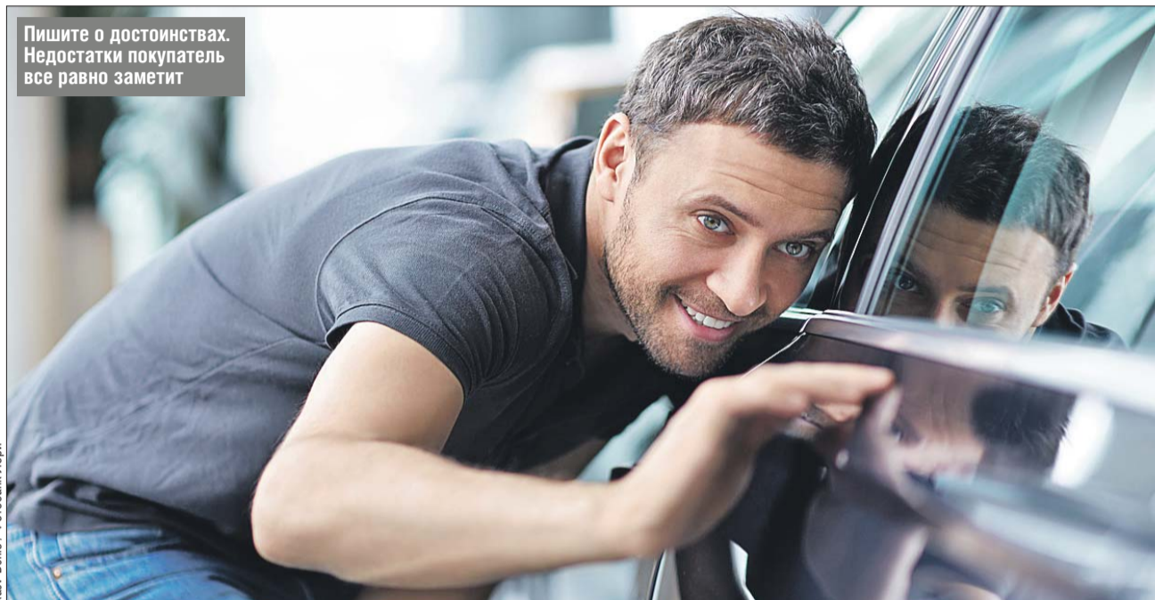
Пишите о достоинствах. Недостатки покупатель все равно заметит