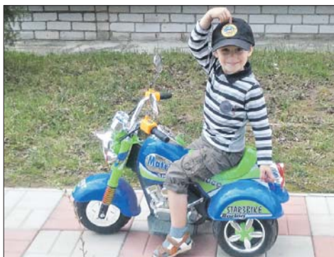
Фотографию и высказывания прислала Светлана Муковина.

Рассматривает фотографии. Бабушка комментирует: