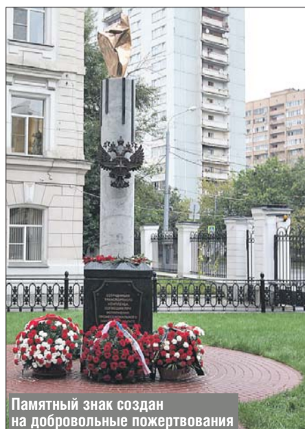
Памятный знак создан на добровольные пожертвования

Технопарк «Отрадное»: ул. Отрадная, вл. 2