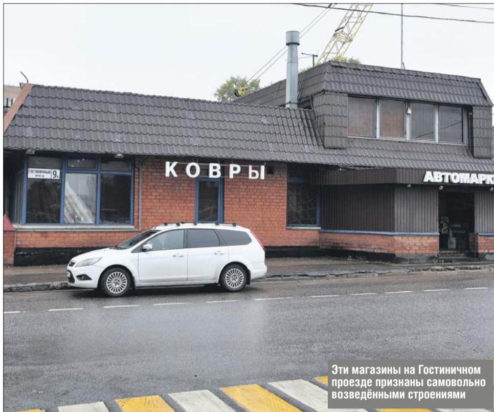
Эти магазины на Гостиничном проезде признаны самовольно возведёнными строениями