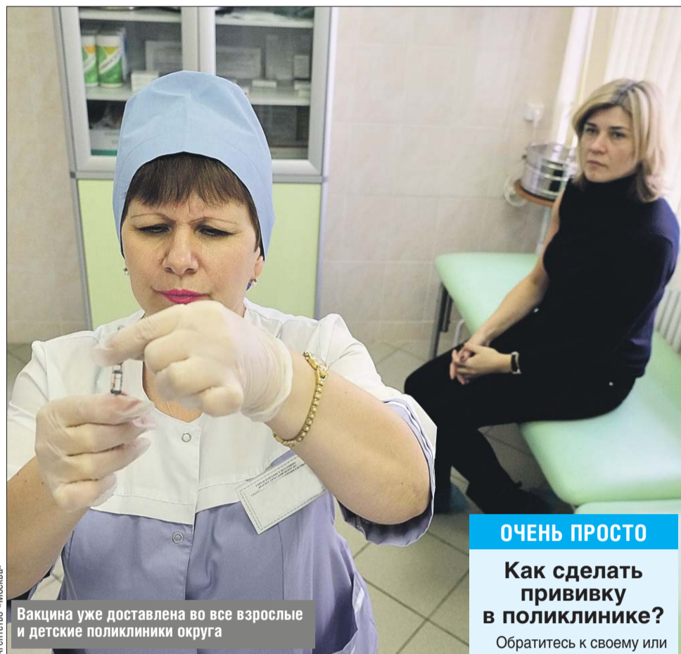
Вакцина уже доставлена во все взрослые и детские поликлиники округа

Грипп обычно начинается с резкого подъёма температуры до 38-40 градусов,