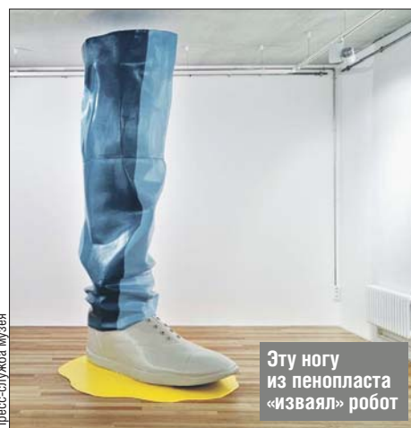
Эту ногу из пенопласта «изваял» робот