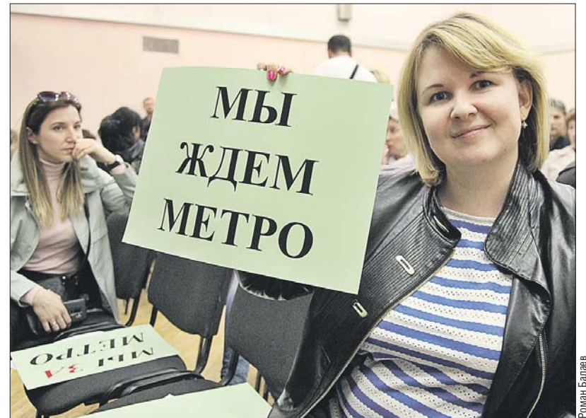
Таковы настроения многих жителей района Северный