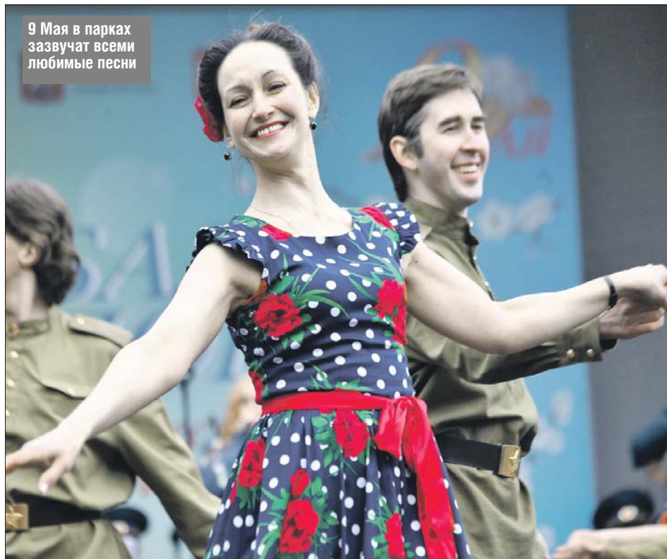
9 Мая в парках зазвучат всеми любимые песни

Одна из главных площадок праздника — ул. Академика Королёва, 15. Тут 7 мая в 13.00 начнётся бал Победы, пройдёт концертная программа и флешмоб «Лента Победы». Также массовые народные гулянья намечены 9 мая в 13.00 в парке Победы (зелёная зона между Юрловским проездом, проездом Дежнёва и Заповедной улицей) и на территории ВДНХ в 12.00. Основные места — Главная аллея, площадь Промышленности и парк «Останкино».