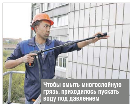
Чтобы смыть многослойную грязь, приходилось пускать воду под давлением

Очистка фасадов — дело сложное, загрязнения часто многослойные, поэтому задачу решают с помощью водяной струи высокого напора. Аппарат размещают в люльке автовышки, и двое рабочих поднимаются на верхний этаж. Правила безопасности строго соблюдаются: на голове каска, страховочный пояс пристёгнут к люльке. Моют сверху вниз, сначала наносят шампунь, затем смывают водой.