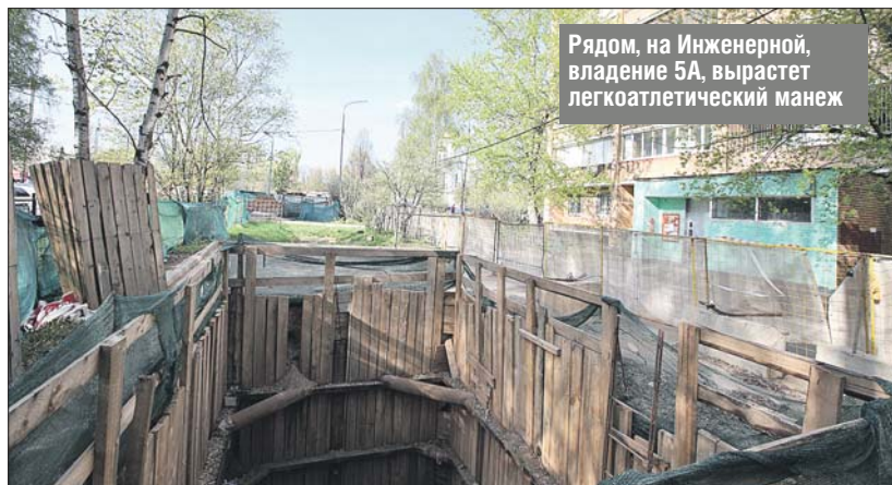
Рядом, на Инженерной, владение 5А, вырастет легкоатлетический манеж

Официальный адрес стройплощадки: ул. Инженерная, вл. 5А. Ордер на земляные работы выдан ОАТИ сроком до 30 июля 2019