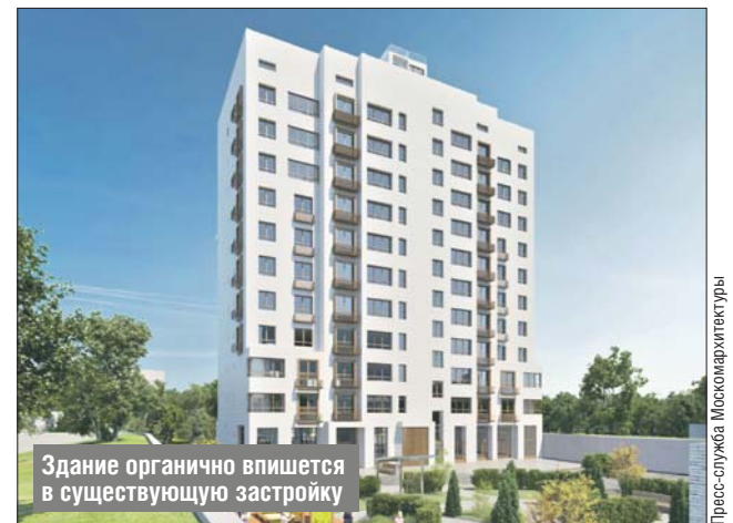
Здание органично впишется в существующую застройку