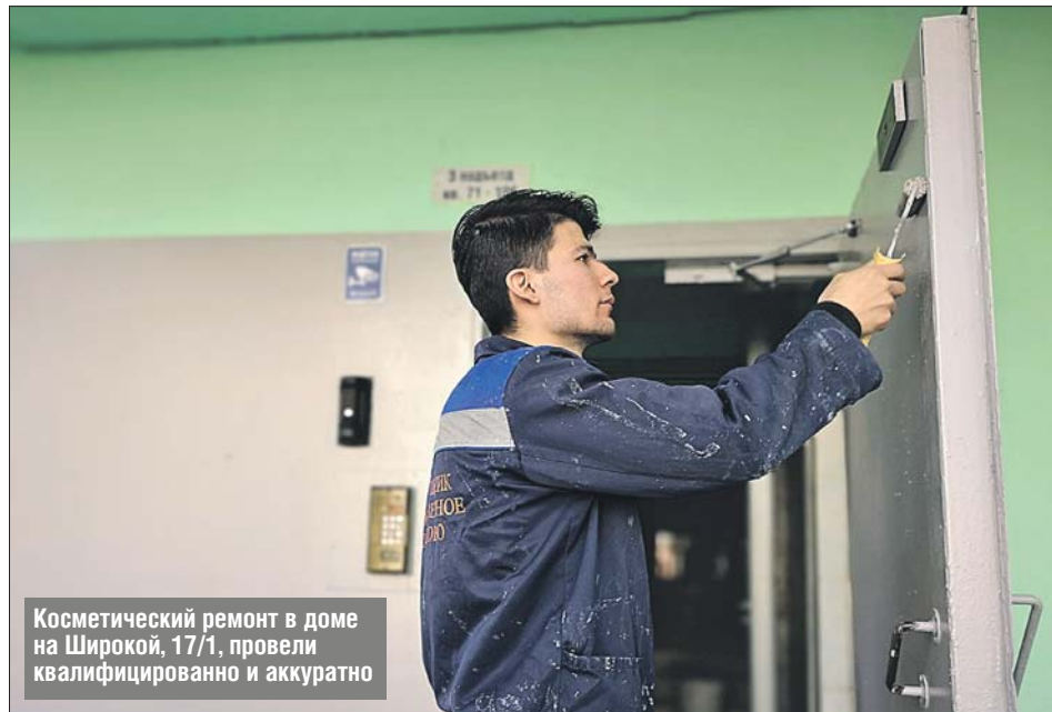
Косметический ремонт в доме на Широкой, 17/1, провели квалифицированно и аккуратно