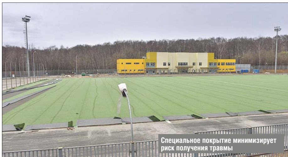
Специальное покрытие минимизирует риск получения травмы

После открытия стадиона спортсмены СВАО получат в своё распоряжение поле с высококачественным искусственным покрытием из синтетической травы, присыпанной песком и резиновой крошкой. Такая поверхность минимизирует риск