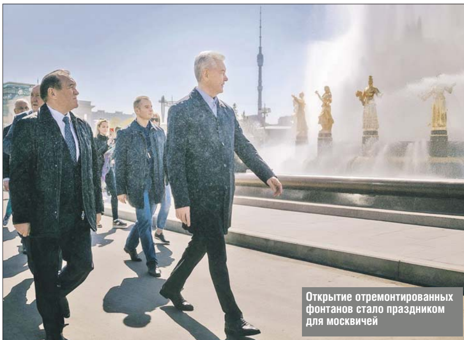
Открытие отремонтированных фонтанов стало праздником для москвичей

— Москва по доброй традиции одновременно запускает фонтаны по всему городу. Это сотни фонтанов. И сегодня знаковое событие: мы закончили комплексную научную реставрацию фонтанного комплекса ВДНХ, который является красивейшим в Москве. Проведена огромная кропотливая работа, восстановлено 16 фонтанов на Главной аллее. «Золотой колос», по сути дела, был утрачен