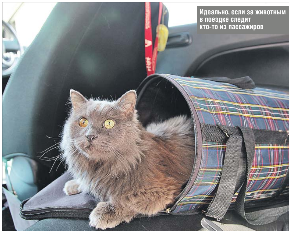
Идеально, если за животным в поездке следит кто-то из пассажиров

Неприятности, как всегда, начались внезапно. В лесу машину тряхнуло при наезде на корень. Испуганная собака, не готовая к таким вещам, вмиг оказалась на коленях у хозяина, прося защиты от неведомой угрозы и царапая. Водитель от неожиданности крутанул рулём — а кругом деревья. Хорошо, опытный шофёр успел вовремя остановиться.