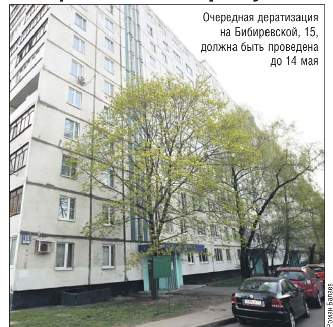
Очередная дератизация на Бибиревской, 15, должна быть проведена до 14 мая