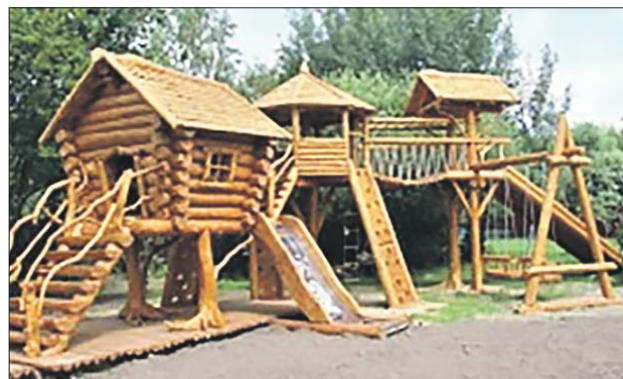
Представлено разработчиком проекта

У большой ели на улице Павла Корчагина появится избушка в стиле русских сказок