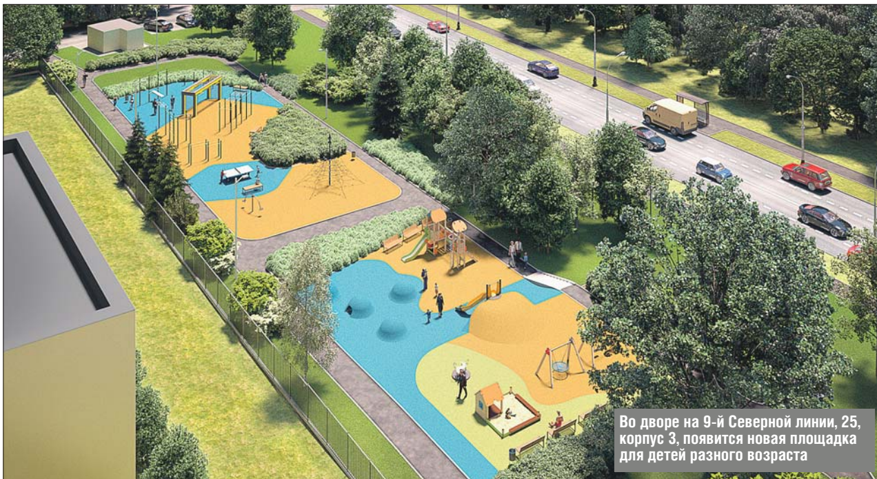
Во дворе на 9-й Северной линии, 25, корпус 3, появится новая площадка для детей разного возраста

Как благоустроят центральный и удалённый районы округа