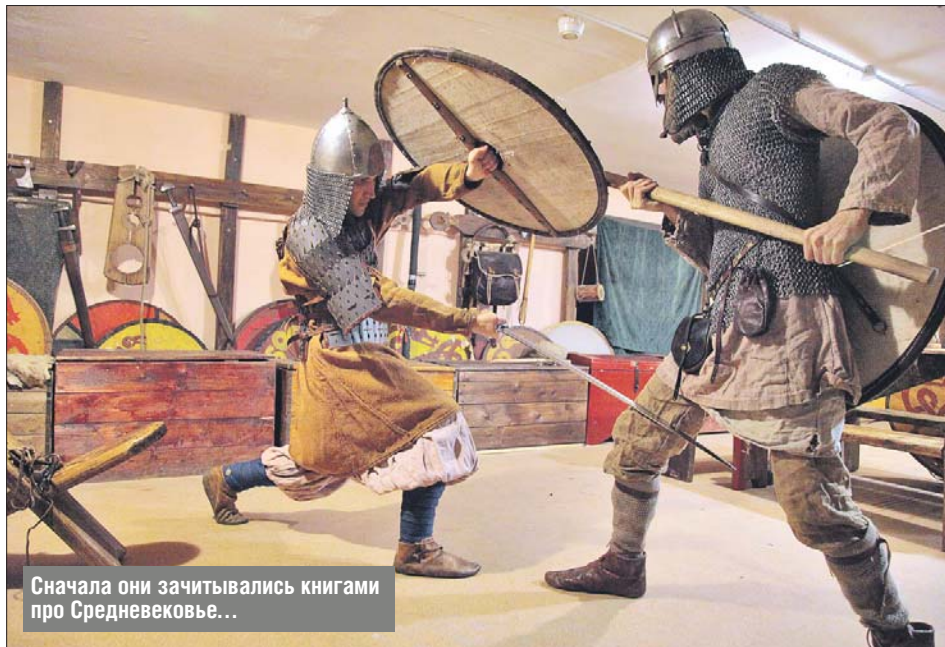
Сначала они зачитывались книгами про Средневековье...

В дружину входят более 20 человек разного возраста