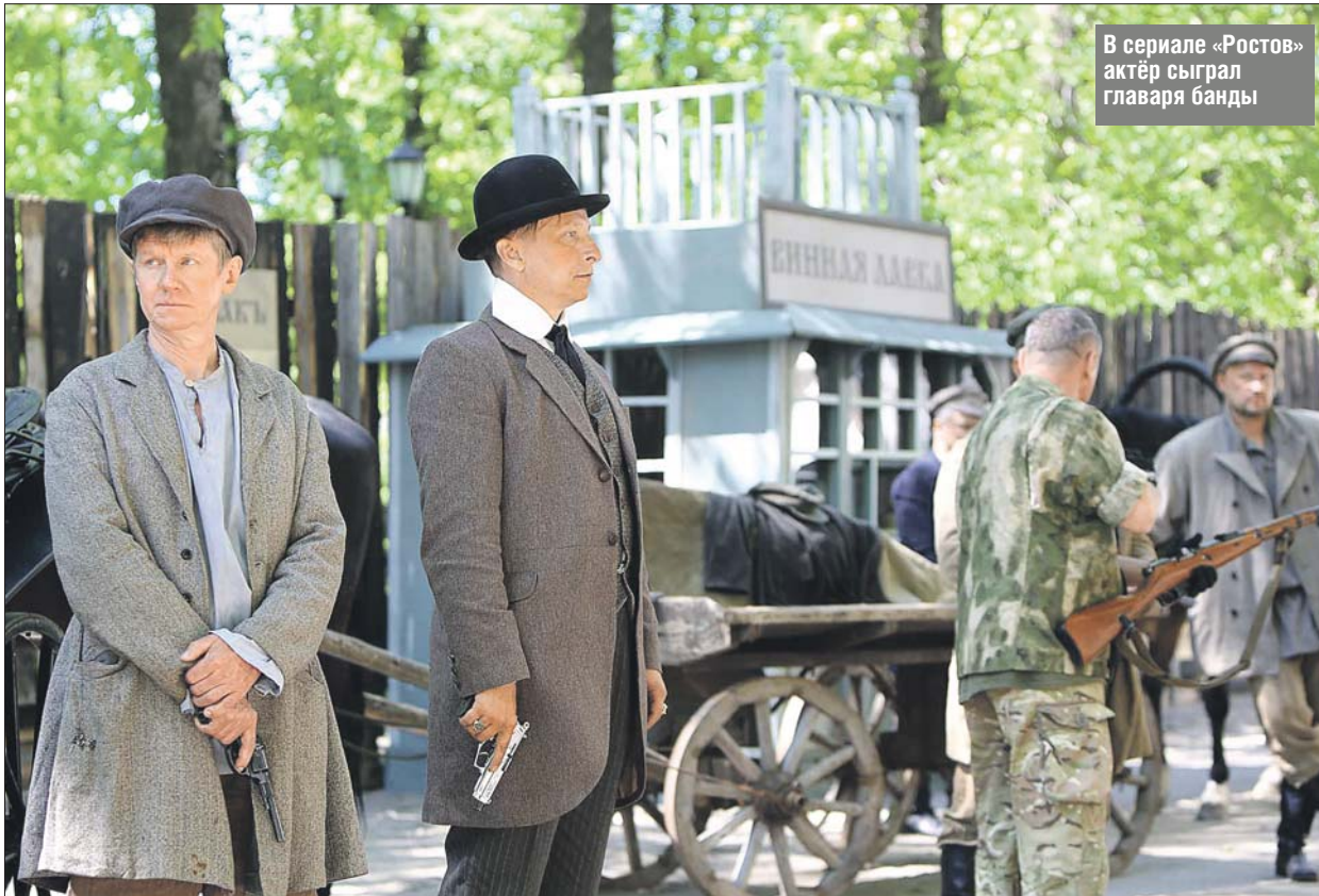
В сериале «Ростов» актёр сыграл главаря банды