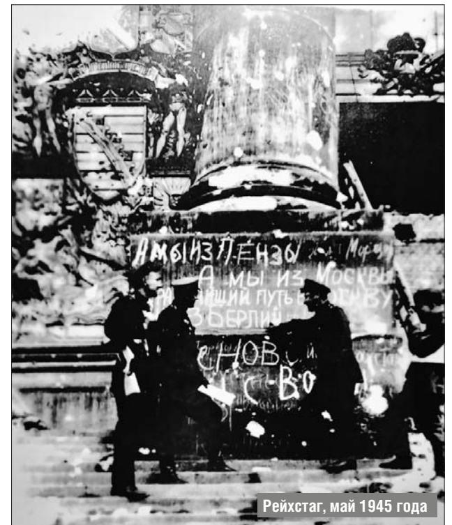
Рейхстаг, май 1945 года

После войны он более 20 лет работал водителем автобуса в Воронеже. Растил и воспитывал двух внуков и внучку. 9 Мая каждого года мы всей семьёй несём цветы на могилы неизвестных героев, а с портретом прадедушки идём в строю «Бес-