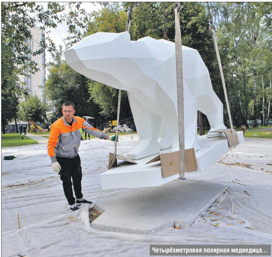
Четырёхметровая полярная медведица...

В Северном и Южном Медведкове продолжается благоустройство по программе «Мой район»