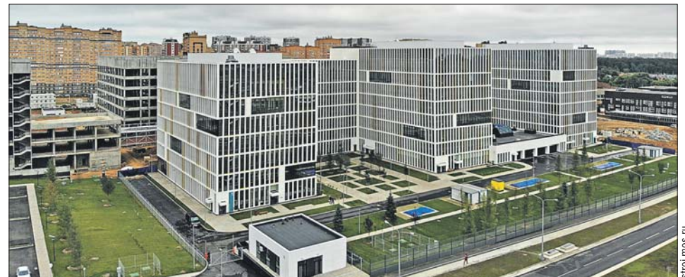
Строящийся в Коммунарке многопрофильный медицинский комплекс

В структуру больницы входит и уникальный родильный дом — единственное в Москве учреждение, где оказывают медицинскую помощь женщинам с онкологической патологией на всех этапах беременности. Необходимо отметить, что дальнейшее технологическое развитие 40-й больницы на старой базе было невозможно: многие здания построены более полувека назад, их состояние и планировка не приспособлены для использования современного оборудования. Диагностические и процедурные отделения и кабинеты