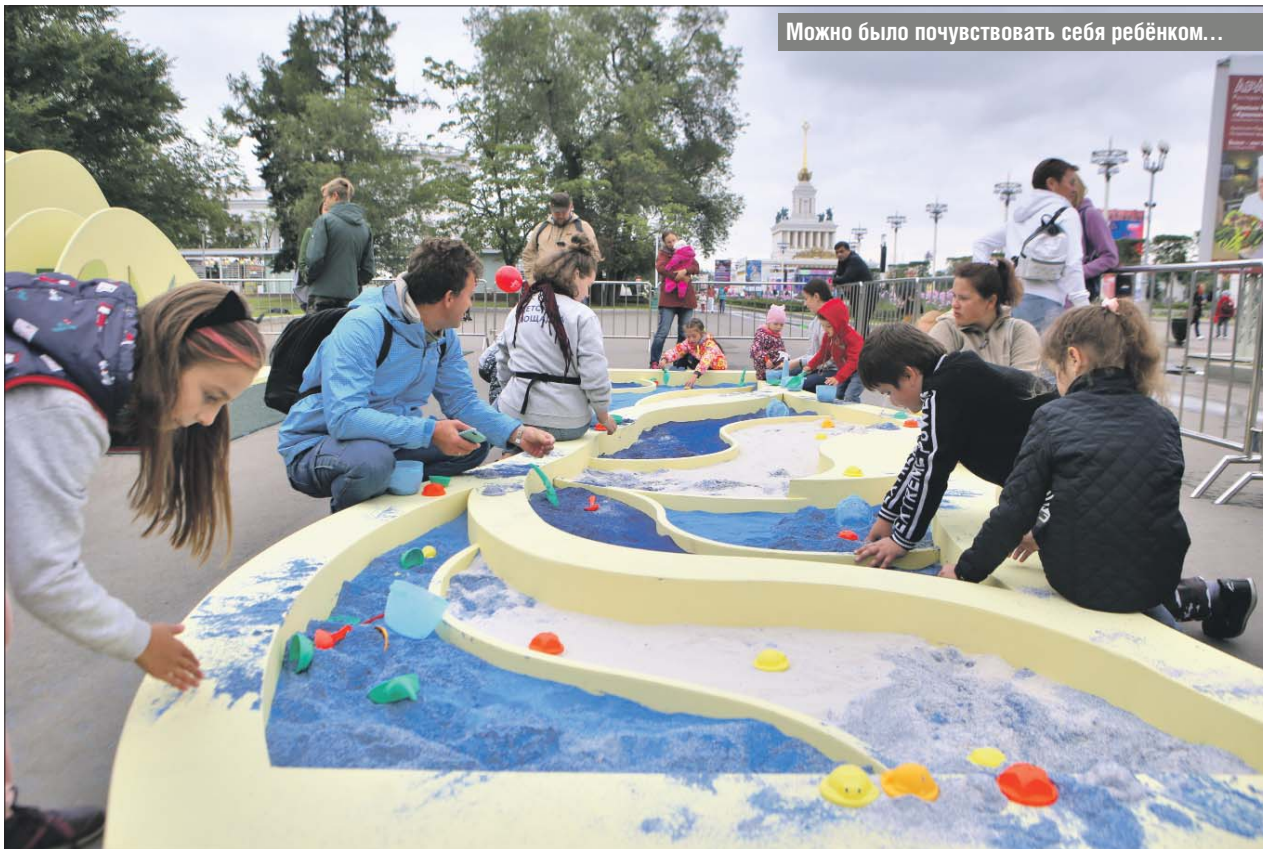
Можно было почувствовать себя ребёнком...