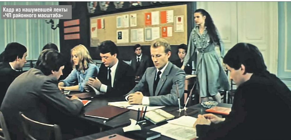
Кадр из нашумевшей ленты «ЧП районного масштаба»