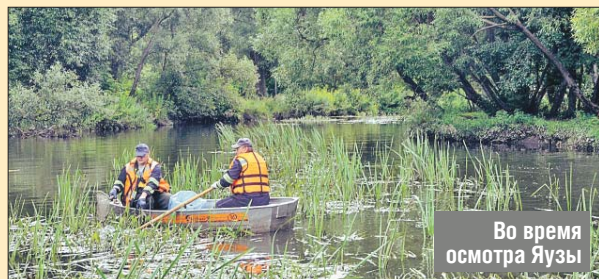
Во время осмотра Яузы