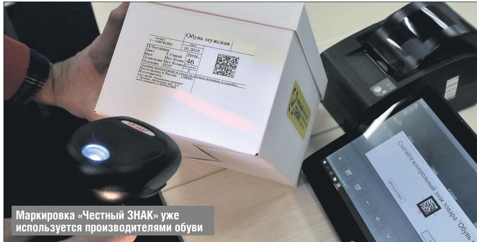
Маркировка «Честный ЗНАК» уже используется производителями обуви

наносит на каждый продукт уникальный код, который в зашифрованном виде фиксирует всю цепочку поставки от фабрики до потребителя. Чтобы товар попал в розничную продажу, его необходимо отсканировать на