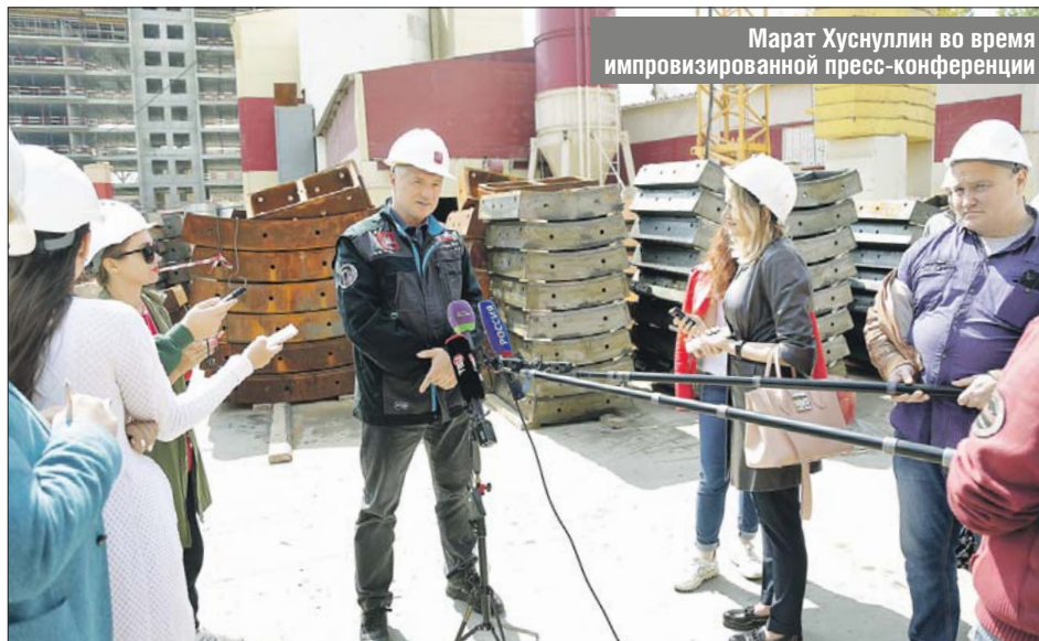
Марат Хуснуллин во время импровизированной пресс-конференции

— «Шереметьевская» строится на глубине 70 метров — это одна из самых глубоких станций столичного метрополитена. Здесь установят самый длинный