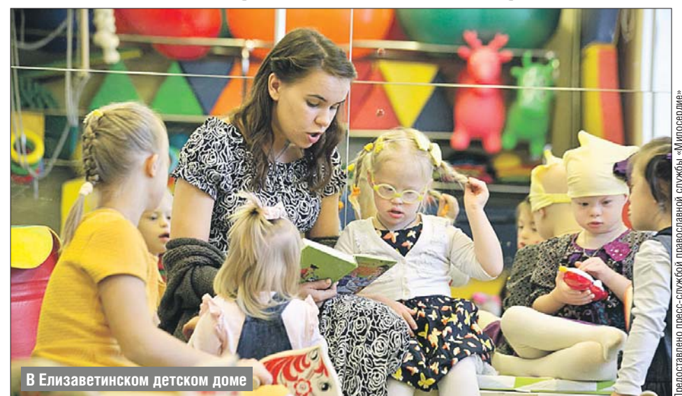
В Елизаветинском детском доме