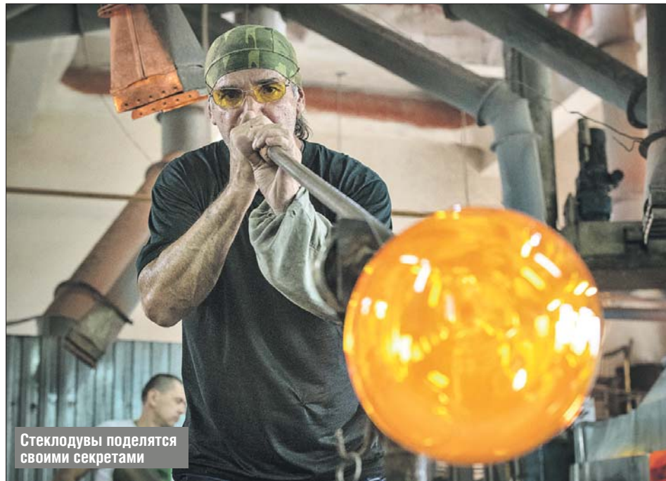
Стеклодувы поделаются своими секретами