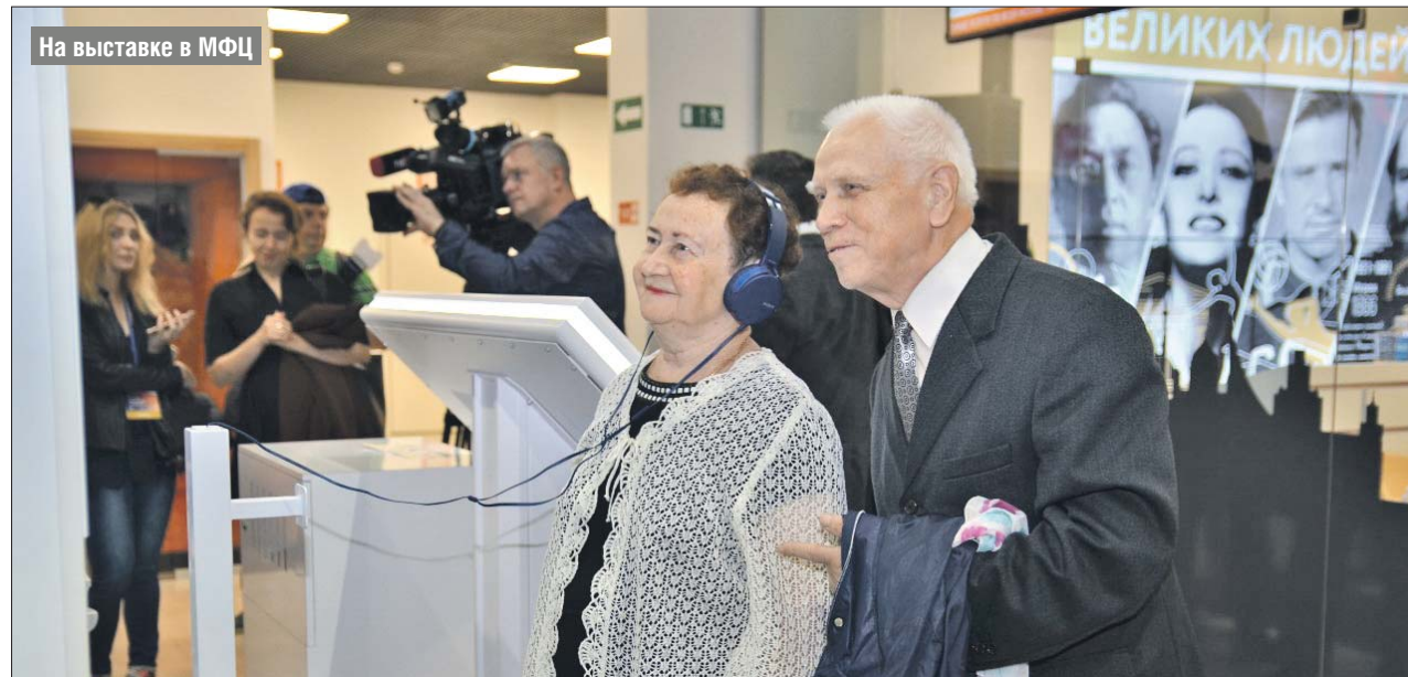
На выставке в МФЦ

Вторая часть выставок состоит из интерактивных экспонатов, посвящённых выдающимся москвичам: писателю Фёдору Достоевскому, вратарю Льву Яшину, балерине Майе Плисецкой, художнику Василию Кандинскому, физиологу Сергею Брюхо-