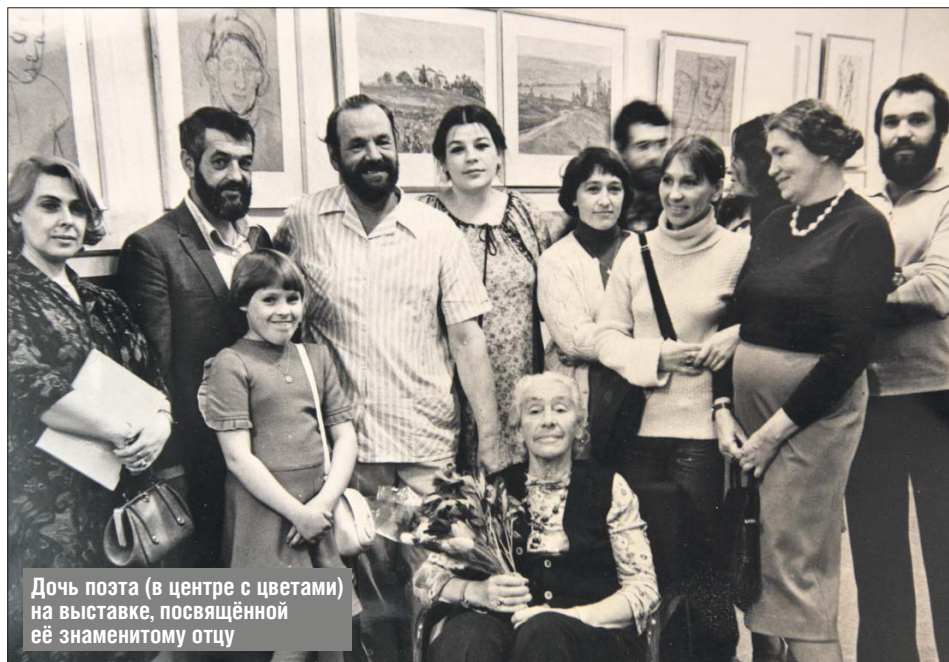
Дочь поэта (в центре с цветами) на выставке, посвящённой её знаменитому отцу

— Однажды в бибиревской квартире я спросила, чья это фотография за