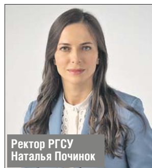
Ректор РГСУ Наталья Починок

— «Московское долголетие» — прекрасный проект, мы считаем своим долгом всячески его поддерживать: и напрямую, открыв для москвичей наш технопарк, и опосредованно, когда мы помогаем