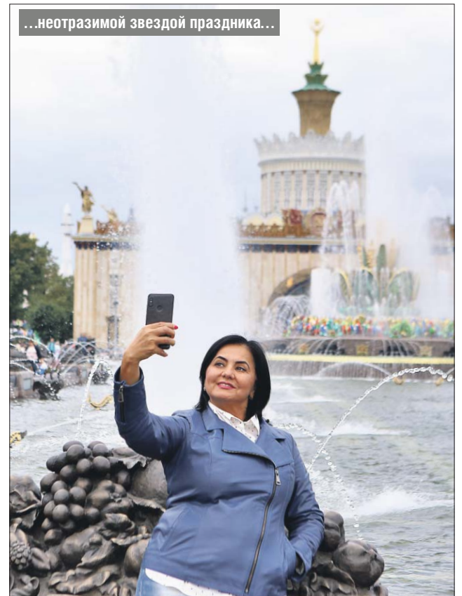
...неотразимой звездой праздника...