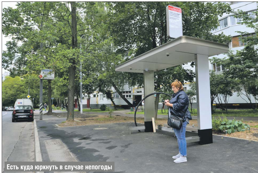
Есть куда юркнуть в случае непогоды

— Как раз сейчас завершается работа по обустройству остановочных пунктов «Улица Ротер-