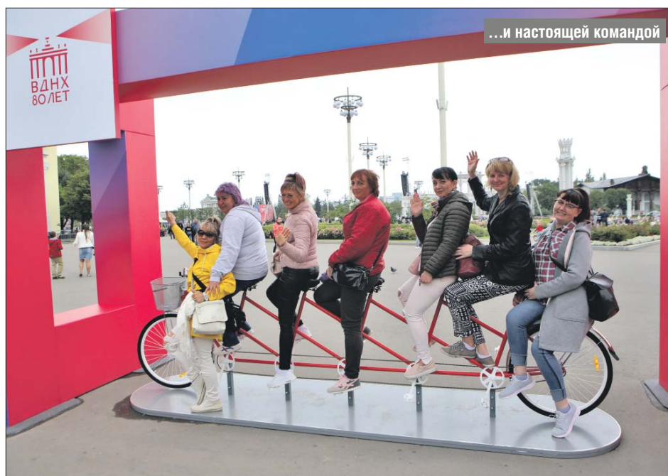
...и настоящей командой

— Меня часто спрашивают, какой должна стать Выставка достижений народного хозяйства. Я думаю, на этот вопрос может быть только один ответ. ВДНХ будет такой, какой хотят её видеть сами москвичи. Она будет местом для тихих прогулок и стадионом экстремального спорта. Она будет уникальным парком аттракционов и техноградом, который даёт путёвку в мир новых профессий. Она будет крупнейшим музеем страны. На ВДНХ будут собираться энтузиасты традиционных народных ремёсел и молодые художники. ВДНХ будет открывать своим гостям глубины Мирового океана и