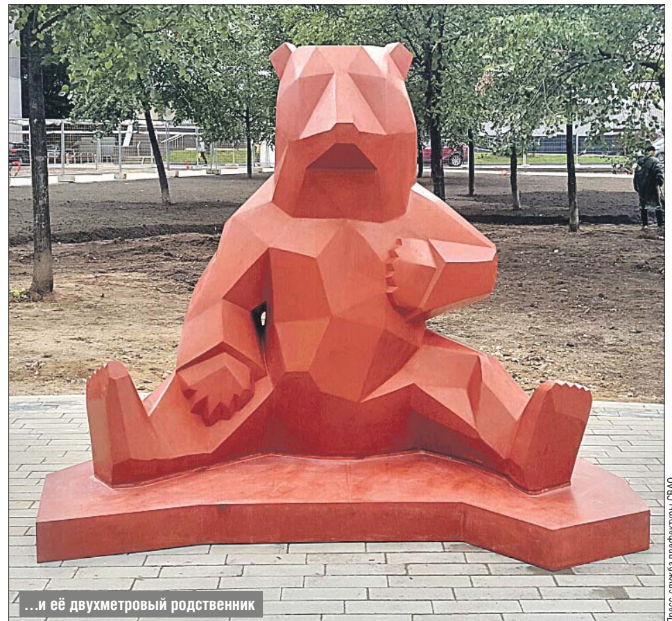
...и её двухметровый родственник

В СВАО идут масштабные работы по обустройству дворов, дорог и скверов. Они решают не только насущные проблемы жителей, но и приносят оригинальные черты в облик районов.