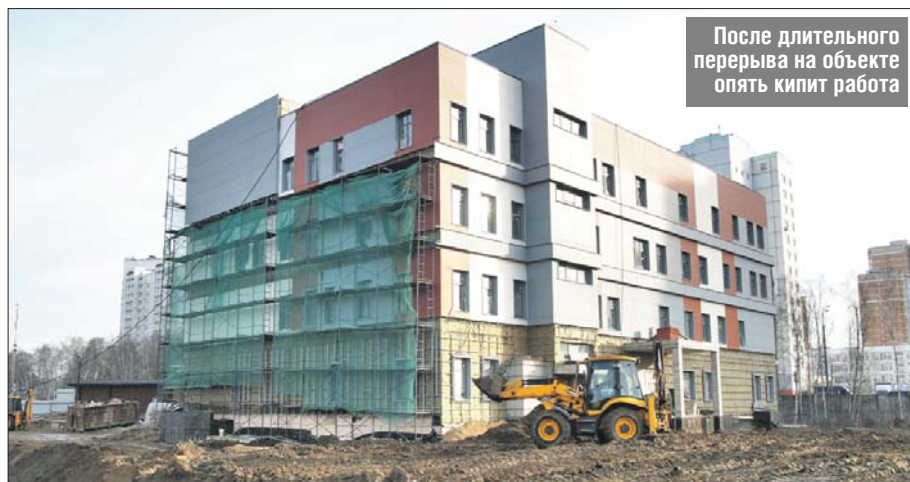
После длительного перерыва на объекте опять кипит работа

Действительно, первоначально планировалось завершить строительство в 2018 году. В мае прошлого года здание было готово, велись отделочные и фасадные работы, переустройство инженерных коммуникаций. Однако по ряду причин застройщику пришлось сменить под-