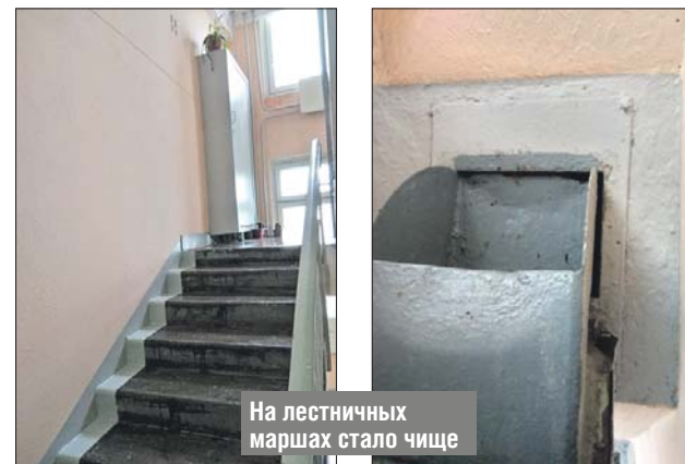
На лестничных маршах стало чище