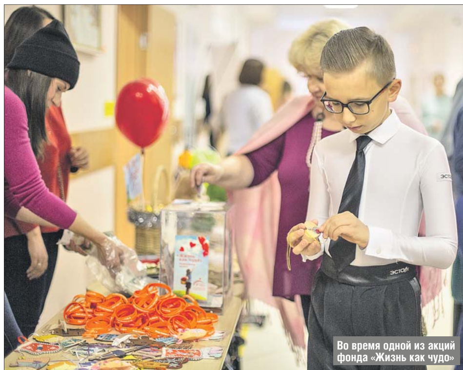
Во время одной из акций фонда «Жизнь как чудо»

Таких подопечных у фонда сотни, за 10 лет удалось помочь 600 детям. Но от благотворителей требуется не только помощь в сборе средств на лечение.