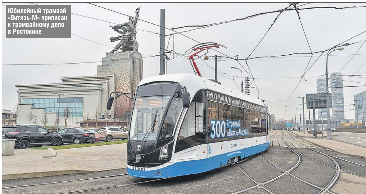
Юбилейный трамвай «Витязь-М» приписан к трамвайному депо в Ростокине

— Мы договорились, что приступаем к созданию собственного производства в Москве и инновационного центра по разработке электрического транспорта, связанного с разработкой и созданием в том числе беспилотного транспорта, — рассказал он.