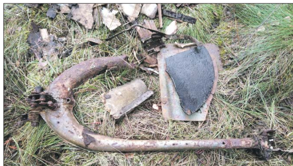
Стойка шасси найденного в болоте штурмовика

Среди других находок — шашки, мундштук, чернильница, снаряды, домино, туба из-под первитина (во время войны этот стимулятор был в аптечке немецких воен-