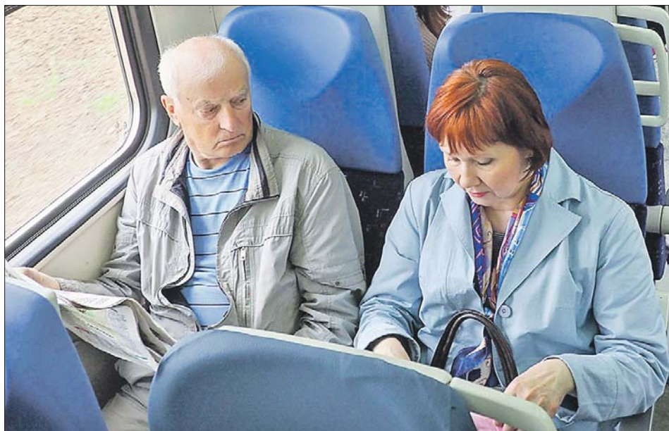
Предпенсионерам в городском транспорте можно ездить по социальной карте москвича

Социальные льготы предоставляет карта москвича