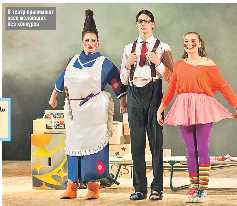
В театр принимают всех желающих без конкурса