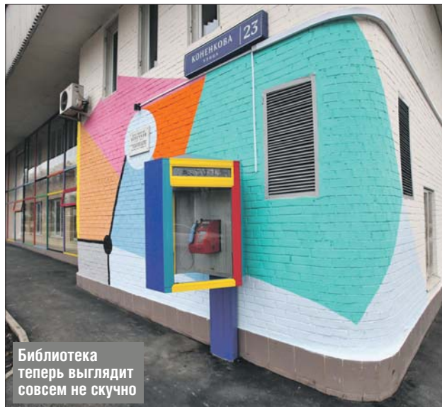
Библиотека теперь выглядит совсем не скучно

Преобразился и облик библиотеки: стены украсили яркими граффити, расписали будку таксофона на углу здания, почистили и освежили портрет Маяковского на фасаде читальни. Площадка под просторной аркой между двумя входами, которая раньше использовалась для хозяйственных