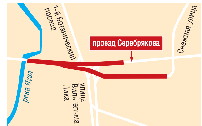
— ограничение движения