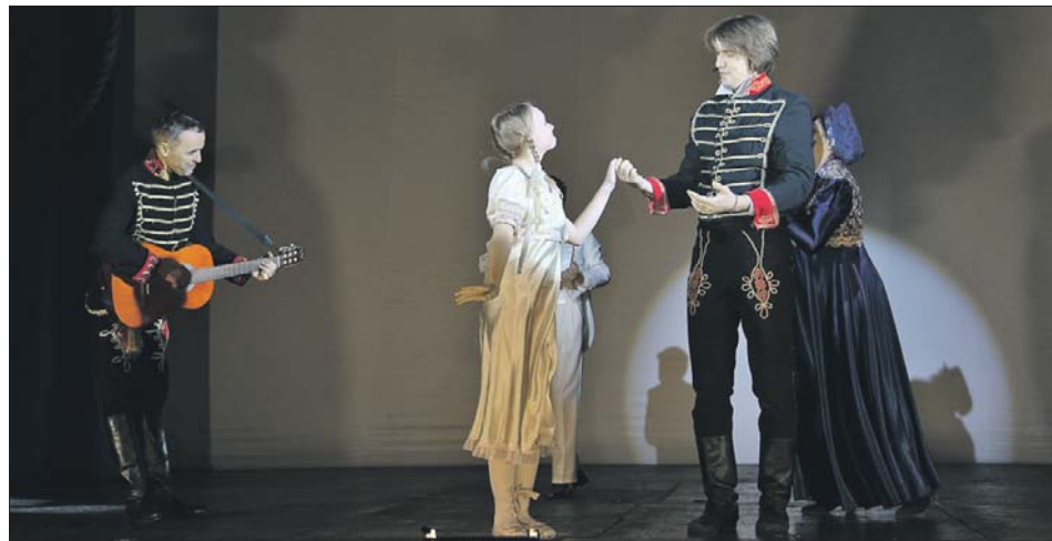
Будущим воинам показали отрывок из «Войны и мира» Льва Толстого