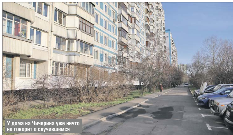
У дома на Чичерина уже ничто не говорит о случившемся

— Всё у них было хорошо, — говорит мужчина, вышедший погулять с собакой. —