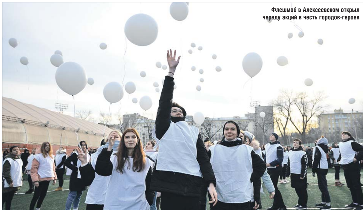
Флешмоб в Алексеевском открыл череду акций в честь городов-героев