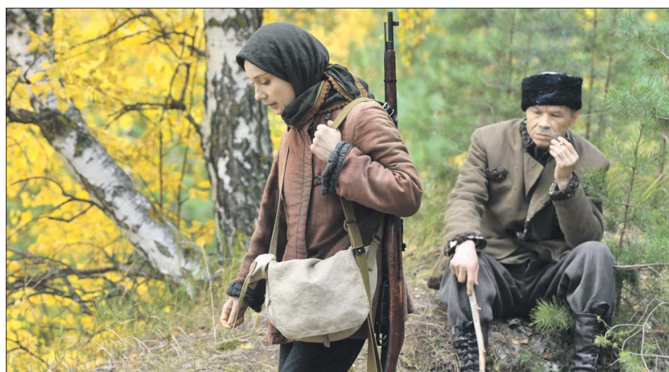
Чулпан Хаматова в главной роли на съёмках сериала «Зулейха открывает глаза»

— За первый роман вы получили премии «Большая книга» и «Ясная Поляна». Дало ли вам это что-то, кроме денег?