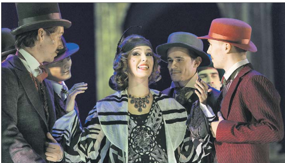
В спектакле «Принцесса цирка» в Московском театре мюзикла