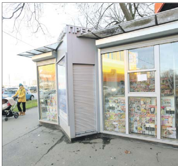
Местным жителям за свежей прессой далеко ходить не надо

Управа Бабушкинского района: ул. Лётчика Бабушкина, 1, корп. 1, тел. (495) 471-5519. Эл. почта: bshspr@svao.mos.ru . Сайт: babushkinsky.mos.ru