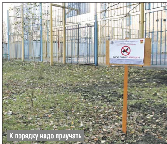
К порядку надо приучать