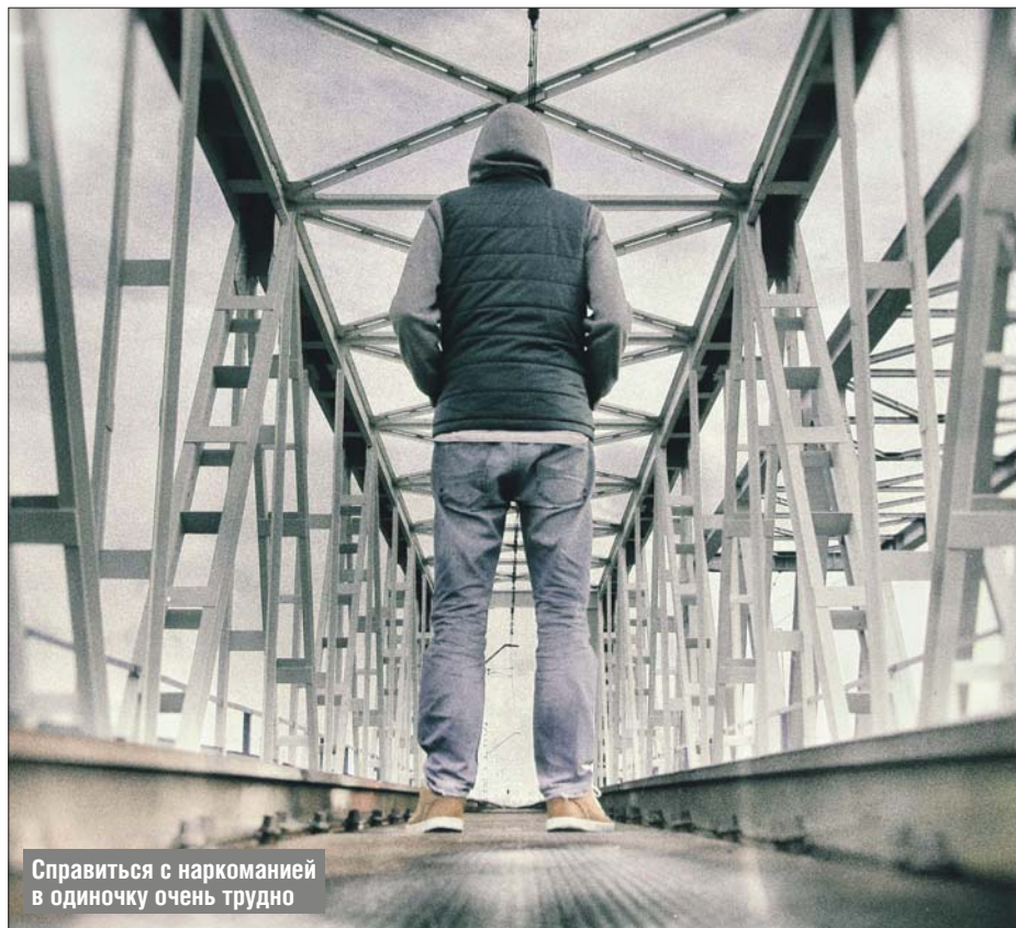
Справиться с наркоманией в одиночку очень трудно

«Анонимные наркоманы» в Ярославском — одно из звеньев мирового сообщества тех, кто употреблял наркотики, но сумел остановиться или мечтает об этом. Посещение групп бесплатное и анонимное. Всё на принципах общественной самоорганизации. Опытные участники добровольно берут на себя заботу об организации таких встреч, о визитах к пациентам наркоклиник, о шефстве над новичками. Груз ответственности не даёт им сорваться.