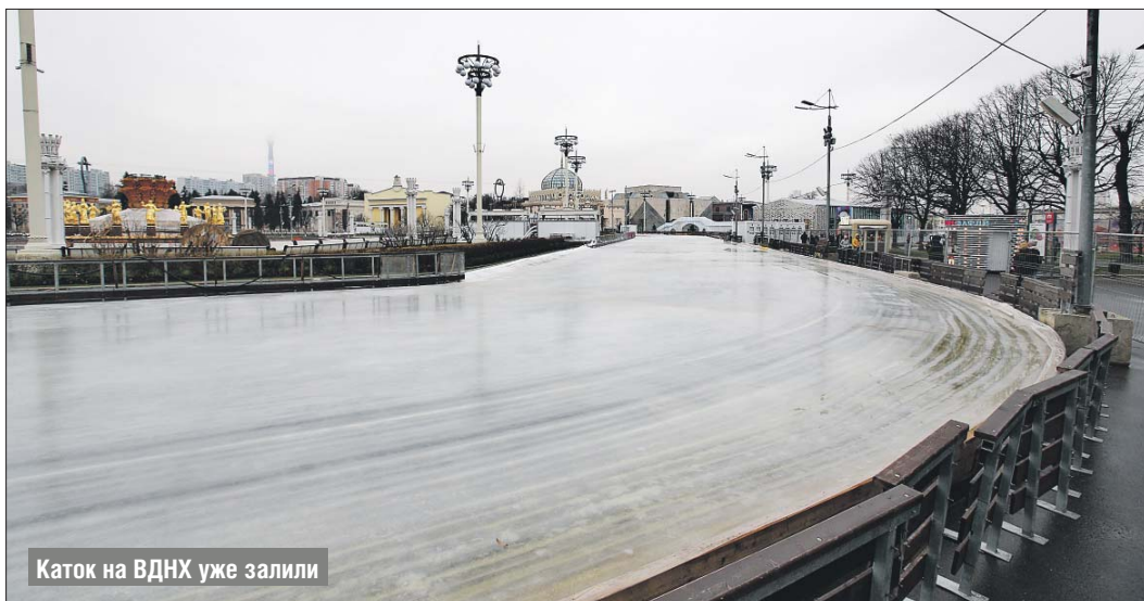
Каток на ВДНХ уже залили

Для детей трёх-восьми лет оборудуют отдельную зону напро-