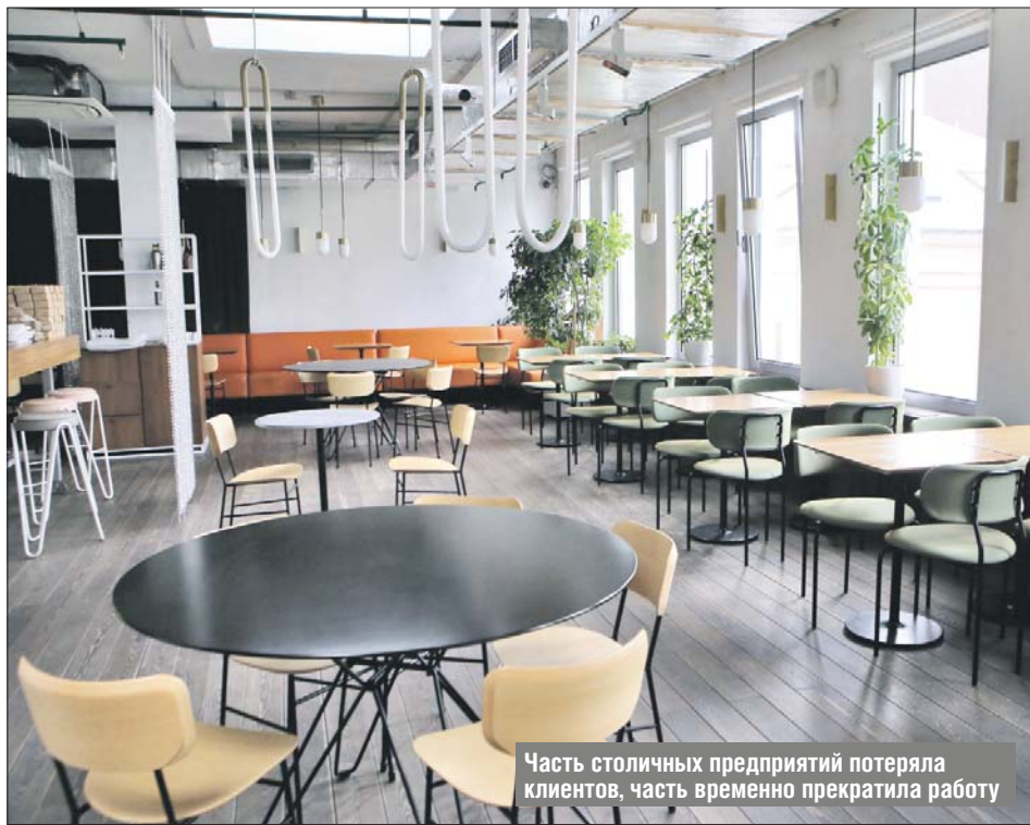
Часть столичных предприятий потеряла клиентов, часть временно прекратила работу