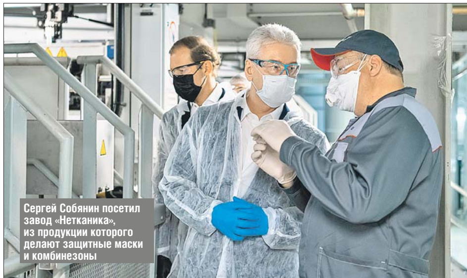
Сергей Собянин посетил завод «Нетканика», из продукции которого делают защитные маски и комбинезоны

1 Начиная с 12 мая 2020 года могут вернуться к работе предприятия промышленности и строительства. В том числе мы возобновляем строительство дорог, школ, детских