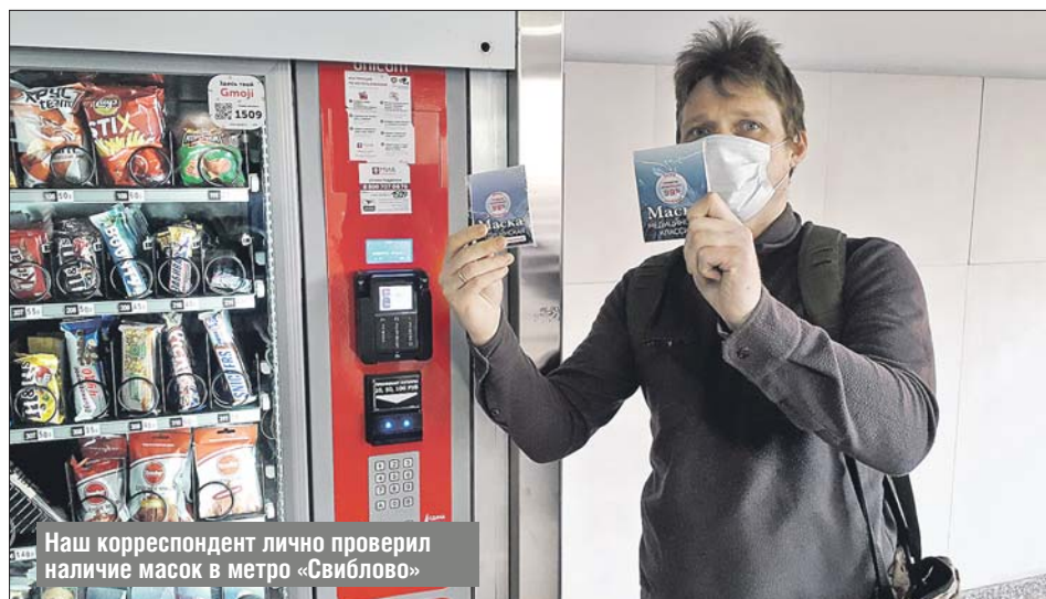
Наш корреспондент лично проверил наличие масок в метро «Свиблово»

— Цена в метро единая: 30 рублей — маска, 20 рублей — перчатки, 50 рублей — набор, — пояснили в ведомстве.