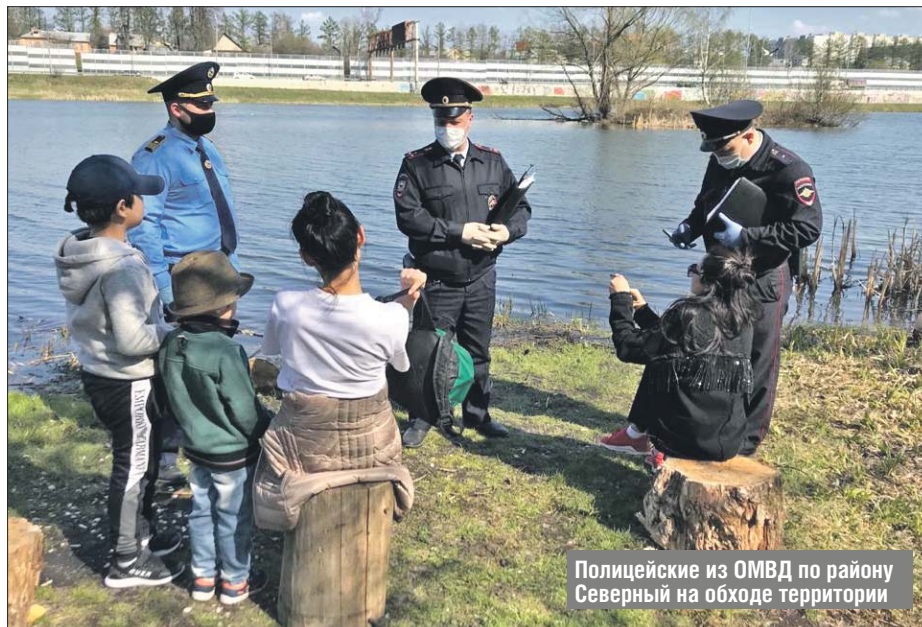
Полицейские и из ОМВД по району Северный на обходе территории