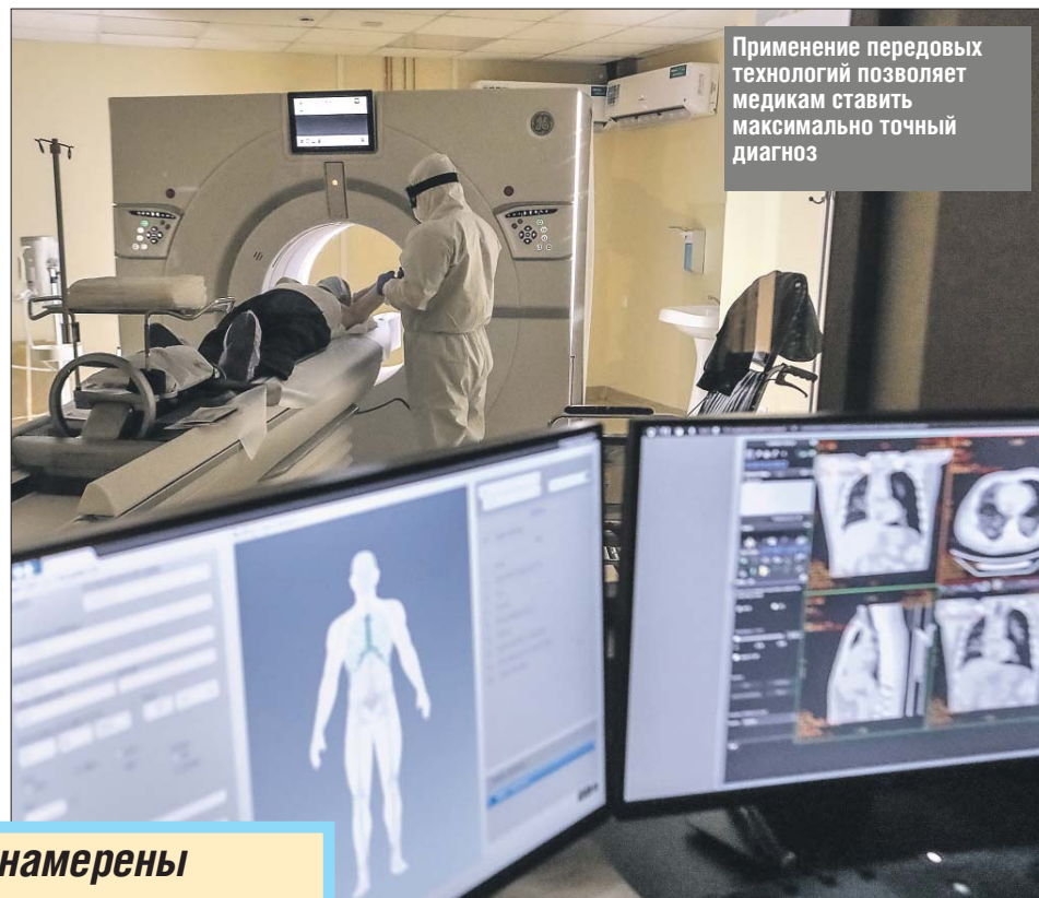
Применение передовых технологий позволяет медикам ставить максимально точный диагноз

— Ранее положительные тесты проходили верификацию в лаборатории НИИ эпидемиологии, как в ре-