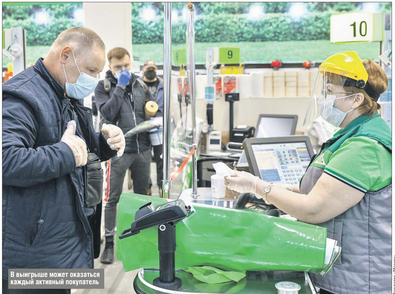
В выигрыше может оказаться каждый активный покупатель

Сертификаты будут действовать исключительно на мо-