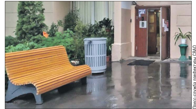
Прошла неделя, и теперь здесь удобная лавочка, новая урна и красиво расставленные вазоны