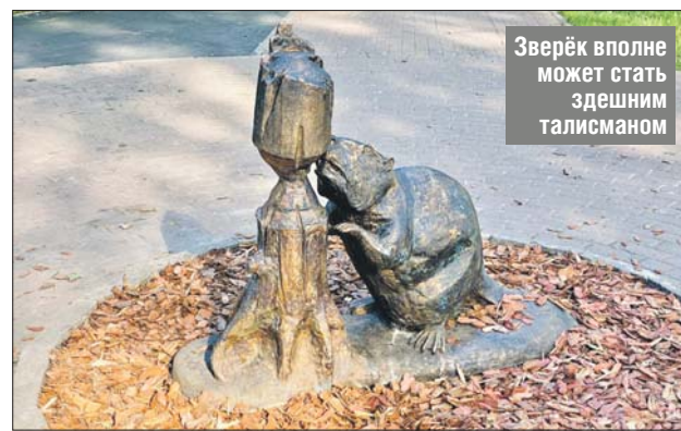
Зверёк вполне может стать здешним талисманом