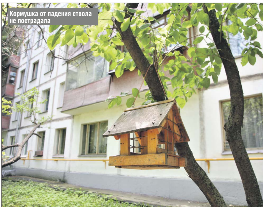
Кормушка от падения ствола не пострадала

Работники «Жилищника Алтуфьевского района» сделали всё необходимое: упавшую часть дерева и сломанные ветки с газона убрали, а кормушку, которая упала без повреждений, перевесили на сосед-