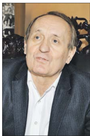
Из архива редакции

Мне вспомнилась история из далёкого советского прошлого, когда я пришёл к первому секретарю Люблинского райкома партии с просьбой помочь открыть театр. На это он мне ответил, что ему нужен не театр, а пивные для рабочего класса. Хорошие пивные, конечно, нужны, но слава богу, что сейчас и в Текстильщиках, и в других районах, в том числе