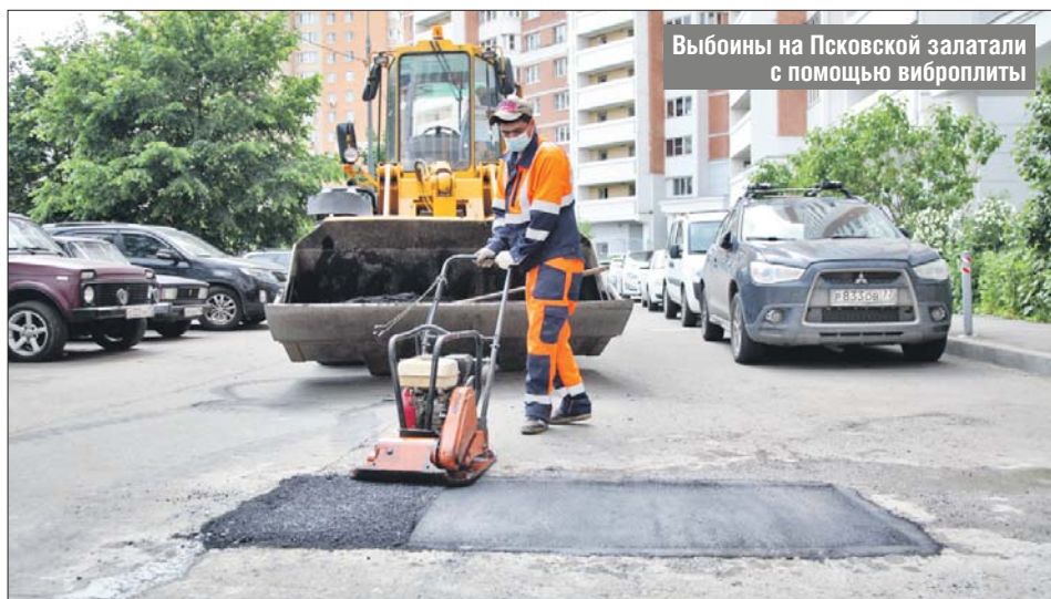
Выбоины на Псковской залатали с помощью виброплиты

Во дворах и на дорогах округа заделывают ямы