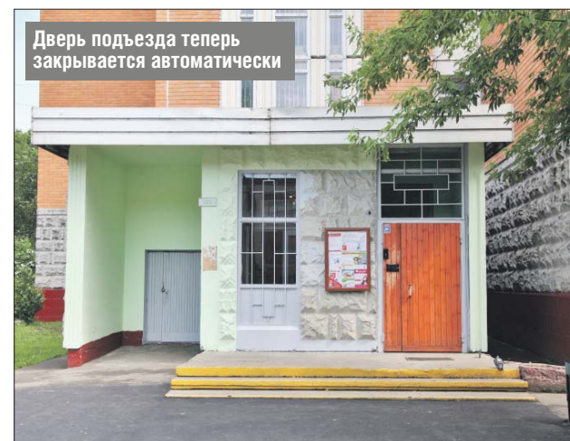
Дверь подъезда теперь закрывается автоматически

ГБУ «Жилищник района Северное Медведково»: ул. Тихомирова, 1, корп. 2, тел.: (495) 656-9851, (499) 479-7377. Эл. почта: zhilishnik@gbusm.ru