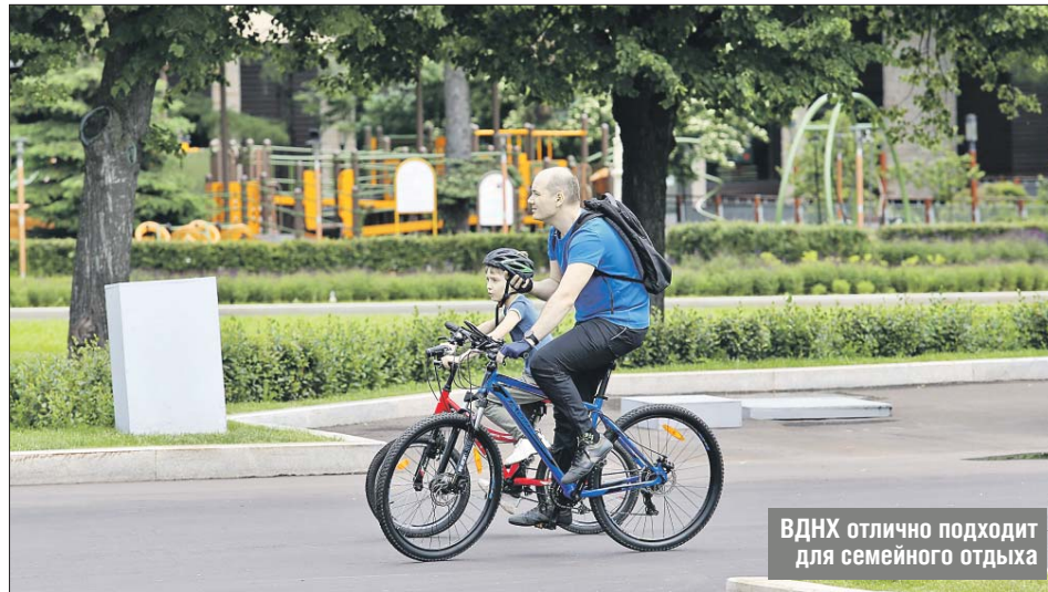
ВДНХ отлично подходит для семейного отдыха

Корреспондент «ЗБ» выяснил, где можно погулять и развлечься в округе