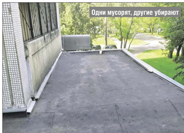
Одни мусорят, другие убирают