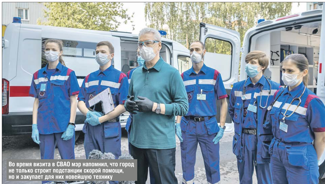
Во время визита в СВАО мэр напомнил, что город не только строит подстанции скорой помощи, но и закупает для них новейшую технику

Помещения подстанции были построены в 1917-1958 годах. Все они обветшали, поэтому новое здание было совершенно необходимо. На время строительства сотрудников подстанции №17 распределили по разным постам, расположенным на территории семи стационаров и поликлиник СВАО.