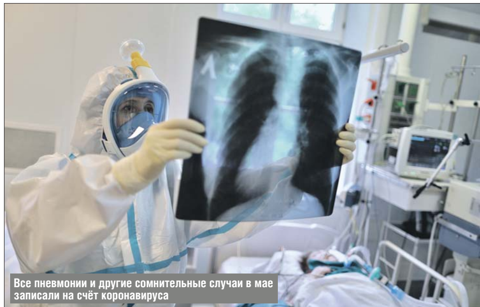
Все пневмонии и другие сомнительные случаи в мае записали на счёт коронавируса

Тем не менее в столичных больницах всегда оставались свободные койки для