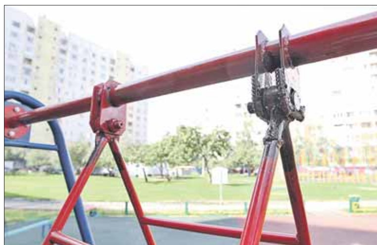
Качели на Отрадной, 9, после обращения на портал починили

В этом году жители обращались на портал с жалобами и пожеланиями по благоустройству. Лидирует Отрадное, самый большой район СВАО, — 395 обращений с начала года, на втором месте Бибирево и Алексеевский — по 190 обращений.