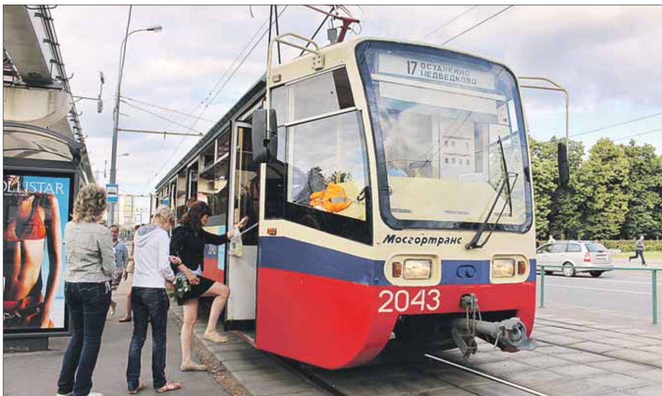
Многие пассажиры по привычке идут к передней двери

У «Золотого Вавилона» к трамваю бежит субъект с пивом. Оттолкнув женщину и школьника, он вбегает в последнюю дверь и плюхается на единственное свободное сиденье. На обратном пути в трамвай входит семья: мама,