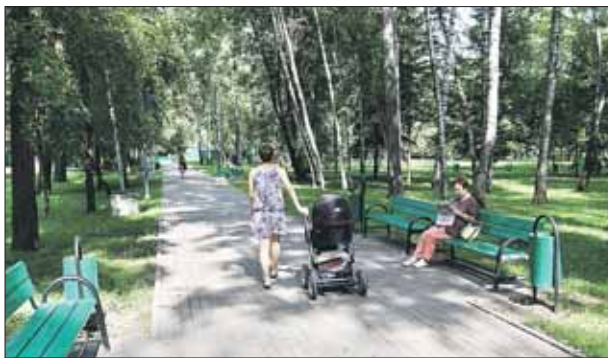
Благоустройство в сквере будет точечным

— Небольшая площадка с комплексом тренажёров появится в западной части Таёжного сквера уже к 1 сентября, — рассказала начальник отдела технадзора по благоустройству и озеленению ГКУ «Дирекция ЖКХиБ