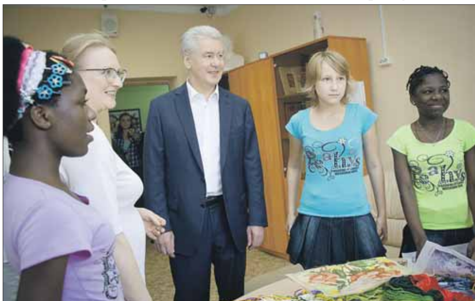
Врио мэра Москвы Сергей Собянин с воспитанниками центра

Врио мэра Москвы Сергей Собянин посетил на минувшей неделе социально-реабилитационный центр для несовершеннолетних «Алтуфьево» в районе Отрадное.