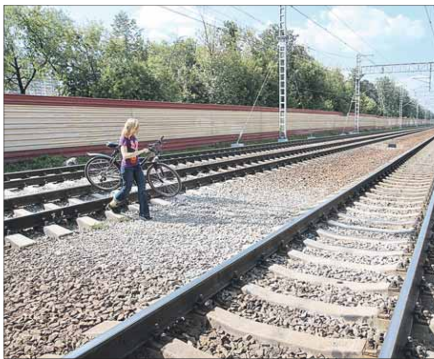
Здесь будет надземный переход с лифтами для маломобильных граждан