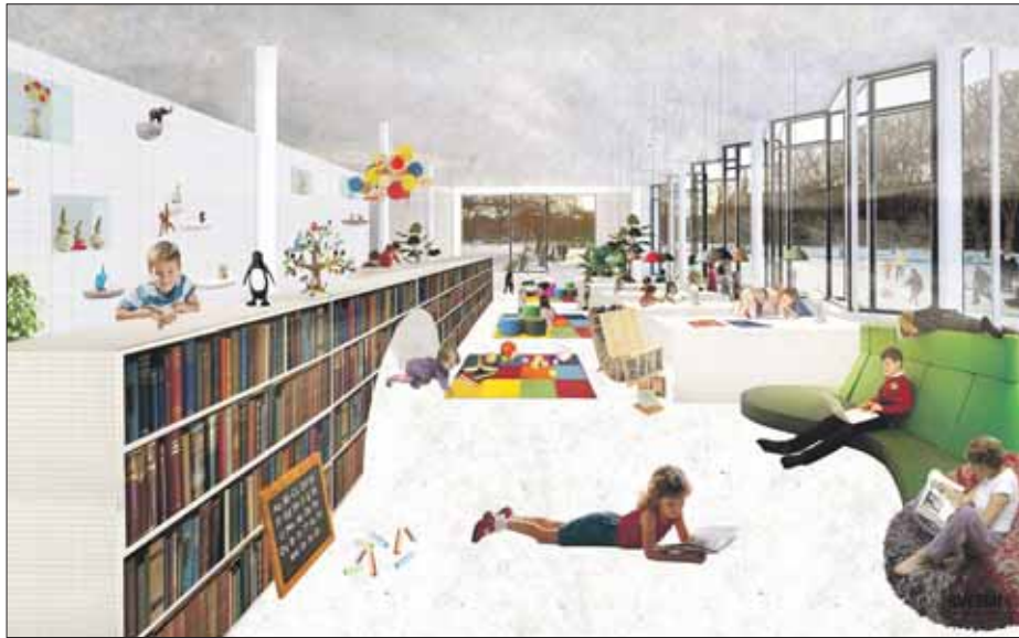
Макет будущего медиacentра