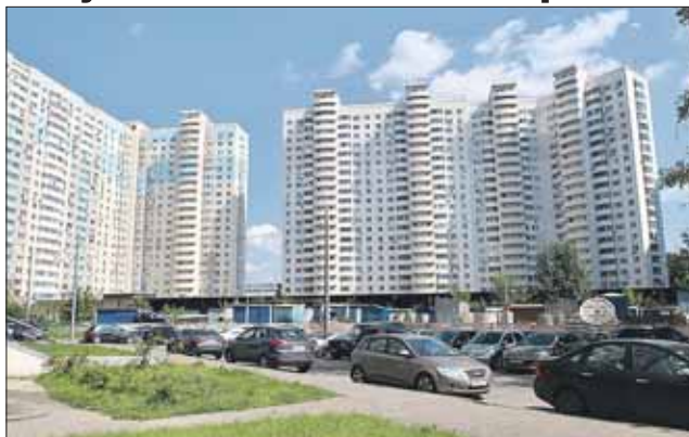
В перспективе здесь планируют построить детский сад