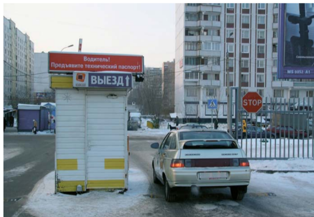
На парковке у «Золотого Вавилона» теперь техпаспорт не проверяют

Почему у «Золотого Вавилона» сначала ввели, а потом отменили контроль техпаспортов