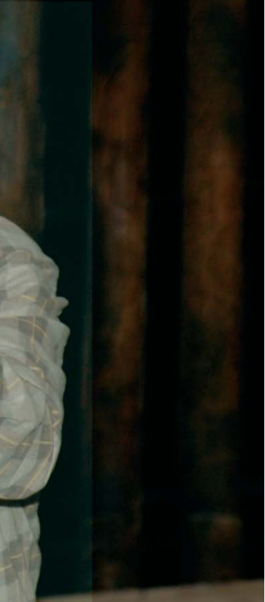
«Прошлым летом в Чулимске»