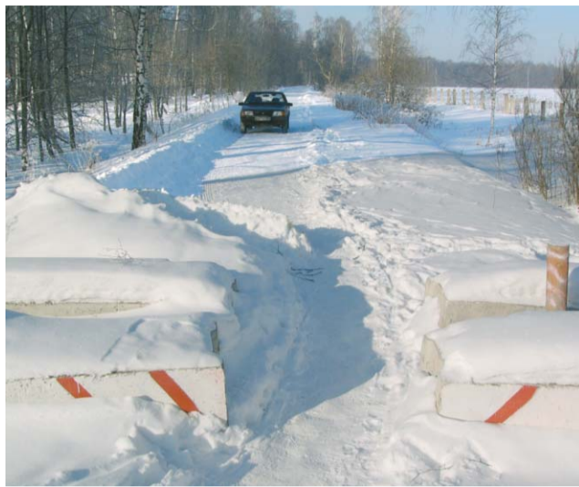
Проезд с ул. Мичурина на Новодачную перекрыли