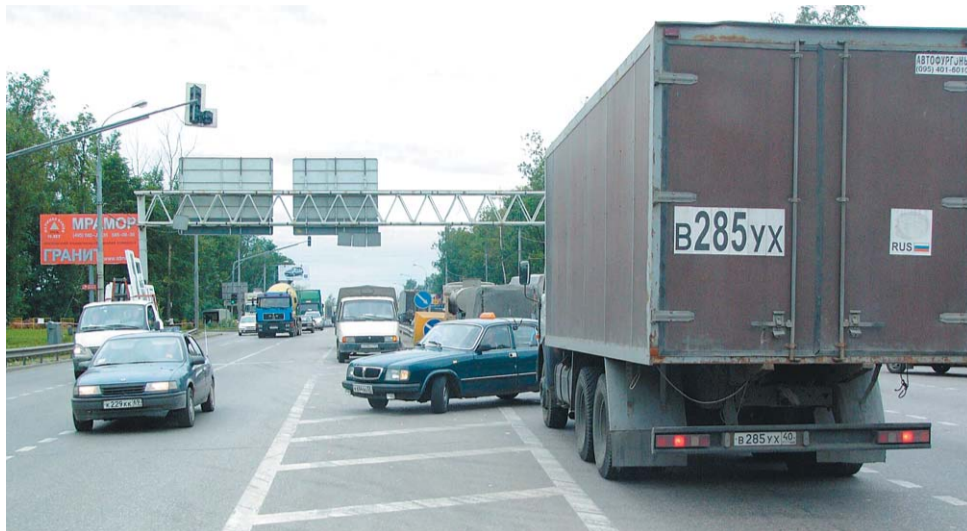
Перекресток на 19-м км Дмитровки давно требует разгрузки

На территории СВАО выявлено 40 очагов аварийности, где за 7 месяцев 2006 года произошло уже 120 серьезных ДТП. В них погибло 7 и было ранено 149 человек. И хотя эти показатели значительно ниже прошлогодних (за тот же период прошлого года погибло 14 человек), само наличие мест, где тяжелые аварии происходят особенно часто, не может не вызывать беспокойства.