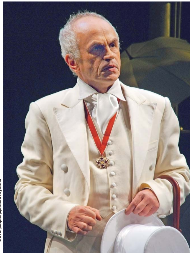
«Идеальный муж» в «Табакерке»

чески оказался под расстрелом. Эйзенштейн узнал об этом и тут же они вместе с Михаилом Роммом дали телеграмму, что арестован наш советский человек, что его нужно отпустить.