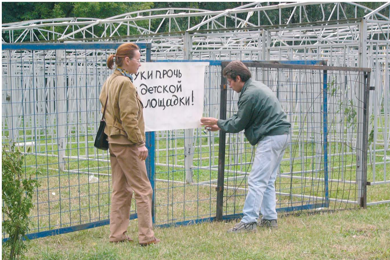
Наглядная агитация — самый безобидный аргумент в конфликте

В результате строительство детского сада затормозилось, поскольку часть стройплощадки по-прежнему занимает старая стоянка. Строители платят неустойки, конфликт набирает обороты, обрстая новыми участниками и претензиями сторон.