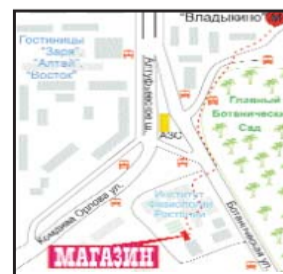
График работы: понедельник — суббота: 10-00 до 19-00 воскресенье: 10-00 до 17-00 Тел. (495) 105-7527 доп. 113 НЕКОНДИЦИОННАЯ ОБУВЬ от 30 рублей

СХЕМА ПРОЕЗДА: ООО «МИДИСА» Ботаническая ул., д. 35, ИФР