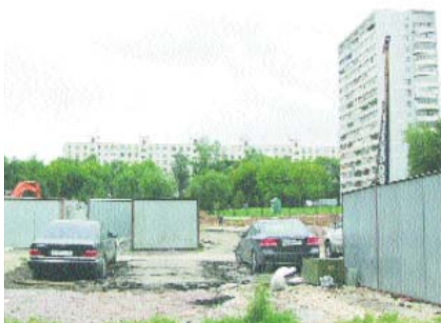
Строительство детсада на Широкой заморожено

Из-за чего ломаются копы в Студеном проезде