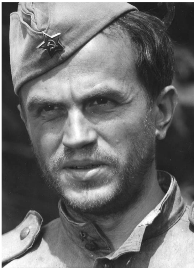
Кадр из фильма «Ожидание полковника Шальгины»

— Отец был очень скромным человеком и мало что рассказывал. Знаю, что он был влюблен в своего учителя. У меня хранятся рисунки Эйзен-