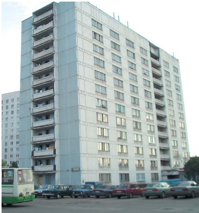
Здание в Южном Медведкове стало яблоком раздора

Люди выселяться не желали. Тогда УФСИНовцы решили избавиться от посторонних иначе — с помощью пропускного режима. Вышел скандал. Когда пришедшую из школы 11-классницу не пустил домой