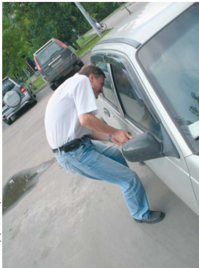
В лидерах новые «Жигули» и «Фольксваген Пассат»

Но главным фактором в отделе розыска ОГИБДД СВАО считают мероприятия по борьбе с угонами, которые в последнее время ГАИ проводит совместно с другими милицейскими службами. Вместе с инспекторами ГАИ в проверках на дорогах теперь участвуют сотрудники патрульно-постовой службы, отдела вневедомственной охраны, службы криминальной милиции и других подразделений. Проводятся такие рейды не реже раза в неделю. Результаты весьма наглядны. Так, во время рейда, проводившегося в ночь с 17 на 18 августа, были задержаны две угнанные машины. Но