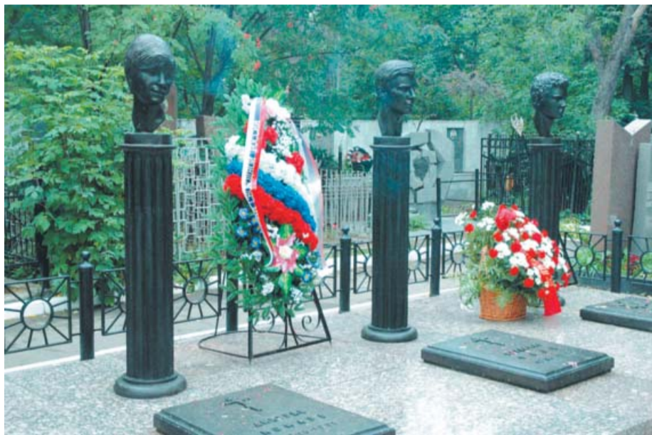
Мемориал на Ваганьковском кладбище

Размещение рекламы в «Звездном бульваре» 405-0425, 405-4140, e-mail: rzb@list.ru