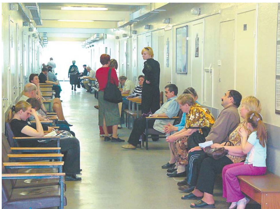
Очередь в окружной аллергологический кабинет в 107-й поликлинике