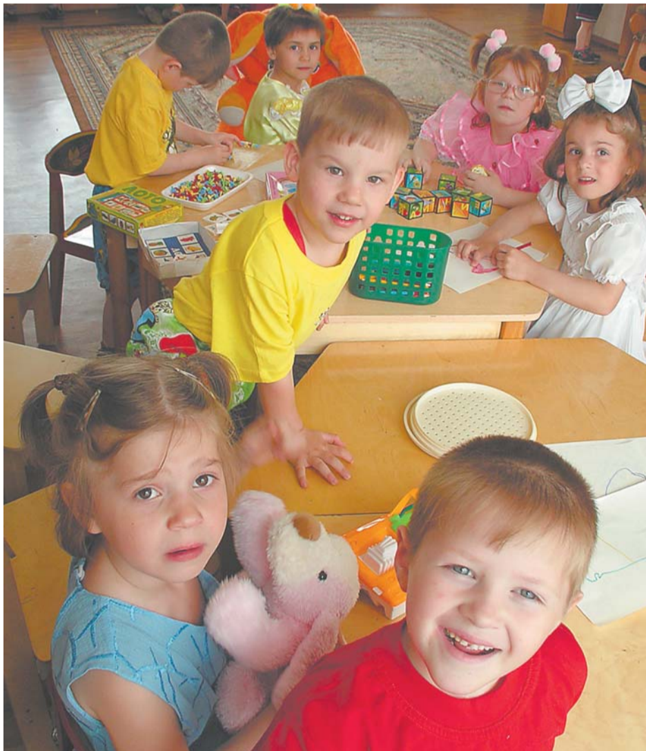
Они живут в детском доме № 59

В нашем округе действуют три детских дома и социально-реабилитационный центр для несовершеннолетних детей «Отрадное». Это около трехсот ребятишек, мечтающих о собственных мамах и папах. Мизерная цифра для более чем миллионного Северо-Востока! Вот если бы взрослым тоже загорелась мечтой — позакрывать казенные приюты, найдя каждому детдомовцу добрых родителей. Так ли уж это неосуществимо? Куда обращаться тем, кто решил породниться с обездоленными детьми?