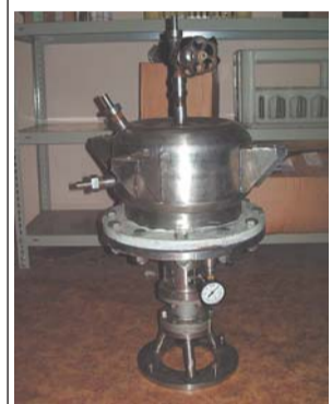
Аппарат для изготовления наркотиков