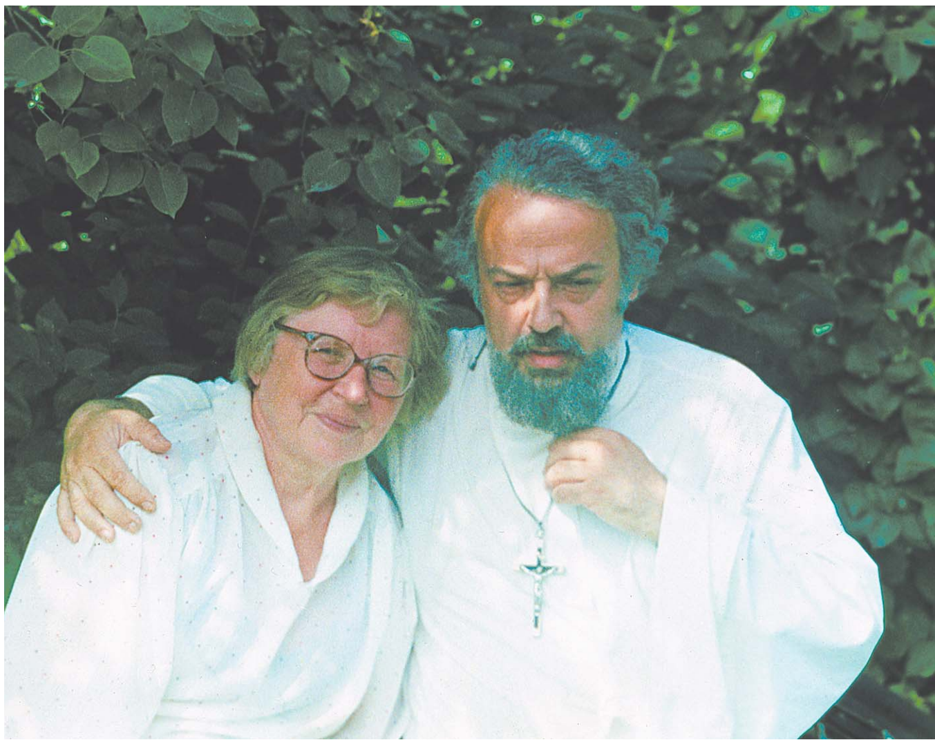
Зоя Масленникова и отец Александр Мень. Новая Деревня

— В вашей книге об отце Александре меня поразило од-