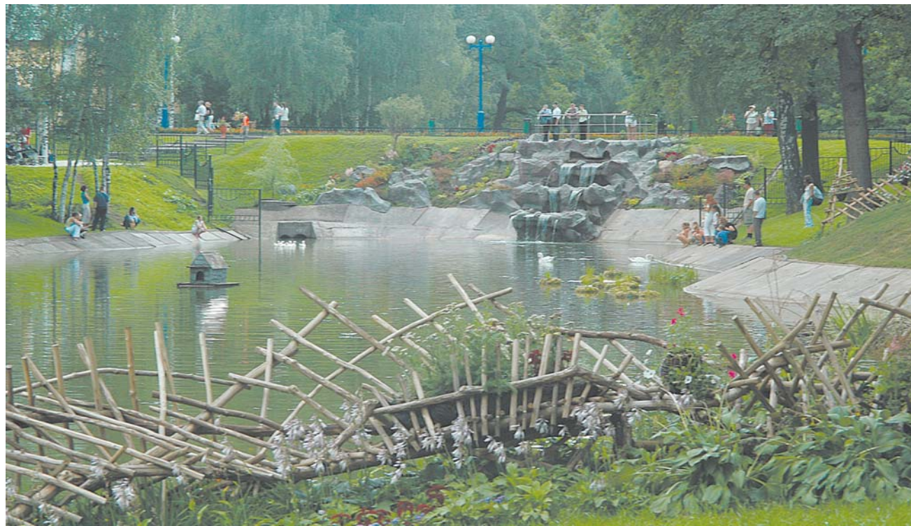
Так выглядит Лианозовский парк сегодня

Благоустройство округа передали в руки профессионалов