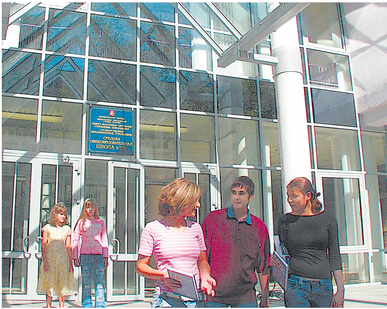
Школу №270 на Маломосковской улице построили за 5 месяцев

О чем говорили на августовском педсовете