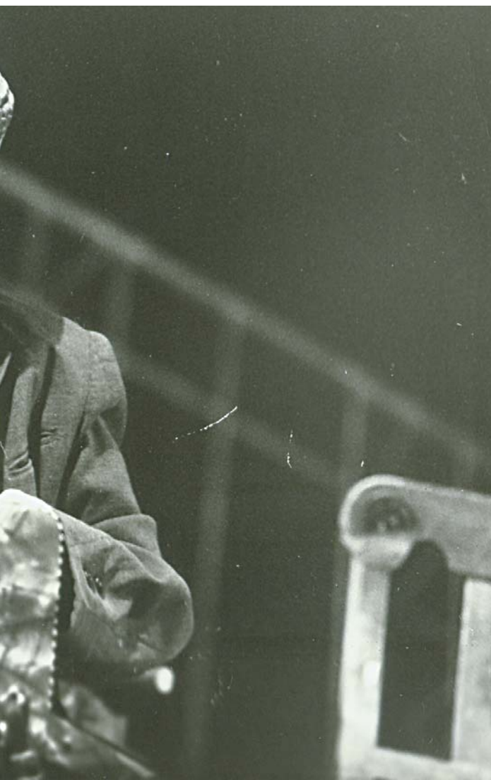
дик в спектакле «Барабанищица» (первая роль в театре)

девицы признавались мне, что парни перестали смотреть в их сторону.