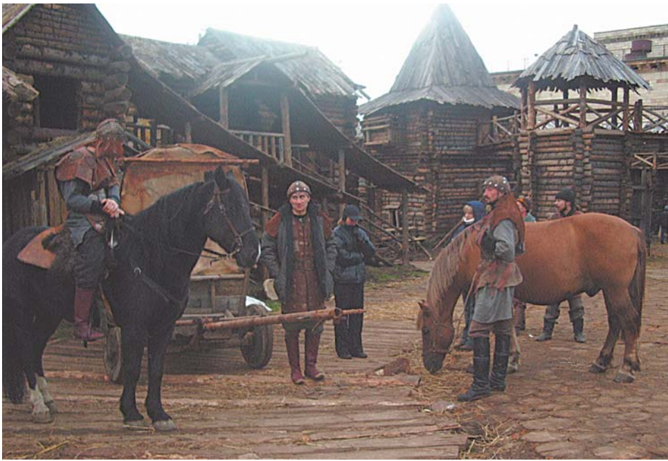
На съемочной площадке

Корреспондент «ЗБ» побывал на съемочной площадке «Мосфильма» вместе с лошадьми. Прямо на территории киностудии раскинулся город Галиград с извилистыми улочками и живописными деревянными домиками. Эту декорацию площадью около 5 кв. км,