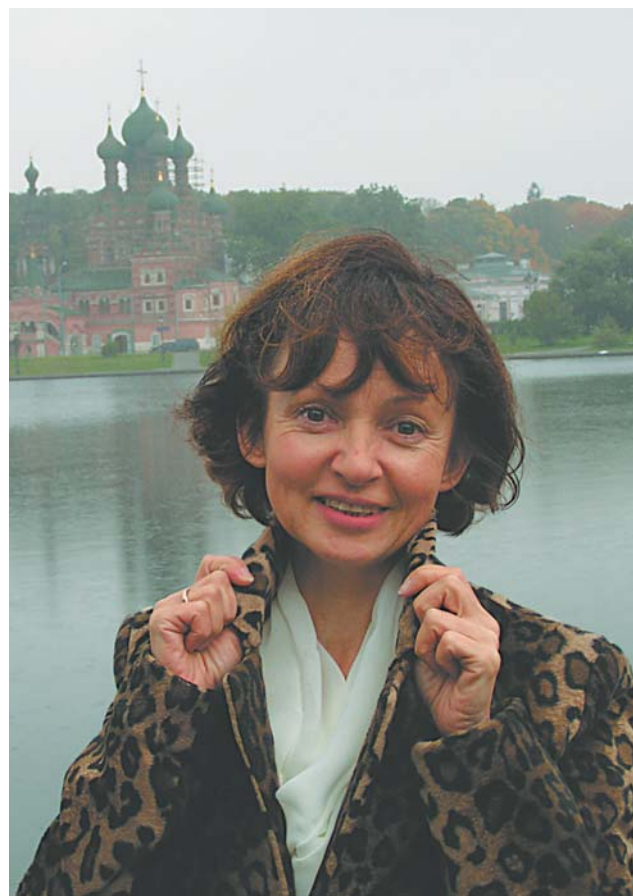
В родном районе

внимания могу уделять дому. Раньше была немислимая нагрузка. Особенно в каникулы. По 36 спектаклей в месяц. Может быть, поэтому я не научилась толком готовить — некогда было. У нас в доме нет культя еды. Муж приходит поздно, обедает на работе. Мы с дочкой тоже едоки неважные. По продуктовым магазинам ходить не любим, зато из книжных нас не вытащишь. Я очень люблю путешествовать, бывать в разных странах, особенно во Франции. Но еще сильнее я люблю свой дом. Он