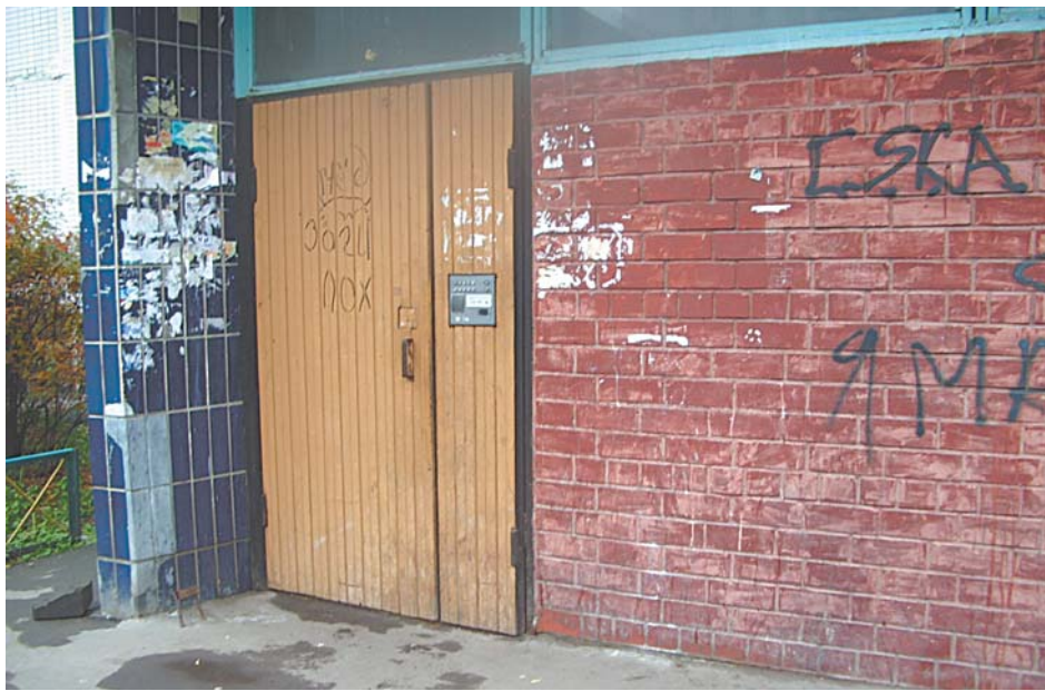
Здесь нашли убитого