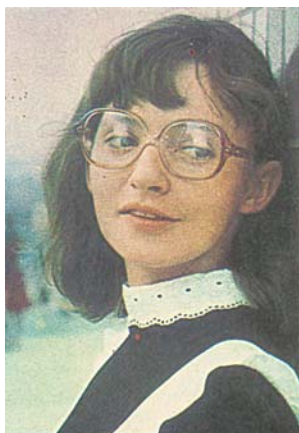
Кадр из фильма «Вам и не снилось»

— Нет, очень редко. Наверное, из-за природной женственности. Если это и были мальчики, то очень тихие, совсем не хулиганистые, не агрессивные. Хорошо помню своего первого мальчика Эдика из спектакля «Барабанщица» по пьесе Салынского. Меня часто спрашивают, волновалась ли я, когда впервые вышла. Отвечаю: ни-