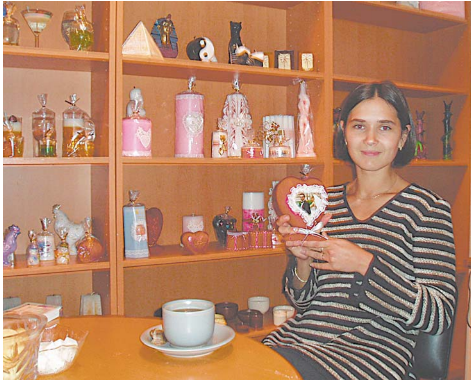
Красивые свечи радуют глаз

Вернувшись домой, она организовала фирму «Свечной двор», в которой была единственным сотрудником. В 1997-м сделала первые 20 све-