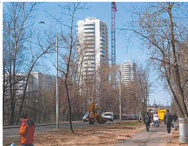
В Лианозове строят несколько таких высоток

заложен новый жилой квартал. Уже отводятся строительные площадки. Вскоре здесь начнут возводить первые четыре дома. Три из них — по индивидуальному проекту