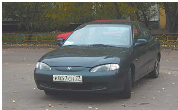
Машина до сих пор на стоянке