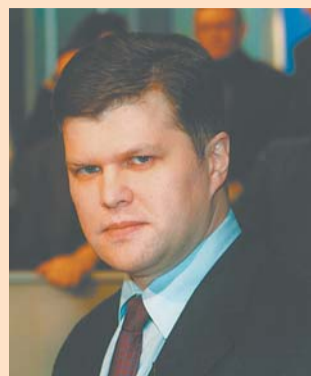
Сергей Митрохин, «ЯБЛОКО»