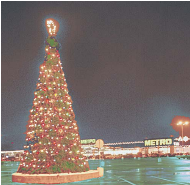
Самая большая елка в округе установлена на проспекте Мира у магазина METRO

Новогодние и рождественские гуляния пройдут по всему округу