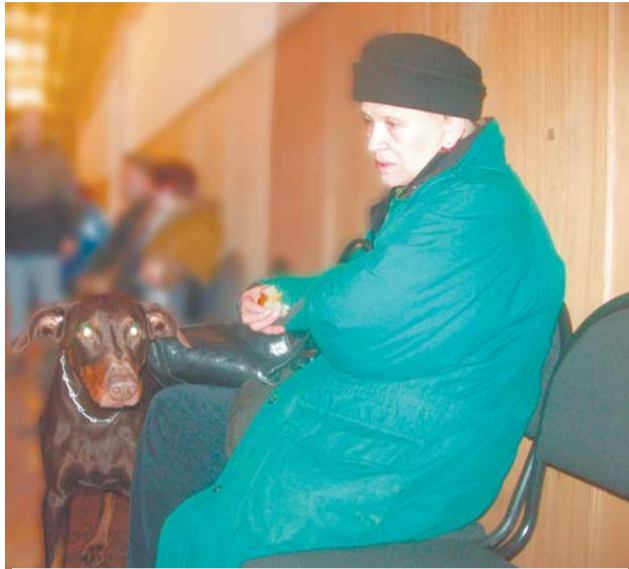
7 декабря, гимназия №1531