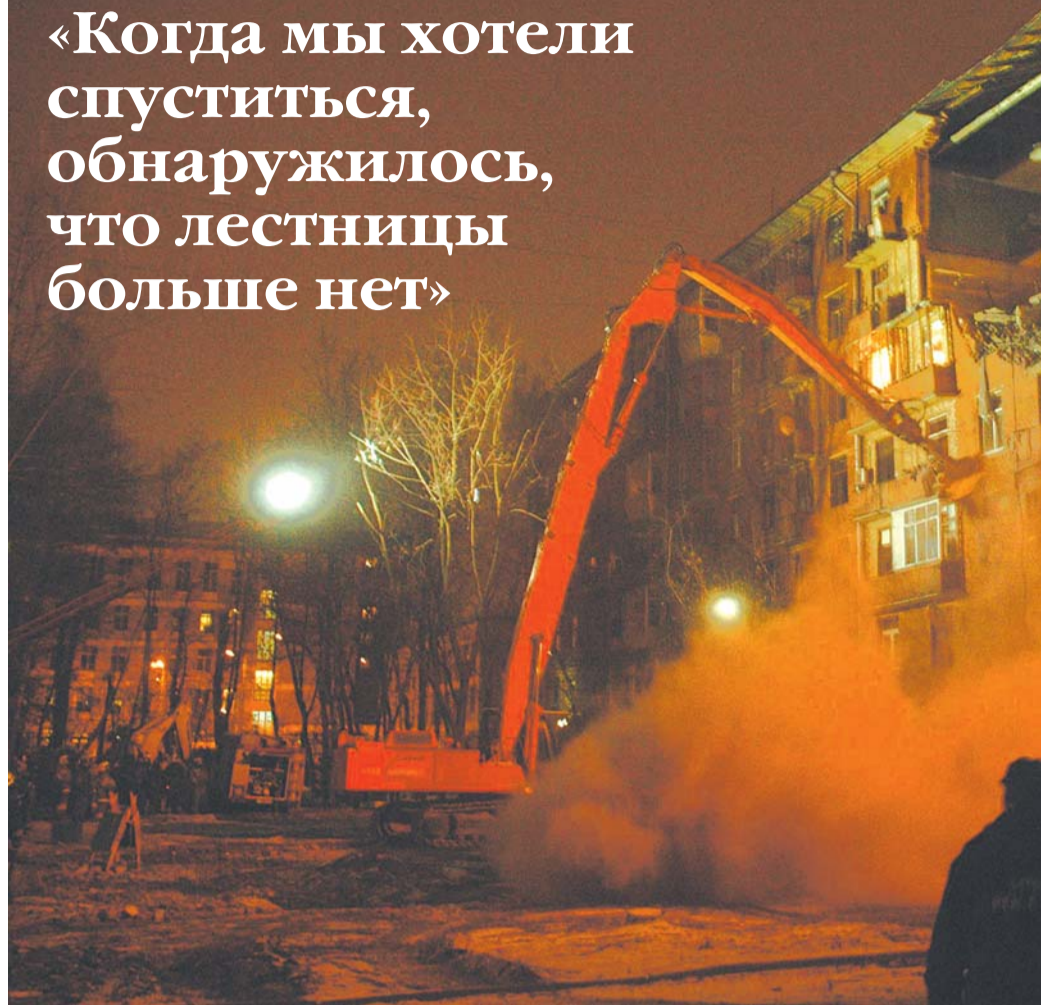
Улица Годовикова, б. Ночь с 7 на 8 декабря

«Когда мы хотели спуститься, обнаружилось, что лестницы больше нет»