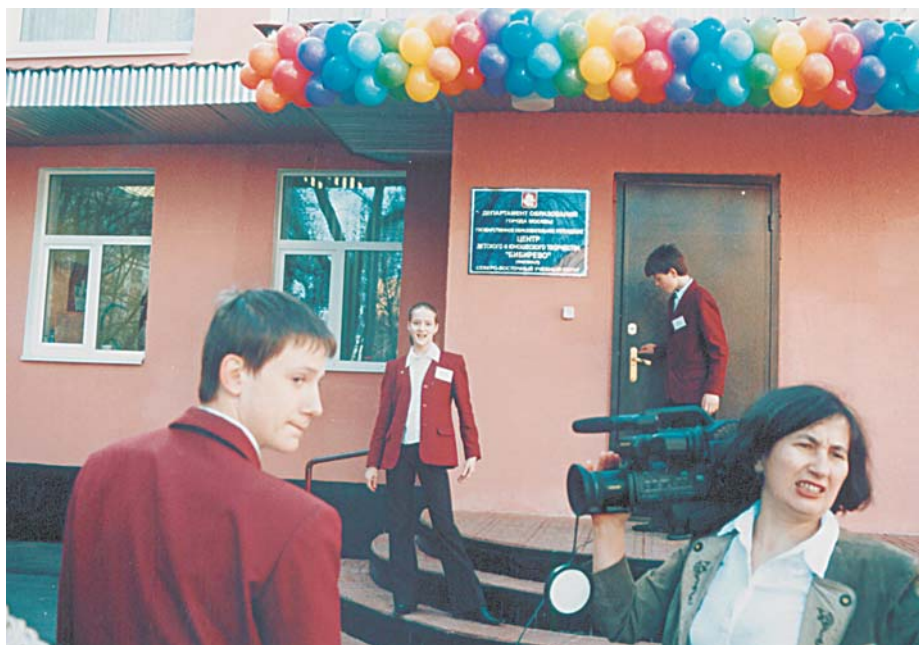
Тысячи ребят района смогут заниматься здесь в кружках и студиях