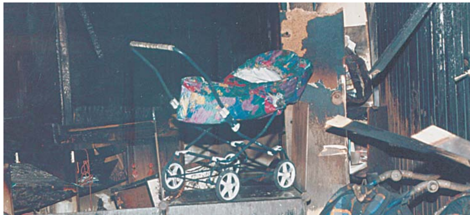
В универсаме на улице Малыгина сгорело все, кроме коляски

Площадь пожара составила 100 кв. метров.