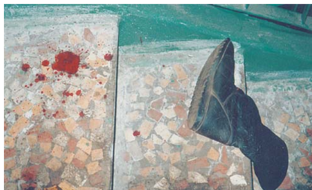
Сразу после трагедии на Шереметьевской, 13

в магазин, пожарным пришлось выбить стекла. Через полчаса приехали спасатели, спилили решетки и замок на грузовых воротах и открыли двери. На первом этаже горели отделы с детскими товарами и музыкальными дисками.