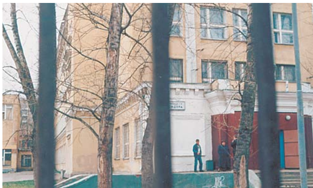
Эту школу №271 «взрывали» 6 раз

Полтора года назад милиция уже поймала двоих ребят, которые пугали школу № 271 на улице Цандера, 3, угрозой взрыва. Их родителям пришлось платить по 16 000 рублей штрафа. Потом в этой школе наступило затишье. Но утром 19 марта в милицию снова позвонили с сообщением о взрывном устройстве в школе № 271. В 8.45 съехали экстренные службы: пожарные, милиция, ГОЧС, «скорая помощь» и кинолог с собакой. Пока собака обнюхивала помещения, дети ждали на улице, а учителя строили предположения, кто мог так пошутить. А потом посыпались новые угрозы. 6, 7, 13, 14 и 15 апреля милиционеры, спасатели, врачи и пожарные вновь встречались у дома № 3 и искали бомбу. Один из звонивших даже проявил фантазию — сообщил милиционерам, что в школе засели террористы. Первого шутника милиция вычислила 14 апреля по горячим следам. Следователь установил владельца аппарата, с которого звонили, нашлись свидетели, и 15-летнего