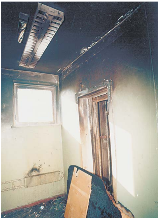
Алтуфьевское шоссе, 97. После пожара

Пока в этом подъезде работает только одна «летающая кабинка». Можно считать, жильцам повезло. Обычно при пожаре страдает соседний лифт, особенно если его шахта отделена только сеткой. Но и глухие шахты не спасают: автоматика-то парная.