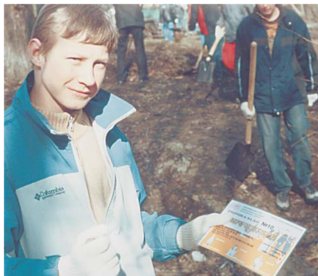
За такой купон школьники готовы убирать мусор хоть каждую субботу

или Как заинтриговать школьника субботником