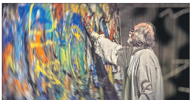
Художники из 18 стран участвуют в фестивале «Абстракция без границ»