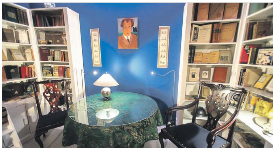
В Музее кино воссоздана обстановка кабинета Сергея Эйзенштейна

Ещё одной площадкой 29 августа станут кинотеатры