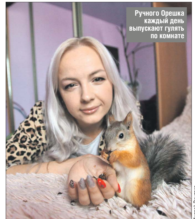
Ручного Орешка каждый день выпускают гулять по комнате

приютов, — пристройство. В парках, подведомственных Бабушкинскому, до пандемии мы организовывали различные фотовыставки и эко-