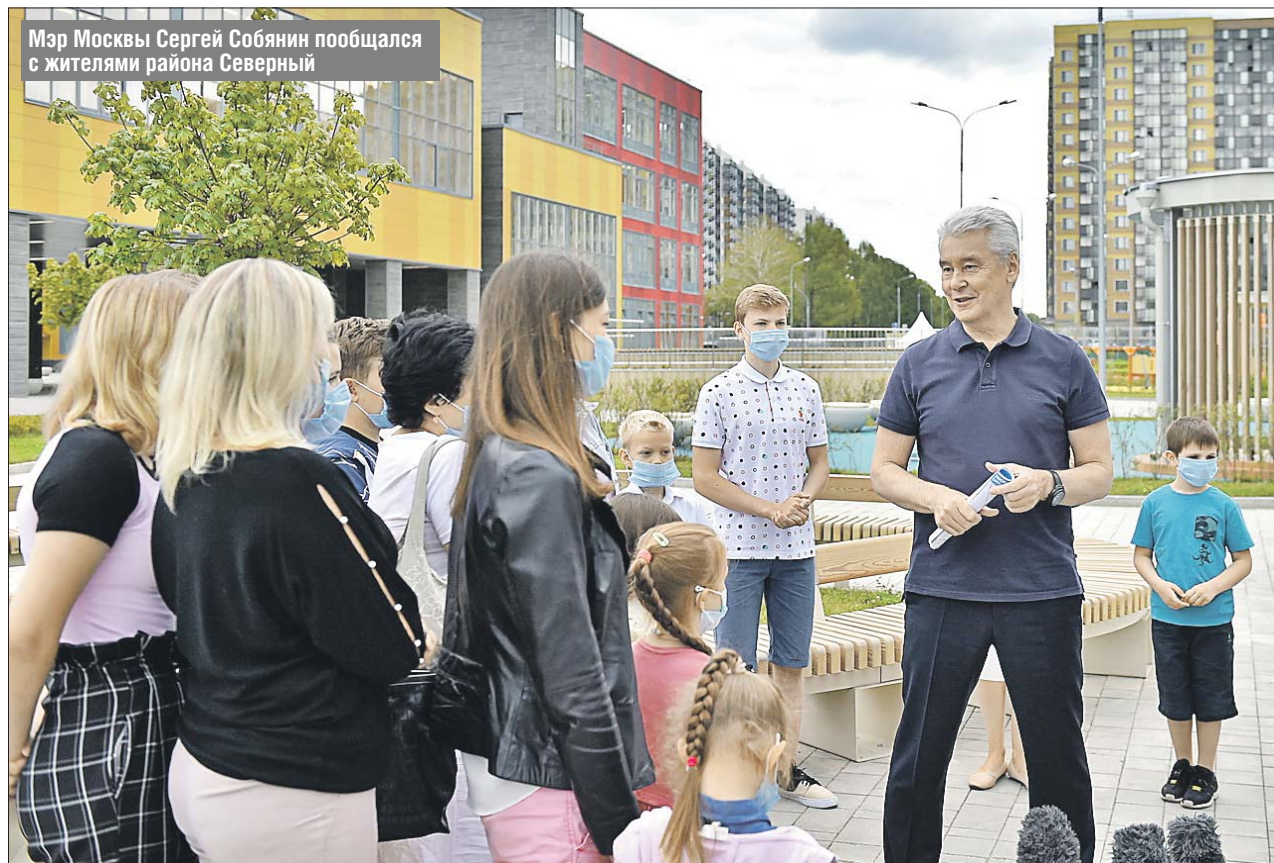
Мэр Москвы Сергей Собянин пообщался с жителями района Северный

Внутри здания в отдельных блоках будут размещаться начальные классы и классы старшей школы.