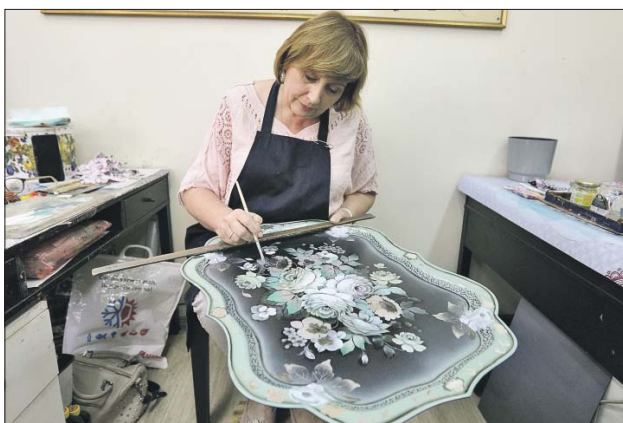
Жостовской декоративной росписи исполнилось 195 лет