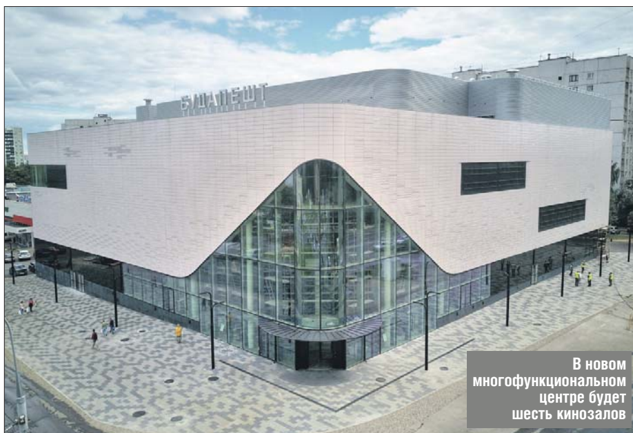
В новом многофункциональном центре будет шесть кинозалов

В новом многофункциональном центре расположился современный кинотеатр, в котором шесть залов. В каждом из них смогут одновременно смотреть фильмы 56 человек. Кроме кинотеатра, в здании есть супермаркет, ма-