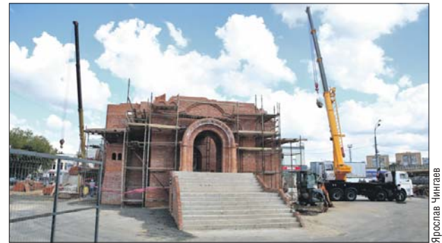
Пока снаружи идут строительные работы, внутри завершается отделка нижнего храма

Первую службу здесь провели в день Казанской иконы Божией Матери. Её возглавил управляющий Северо-Восточным и Юго-Восточным викари-