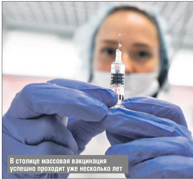
В столице массовая вакцинация успешно проходит уже несколько лет

— В прошлом году мы привили от гриппа около 7 миллионов москвичей — огромный объём, — рассказал он. — Это, кстати, возможно, нас спасло от каких-то ещё больших пиков заболеваемости этой весной, когда пришёл коронавирус. И в этом году