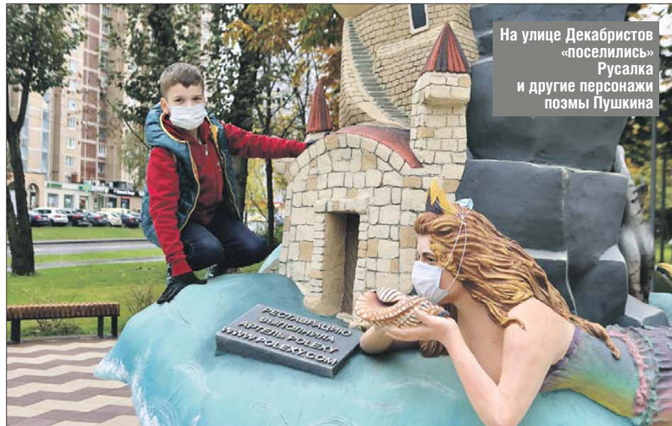
На улице Декабристов «поселились» Русалка и другие персонажи поэмы Пушкина

— Поэтому ваша команда — сотрудники префектуры, главы управ, депутаты — лично поздравляли ветеранов с Днём Победы?