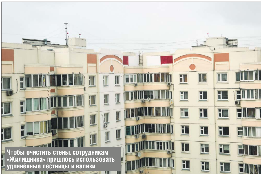
Чтобы очистить стены, сотрудникам «Жилищника» пришлось использовать удлинённые лестницы и валики

Чёрные изображения и надписи больше не портят облик здания