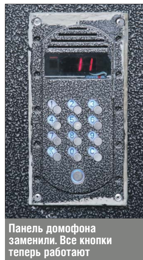
Панель домофона заменили. Все кнопки теперь работают

Сейчас запирающее устройство в подъезде дома 22 на улице Abramцевской исправно. Как сообщили в ГБУ «Жилищник района Лианозово», представители компании, об-