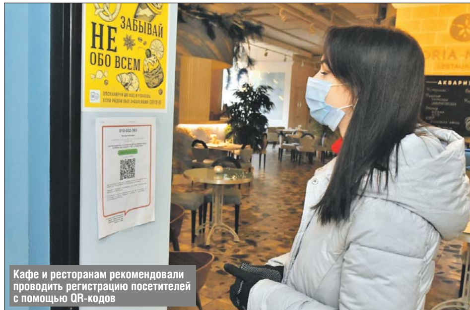
Кафе и ресторанам рекомендовали проводить регистрацию посетителей с помощью QR-кодов

— В этих условиях существующих мер противодействия коронавирусу становится недостаточно. Требуется ввести дополнительные ограничения, чтобы, насколько это возможно, разорвать цепочки передачи вируса и снизить уровень заболеваемости, — сообщил мэр Москвы.