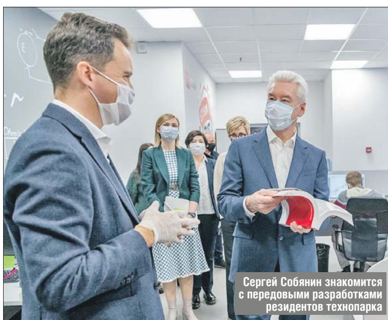
Сергей Собянин знакомится с передовыми разработками резидентов технопарка

Сегодня в технопарке работает ряд крупных предприятий — например, российский разработчик