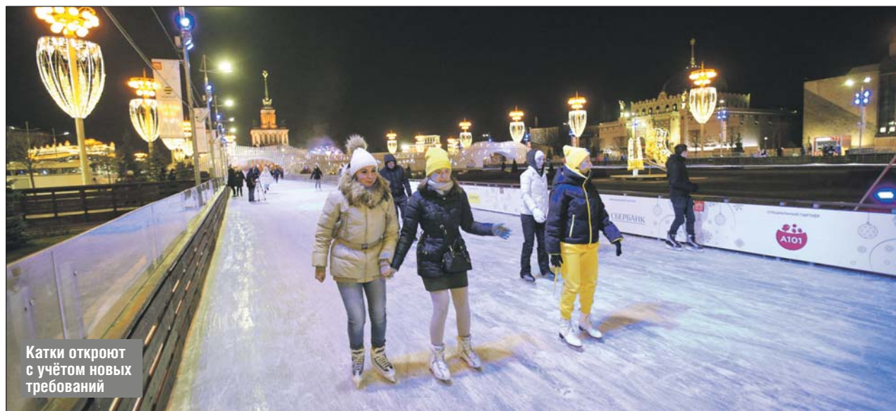
Катки откроют с учётом новых требований

Для получения медицинской помощи (например, для прохождения сеансов диализа, курсов химиотерапии и других видов лечения по неотложным показаниям) в течение дня записи к врачу социальная карта будет разблокирована. Если нужны продукты, то лучше