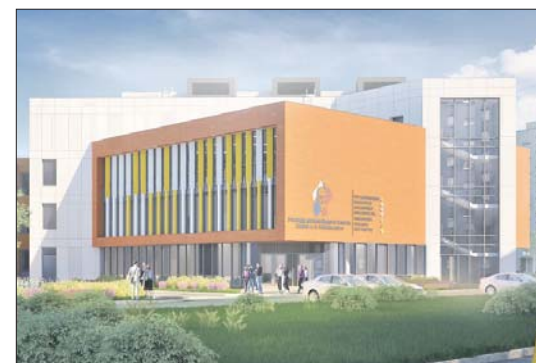
Здание станет частью учебного комплекса училища олимпийского резерва №4