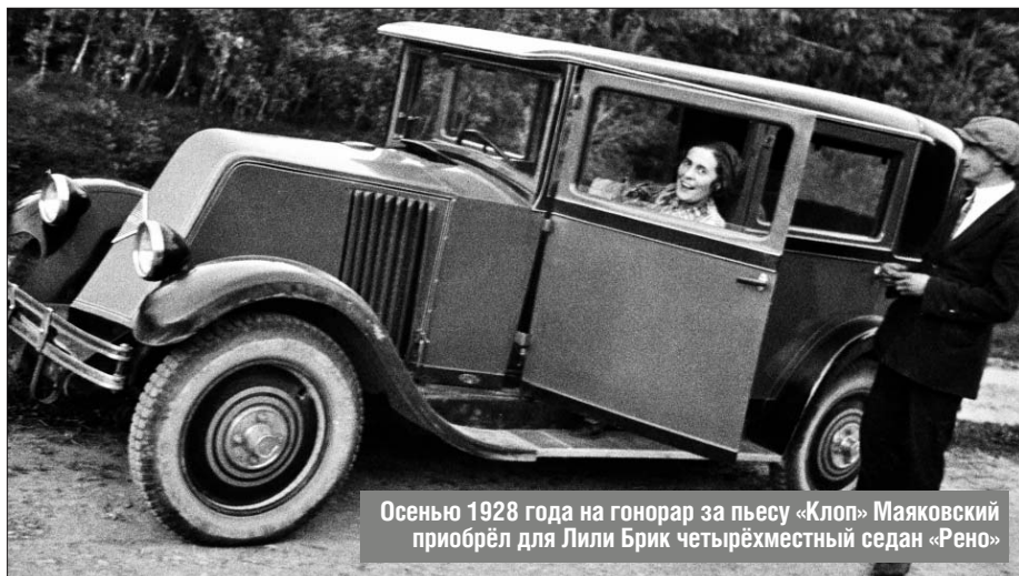
Осенью 1928 года на гонорар за пьесу «Клоп» Маяковский приобрёл для Лили Брик четырёхместный седан «Рено»

Среди наиболее интересных экспонатов — фургончик