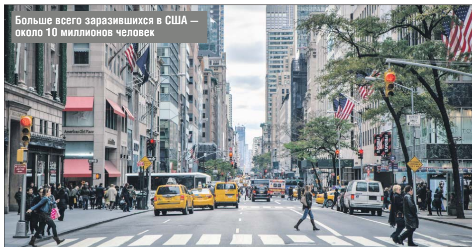
Больше всего заразившихся в США — около 10 миллионов человек

С начала пандемии в мире, по данным Университета Джонса Хопкинса, скончались 1,2 млн человек. По числу летальных исходов лидируют США — 237,1 тысячи, ещё