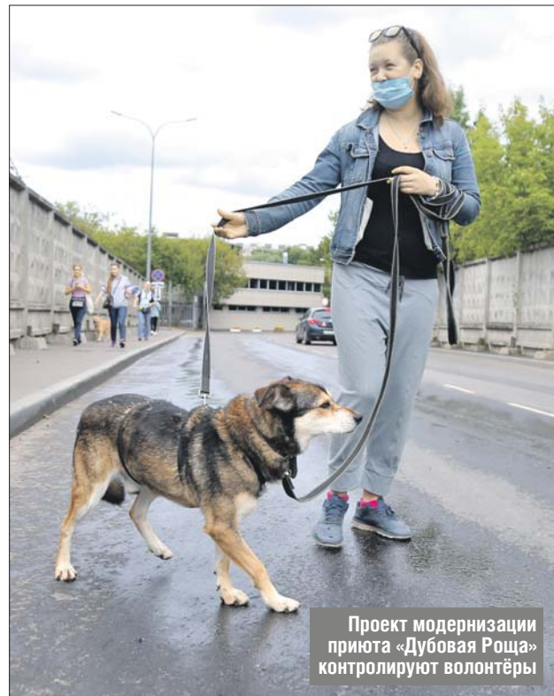
Проект модернизации приюта «Дубовая Роща» контролируют волонтеры

Полная версия интервью — на сайте газеты «Звёздный бульвар» zbulvar.ru