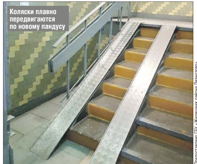
Коляски плавно передвигаются по новому пандусу

ГБУ «Жилищник района Лианозово»: ул. Новгородская, 32, тел./факс (499) 908-8079. Эл. почта: gbu_lia@svao.mos.ru