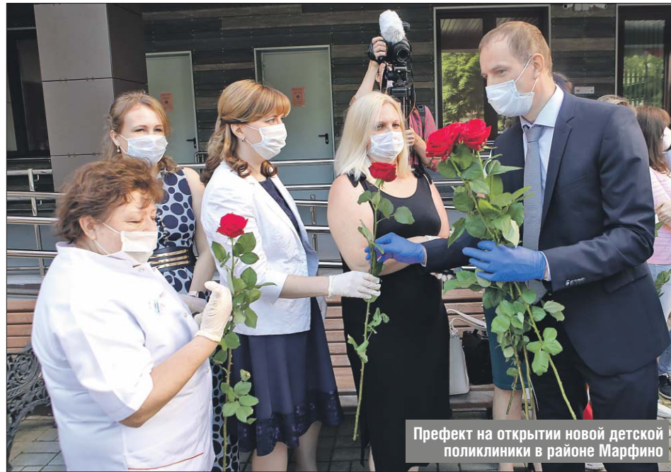
Префект на открытии новой детской поликлиники в районе Марфино

— В самом начале пандемии пришлось отказаться от ряда проектов благоустройства. Считаю, что мы правильно расставили приоритеты и, несмотря на трудности, сделали и «передали» обновлён-