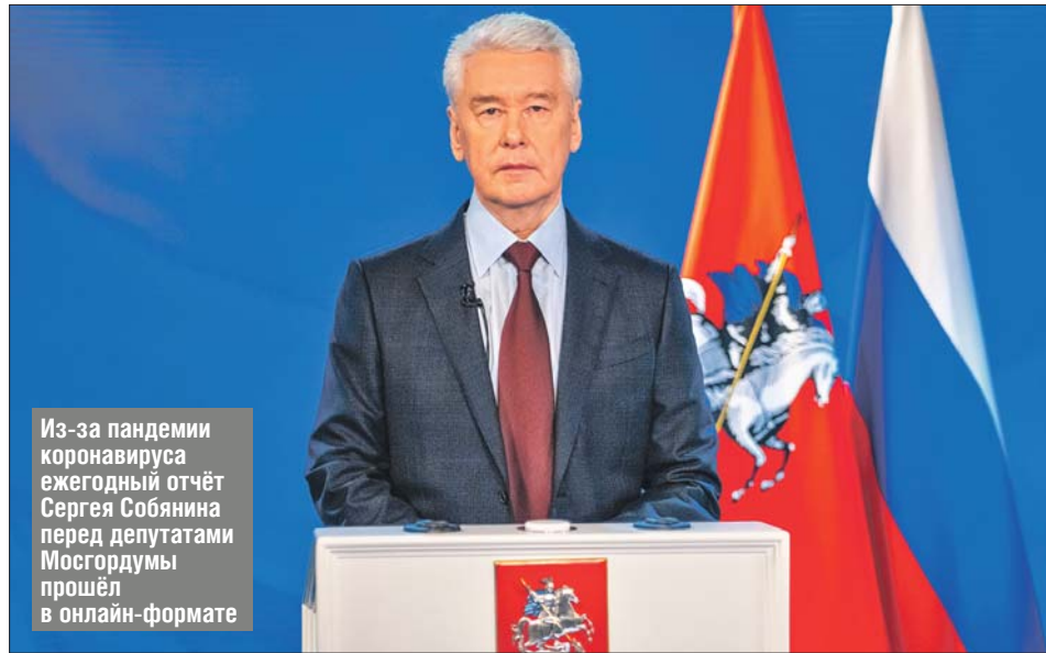
Из-за пандемии коронавируса ежегодный отчёт Сергея Собянина перед депутатами Мосгордумы прошёл в онлайн-формате

Пандемия стала серьёзным испытанием для системы го-