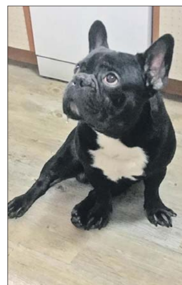
Любитель автобусных поездок бульдог Конор заставил поволноваться своих хозяев