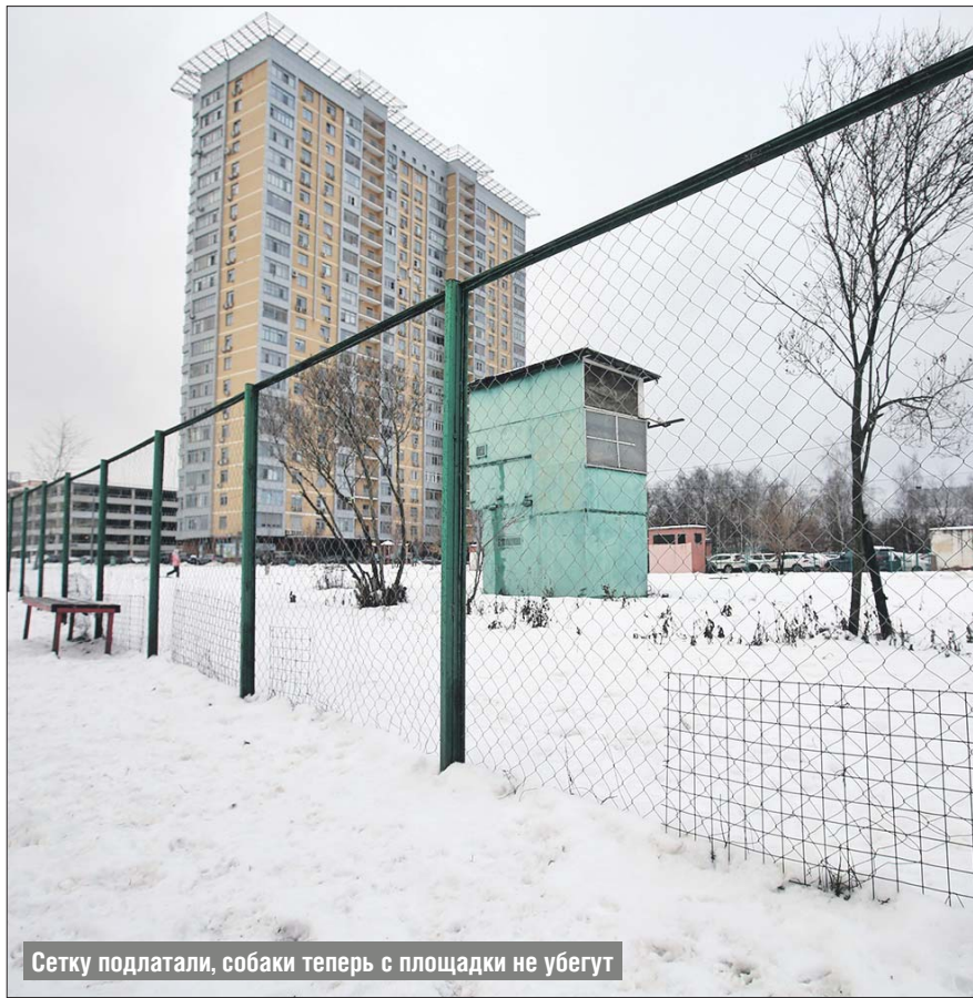
Сетку подлатали, собаки теперь с площадки не убегут

➤ ГБУ «Жилищник Алтуфьевского района»: ул. Стандартная, 3, тел. (499) 902-2220. Эл. почта: gbu.altuf@mail.ru