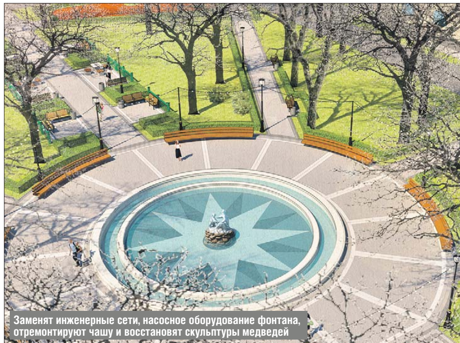
Заменяют инженерные сети, насосное оборудование фонтана, отремонтируют чашу и восстановят скульптуры медведей

— Проводимый на портале «Активный гражданин» опрос показал, что благоустройство в предложенном виде поддержали 70% жителей. Недавно МАРХИ — а именно его студенты делали этот двор полвека назад — дал оценку той концепции, которая позволит обновить территорию. Специалисты отметили, что проектиров-