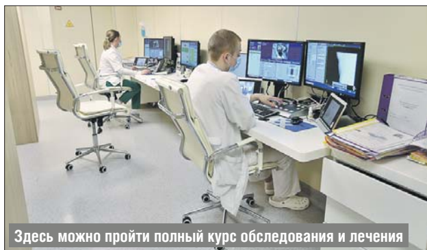
Здесь можно пройти полный курс обследования и лечения

Важно, что вскоре в здании онкоцентра заработает аптечный киоск. Здесь пациенты смогут получать все