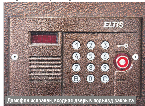
Домофон исправен, входная дверь в подъезд закрыта

— На входной двери подъезда 1 дома 1, корпус 1, на улице Широкой заменили блок вызова домофона. В настоящее время запирающее устройство исправно, домофон работает, входная дверь закрыта, — сооб-