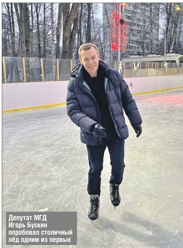
Депутат МГД Игорь Бускин опробовал столичный лёд одним из первых

— Катание на коньках на открытом воздухе — отличный вид активного зимнего отдыха, и при соблюдении ряда санитарных требований это достаточно безопасно, несмотря на пандемию коронавируса, — гово-