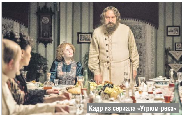
Кадр из сериала «Угрюм-река»