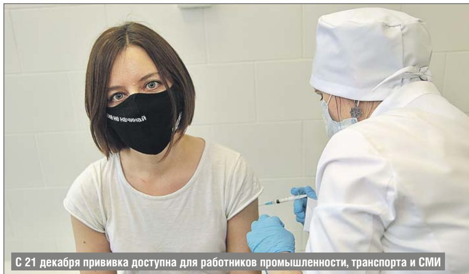
С 21 декабря прививка доступна для работников промышленности, транспорта и СМИ