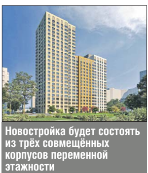
Новостройка будет состоять из трёх совмещённых корпусов переменной этажности

— Новостройка будет состоять из трёх совмещённых корпусов переменной этажности. Большая часть квартир — двухкомнатные. Мы с нетерпением ждали начала строительства. Ведь новые квартиры в этом доме