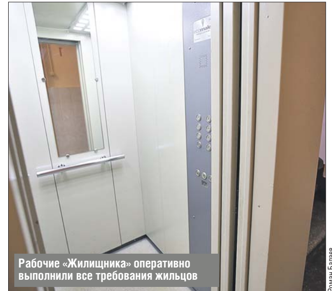
Рабочие «Жилищника» оперативно выполнили все требования жильцов