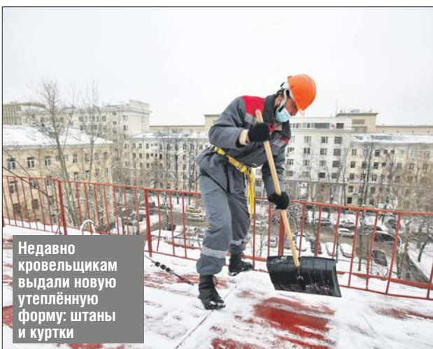
Недавно кровельщикам выдали новую утеплённую форму: штаны и куртки

нужно убирать снег с кровельных строений. Делать это бу-