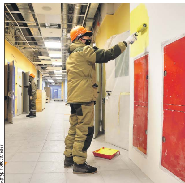
Открытие этой поликлиники жители Алексеевского района ждут уже несколько лет