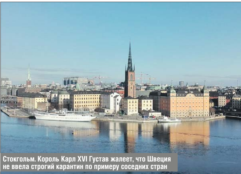
Стокгольм. Король Карл XVI Густав жалеет, что Швеция не ввела строгий карантин по примеру соседних стран

В мире вводят новые жёсткие ограничения из-за коронавируса