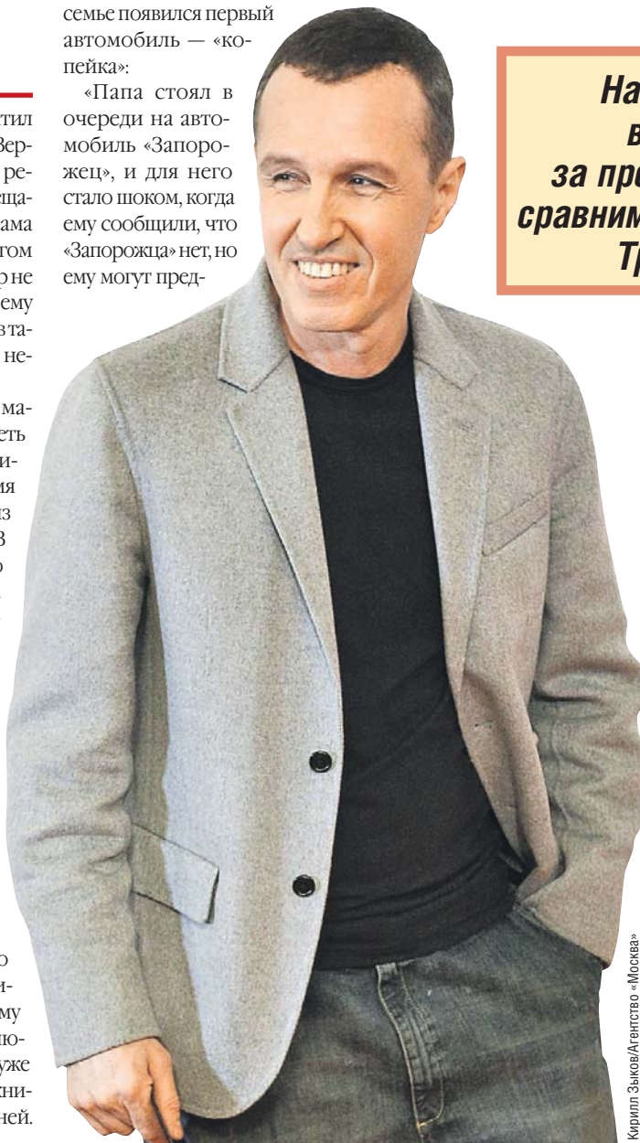
Кирилл Зыков/Агентство «Москва»