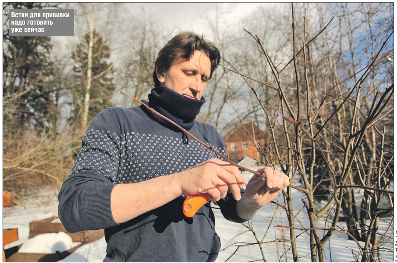
Ветки для прививки надо готовить уже сейчас

— На черенке и подвое делается косой срез длиной до 3 сантиметров. Затем, отступая треть от вершины среза — острый край, — делается рез вглубь черенка на оставшиеся две трети (вид сбоку на черенки напоминает латинскую букву Z. — Ред. ). Потом черенки соединяют друг с другом так, чтобы рез одного вошёл в рез другого. При этом на привитом черенке нужно оставить не более трёх почек. Место соединения можно замазать варом, лаком, бальзамом, живицей, потом замотать плёнкой или изолентой — липкой стороной наружу. Данный способ иде-