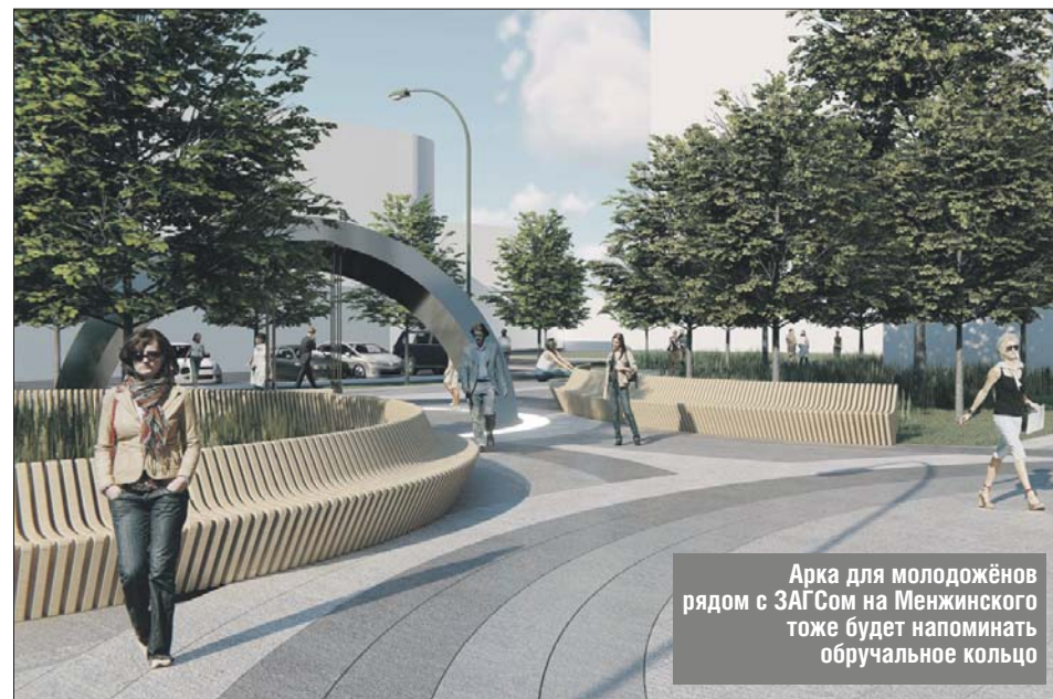
Арка для молодожёнов рядом с ЗАГСом на Менжинского тоже будет напоминать обручальное кольцо