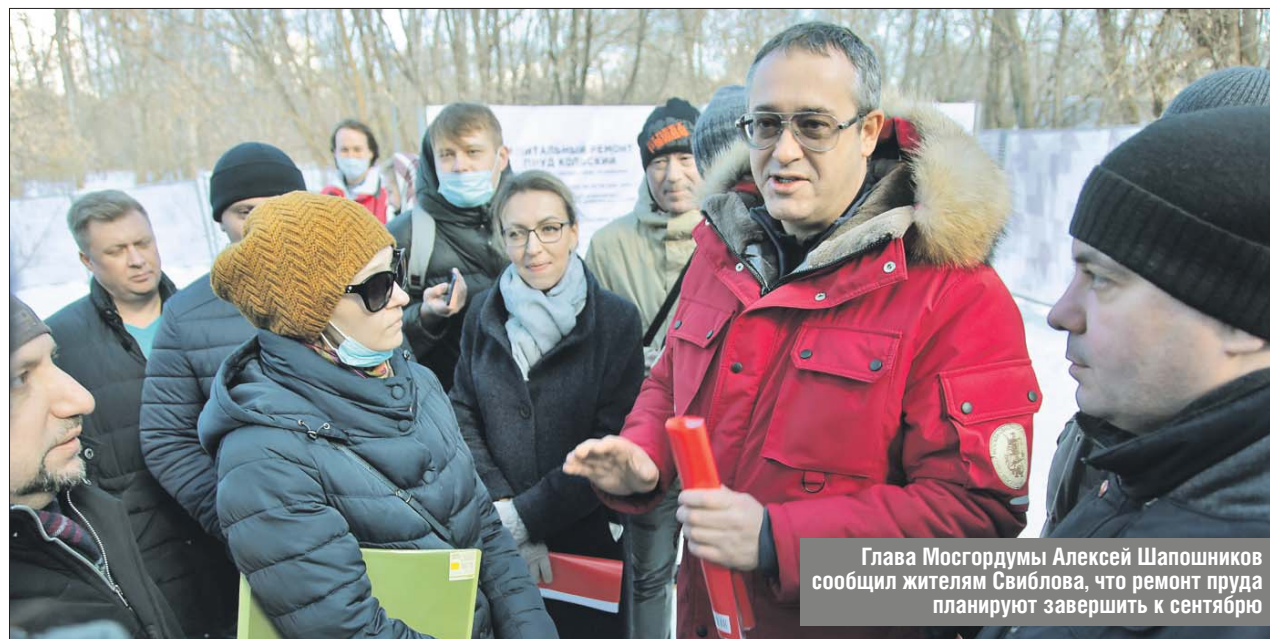
Глава Мосгордумы Алексей Шапошников сообщил жителям Свиблова, что ремонт пруда планируют завершить к сентябрю

Береговая линия Кольского пруда — бетонная. Сейчас в нескольких местах она разрушена. Одну часть берега вос-