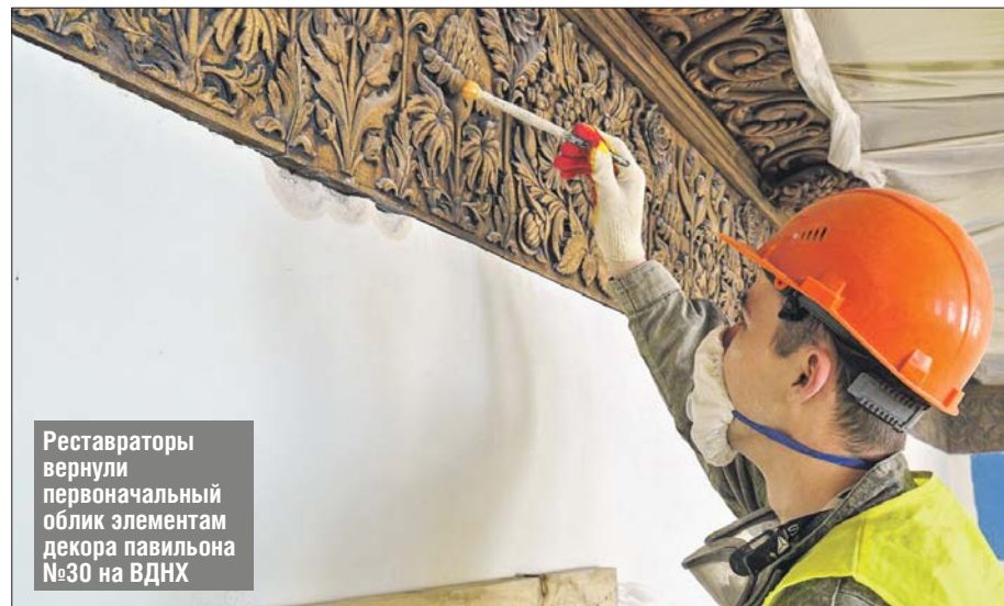
Реставраторы вернули первоначальный облик элементам декора павильона №30 на ВДНХ

Павильон №30 «Микробиологическая промышленность» пришлось восстанавливать буквально с фундамента. Его, как и стены, уже привели в порядок, недавно приступили к ин-