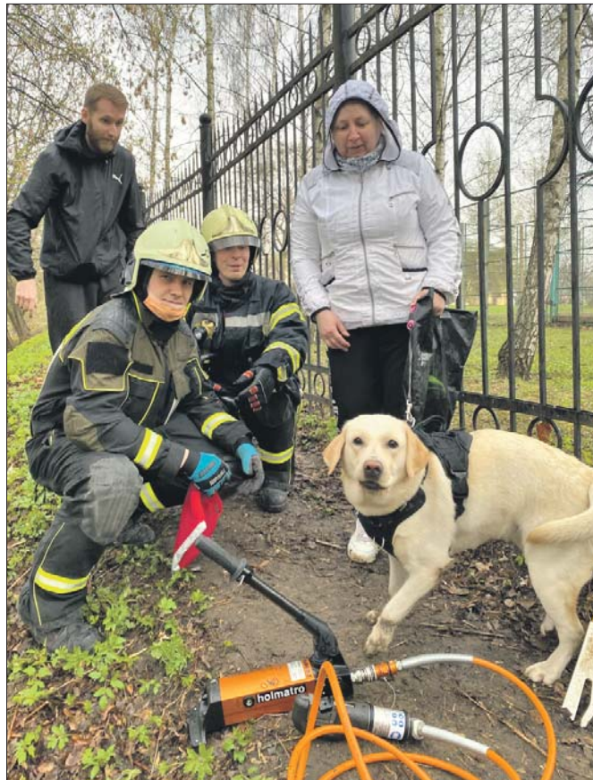
Пёс быстро оправился от потрясения, а радостные хозяева поблагодарили спасателей за освобождение своего любимца

Лабрадор быстро оправился от потрясения и, виляя хвостом, продолжил прогулку, а радостные хозяева