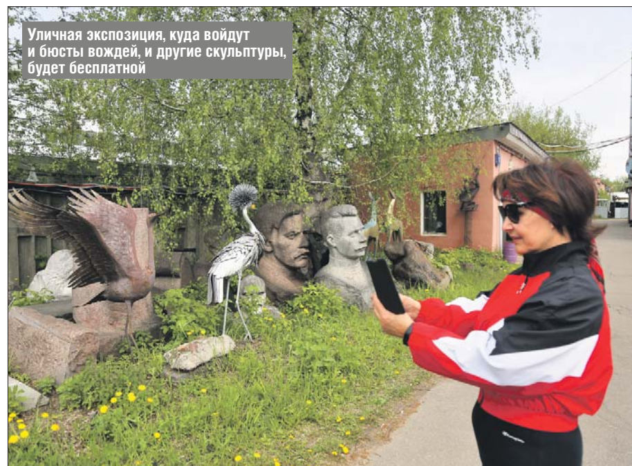
Уличная экспозиция, куда войдут и бюсты вождей, и другие скульптуры, будет бесплатной