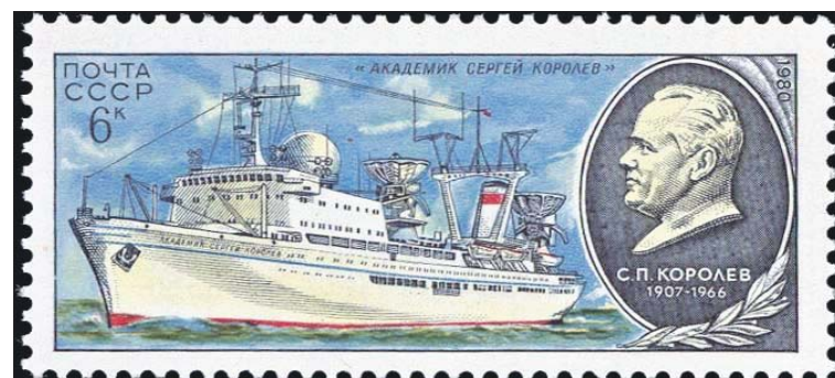
На почтовой марке выпуска 1980 года — научно-исследовательское судно «Академик Сергей Королёв». Основное назначение — обеспечение оперативного управления космическими аппаратами

По чистой случайности Сергей Павлович не попал на пароход, затонувший в Японском море