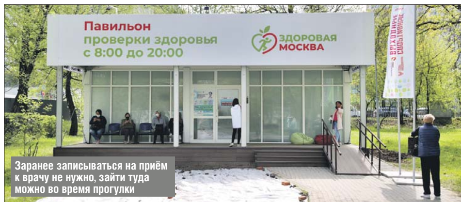
Заранее записываться на приём к врачу не нужно, зайти туда можно во время прогулки