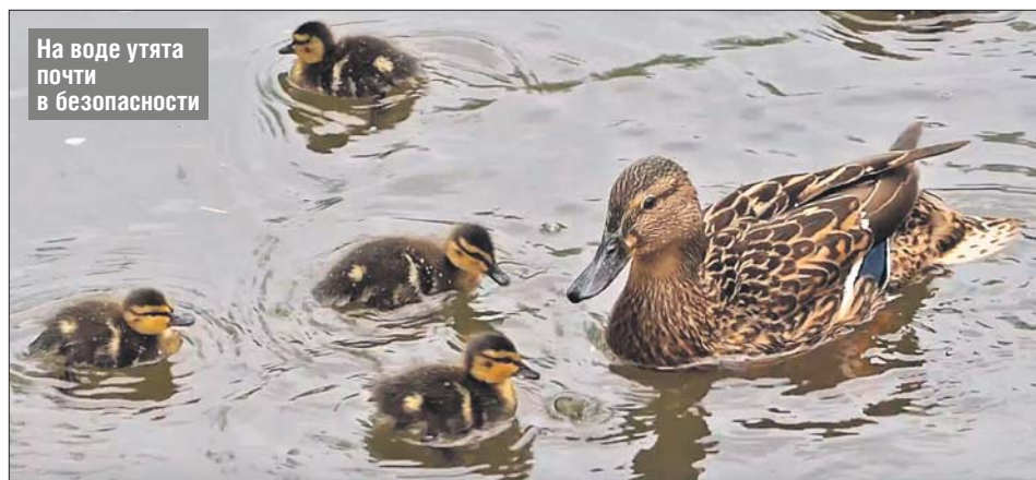
На воде утята почти в безопасности

Конечно, на воде утята почти в безопасности. Но если у взрослой птицы в основании