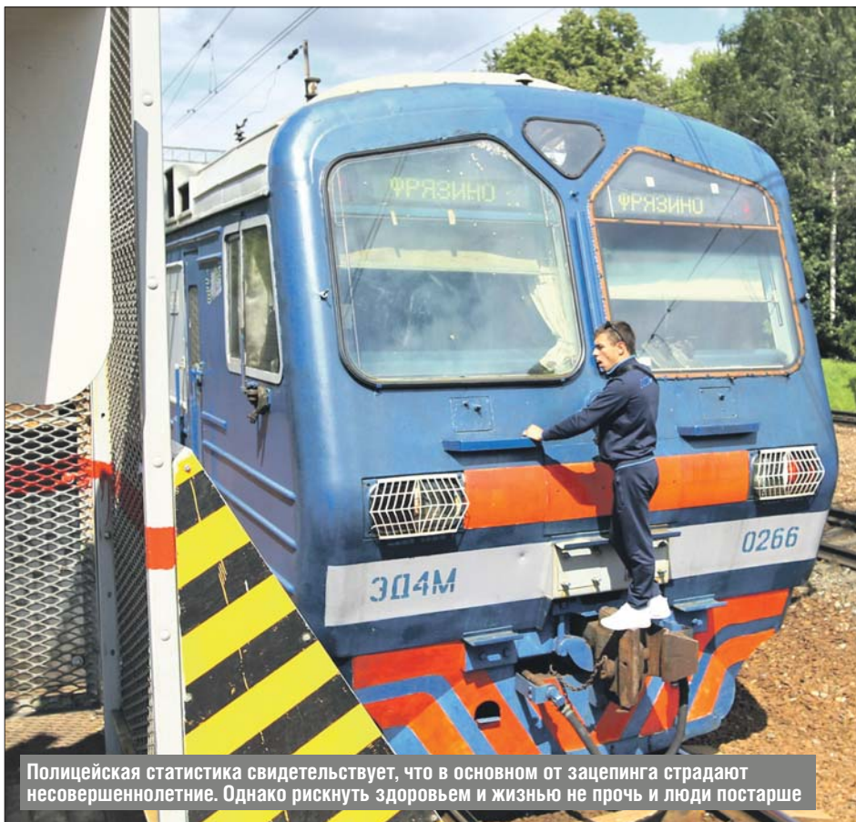
Полицейская статистика свидетельствует, что в основном от зацепинга страдают несовершеннолетние. Однако рискнуть здоровьем и жизнью не прочь и люди постарше

По словам майора Скачкова, на железной дороге Ярославского направления в 2020 году было травмировано немало подростков. 80% таких «по-