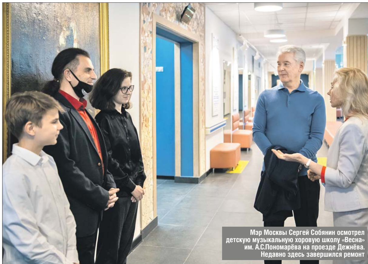
Мэр Москвы Сергей Собянин осматрел детскую музыкальную хоровую школу «Весна» им. А.С.Пономарёва на проезде Дежнёва. Недавно здесь завершился ремонт

Пока шли ремонтные работы, занятия не прекраща-