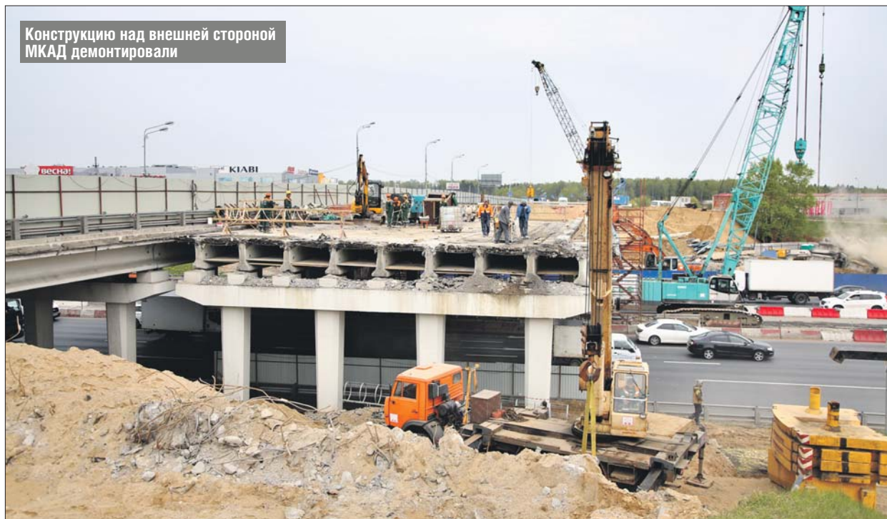
Конструкцию над внешней стороной МКАД демонтировали

Сейчас строители демонтируют правую часть моста, машины ездят по левой. Кон-