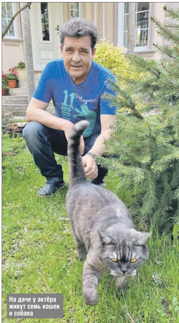
На даче у актёра живут семь кошек и собака