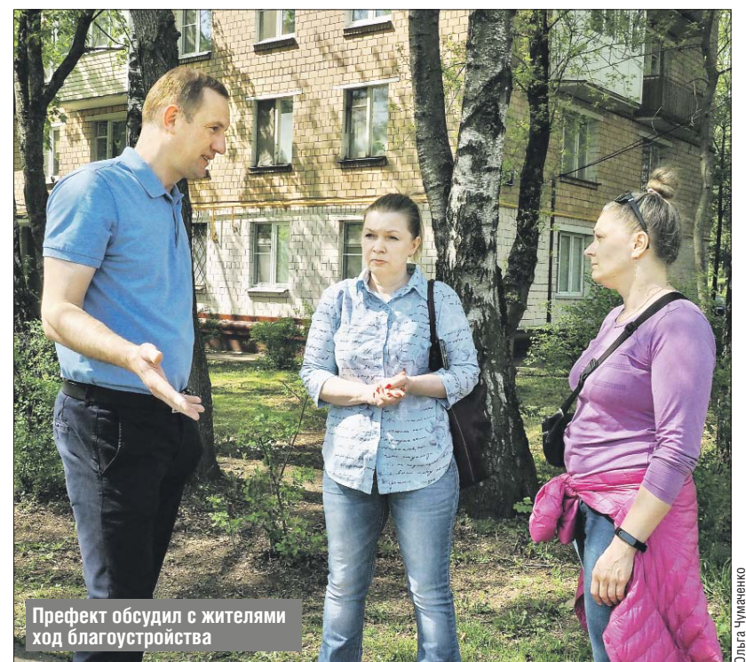
Префект обсудил с жителями ход благоустройства