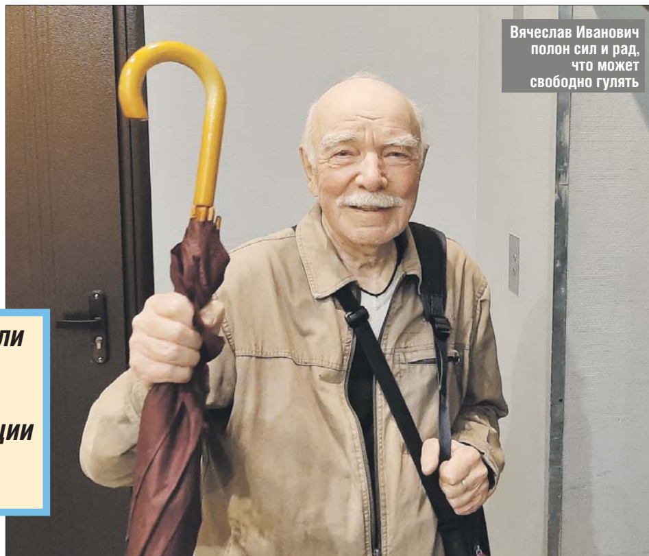
Вячеслав Иванович полон сил и рад, что может свободно гулять

Оба укола прошли гладко, ни малейшей негативной реакции организма не было