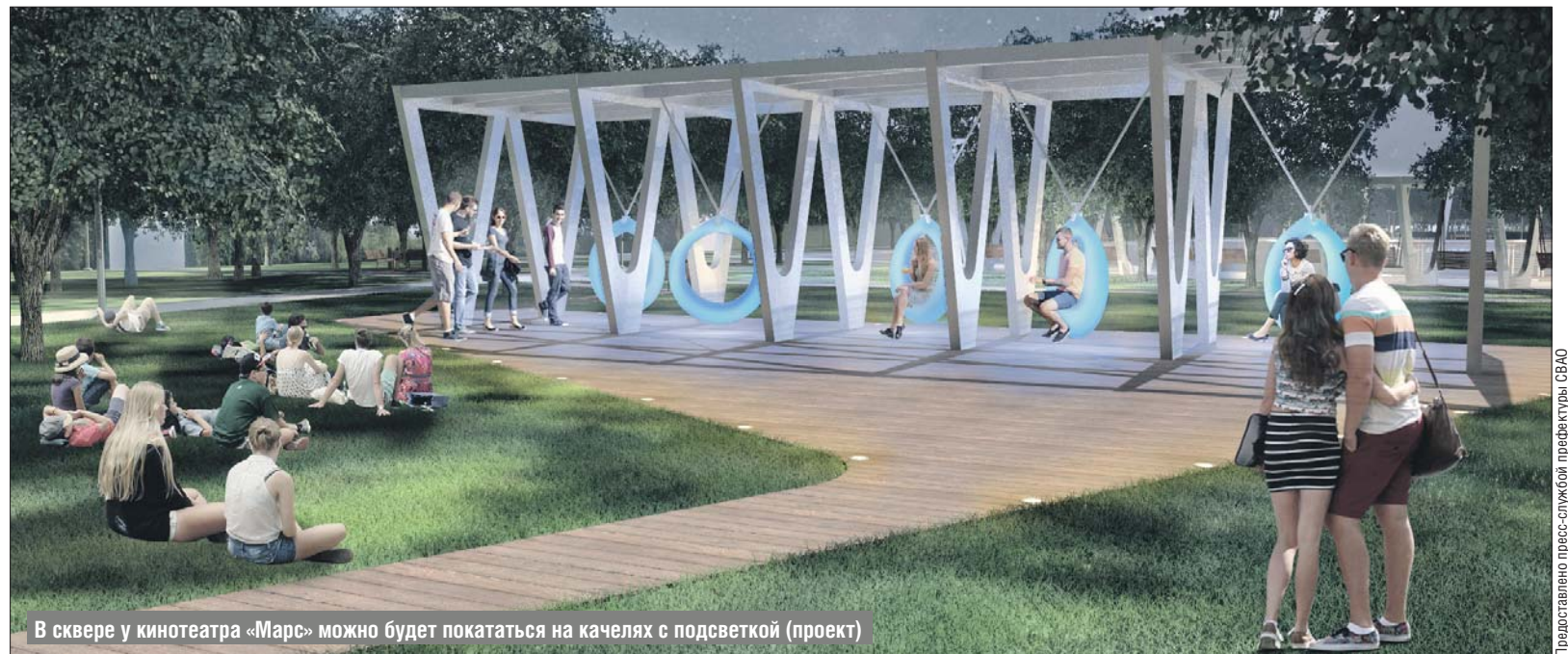
В сквере у кинотеатра «Марс» можно будет покататься на качелях с подсветкой (проект)

О благоустройстве в трёх районах округа рассказал на своём сайте мэр