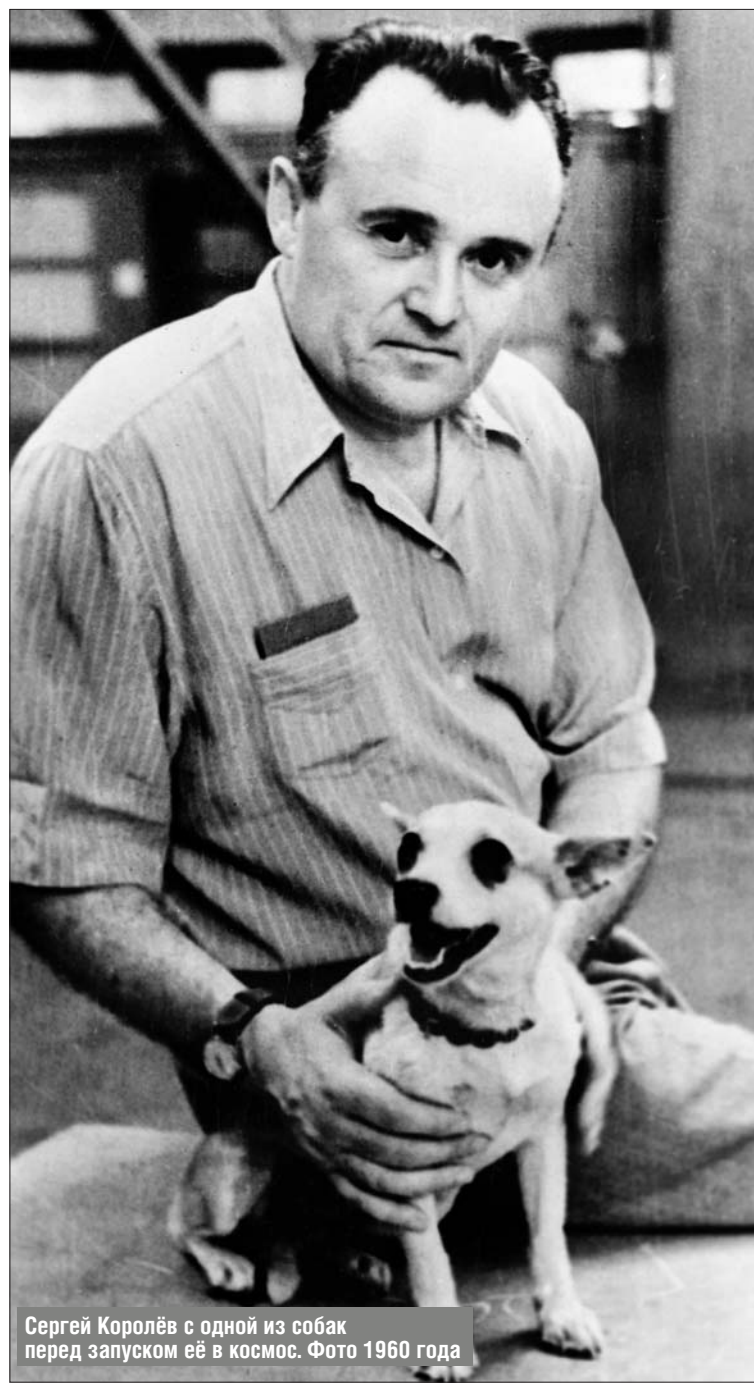
Сергей Королёв с одной из собак перед запуском её в космос. Фото 1960 года

Интерес к исторической личности пробудили почтовые марки