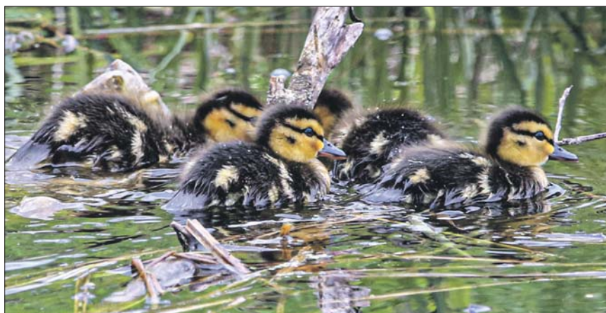
Пресс-служба ГПБУ «Мосприрода»

► Дирекция особо охраняемых территорий по СВАО Мосприроды: (499) 477-1197