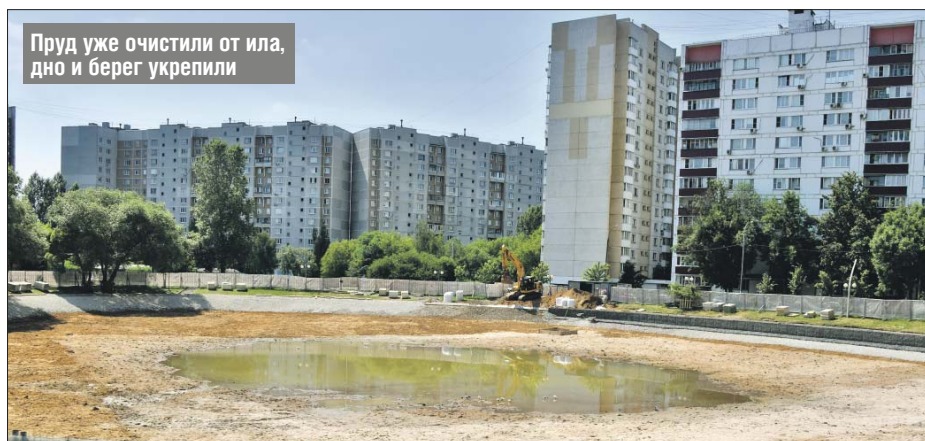
Пруд уже очистили от ила, дно и берег укрепили

Алексей Шапошников также побывал на Капустинском пруду в Свиблове. Ремонт здесь идёт полным ходом