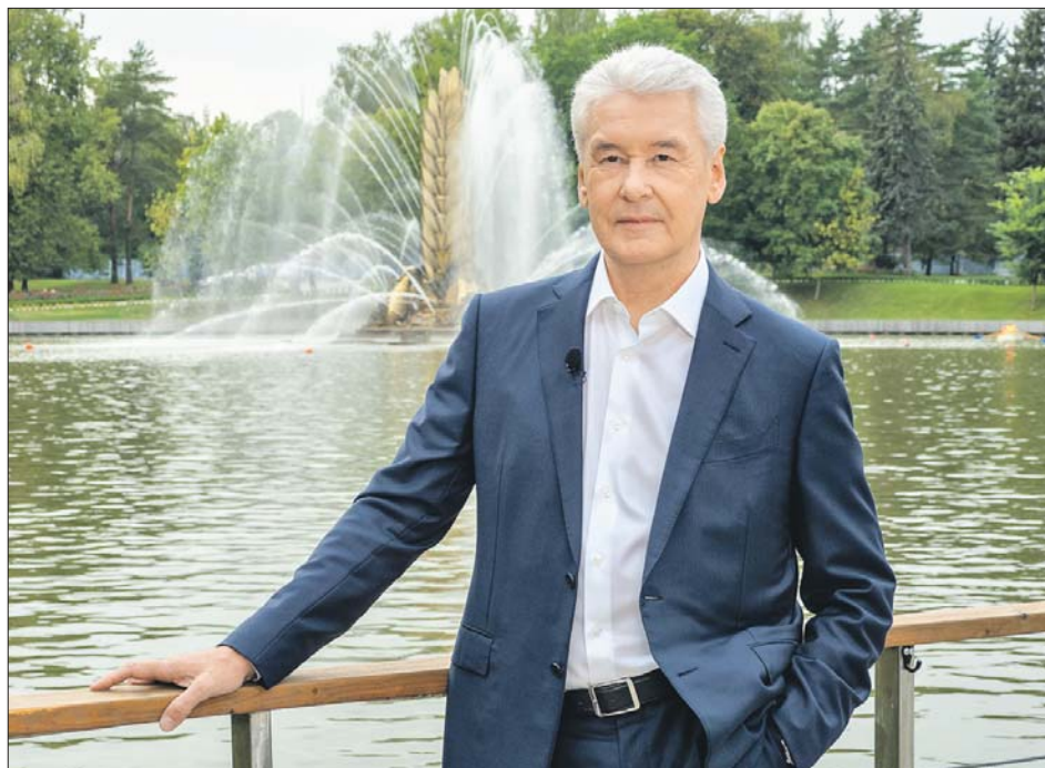
«Вместе мы сделаем Москву лучшим городом Земли для всех поколений москвичей!» — написал Сергей Собянин в своём блоге

сти для каждого москвича. За последние несколько лет в городе уже сделано в этом направлении немало. В частности, Москва обладает одной из самых удобных систем оплаты проезда с помощью универсальной карты «Тройка». Также столица России за-