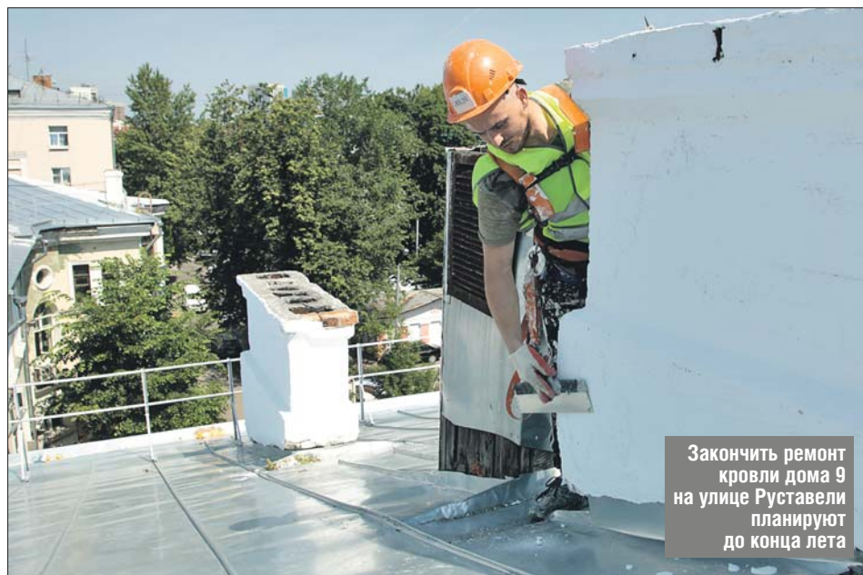
Закончить ремонт кровли дома 9 на улице Руставели планируют до конца лета

Мы заходим в один из подъездов, поднимаемся на чердак и заглядываем на крышу. Двое рабочих укладывают на кровлю листы металла. Оба — со страховкой. Начальник управления рассказывает, что ремонтируют скатную кровлю не всю сразу, а частями.