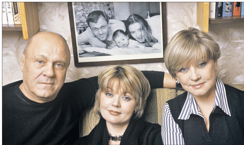
«У меня любящая жена, надёжная семья, успешная дочь», — говорил Владимир Меньшов. На фото с дочерью Юлией Меньшовой и женой Верой Алентовой