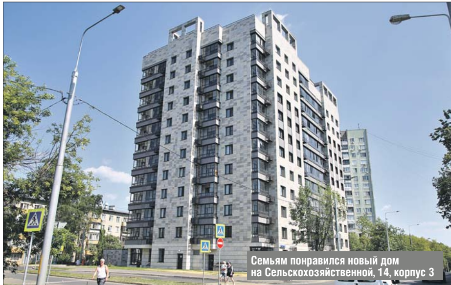
Семьям понравился новый дом на Сельскохозяйственной, 14, корпус 3

— Конечно, есть. У нас девять уличных спортплощадок и пять стандартных хоккейных коробок во дворах. Но это ещё не всё. Наши жители могут кататься на коньках круглый год в районе два