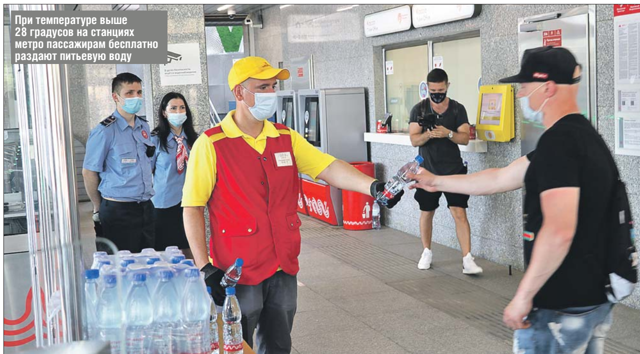
При температуре выше 28 градусов на станциях метро пассажирам бесплатно раздают питьевую воду

неё в центр, а потом пересел на «серую» ветку. За день самая низкая температура была на «Новослободской»: +25 градусов. Жарче всего