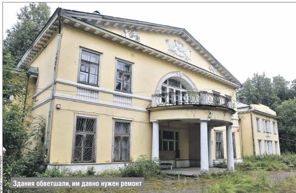
Здания обветшали, им давно нужен ремонт