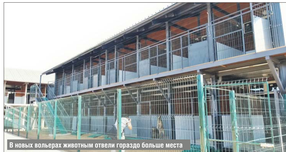
В новых вольерах животным отвели гораздо больше места

вич-панелями. На пол уложена плитка. Вольеры состоят из двух помещений: внутреннего и внешнего. Собаки могут свободно переходить туда, где им в данный момент комфортнее, через специальный лаз, который прикрыт клапаном для