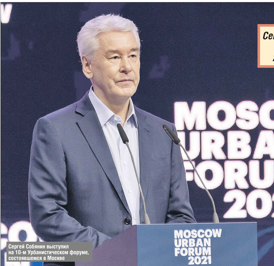
Сергей Собянин выступил на 10-м Урбанистическом форуме, состоявшемся в Москве