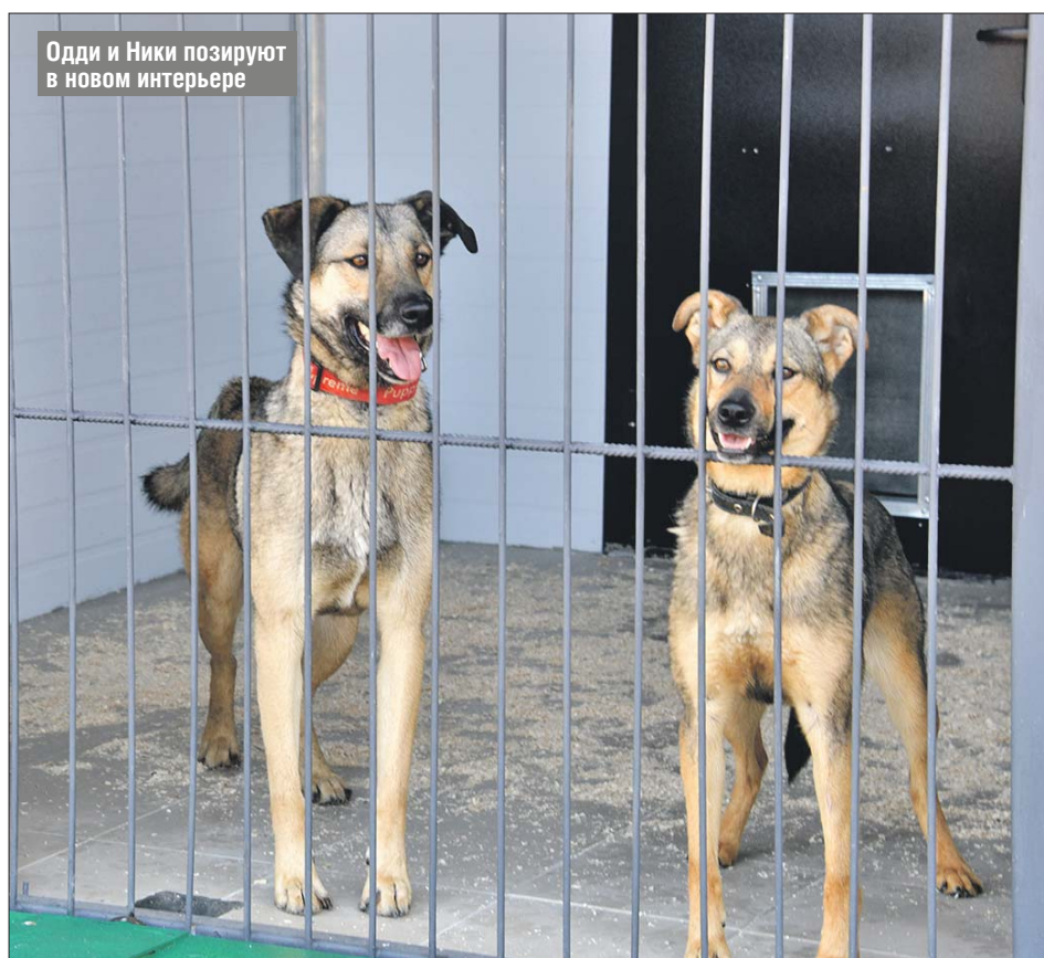
Одди и Ники позируют в новом интерьере

Стены вольеров облицованы теплоизолирующими сэнд-