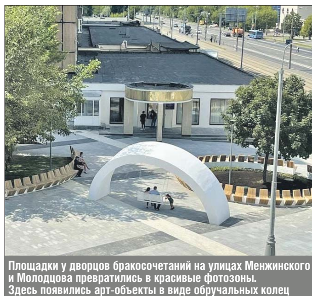
Площадки у дворцов бракосочетаний на улицах Менжинского и Молодцова превратились в красивые фотозоны. Здесь появились арт-объекты в виде обручальных колец