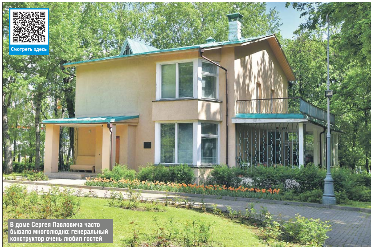
В доме Сергея Павловича часто бывало многолюдно: генеральный конструктор очень любил гостей

Дальше маршрут идёт к набережной Останкинского пруда. Там находится памятник Владимиру Зворыкину —