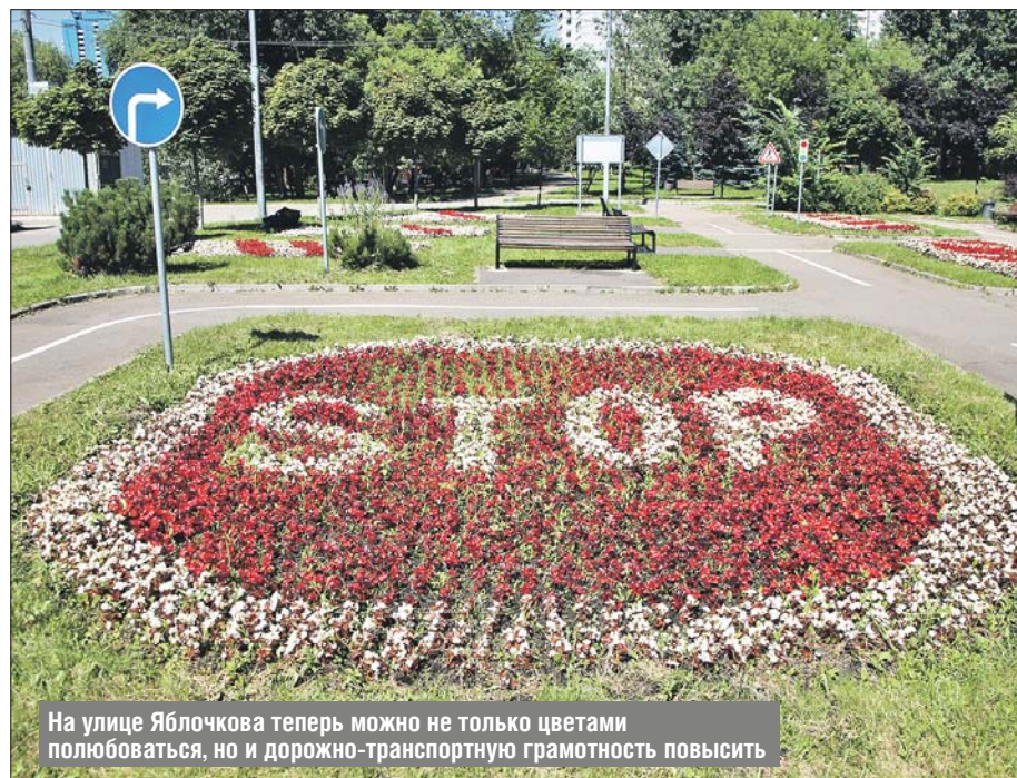
На улице Яблочкова теперь можно не только цветами полюбоваться, но и дорожно-транспортную грамотность повысить