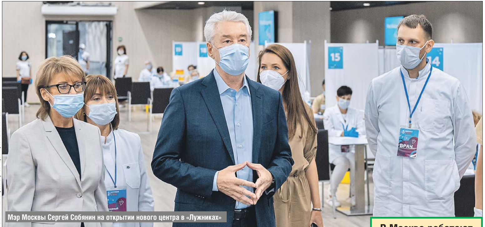
Мэр Москвы Сергей Собянин на открытии нового центра в «Лужниках»