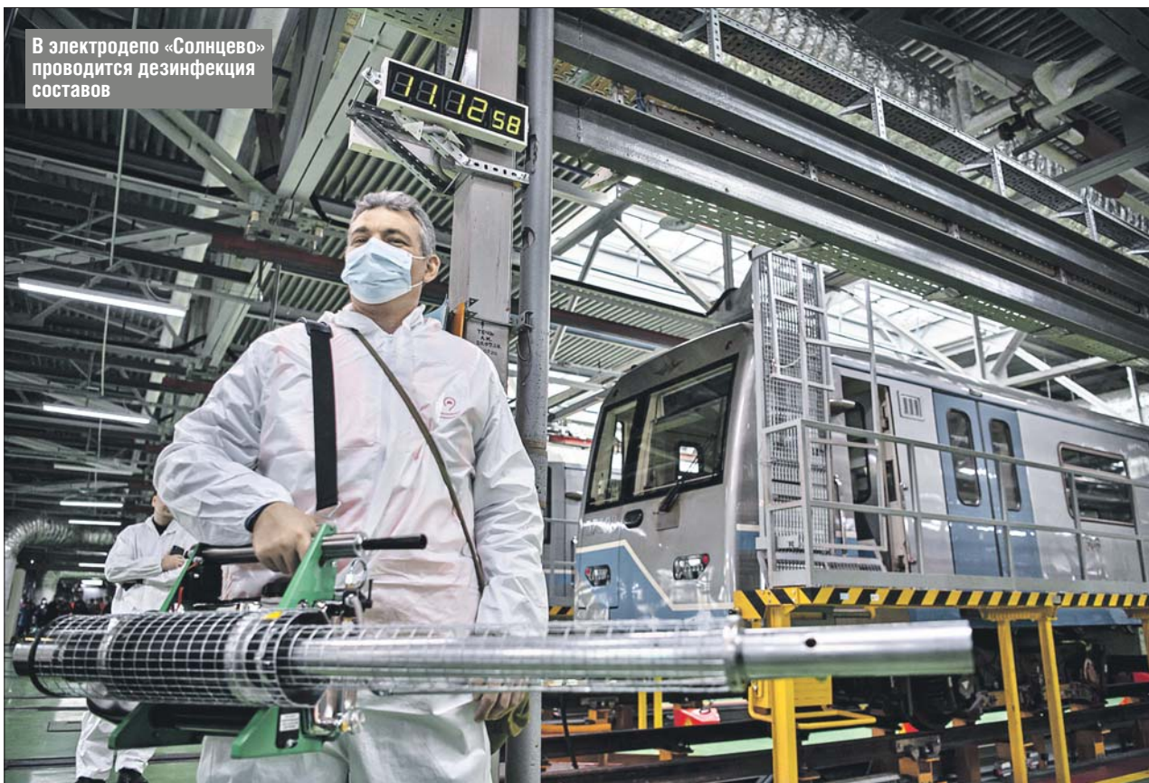
В электродепо «Солнцево» проводится дезинфекция составов

Ежедневно обрабатывают 6 тысяч вагонов метро