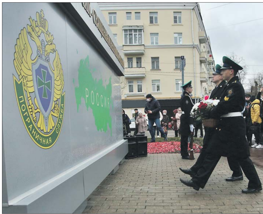
Стелу, посвящённую выдающимся выпускникам Московского пограничного института ФСБ России, открыли на пересечении улиц Искры и Лётчика Бабушкина

Теперь о героях, учившихся на Осташковской улице, будет знать больше людей, ведь ин-