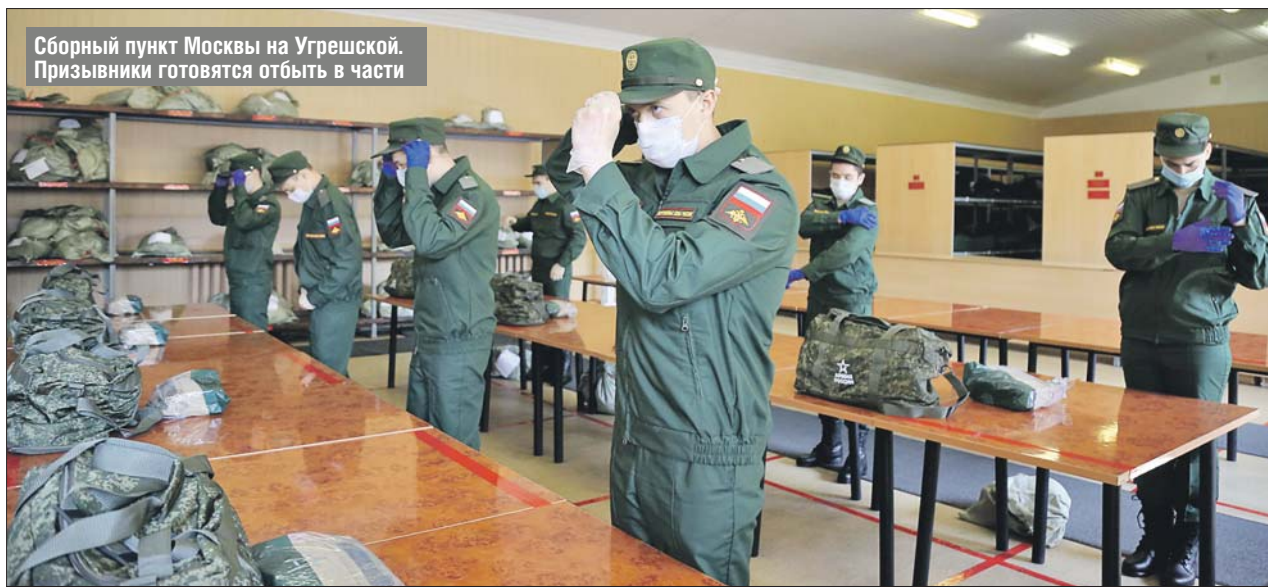
Сборный пункт Москвы на Угрешской. Призывники готовятся отбыть в части

В научные роты в каждый призыв направляют около 100 москвичей