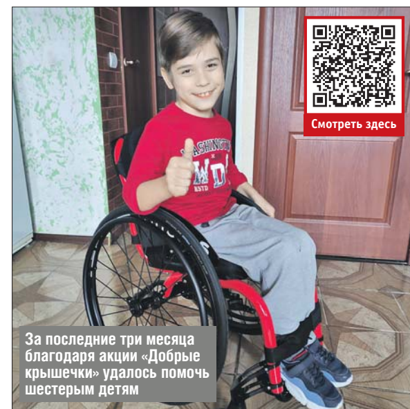
За последние три месяца благодаря акции «Добрые крышечки» удалось помочь шестерым детям

И В СВАО больше десятка пунктов приёма «добрых» крышечек. Принести пластик можно, например, по адресам: ул. Лескова, 19а, стр. 2; Ярославское ш., 2, корп. 2; ул. Абрамцевская, 24. Внимание! Крышечки должны быть чистыми