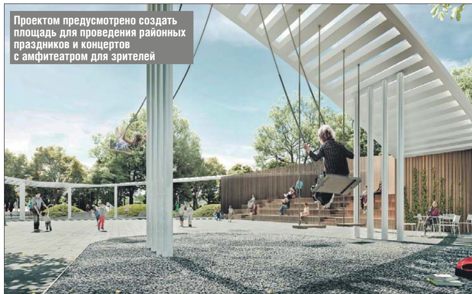
Проектом предусмотрено создать площадку для проведения районных праздников и концертов с амфитеатром для зрителей