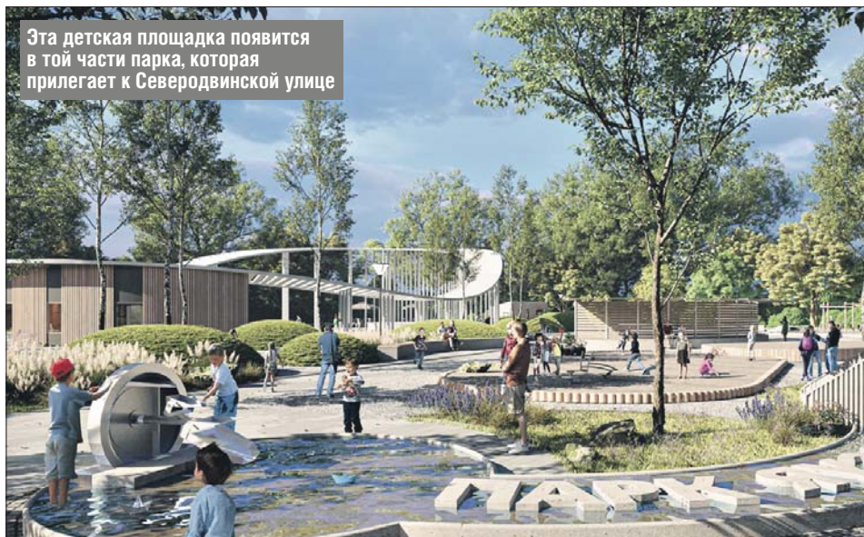
Эта детская площадка появится в той части парка, которая прилегает к Северодвинской улице