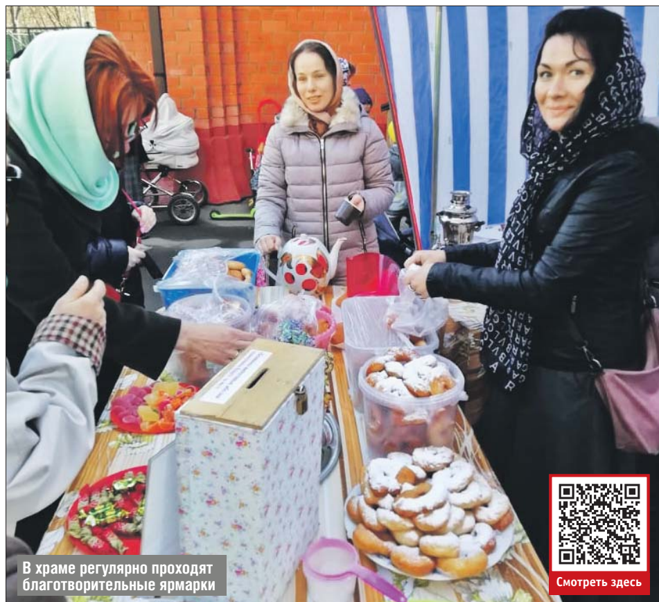
В храме регулярно проходят благотворительные ярмарки

Волонтеры берут на личное попечение одиноких прихожан — стариков и инвалидов. Помогают с уборкой и приготовлением еды, приносят лекарства и продукты. Не все имеют возможность что-то