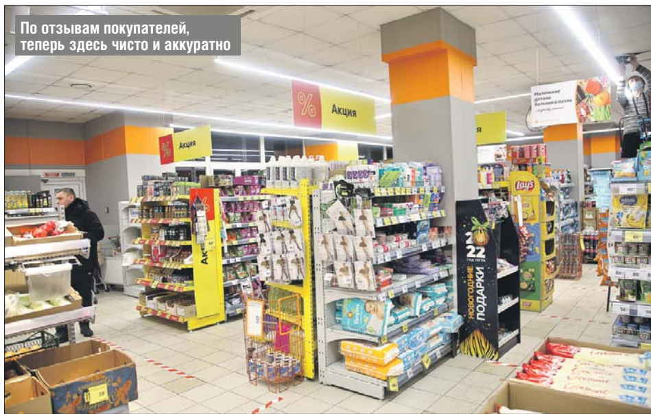
По отзывам покупателей, теперь здесь чисто и аккуратно

В магазине провели ремонт после вмешательства Роспотребнадзора