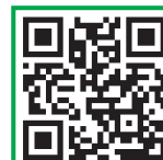
Все новости района: «Марфино»

В японском саду Главного ботанического сада им. Н.В. Цицина установлены и конструкции, которые в Японии по традиции защищают деревья от снега. Они состоят из бамбуковых шестов и джутовых веревок. Об этом сообщает газета «Марфино».