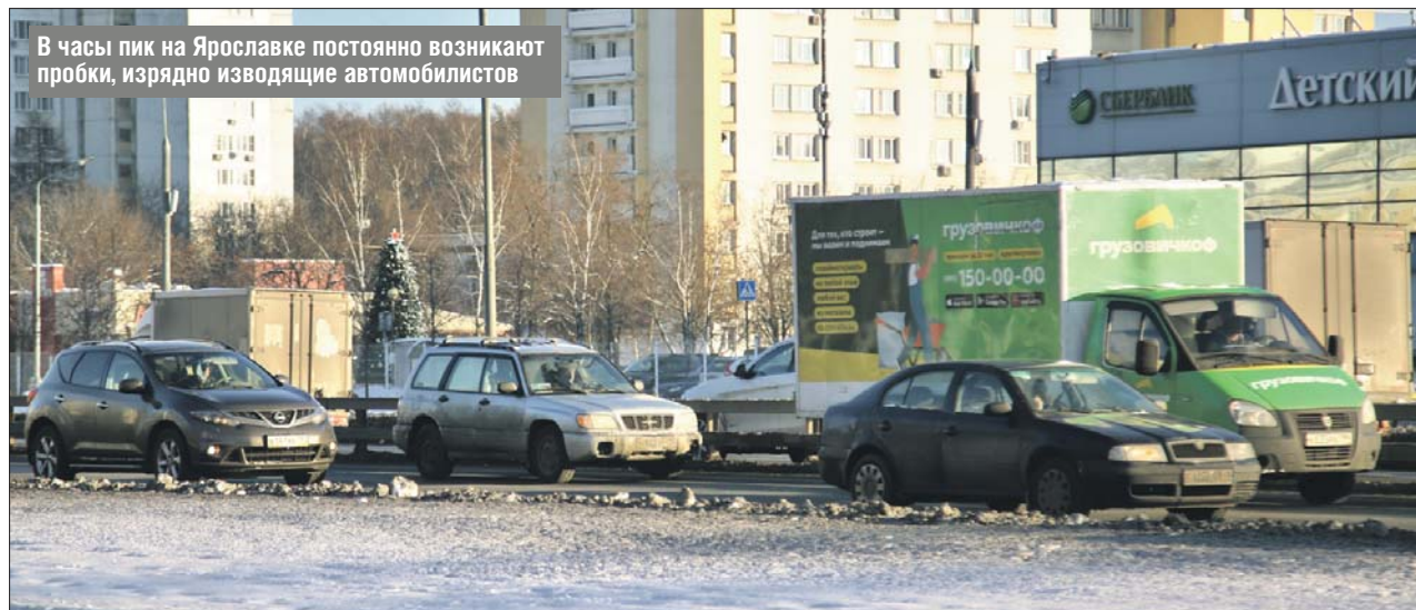
В часы пик на Ярославке постоянно возникают пробки, изрядно изводящие автомобилистов

После открытия путепроводов появятся альтернативные маршруты между районами