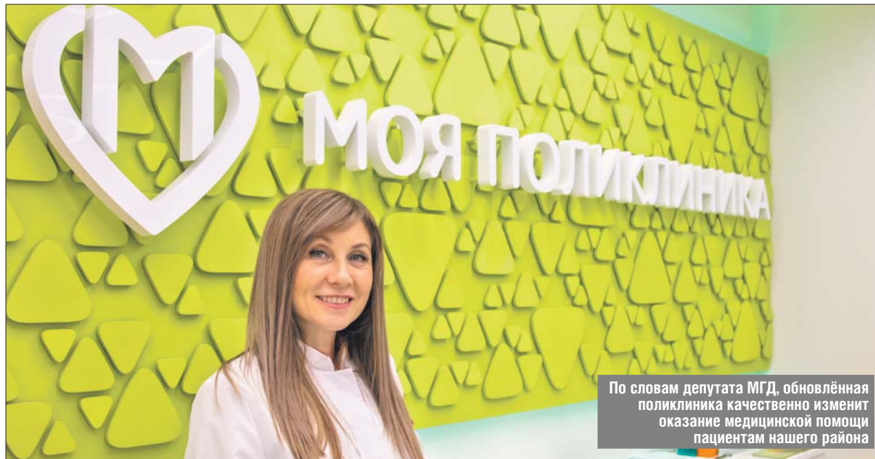
По словам депутата МГД, обновлённая поликлиника качественно изменит оказание медицинской помощи пациентам нашего района

Она напомнила, что это уже третий объект в избирательном округе, где будет начат ремонт по новому стандарту: первым был обновлён филиал №2 детской поликлиники на Новгородской улице; кроме того, ремонтные работы ведутся в филиале диагностического центра №5 на ул. Корнейчука, 28. Теперь очередь филиала на ул. Лескова, 22а. Трёхэтажное зда-