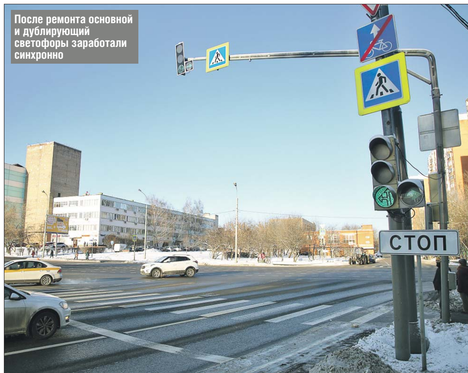
После ремонта основной и дублирующий светофоры заработали синхронно

За организацией дорожного движения, в том числе и за работой светофоров, следят сотрудники Центра органи-