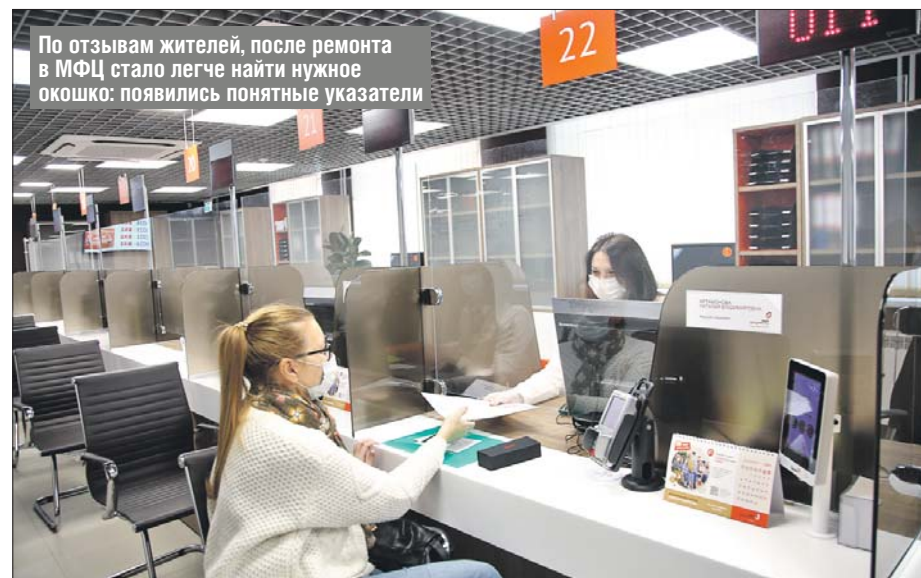
По отзывам жителей, после ремонта в МФЦ стало легче найти нужное окошко: появились понятные указатели