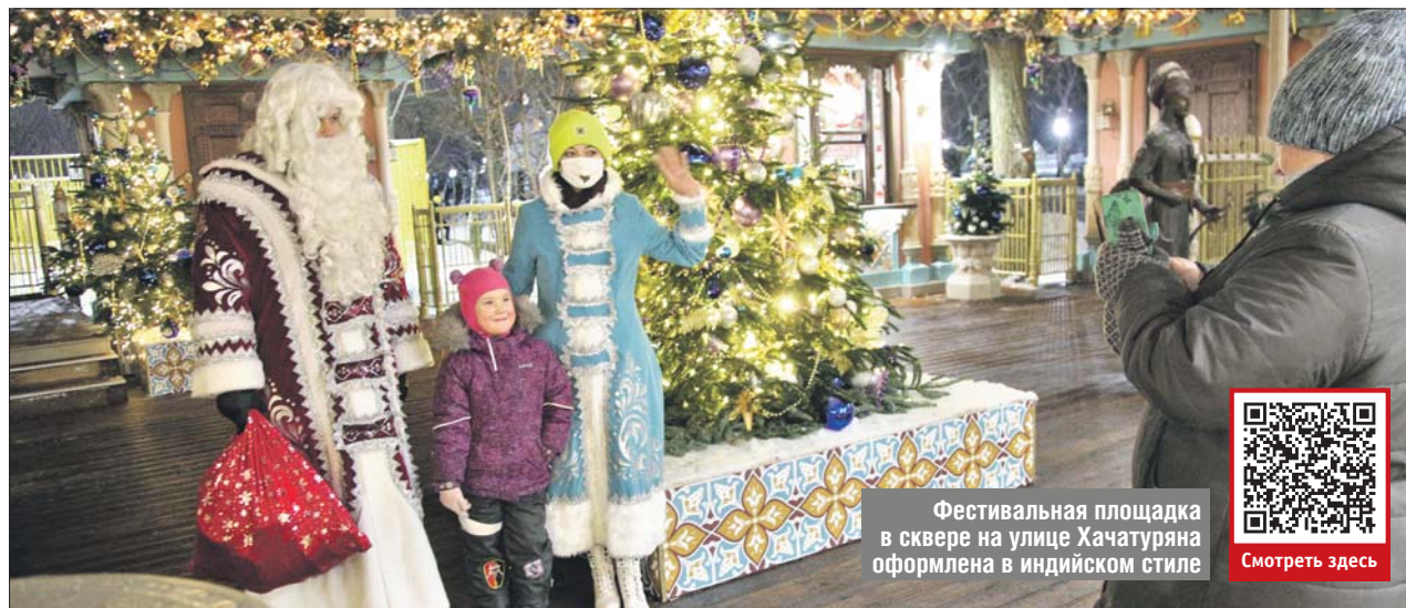
Фестивальная площадка в сквере на улице Хачатуряна оформлена в индийском стиле

Одна из фестивальных площадок заработала в Отрадном, в сквере на улице Хачатуряна. Она оформлена в индийском стиле. Гости фестиваля приветствуют скульптура Ганеши — божества с головой слона и четырьмя руками. В украшении главной ёлки использованы индийские орнаменты, перья, стилизованные лепестки лотоса, индийские фонарики. В общей сложности площадку украшают около 60 ёлочек разной высоты. Будет работать ярмарка, на которой можно приобрести сувениры и полакомиться традиционными индийскими кушаньями, например отвежать чай масала, плов с изюмом и кешью, кукурузу, приготовленную на гриле. — Как только выходим погу-