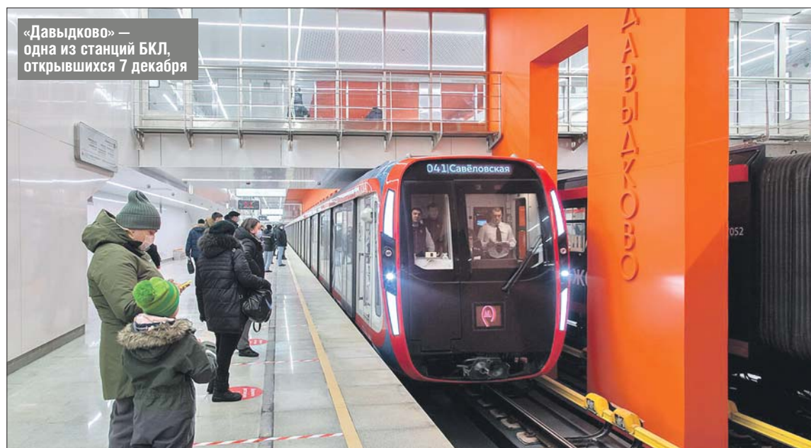
«Давыдково» — одна из станций БКЛ, открывшихся 7 декабря