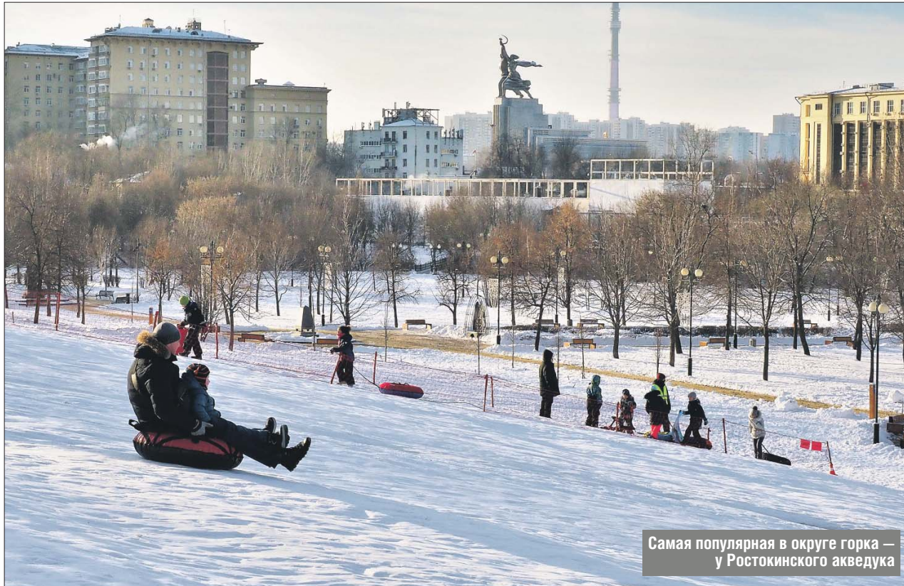
Самая популярная в округе горка — у Ростокинского акведука