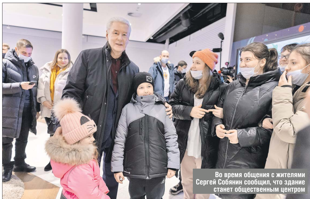
Во время общения с жителями Сергей Собянин сообщил, что здание станет общественным центром