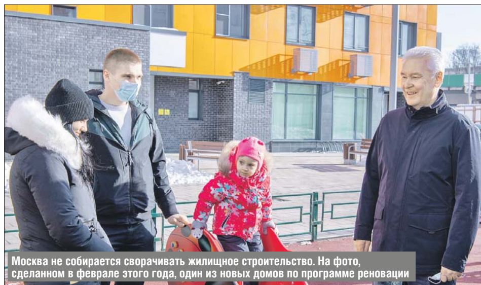
Москва не собирается сворачивать жилищное строительство. На фото, сделанном в феврале этого года, один из новых домов по программе реновации

ракта общей суммой более чем на 40 миллиардов рублей, — пояснил мэр.