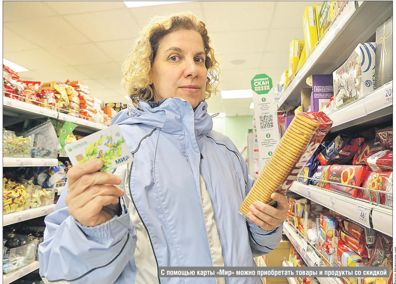
С помощью карты «Мир» можно приобретать товары и продукты со скидкой

После оформления карты её нужно зарегистрировать