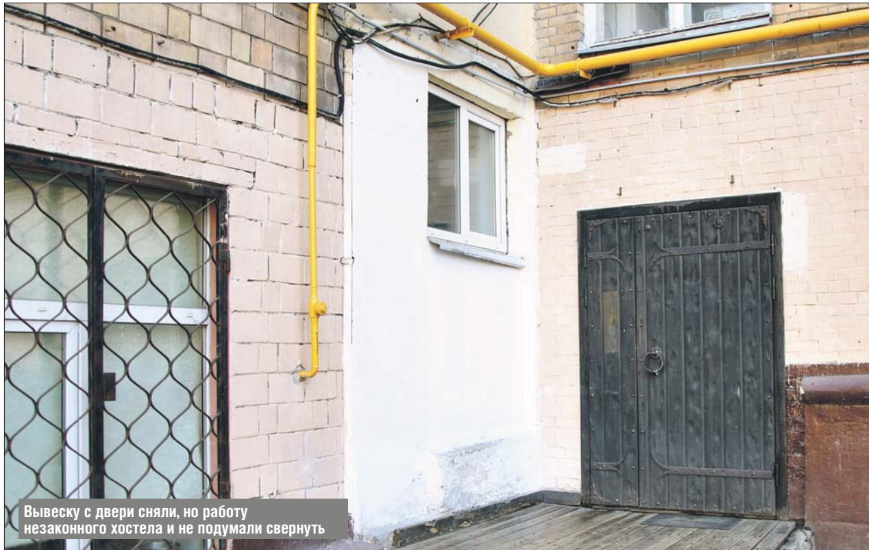
Вывеску с двери сняли, но работу незаконного хостела и не подумали свернуть

По его словам, аналогичное обращение отправили и в Госинспекцию по недвижимости. Именно это контрольное ведомство официально установило, что хостел размещён в доме незаконно.