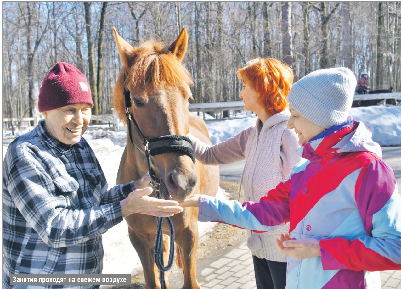
Занятия проходят на свежем воздухе

В нашем округе открылись новые кружки проекта «Московское долголетие»