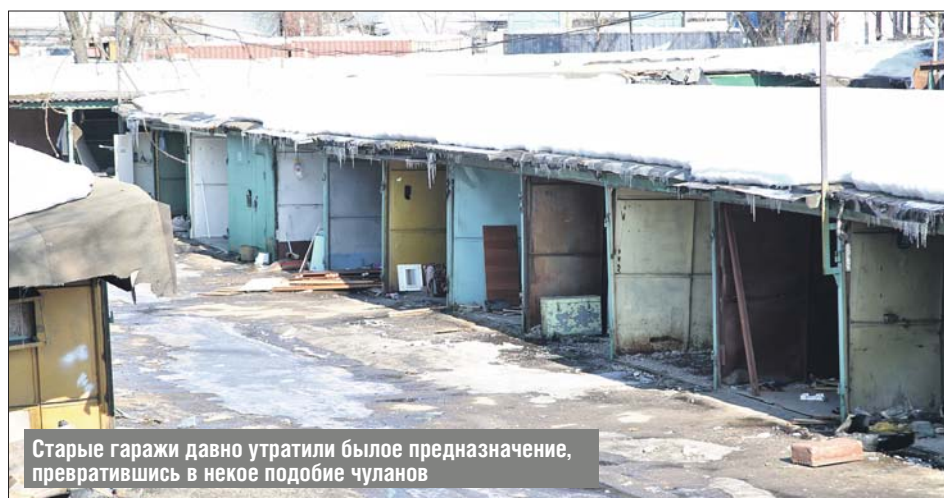
Старые гаражи давно утратили былое предназначение, превратившись в некое подобие чуланов

— В одном из гаражей нашли чемодан советского производства. Я с таким ездила