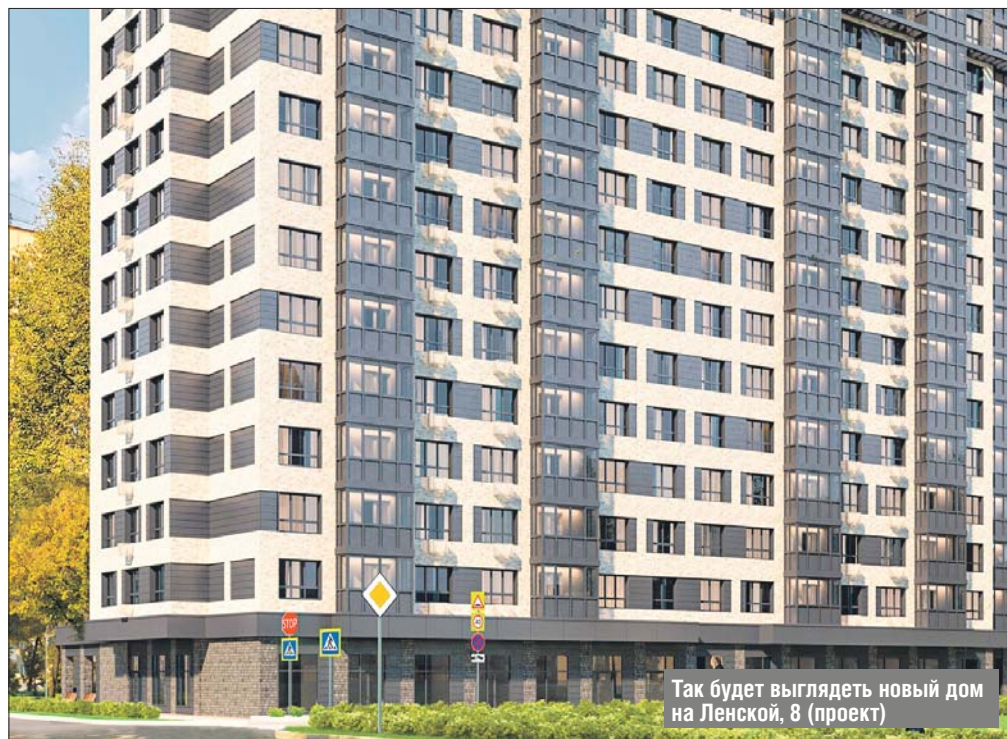
Так будет выглядеть новый дом на Ленской, 8 (проект)

Картой «Мир» можно расплачиваться и снять деньги в Абхазии, Армении, Белоруссии, Вьетнаме, Казахстане, Киргизии, Турции, Таджикистане, Узбекистане. А в Южной Осетии с карты «Мир» можно только снять наличные деньги