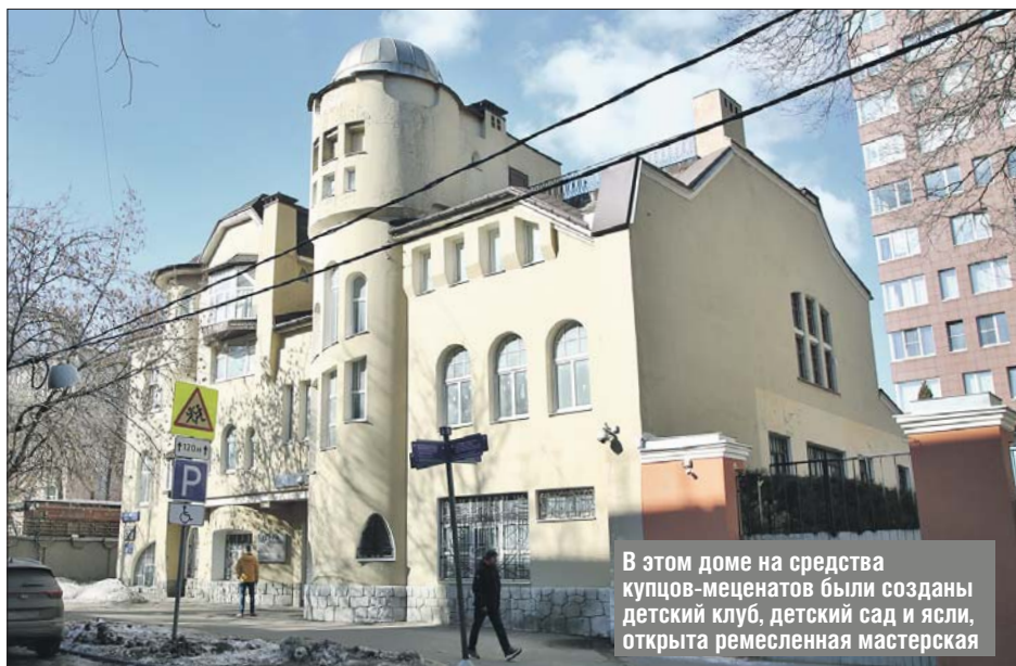
В этом доме на средства купцов-меценатов были созданы детский клуб, детский сад и ясли, открыта ремесленная мастерская