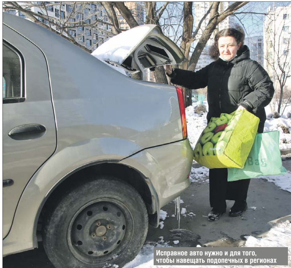
Исправное авто нужно и для того, чтобы навещать подопечных в регионах