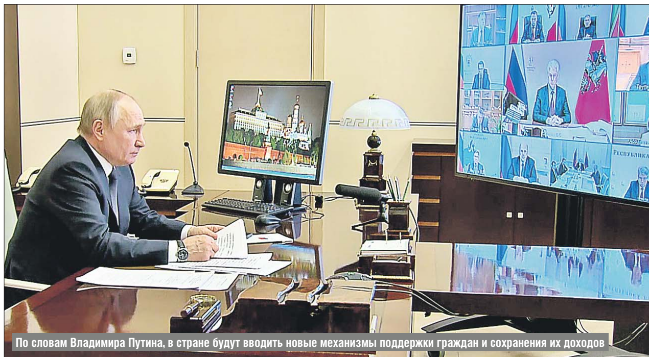
По словам Владимира Путина, в стране будут вводить новые механизмы поддержки граждан и сохранения их доходов

По словам Президента РФ, в центре внимания также будет защита материнства, детства, поддержка семей с детьми. С 1 апреля семьи с невысокими доходами начнут получать дополнительные выплаты на детей от 8 до 16 лет включительно.