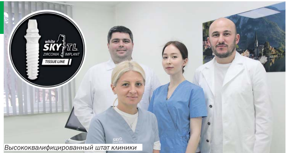
Высококвалифицированный штат клиники