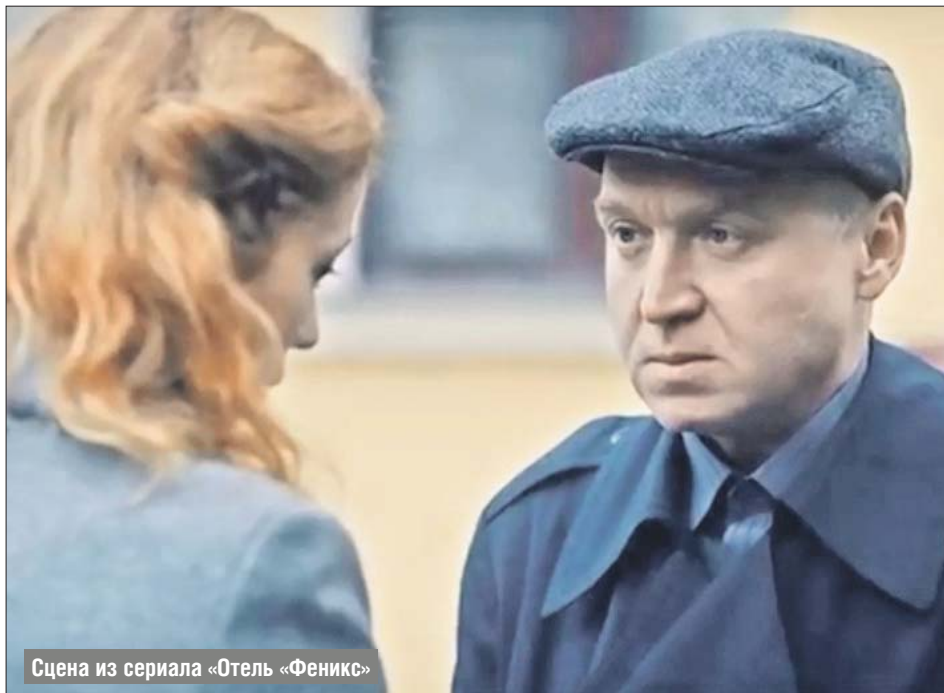
Сцена из сериала «Отель «Феникс»

— Телецентр ведь в Останкине? Значит, бывал, и не раз. Рядом с телецентром, на улице Академика Королёва, находилось первое московское актёрское агентство, которое взяло меня под своё крыло, о чём я с благодарностью вспоминаю. Когда первый раз туда поехал, Москву ещё толком