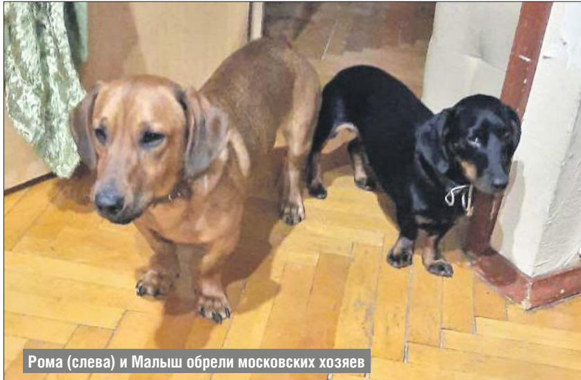
Рома (слева) и Малыш обрели московских хозяев