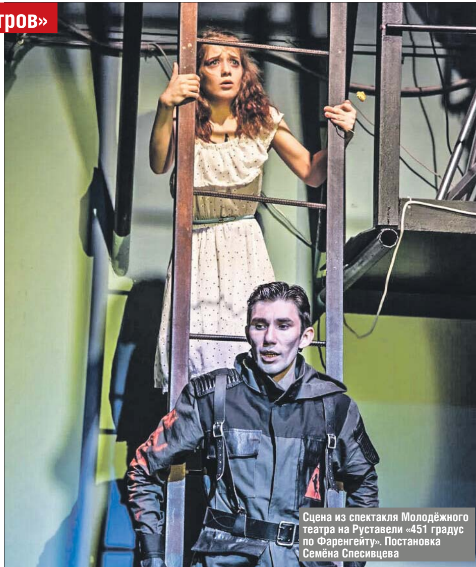
Сцена из спектакля Молодёжного театра на Руставели «451 градус по Фаренгейту». Постановка Семёна Спесивцева