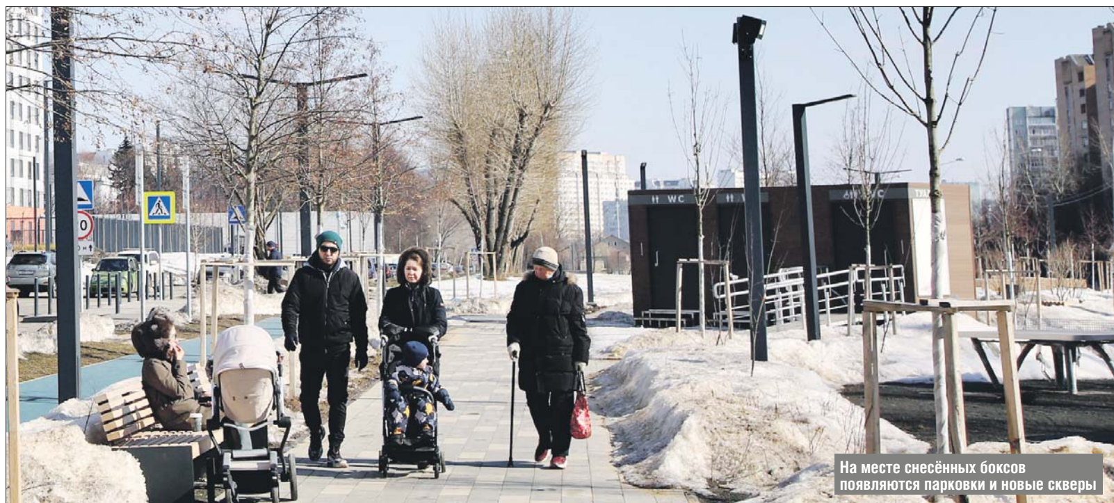
На месте снесённых боксов появляются парковки и новые скверы