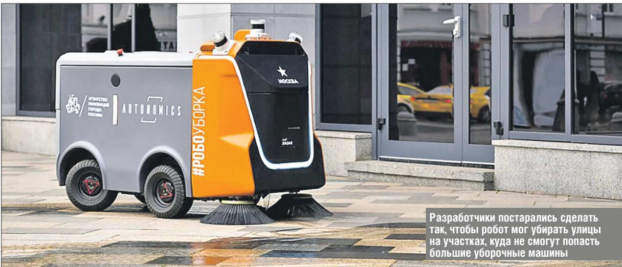
Разработчики постарались сделать так, чтобы робот мог убирать улицы на участках, куда не смогут попасть большие уборочные машины

На территории ВДНХ проходит испытания механический уборщик