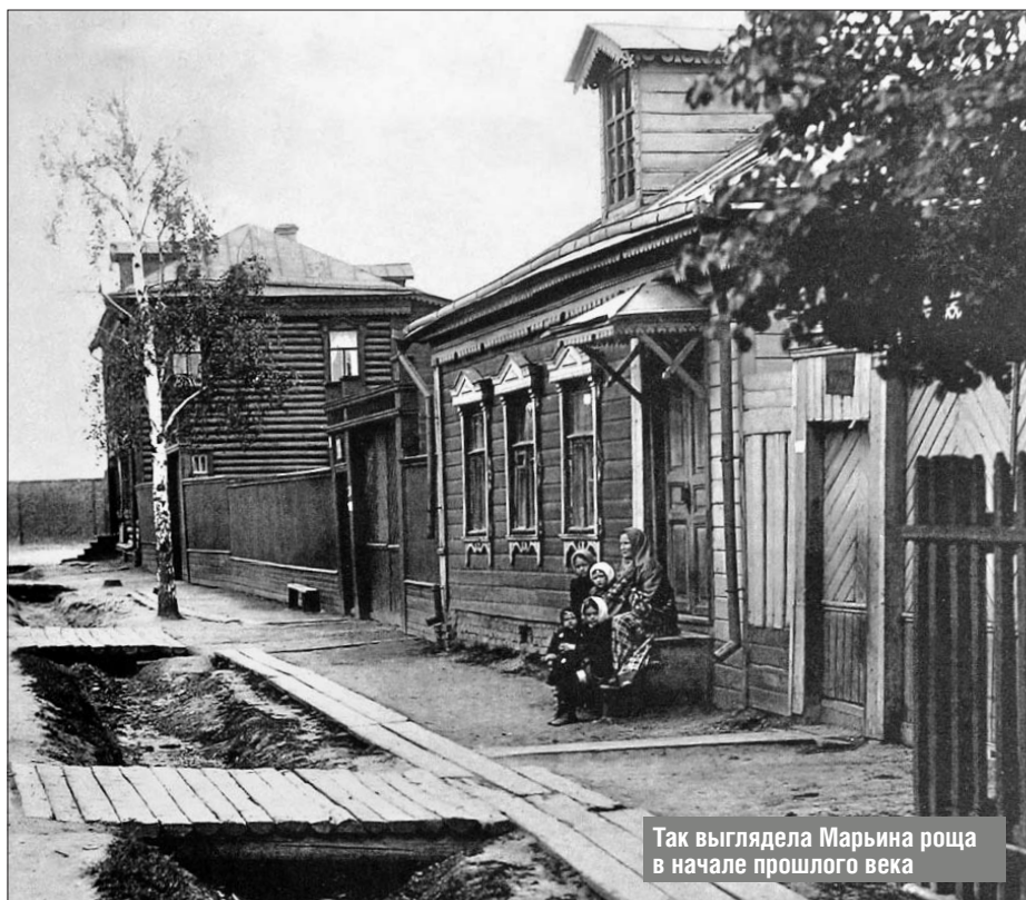
Так выглядела Марьяна роща в начале прошлого века

Но особым достижением педагога-экспериментатора считали летнюю трудовую колонию с детским самоуправлением, разместившуюся на заброшенной даче под Москвой.