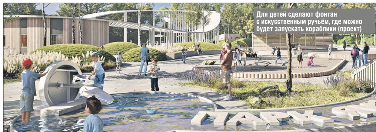
Для детей сделают фонтан с искусственным ручьём, где можно будет запускать кораблики (проект)

— В марте мы откроем выставку конкурсных фото на Чермянке. Обязательно приеду вручить победителям призы, — сказал председатель Мосгордумы.