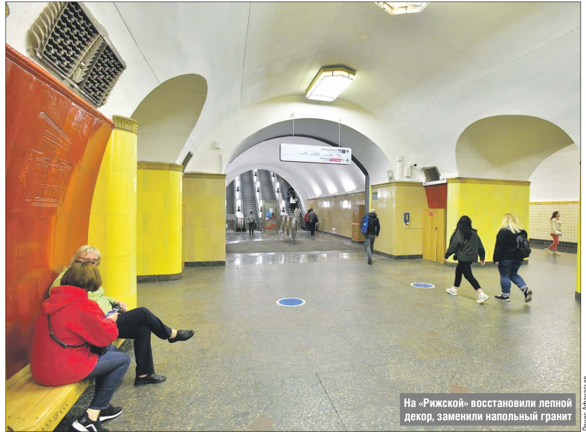
На «Рижской» восстановили лепной декор, заменили напольный гранит