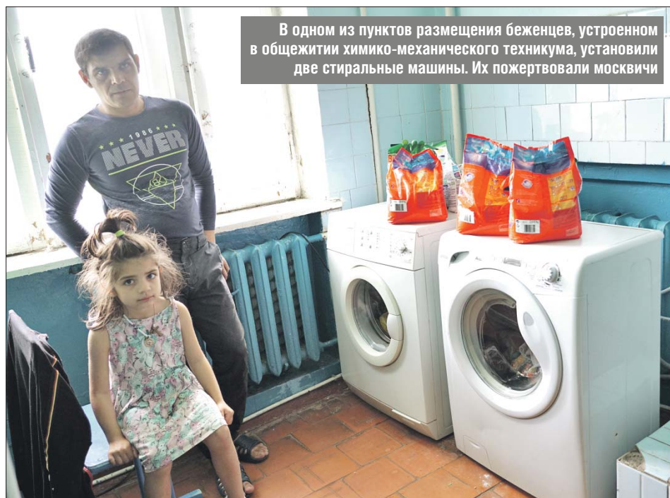
В одном из пунктов размещения беженцев, устроенном в общежитии химико-механического техникума, установили две стиральные машины. Их пожертвовали москвичи

— Поездку на машине мы совершили в конце апреля во время недельного отпуска. Совместили её с паломничеством: недалеко от Россоши есть удивительной красоты