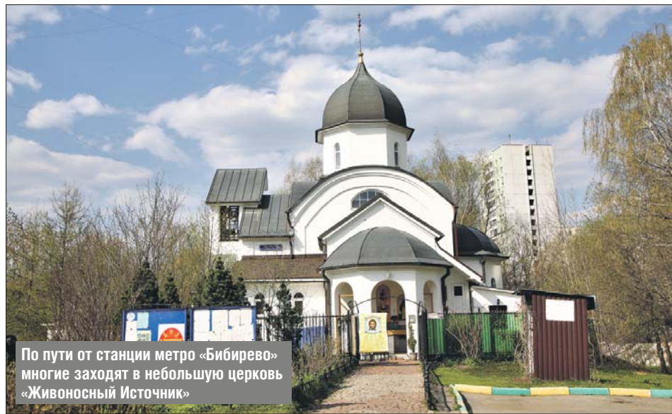
По пути от станции метро «Бибирево» многие заходят в небольшую церковь «Животворный источник»

Первое упоминание исчезнувшего села Бибирево встречается в писцовой книге 1584 года (тогда оно было вотчиной московско-