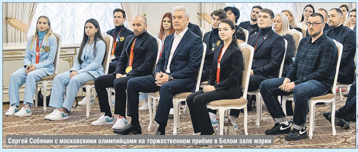
Сергей Собянин с московскими олимпийцами на торжественном приёме в Белом зале мэрии