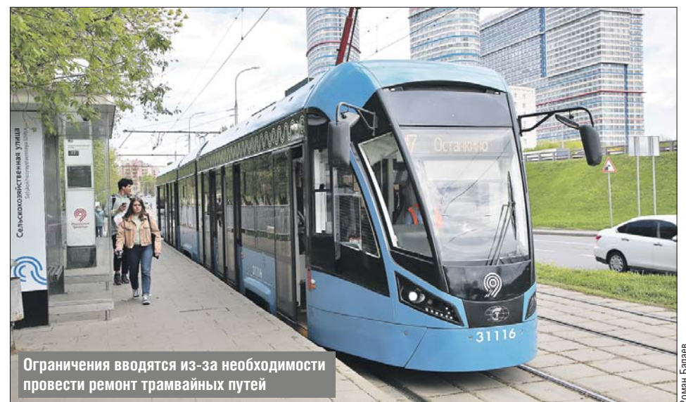
Ограничения вводятся из-за необходимости провести ремонт трамвайных путей