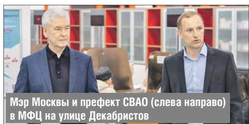
Мэр Москвы и префект СВАО (слева направо) в МФЦ на улице Декабристов

WWW.ZBULVAR.RU • E-MAIL: ZB@ZBULVAR.RU • ГОРЯЧАЯ ЛИНИЯ ДЛЯ ЧИТАТЕЛЕЙ: (499) 647-6831 • T.ME/ZB_SVAO