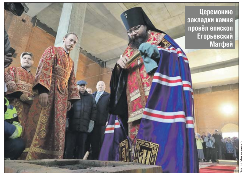
Церемонию закладки камня провёл епископ Егорьевский Матфей