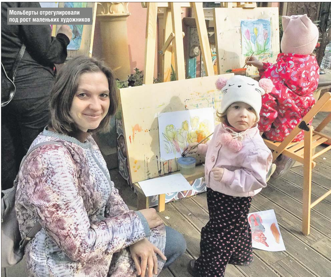
Мольберты отрегулировали под рост маленьких художников

Фестивальной площадкой в нашем округе стал сквер на улице Хачатуряна