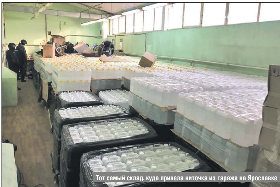
Тот самый склад, куда привела ниточка из гаража на Ярославке

Подпольный магазин вывел полицию на склад палёной водки на Ярославском шоссе