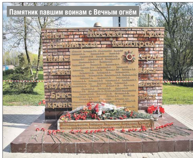
Памятник павшим воинам с Вечным огнём

го Вознесенского монастыря, «что у Фроловских ворот»). Позже обитель перестала владеть селом, но монастырю, расположенному в Кремле, оставили здесь небольшое подсобное хозяйство. В Бибирево поставили деревянную Благовещенскую церковь, дворы церковного причта, монастырский