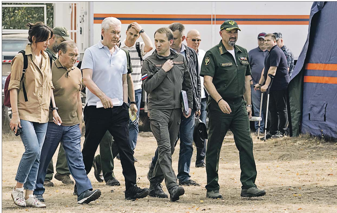
Сергей Собянин лично прибыл в Рязанскую область, чтобы проверить, как организована работа московских структур

Основная ставка в борьбе с бедствием делается на авиацию и строительную технику.