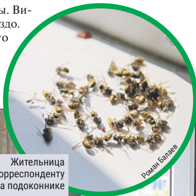
Жительница показала корреспонденту «трофеи» на подоконнике

— А отверстие-то сквозное — оттуда они и пробрались в квартиру. В комнате я попросила