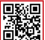
Все новости района: «Северный»

Экипаж ГИБДД задержал на Дмитровском шоссе упитанного поросёнка. Его подманили бутербродом и, погрузив в багажник, отвезли в собачий приют на передержку — пока не найдут старого или нового хозяина. Об этом сообщает газета «Северный».