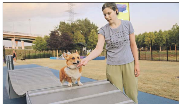
Тренировать питомцев можно на лесенках и горках