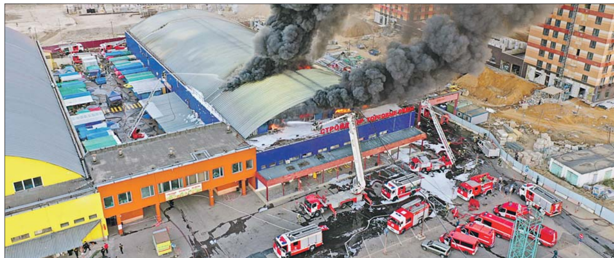
На полную ликвидацию возгорания на Сигнальном проезде потребовалось около четырёх часов