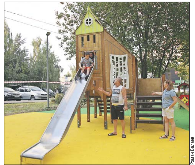
Игровой домик с горкой установили на Абрамцевской улице, 24, корпус 1