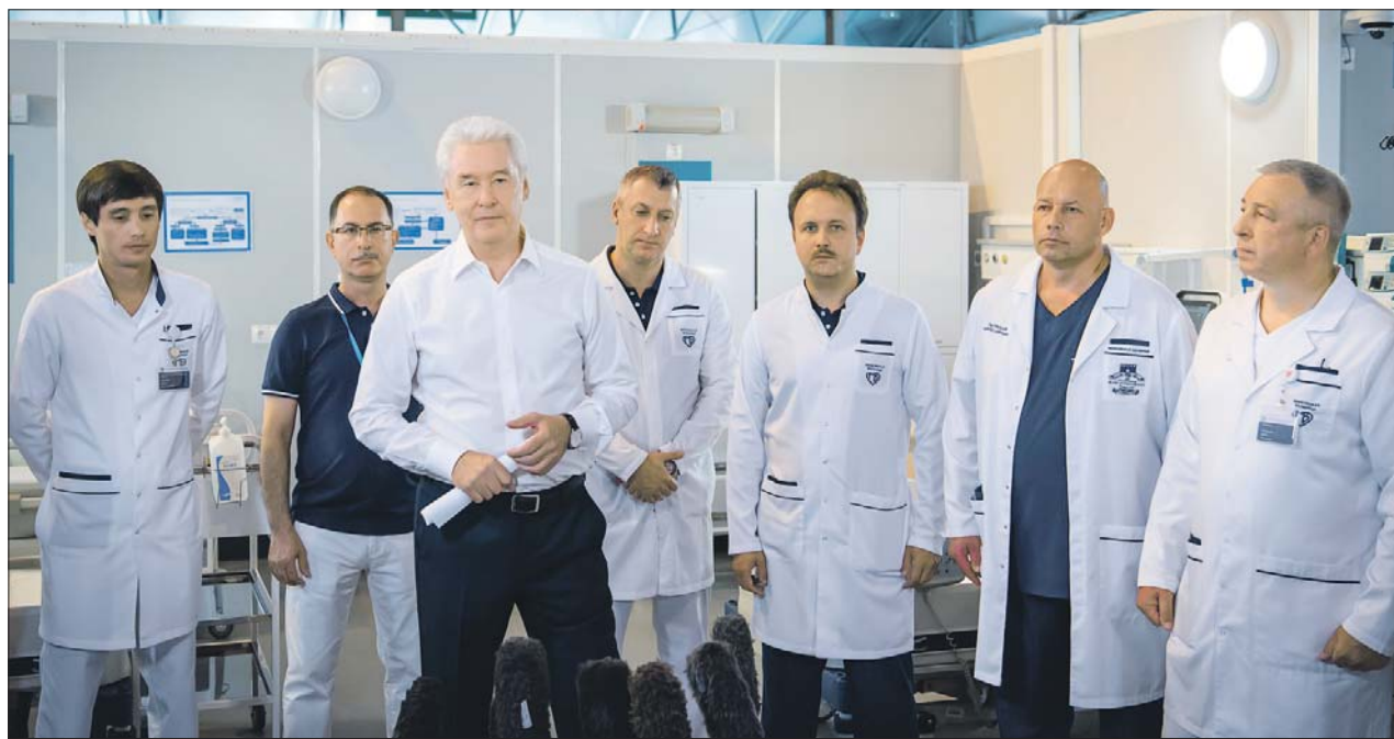
Мэр Москвы обсудил новые стандарты экстренной помощи с главными врачами крупнейших многопрофильных больниц города

— Каждая минута в приёмном отделении, каждый ал-