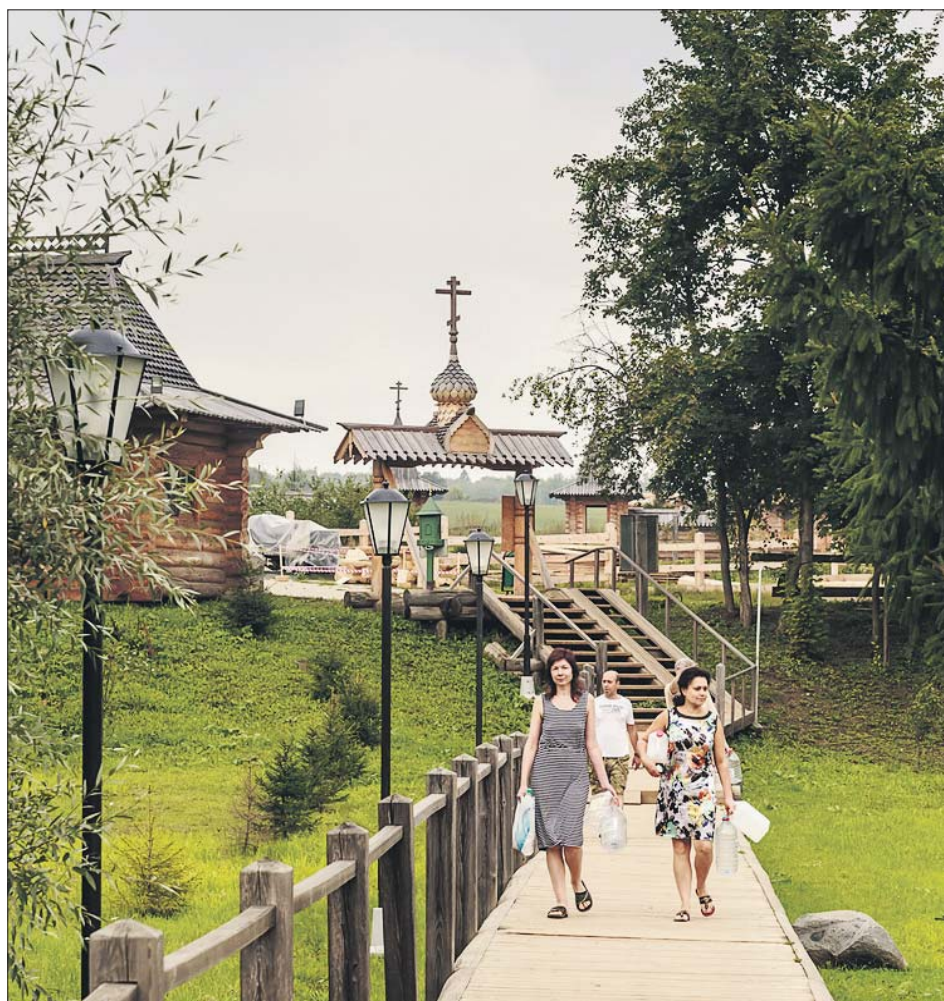
По преданиям, целебный водопад на правом берегу реки Вондиги появился в XIV веке