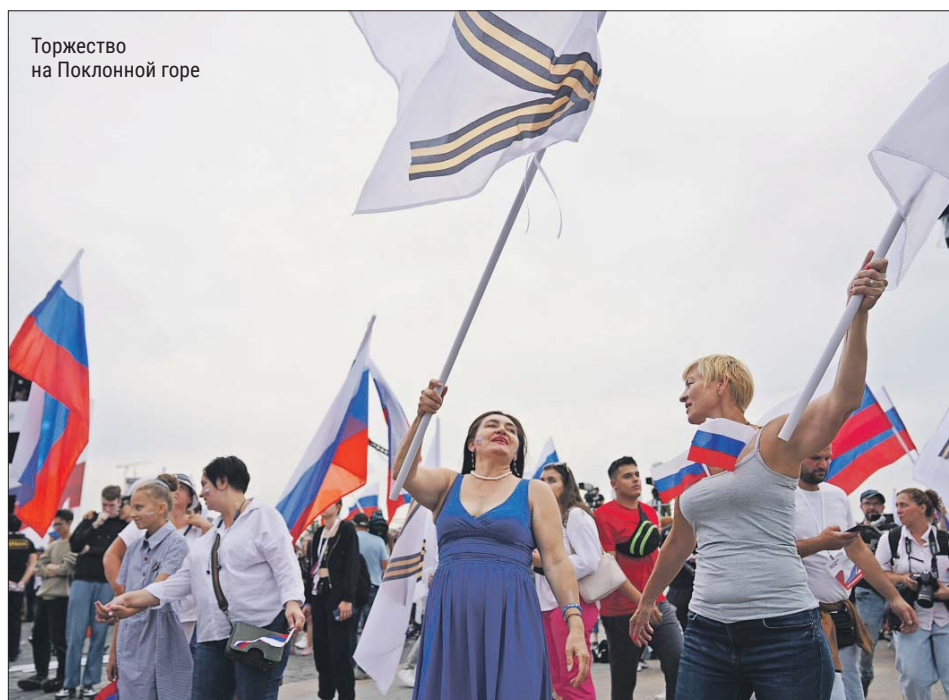
Торжество на Поклонной горе