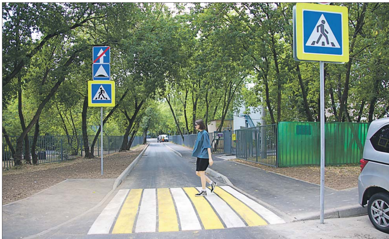
Разметку для пешеходов нанесли между школой и детским садом на Ленской улице

— Дорога тут была узкая. Если приезжал грузо-