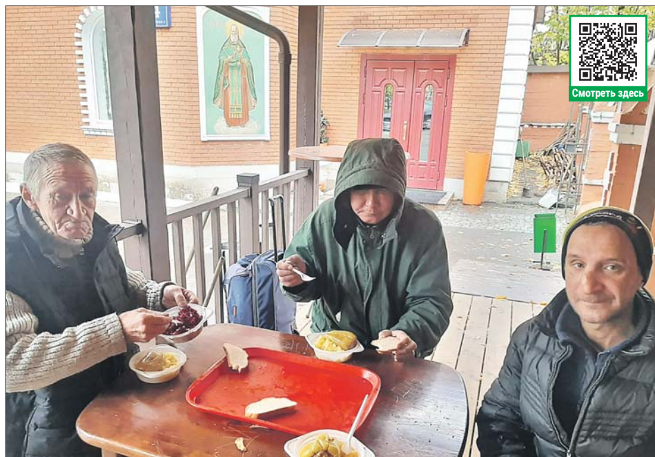
На подворье храма Рождества Пресвятой Богородицы во Владыкине волонтеры кормят нуждающихся и выдают им предметы первой необходимости

— Нужны крупы, макароны, мясные, рыбные и овощные консервы, курица, рыба и сосиски, овощи,