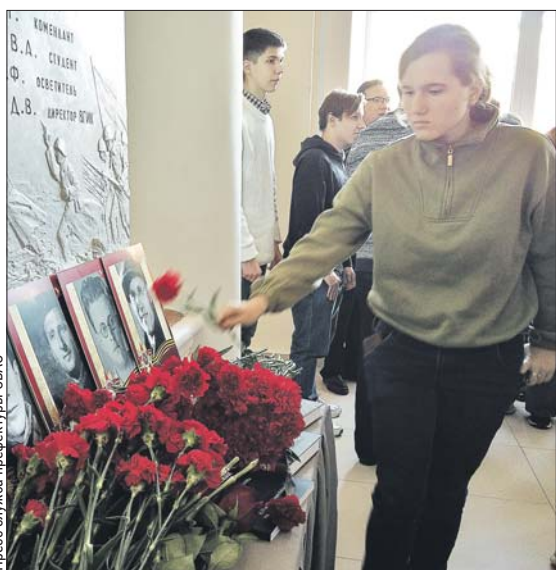
Мемориальная акция прошла во ВГИКе