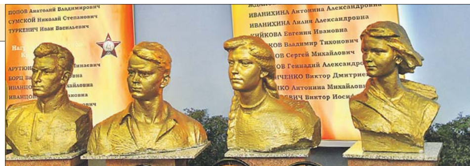
Бюсты молодогвардейцев, которым присвоили звание Героя Советского Союза