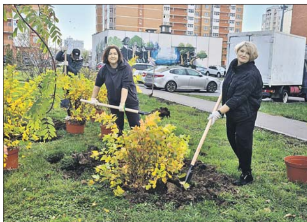
Кустарники высадили во дворах на Дмитровском шоссе