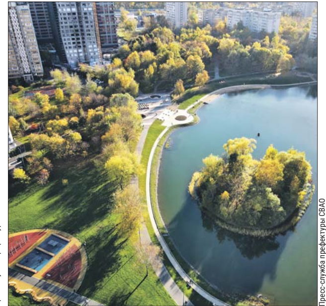
Водоём окружает удобная прогулочная дорожка