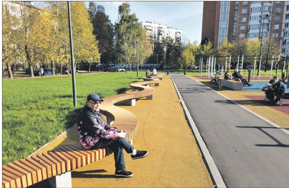
Рядом с новой спортплощадкой разместились необычная скамейка-змейка

Территорию у Капустинского пруда симпатично благоустроили