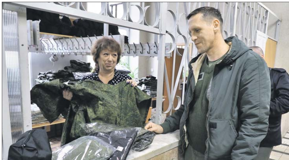
В гардеробе выдают экипировку — берцы, термобельё, униформу, рюкзаки, гигиенические наборы, аптечки

Родственники ожидают мужчин на улице. Здесь есть скамейки, для детей