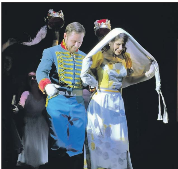
Сцена из спектакля «Повести Белкина»

— Режиссёр Вячеслав Спесивцев, мастерски сломав стереотипы, дал миру совершенно неожиданного, пылающего яркими красками «Гамлета». В спектакле много необычного, в том числе очень пёстрая одежда актёров. Музыка, которую режиссёр выбрал для постановки, — это песни соотечественников Шекспира знаменитой ливерпульской четвёрки — The Beatles. Спектакль будто переносит зрителя из века в век, из нашей эпохи в эпоху Шекспира и смотрится как захватыва-