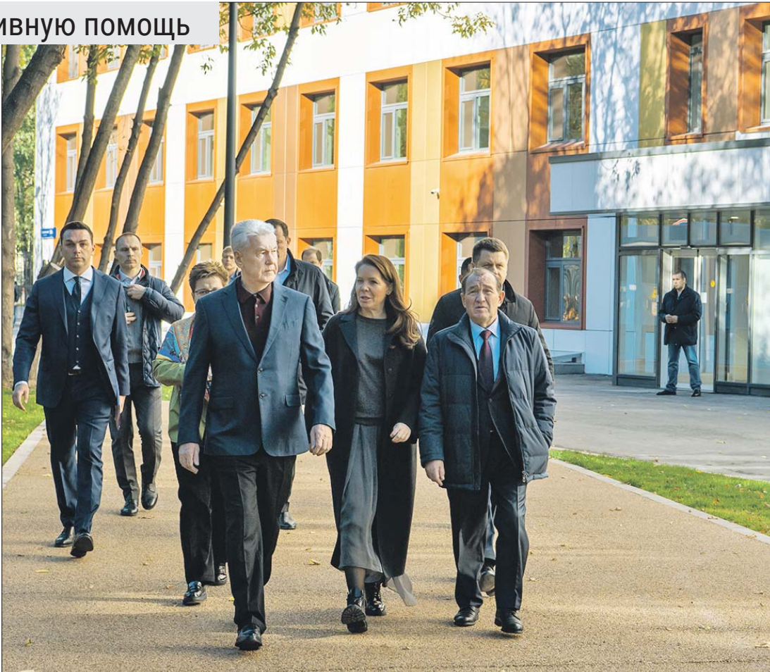
Мэр Москвы Сергей Собянин вместе с коллегами проверил, как идут работы по обустройству дома сестринского ухода «Даниловский»