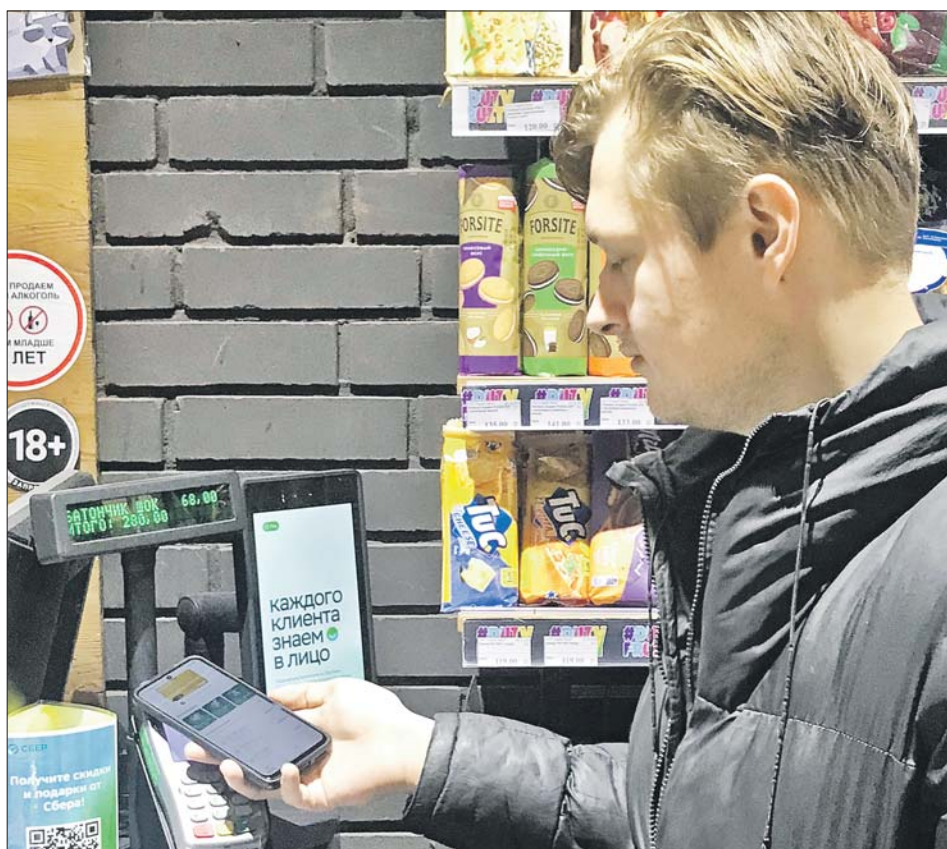
Перед тем как поднести гаджет к терминалу, не забудьте разблокировать экран

Приложение Mir Pay проверил корреспондент «ЗБ»