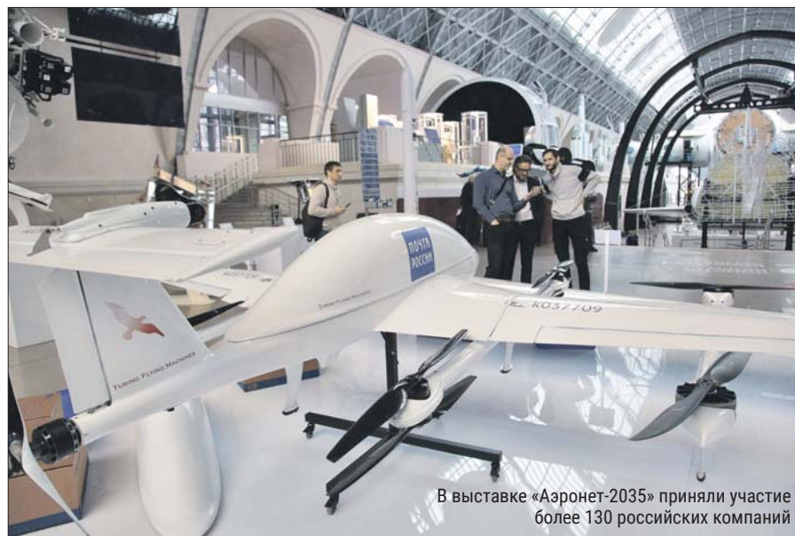
В выставке «Аэронет-2035» приняли участие более 130 российских компаний