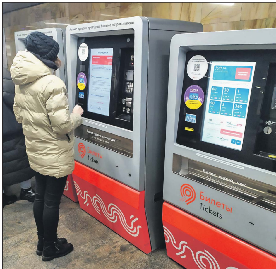
На станции метро «Бибирево»

— Да, кассы закрыты. А что делать, если автоматом пользоваться не умею? — Я с трудом, но убедительно симулирую бытовую непри-