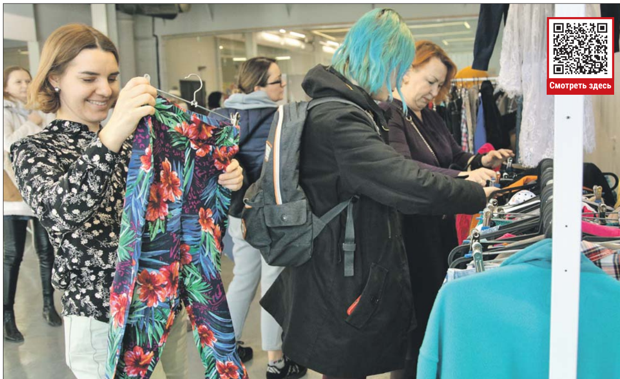
На «Флаконе» устроят вещевой своп: можно принести одежду, которая вам больше не подходит, и обменять на наряд по душе

Сотрудники фонда «Второе дыхание» 3 декабря в