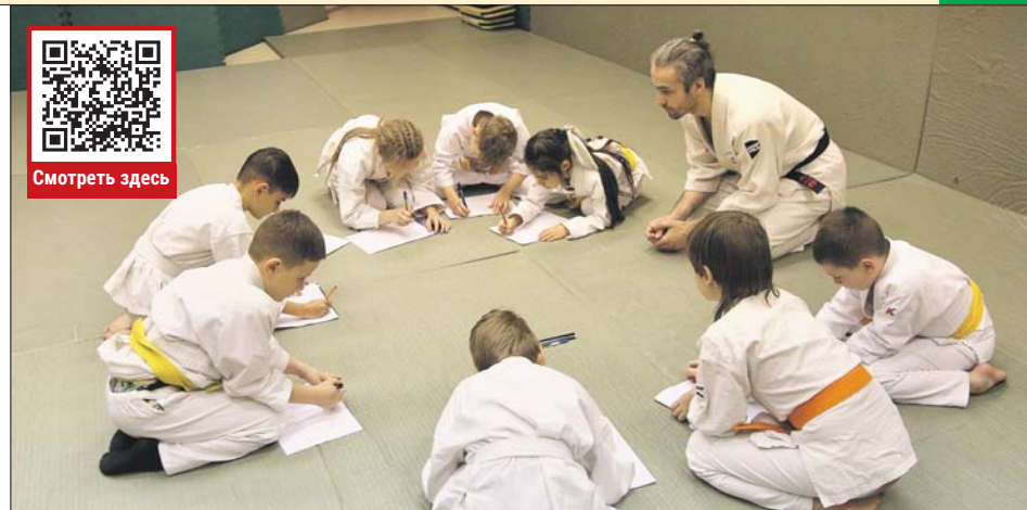
Каждую неделю воспитанники клуба «Спецназ XXI» в Алтуфьевском пишут письма нашим бойцам