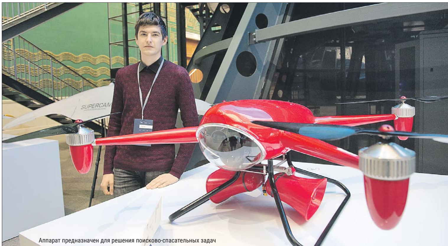
Аппарат предназначен для решения поисково-спасательных задач

Уникальные отечественные разработки показали на ВДНХ