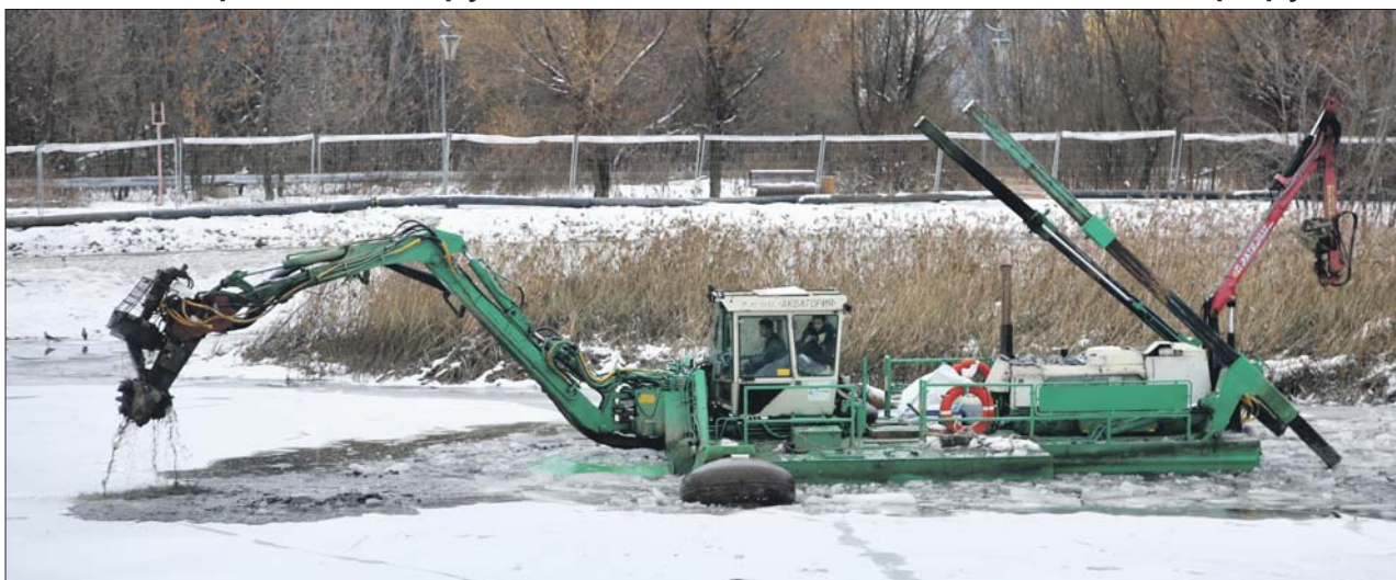
Очистка Алтуфьевского пруда, начатая в октябре, продолжается и сейчас: снег этому не помеха

На замерзающих прудах в СВАО делают специальные проруби