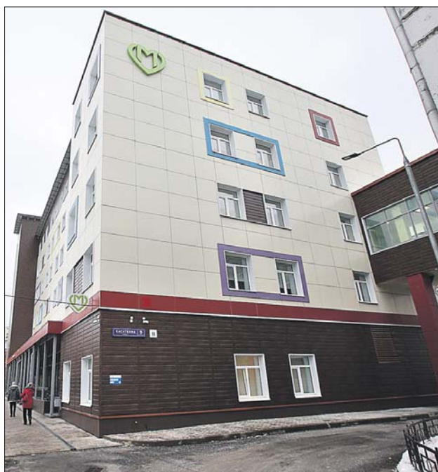
Улица Касаткина, 9, стр. 2

— На первом этаже разместились самые часто посещаемые кабинеты: в левом крыле — кабинеты для забора лабораторных анализов, кабинет выдачи справок и направлений, а в правом — кабинет дежурного врача и помещения с отдельным входом для детей с признаками ОРВИ, — рассказала «ЗБ» главный врач поликлиники Анастасия Рубцова. — На 2-м этаже принимают участковые врачи-педиатры. Здесь же находятся прививочный и процедурный кабинеты, комната кормления.