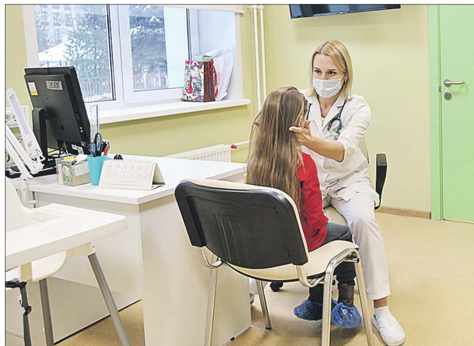
Врачи принимают маленьких пациентов в светлых просторных кабинетах