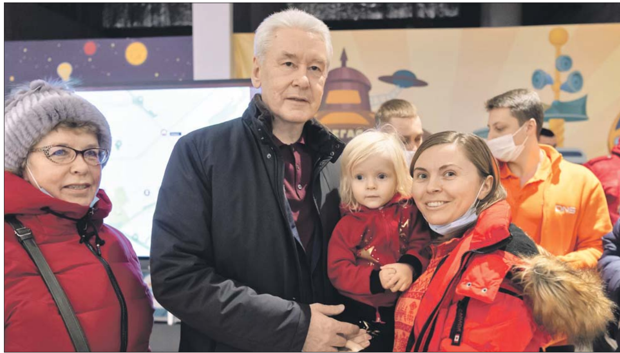
Сергей Собянин проверил, каким после реконструкции стал бывший кинотеатр «Марс» в Алтуфьевском районе. Декабрь 2021 года

В Северо-Восточном округе, к примеру, преобразилась пойма Яузы. В прошлом году благоустроили участок вдоль Северодвинской улицы и территорию между улицами Широкой и Енисейской. А ранее ухоженными стали участки вдоль Лазоревского, Чукотского и Тенистого проездов, зелёная зона на Заповедной улице, на Юрловском проезде появился парк спорта. В 2022 году в округе обновили сквер «Знаки зодиака» в Бабушкинском районе, скверу Капустинского пруда и променад вдоль улицы Седова в Свиблове. В Южном Медведкове обновили крупный жилой квартал между Сухонской улицей и проездом Шокальского, в Бибиреве сквер вдоль улиц Мелихов-