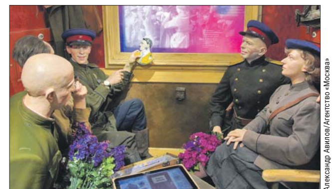
Экспозиция посвящена трём военным трибуналам 1945-1949 годов