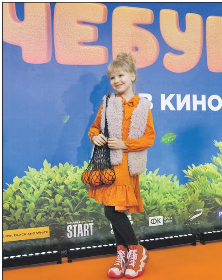
Ева на премьере семейной кинокомедии, в которой исполнила роль Сони

— Например, иностранные языки. Я изучаю английский, французский и китайский! Китайский — благодаря подруге. Она давно его учит, даже ездила в Китай по обмену. Однажды она устроила мне мастер-класс: учила некоторым словам, рисовала... И мне понравилось. Говорят, что китайский язык сложный, но мне пока базовые слова кажутся лёгкими. К тому же это увлекательно: слова в китайском строятся не так, как в русском. Ещё я занимаюсь музыкой — вокалом, фортепиано и гитарой. Юрий Николаевич Стоя-