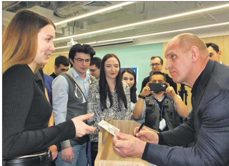
Трёхкратный победитель Олимпийских игр всем желающим оставил автограф на память

— Не успел я прийти в большой спорт, как сломал ногу и полгода скакал в гипсе от бедра до кончиков пальцев. Поэтому страха травм у меня не было: я