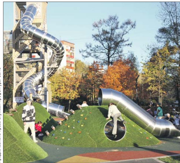
Игровой городок в сквере «Знаки зодиака». Октябрь 2022 года