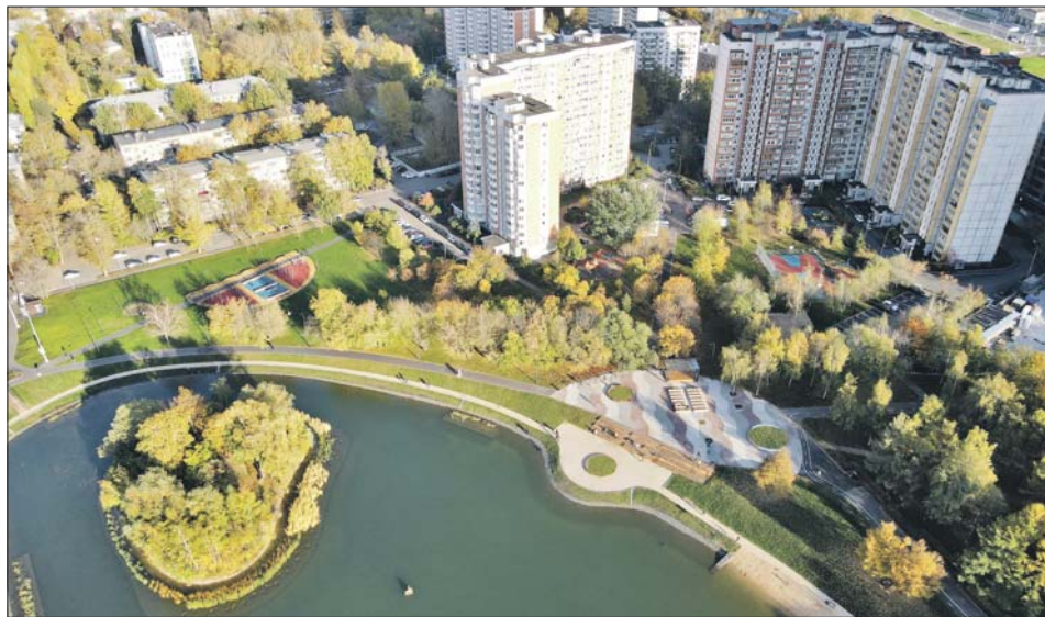
Благоустроенные площадки у Капустинского пруда. Октябрь 2022 года