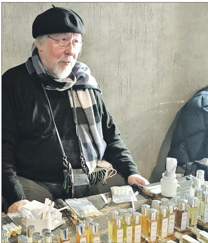
Духи Олейникова отличаются оригинальным сочетанием компонентов

— Когда мне было года четыре, я сдвигал стулья, накрывал одеялом и в такой таинственной атмосфере составлял «сокровища»: баночки, скляночки, флаконы. От мамы мне достался флакон в форме Эйфелевой башни с каким-то феерическим содержанием. Запах его был терпко-пряным, с отчётливыми нотками чёрного чая. А однажды мама показала мне, как выращивать кристаллы поваренной