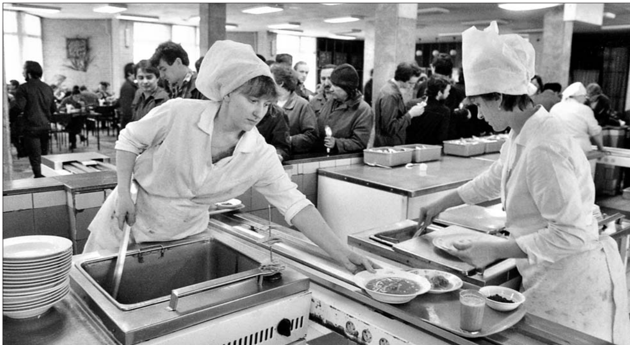
Московский станкостроительный завод имени Серго Орджоникидзе. Линия раздачи комплексных обедов. 1988 год.

— На подобной фабрике-кухне можно было пообедать и взять с собой готовую еду, полуфабрикаты, выпечку. Хозяйка могла совершенно не запариваться, что приготовить к праздничному столу. Зашла на фабрику-кухню, прикупила салаты из свежей капусты и мясной, солёные помидоры-огурцы, рыбу под маринадом и бисквит-