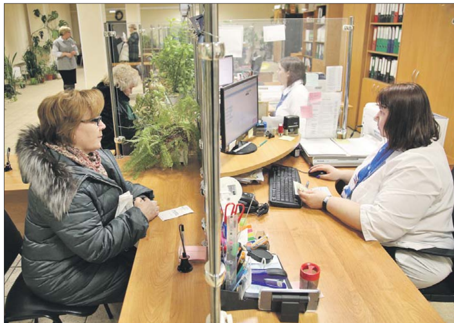
В клиентской службе на Енисейской улице

— Оба фонда часто работали с одними и теми же категориями посетителей. Данные передавали друг другу через систему межведомственных запросов. Сейчас вся информация собрана в единой базе данных. Общий канал получения информации — сайт Социального фонда Рос-