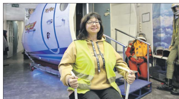
Участница клуба «Авиатор» занимается на тренажёре для улучшения координации движений

из двух групп. Первая занимается по понедельникам и средам с 12.00 до 14.00, вторая — в это же время, но по вторникам и четвергам.