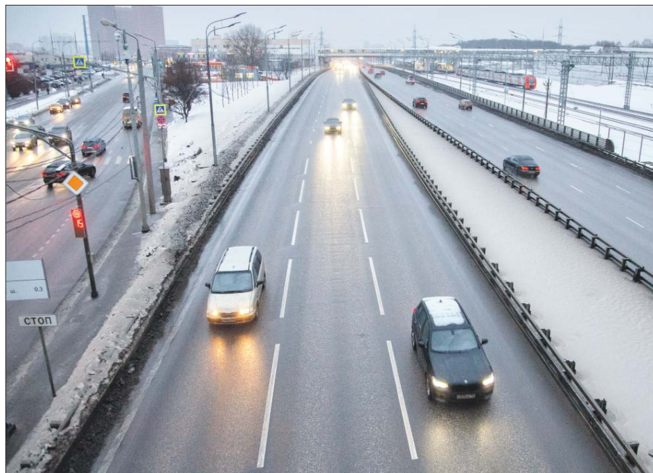
Участок Московского скоростного диаметра в районе Алтуфьевского шоссе, 2а

Многие транзитники уже ушли с трассы: «ЗБ» в этом убедился