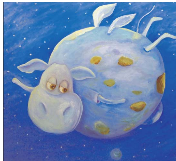
Сюжет картины был навеян повестью «Маленький принц»