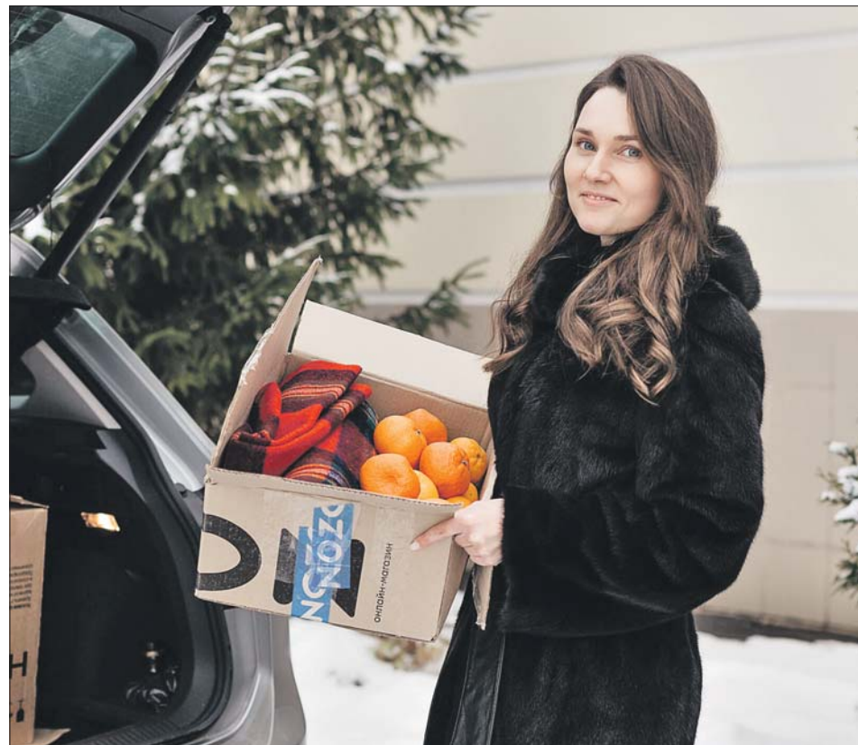
Волонтеры помогают создать для подопечных уют и домашнюю атмосферу