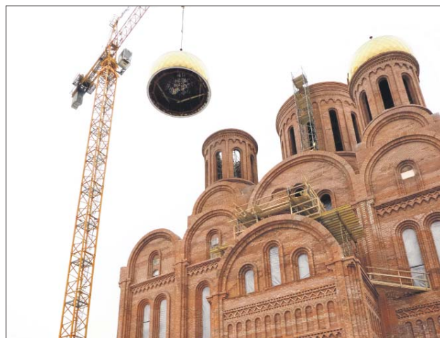
Строящийся храм Успения Пресвятой Богородицы рассчитан на тысячу прихожан

Новый храм рассчитан на 1 тысячу прихожан, его высота составляет 60 метров. Он станет главным храмом столичных строителей. Уже выполнена кирпичная кладка стен под купола, сделаны сводчатые перекрытия кровли, колонны. Установлены семь из восьми колоколов. Центральный купол с крестом установят после крещенских праздников. Проект росписей создаст известный художник Василий Нестеренко, который работал над храмом Христа Спасителя. Ввести здание в эксплуатацию планируют в 2024 году. Об этом сообщил куратор