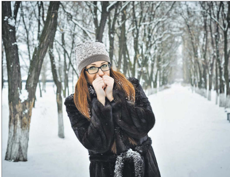
Если кожа побелела, это уже первая стадия обморожения

— Если предмет небольшой, нужно доставить пострадавшего вместе с ним в тёплое место и ждать, когда отогреется. Если же передвижение невозможно, надо отогревать на месте дыханием или тёплой водой, но ни в коем случае не горячей. Открытый огонь вроде зажигалки или спичек использовать нельзя, — объясняет Ситников. — После отлипания оцените масштаб