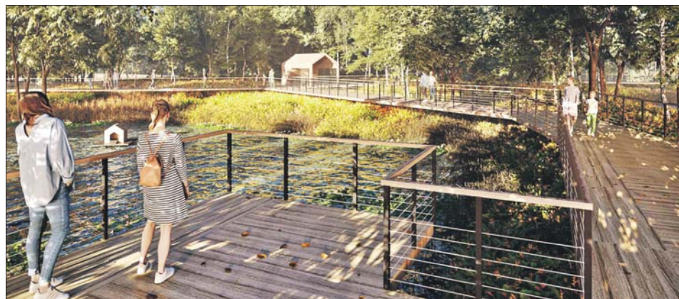
Планируется обновить экотропы с пешеходными мостами и смотровыми площадками

Также в этом году планируется реконструировать Сель-