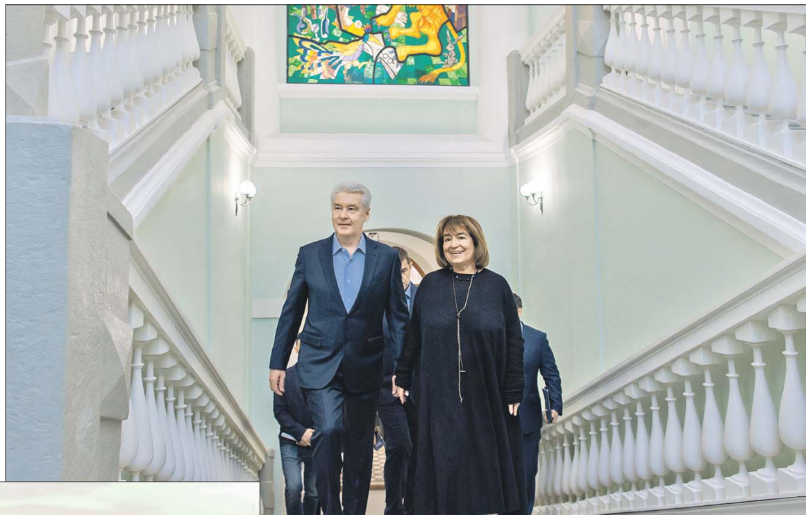
Мэр Сергей Собянин с реставраторами в главном корпусе

Интересно, что в 1812 году именно этот дом был выбран наполеоновским маршалом Мюратом для своей штаб-квартиры. Правда, пробыв там один день, маршал по неизвестным причинам сменил адрес.