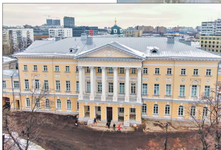
С именем бывших владельцев усадьбы связано множество легенд

Больница в этих стенах была основана в 1866 году