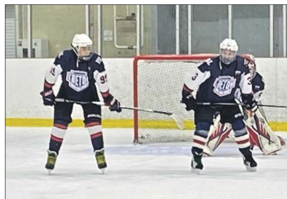
Игроки команды «Светон»