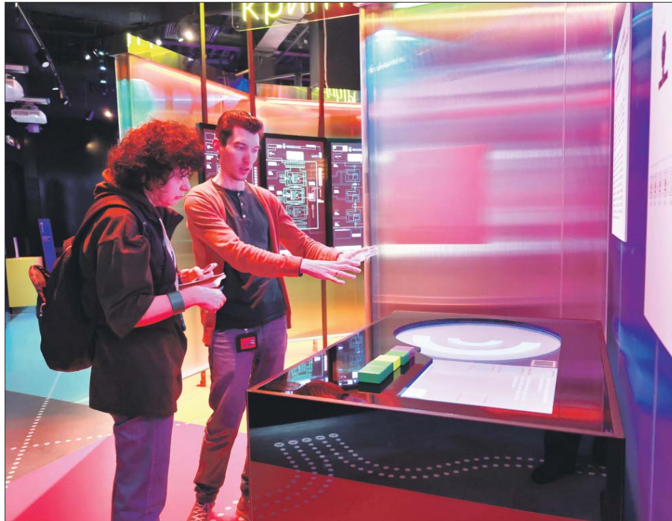
Часть экспозиции посвящена современности. Например, эта инсталляция познакомит с некоторыми способами защиты личных данных в Интернете

В Музее криптографии появились новые экспонаты