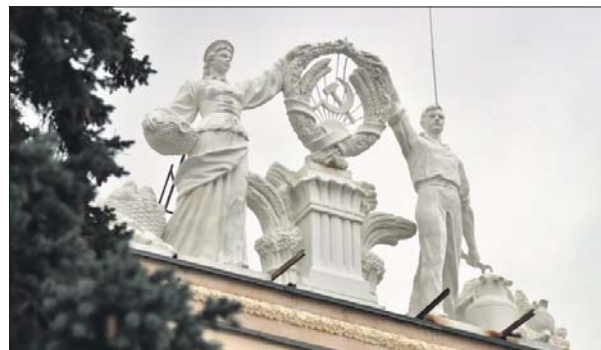
Фигуры литовских колхозников украшают павильон №6