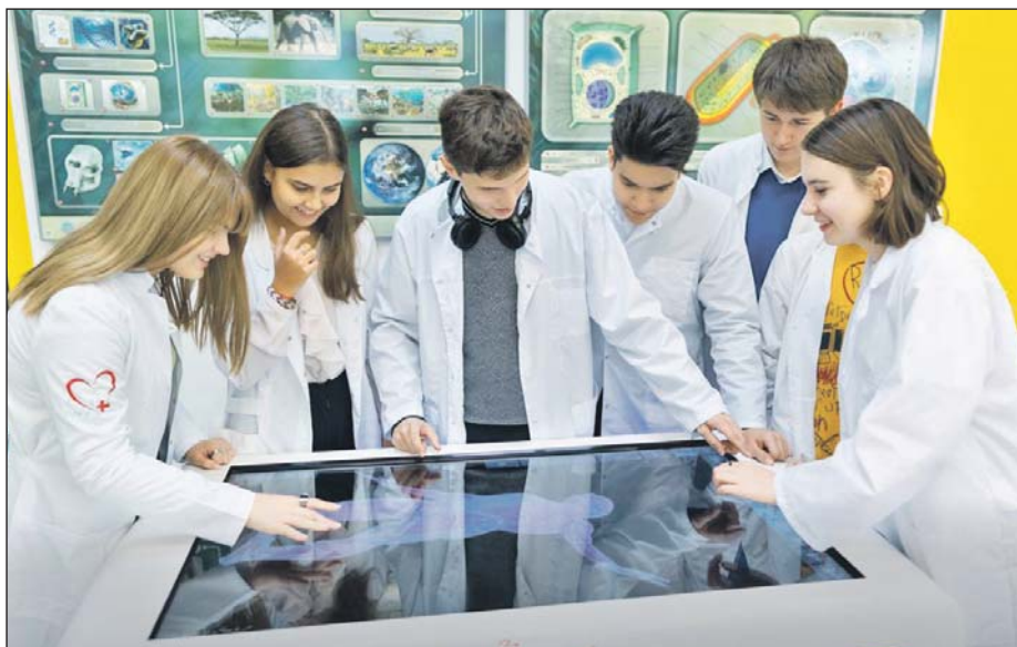
Ученики медицинских классов познакомятся с особенностями работы медсестёр

В начале 10-го класса ученики смогут посетить профильные городские предприятия. А оканчивать