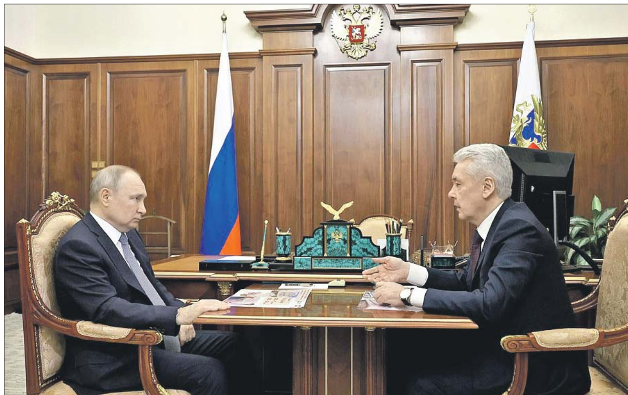
Сергей Собянин доложил президенту об основных программах развития Москвы

Мы реализуем в области экономики ряд интересных проектов, которые будут драйверами развития в ближайшие годы. Мы уже говорили о беспилотных летательных аппаратах. В «Руднёво» на промплощадке мы развернули большую площадку, сегодня уже там 120 тысяч квадратных метров промышленных площадей, в ближайшие годы будет в три раза больше. И ядром этого промплощадки будут