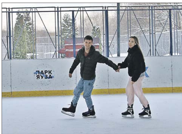
Сегодня на территории парка действуют уже четыре катка, один из них — на улице Бажова

О запланированных новинках рассказали и на заседании общественного совета. Например, на Сельскохозяйственной улице хотят обустроить конюшню на три десятка лошадей для клуба «Золотая подкова». Здесь будут обучать вер-