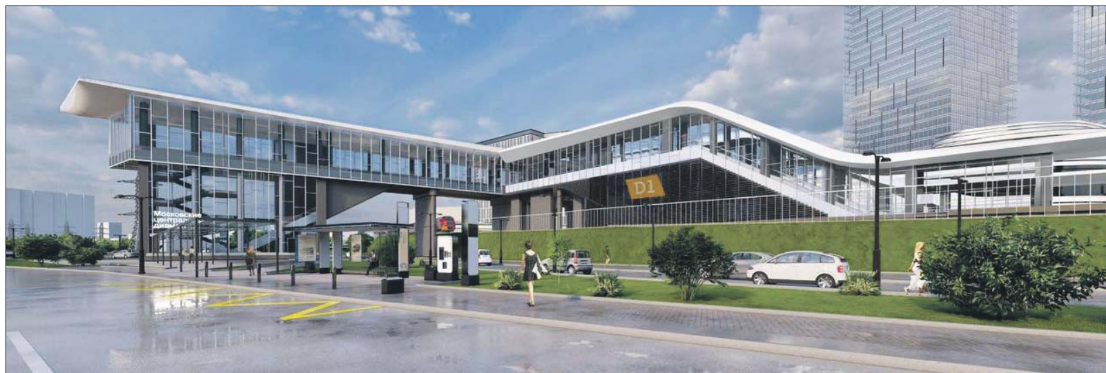
Проектное решение: вид на будущий ТПУ со стороны улицы Комдива Орлова

У станции метро «Петровско-Разумовская» создают транспортно-пересадочный узел. Он свяжет две линии метро, МЦД-1, МЦД-3 и городские автобусы. А вместо наземного перехода через рельсы, по которому сейчас приходится добираться до метро жителям улицы Комдива Орлова, планируют сделать крытый — он пройдёт над путями. По расчётам специалистов, в сутки узлом будут пользоваться почти 90 тысяч пассажиров.