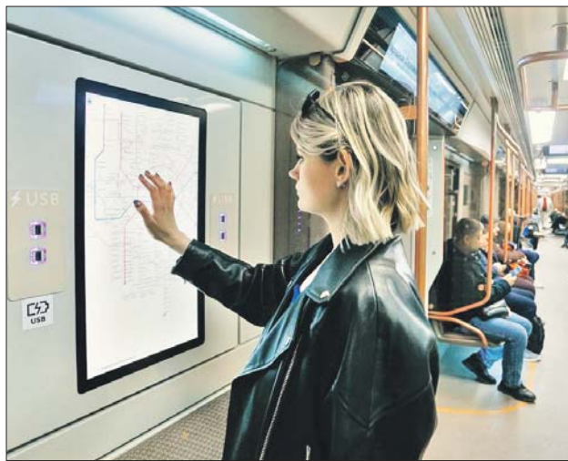
В современных вагонах можно построить маршрут с помощью сенсорного экрана

созданием поезда нового поколения, который сможет выходить на линии начиная с 2026 года. По словам мэра, он вместит больше пассажиров, его двери будут рекордно ши-