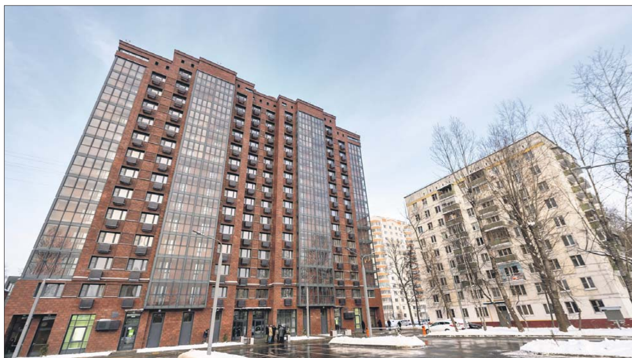
Проезд Дежнёва, 8, — дом, построенный по программе реновации в районе Южное Медведково

Мы в этом году закончим реконструкцию половины всего поликлинического фонда Москвы, и будет 200, по сути, новых зданий, оснащённых по новому, самому современному стандарту. Это, конечно, улучшит качество амбулаторного обслуживания москвичей. <...>