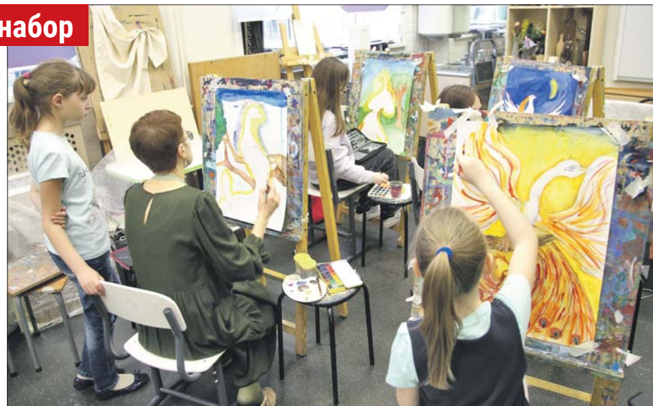
На занятии в школе искусств имени Е.Ф.Светланова в Алексеевском районе