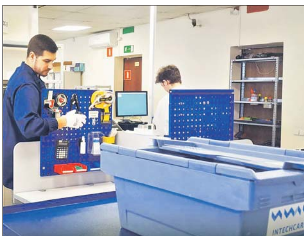
«Инновационные карточные технологии» — резидент технопарка «Калибр»

Ещё одной компании присвоен статус якорного резидента технопарка «Калибр». Она производит пластиковые смарт-карты — те самые, которые начинены микросхемами и используются во множестве гаджетов и электронных приборов.