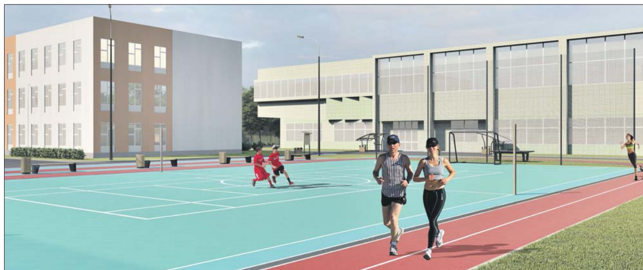
На территории учебных заведений на улице Тихомирова обновят спортивные объекты

У станции «Медведково» приведут в порядок тротуары