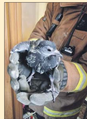
Малыша вызволял отряд «СпасРезерва»