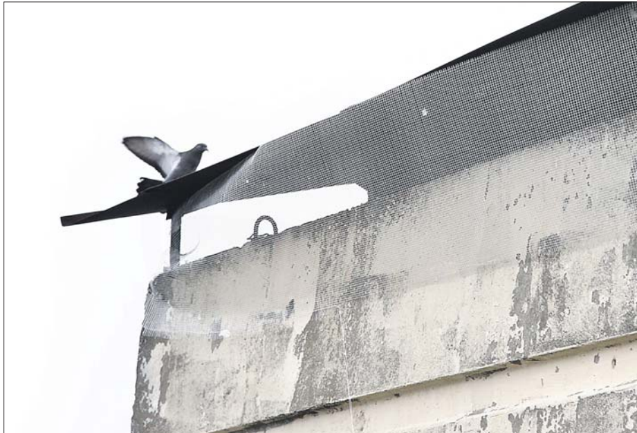
Благодаря сетке сохранится вентиляция чердака, но доступ для голубей туда теперь закрыт

— На чердаке действительно было засилье голубей. Птицы попадали туда через продухи — небольшие отверстия для цирку-