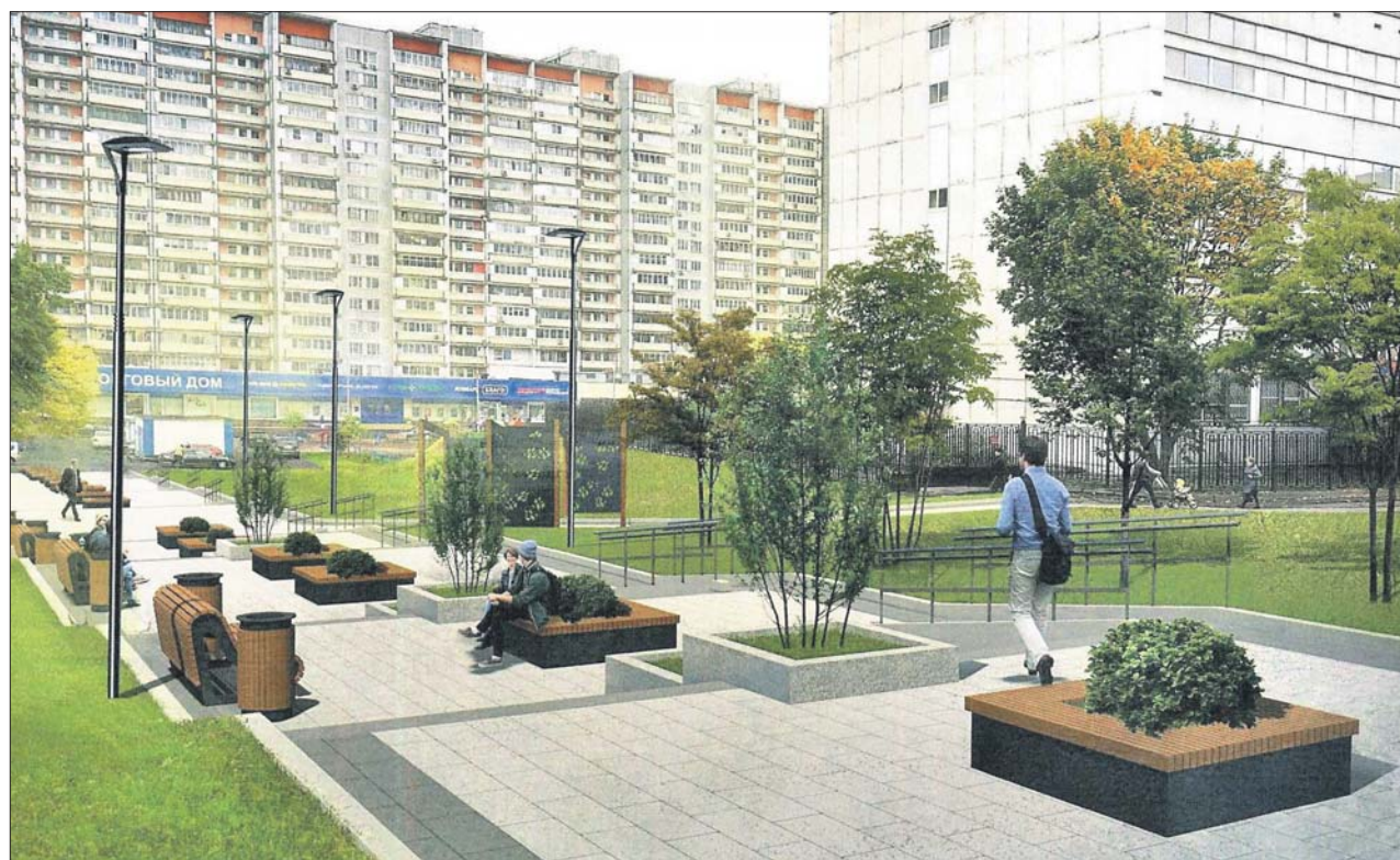
Такую просторную лестницу с зонами отдыха планируют сделать на Широкой улице

— Сейчас эти автобусы останавливаются там же, где и общественный транспорт, а это создаёт неудобства водителям наших столичных маршрутов, — пояснил глава управы.