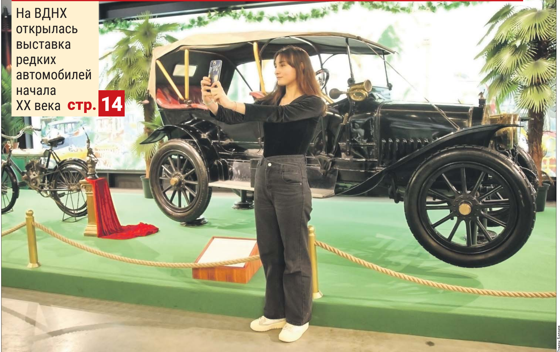
Этот «Руссо-Балт» 1911 года – единственная сохранившаяся отечественная легковушка той эпохи

На ВДНХ открылась выставка редких автомобилей начала XX века стр. 14