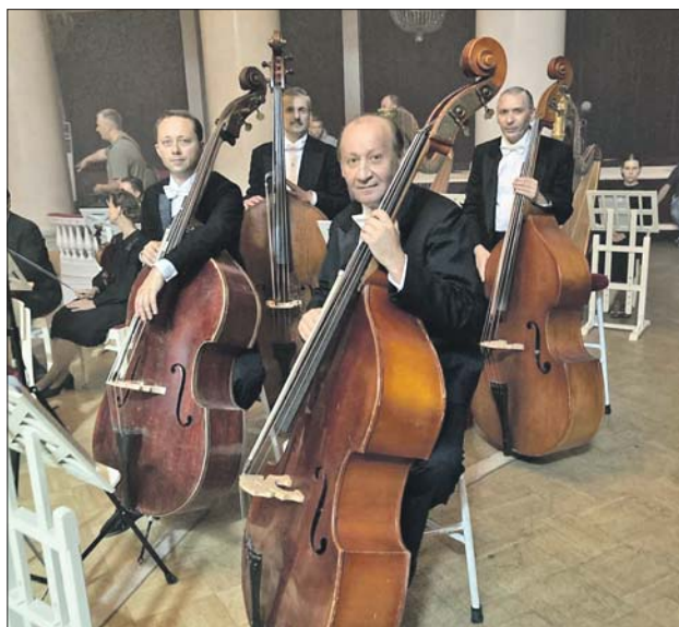
Кадр из сериала «Седьмая симфония»

— Папа был директором предприятия. Как-то он приехал домой пообедать, развернул газету и спросил: «Сын, куда будешь поступать?» Я сказал, что в театральный институт. Папа перевернул страницу и не моргнув глазом произнёс: «А вот Пермское военное училище объявляет набор». И я по-