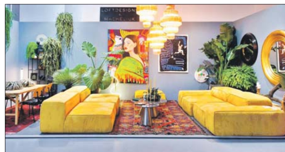
Телеграм-канал мэра Москвы Сергея Собянина t.me/mos_sobyainin

Вход на выставку будет свободный. Нужна только предварительная регистрация на сайте mwdi.ru .