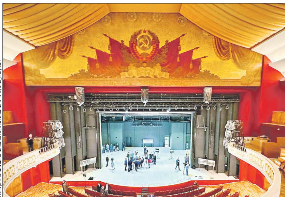
В зале восстановили историческое панно

В своём телеграм-канале Сергей Собянин рассказал о том, как город следит за состоянием театральных зданий. В 85 из них с 2013 года были завершены строительство, реконструкция и капремонт. В их числе театры на Таганке и на Покровке, «Современник», «Геликон-опера», театры Александра Градского, Романа Виктюка и другие, всего четыре десятка.