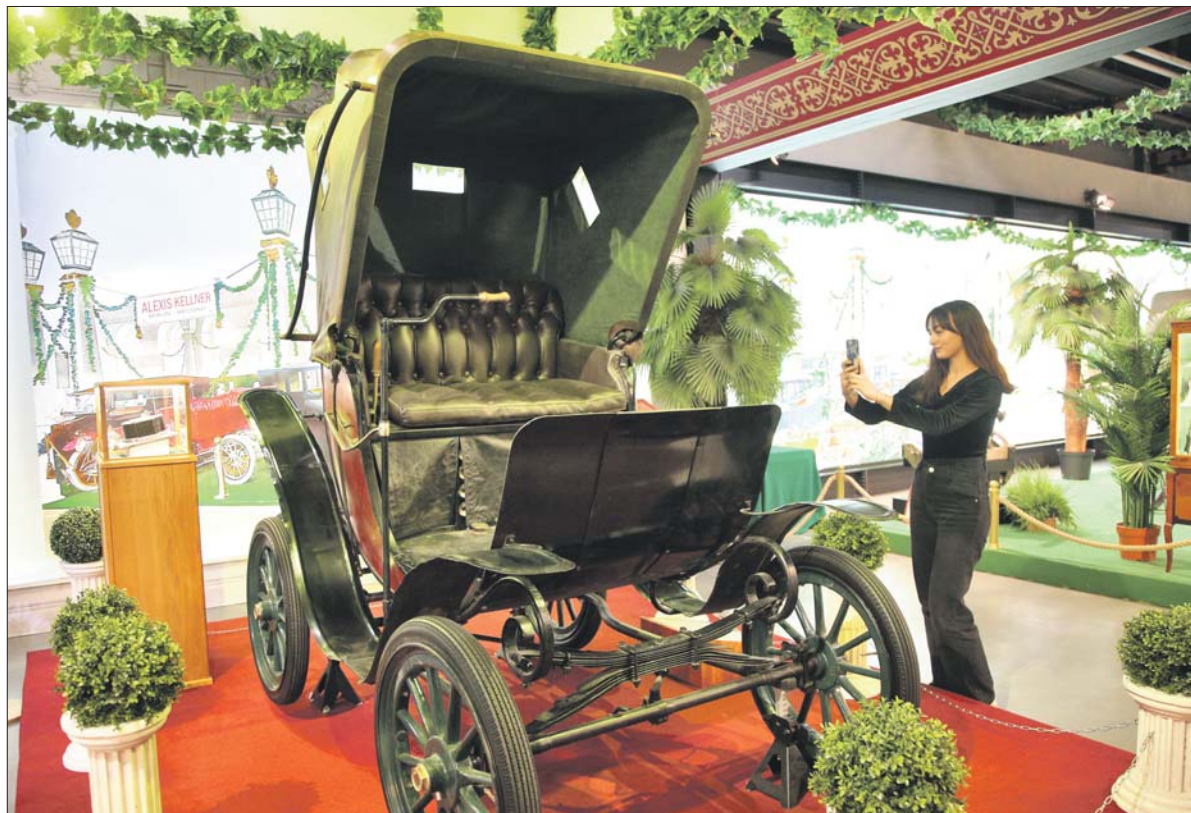
На этой коляске с электромотором члены царской семьи с удовольствием катались по Гатчине

Также представлена диорама о том, как посещал автосалон император Николай II; много макетов старинных авто и архивных снимков.