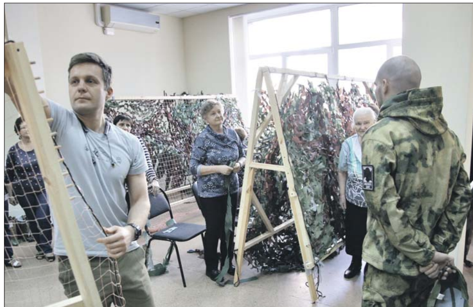
Перед возвращением в часть боец успел посмотреть, как волонтеры делают маскировочные сети

С началом весеннего потепления бойцам часто