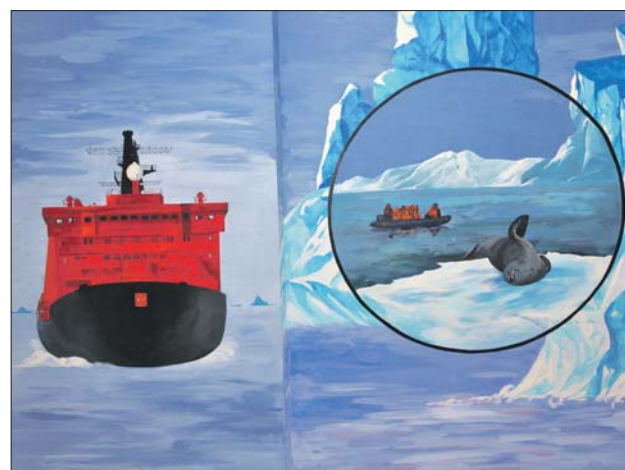
Ничего подобного ни в одной школе ещё не было