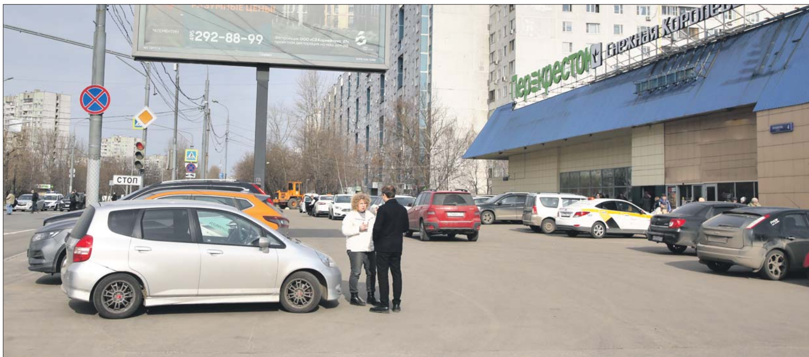
Из-за ширины площадки у ТЦ на улице Плещеева не все водители понимают, что это тротуар — парковаться на нём запрещено

Бесплатную стоянку планируют обустроить неподалёку от станции метро «Бибирево»