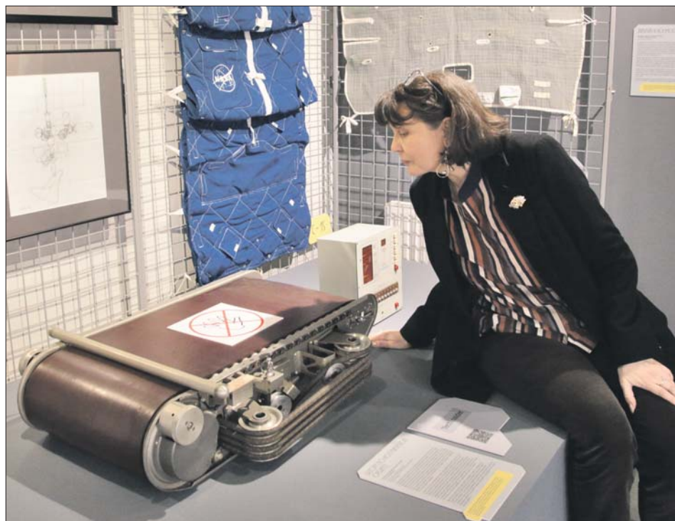
Посетительница новой выставки в Музее космонавтики изучает тренажёр «Бегущая дорожка», созданный в 1980-х

В центре «Космонавтика и авиация», который в этот день ещё и отпразднует своё пятилетие, установят новый экспонат — спускаемый аппарат космического корабля «Восток-6», в котором Валентина Терешкова вернулась из своего первого полёта. Каждый час с 11.00 до 18.00 здесь будут проходить экскурсии, которые прове-