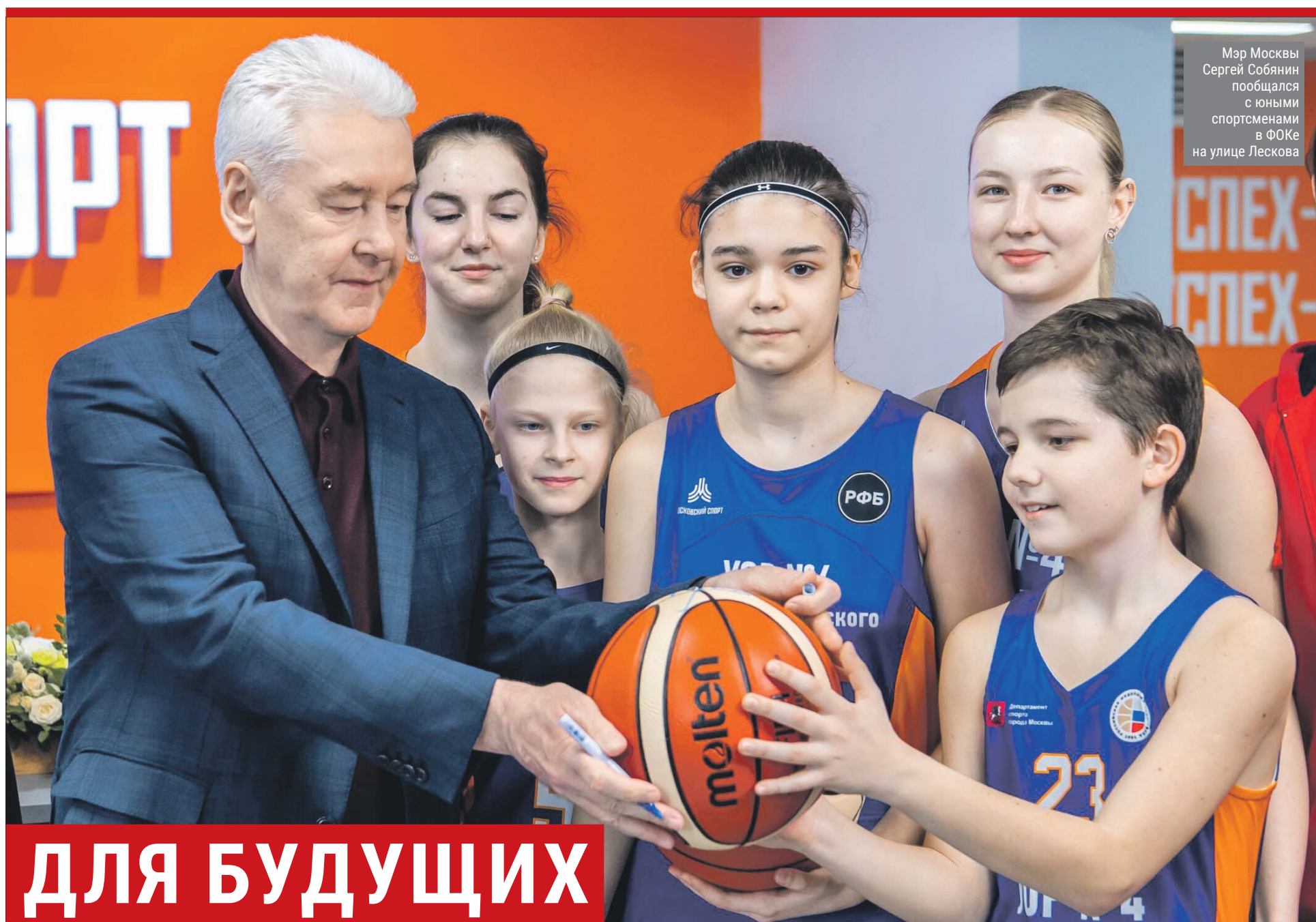
Мэр Москвы Сергей Собянин пообщался с юными спортсменами в ФОКе на улице Лескова

Куда сходить в округе в День космонавтики стр. 15