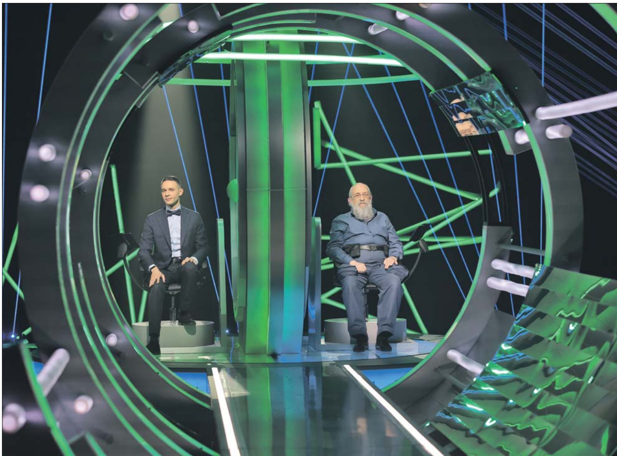
В телешоу «Игры разума» Сергей Малозёмов состязался с Анатолием Вассерманом

ники в этом — современные смартфоны или умные часы, в которых есть шагомеры. Чтобы существенно снизить риск сердечно-сосудистых заболеваний, нужно делать не менее 7 тысяч шагов в день. Многие слышали про 10 тысяч шагов — это условная величина, но вот 2-3 тысяч шагов в день явно недостаточно.