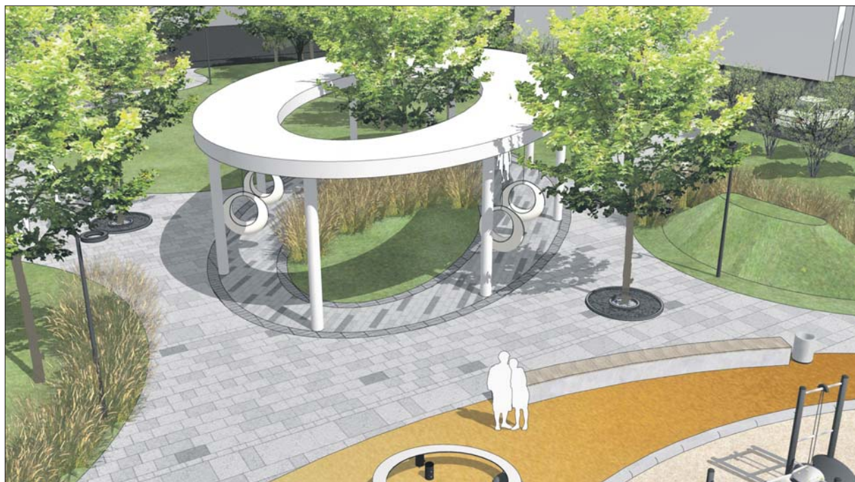
Сайт мэра Москвы Сергея Собянина sobyainin.ru

«По возможности мы расширяем пешеходную зону, сохраняя при этом число полос движения, а значит, и пропускную способность улиц. Меняем покрытие на