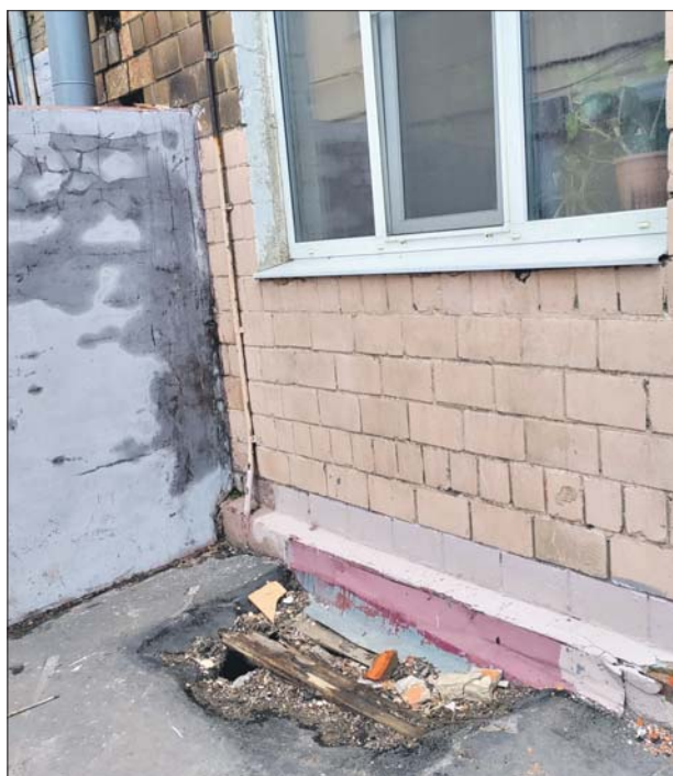
БЫЛО: у дома 4 на улице Бажова разрушился козырёк над приемком

Чаще всего к засору приводит спущенный в канализацию наполнитель из кошачьего лотка