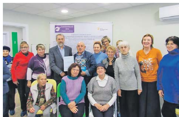
Лектор и «серебряные» волонтеры — участники одного из мероприятий

Участники проекта получили навыки самоконтроля состояния здоровья глаз без