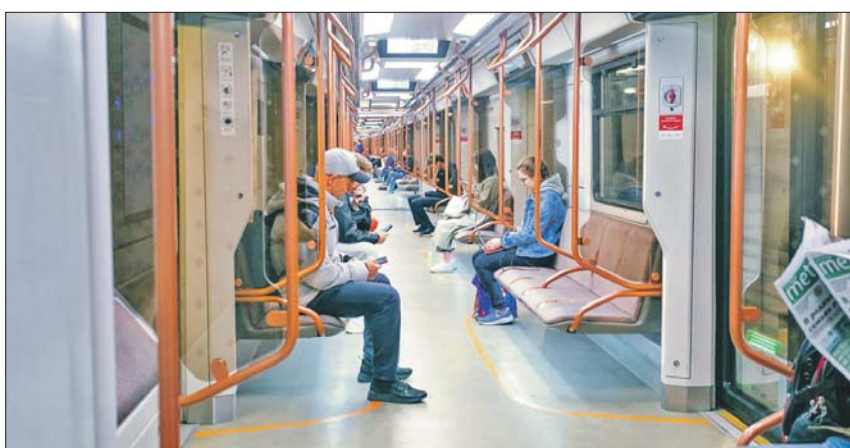
Просторные и тихие вагоны поездов «Москва-2020» оснащены зарядками для гаджетов

Всего в столичный метрополитен в этом году поступят около 300 вагонов для поездов «Москва-2020».