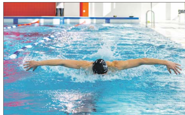
В бассейне размером 25 на 16 метров шесть дорожек

По программе «Мой район», разработанной по инициативе Сергея Собянина, в Бибиреве создают комфортные условия для проживания. Реконструирован кинотеатр «Будапешт», от-