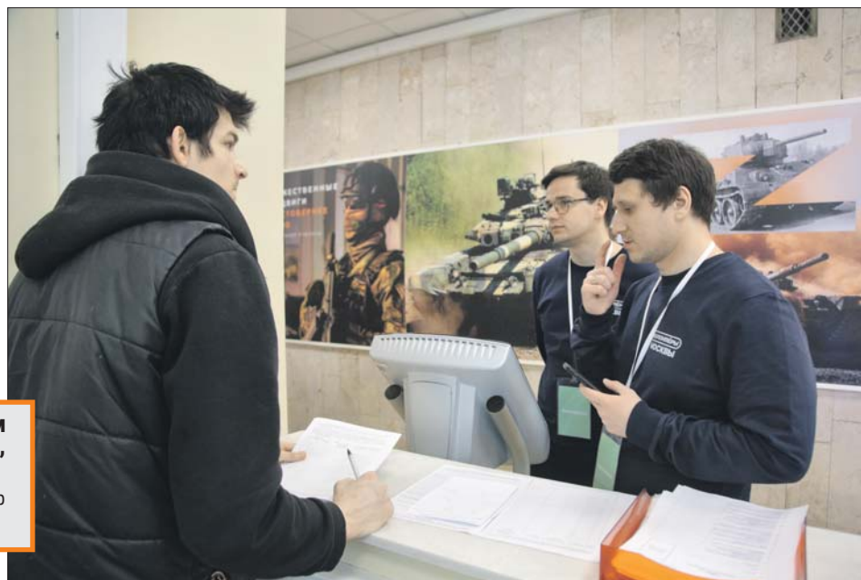
Первым делом кандидаты заполняют анкету

около 100 посетителей. Однако, если будет необходимость, число сотрудников увеличат, и тогда в день пункт смогут посетить около 300 человек.