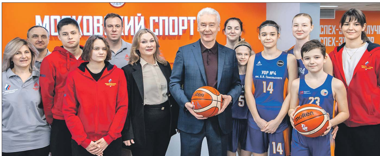
В день открытия ФОКа Сергей Собянин пообщался с воспитанниками и тренерами спортивного училища №4 имени Гомельского

В Бибиреве появилось место, где смогут тренироваться и играть все желающие