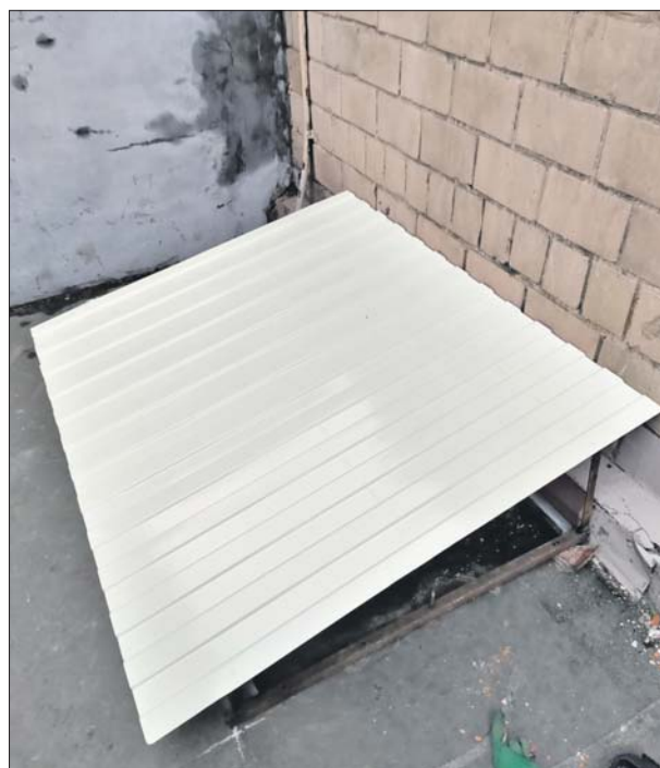
СТАЛО: коммунальщики быстро исправили положение