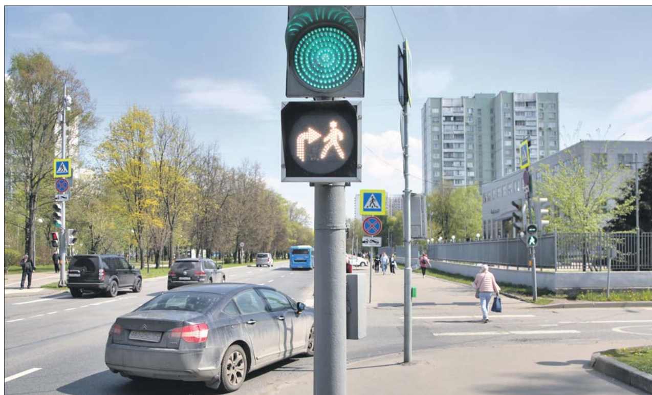
На пересечении Череповецкой и Новгородской улиц

Однако, как сообщили в ЦОДД, в Москве выделять зону платной парковки синей разметкой в ближайшее время не планируют. Ведь возле таких стоянок всегда есть предупреждающие знаки. Их регулярно чистят, изображения на табличках хорошо видны даже в непогоду.