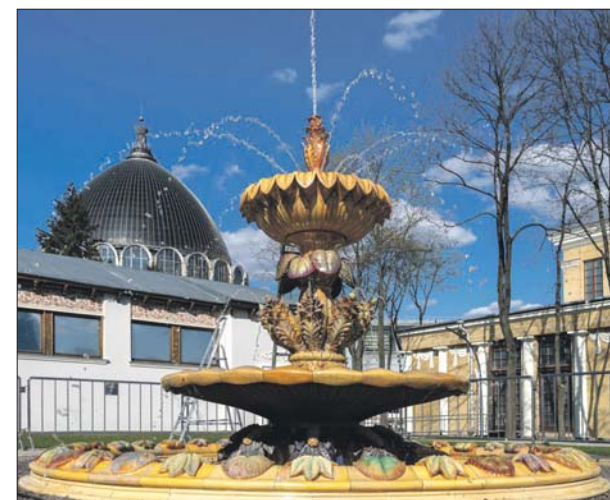
Сайт мэра Москвы Сергея Собянина sobyanin.ru

В столице открылся сезон фонтанов, на ВДНХ их более 20