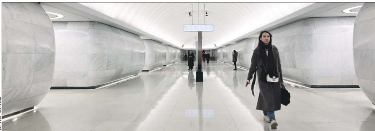
В оформлении станции «Марьина Роща» преобладает эстетика фарфора

— Мне и «Рижская» нравится, и «Сокольники», и рыбы на стенах станции «Нагатинский Затон». В первые дни после открытия движения мы с однокурсниками ездили по ним, просто чтобы полюбоваться, — призналась девушка.