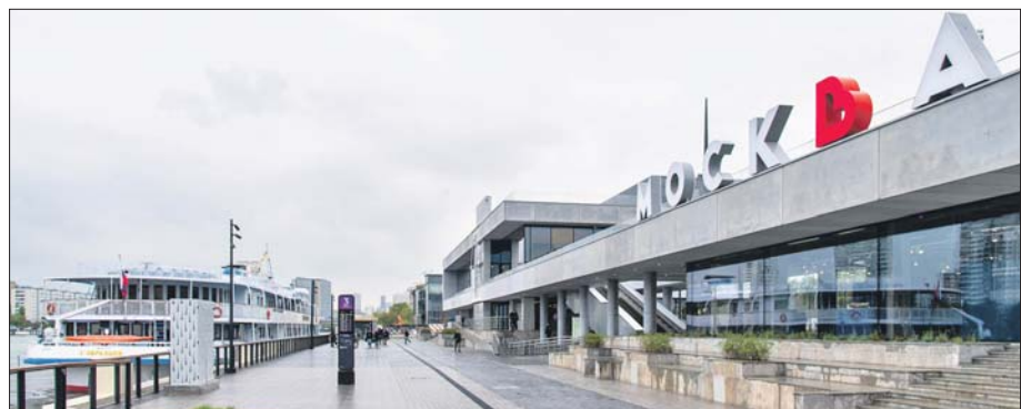
Отсюда лайнеры будут уходить в 30 городов России

смотровую площадку. В здании вокзала откроется выставочное пространство Музея транспорта Москвы.