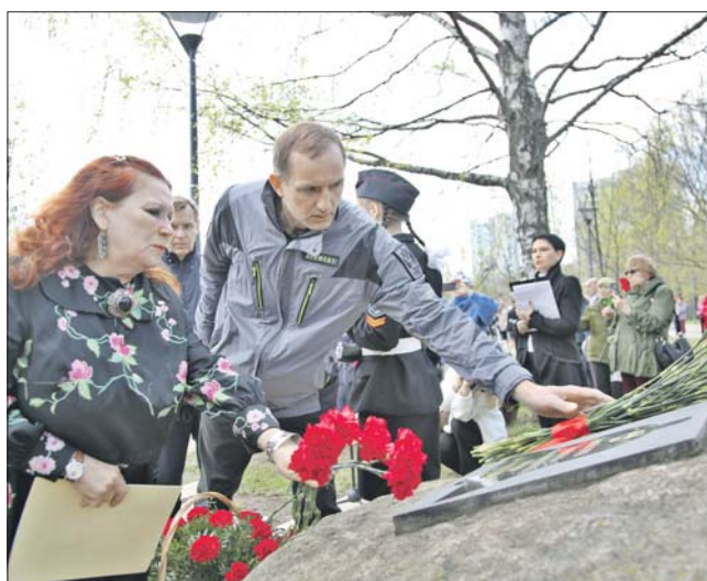
Префект СВАО Алексей Беляев возложил цветы к памятному камню