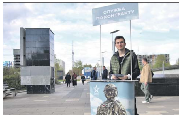
Инфостенд у станции метро «Марьино Роща»

— Сам я староват, но для молодёжи служба по контракту может стать хорошим