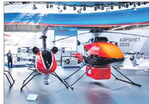
Беспилотники вертолётного типа востребованы в сельском хозяйстве

— Уже сегодня это центр беспилотного авиастроения. Лучшие предприятия страны размещаются здесь, начиная от стартапов, ла-