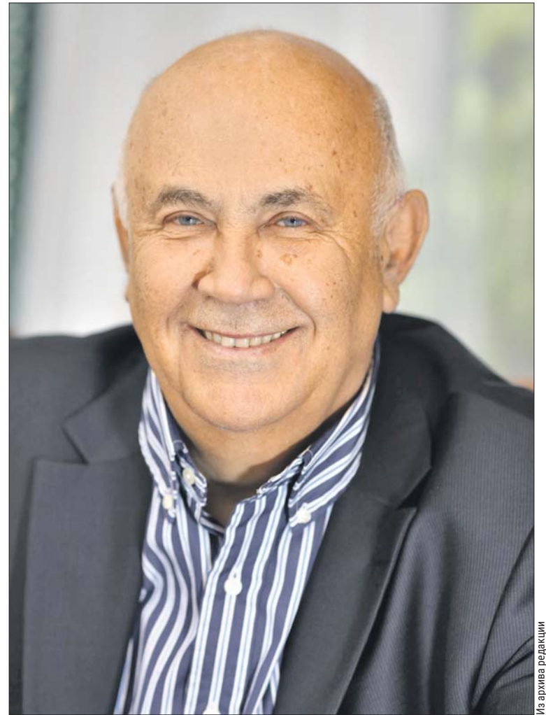
Владимир Григорьевич умел радоваться жизни

В 1990-х годах всё Правительство Москвы по выходным играло в футбол — был такой порыв.