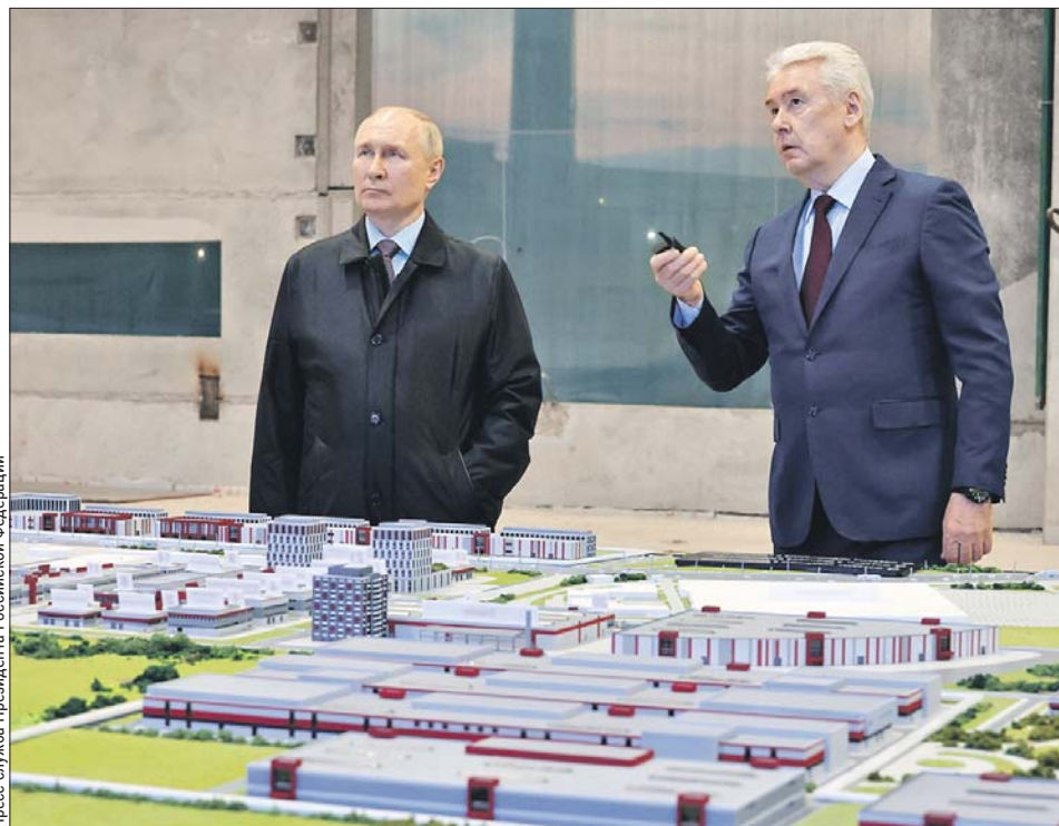
Сергей Собянин рассказал Владимиру Путину о развитии технопарка «Руднёво»

Сейчас Москва снова превращается в индустриальный центр XXI века, где создают новые заводы. Начиная с 2018 года объём производства в городе вырос в два раза. Современные производства экологически чистые и требуют большого количества высококвалифицированных инженеров и рабочих — таким в столице самое место. — Я уверен, что всё будет сделано. Это индустриаль-