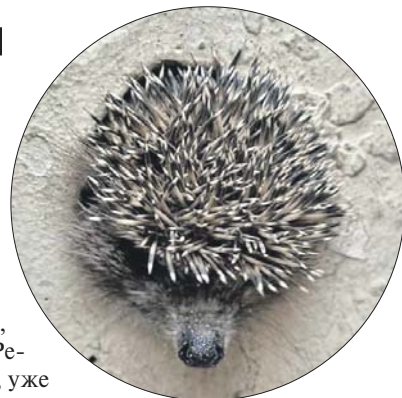
Зверёк застрял в отверстии бетонного забора