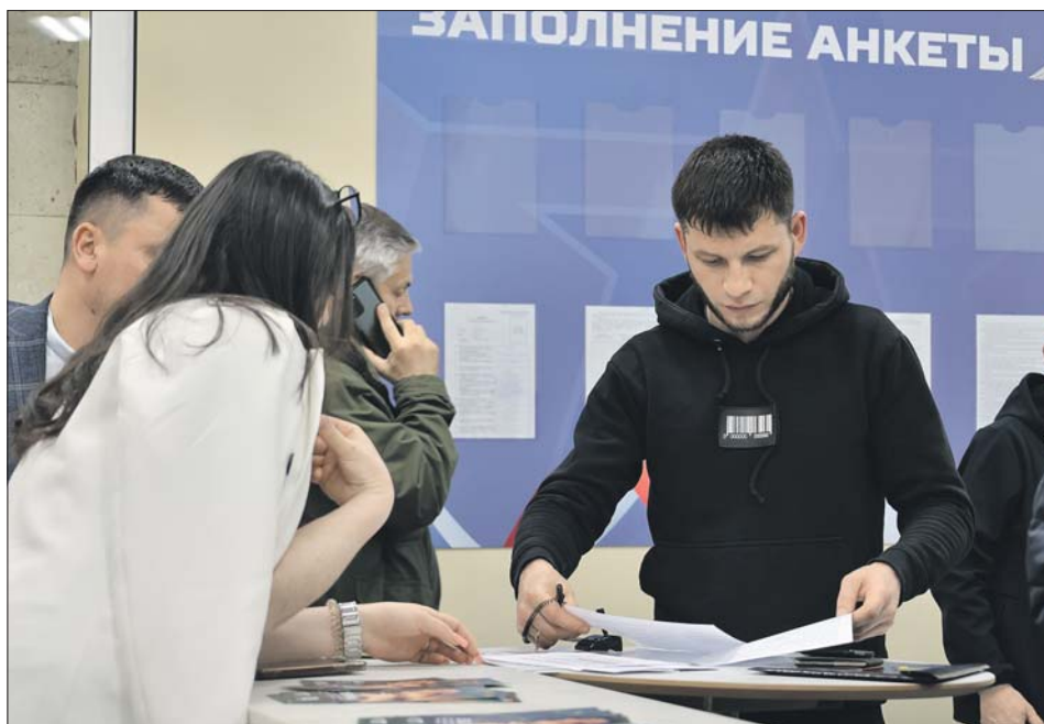
Сначала кандидат заполняет анкету, а после проверки документов его вызывают к специалистам

На улице Яблочкова идёт отбор на контрактную службу