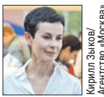
Ирина Апексимова / Агентство «Москва»