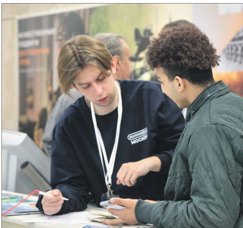
Кандидаты заполняют анкету, пройдут медосмотр и профессионально-психологический отбор

Пункт отбора посещают известные актёры, телеведущие. Впечатления от того, как организован приём, у них позитивные. Заслуженный артист РФ