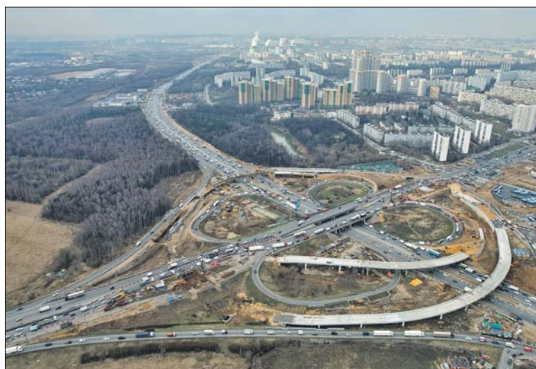
На современной развязке будут направленные съезды

Реконструкция Липецкой развязки позволит обеспечить беспрепятственный выезд на федеральную трассу М-4 «Дон». За счёт