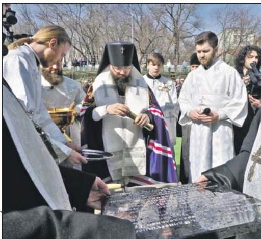
Чин освящения закладной капсулы