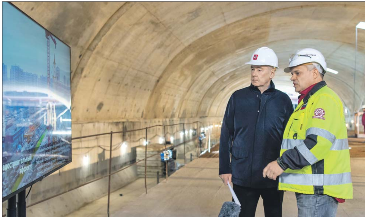
Мэр Москвы Сергей Собянин и генеральный директор АО «Мосметрострой» Сергей Жуков на строящейся станции «Физтех»

«Физтех» — это станция мелкого заложения с двумя вестибюлями, выходящими к Дмитровскому шоссе, к остановкам наземного транспорта и к жилой и общественной застройке. Её главным украшением станут световые колонны в центре платформы. Меж-