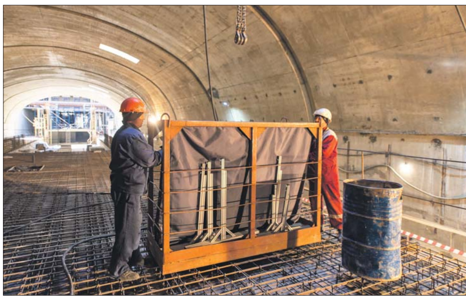
Метростроевцы за работой