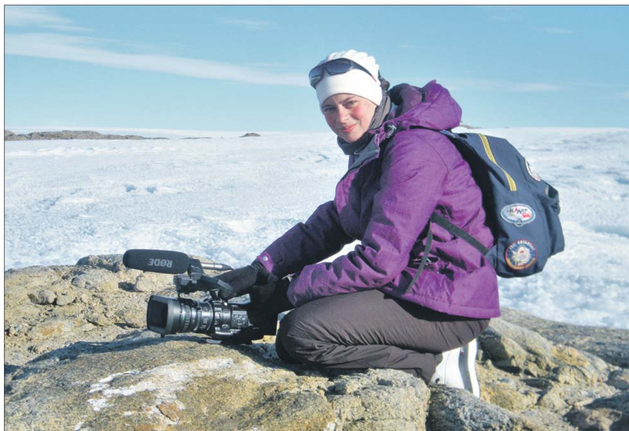
Выпускница ВГИКа приняла участие уже в семи экспедициях и сняла четыре фильма

Зимовка в Антарктиде — это вовсе не три месяца,