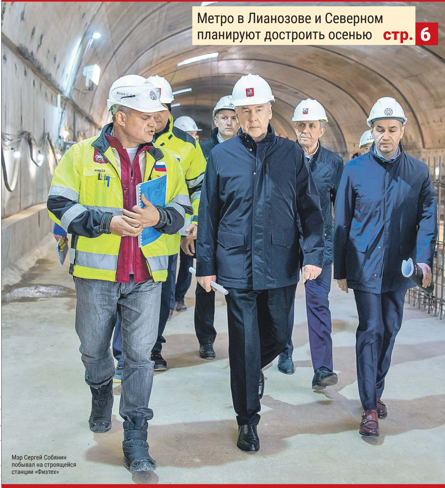
Мэр Сергей Собянин побывал на строящейся станции «Физтех»

Метро в Лианозове и Северном планируют достроить осенью стр. 6