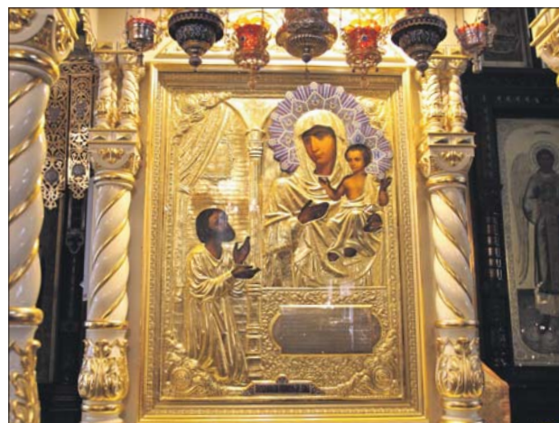
Икона Божией Матери «Нечаянная Радость»

Верующие отстояли всю службу по неписаному уставу: стой прямо, внимай благоговейно. Кто мог, опускался на колени. Женщины с покрытыми головами бешумно, как тени, передвигались по церкви, припадая к иконам устами. Под иконами стояли благоуханные цветы в вазах.