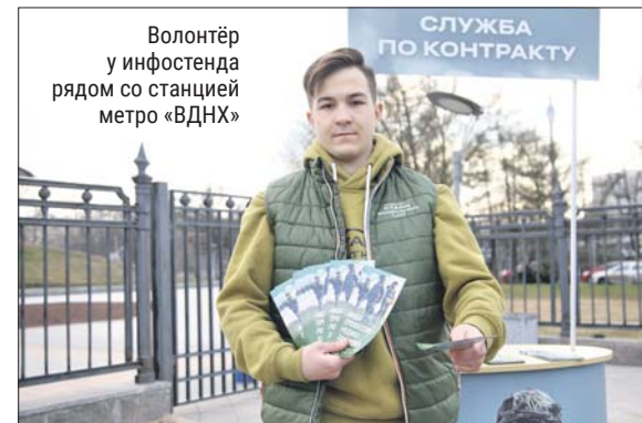
Волонтер у инфостенда рядом со станцией метро «ВДНХ»