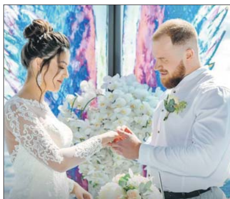
Молодожёнов ждут более 30 необычных площадок

На выездных площадках и во дворцах бракосочетания будут бесплатно работать профессиональные фотографы.