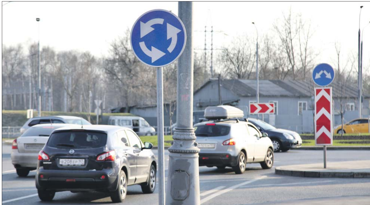
У перекрёстка с круговым движением на Сигнальном проезде

Если стоит только знак со стрелками, надо пропустить всех, кто уже едет по кругу