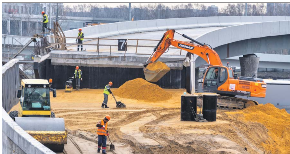
Строительные работы на развязке МКАД с Липецкой улицей

Выезд на федеральную трассу «Дон» станет удобнее и быстрее