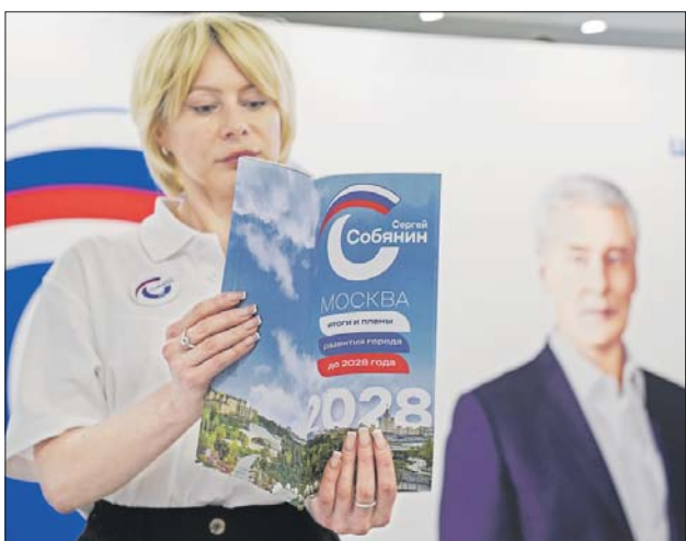
Пелагия Тихонова/Агентство «Москва»

Штаб общественной поддержки кандидата работает по адресу: улица Покровка, 47