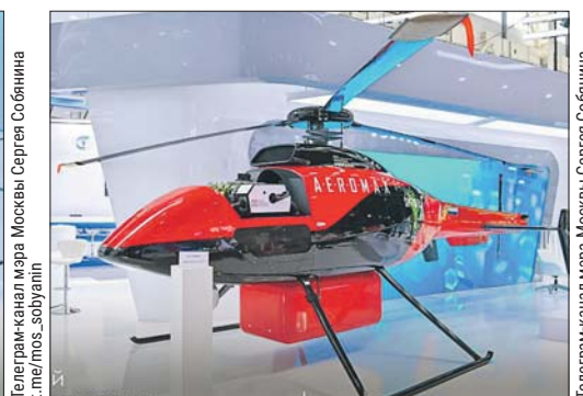
...и беспилотный вертолёт от «Аэромакс»

Дальность полёта позволят увеличить водородные двигатели