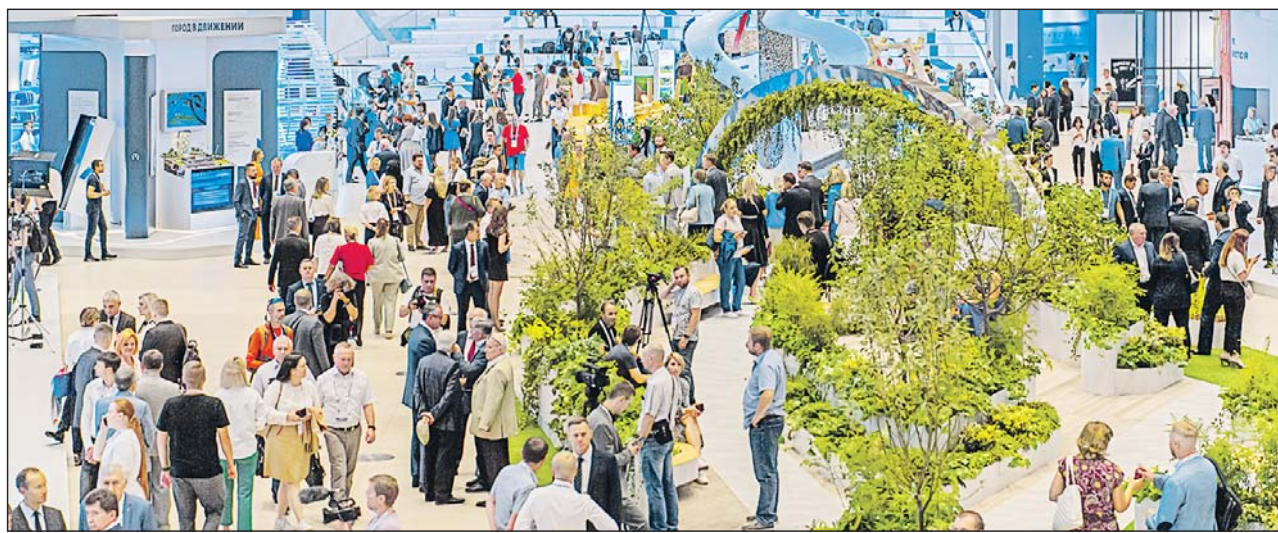
Выставка «Город для каждого» на Урбанфоруме в 2022 году

Начать путешествие по форуму можно будет с павильона «Куб» Комитета по туризму. Уникальная аудиовизуальная экспозиция и шоу «Почувствуй свой город» расскажут о развитии Москвы за последние 12 лет. На площадке Департамента культуры выступят артисты и творческие коллективы. В павильоне Департамента информационных технологий посетители совершат виртуальную прогулку по городу. Для любителей активного отдыха Департамент спорта откроет экстрим-парк. Кроме того, жителей и гостей столицы приглашают посетить модное пространство, две