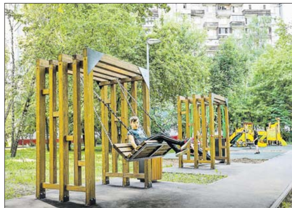
Площадка на Челюскинской ул., 14, корпус 2, теперь выглядит так

Все проекты разрабатывают с учётом пожеланий горожан. Чаще всего москвичи просят установить дополнительное освещение, скамейки, обновить детские и спортивные площадки.