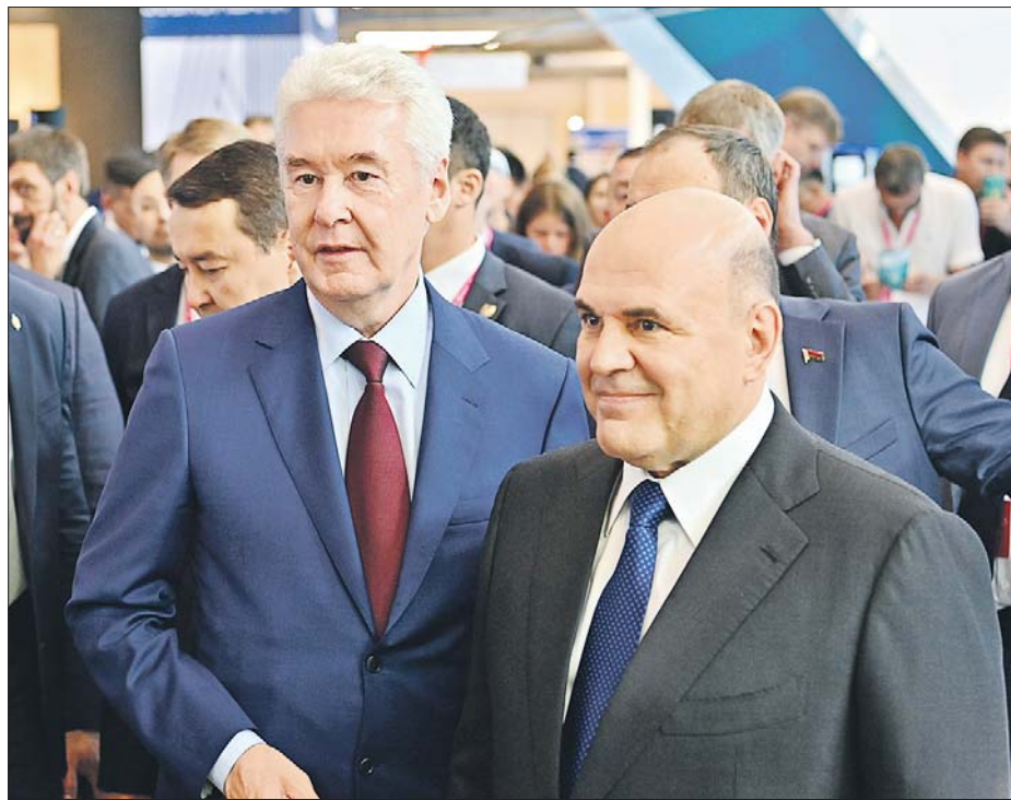
Сергей Собянин и Михаил Мишустин на выставке «Иннопром-2023» в Екатеринбурге