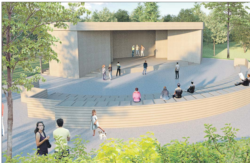
Проектное решение эстрадной зоны в парке «Долгие пруды»

Реконструировали станции электричек Новодачная и Долгопрудная, построили дублёр Дмитровского шоссе вдоль Савёловского направления МЖД и развязку Дмитровского и Долгопрудненского шоссе, пустили два новых автобусных маршрута.