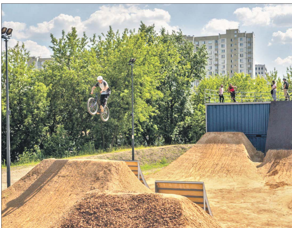
В парке «Яуза» в районе Северодвинской улицы недавно открыли профессиональный дёрт-трек — трассу для катания и трюков на велосипедах