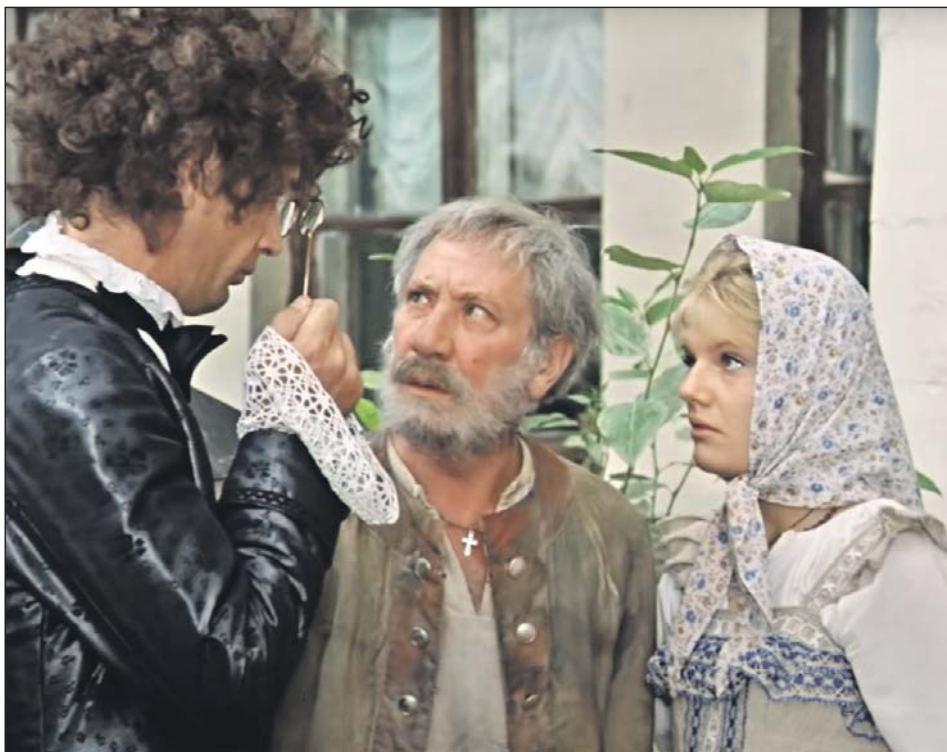
Александр Абдулов, Николай Скоробогатов и Александра Захарова в фильме «Формула любви» режиссёра Марка Захарова.