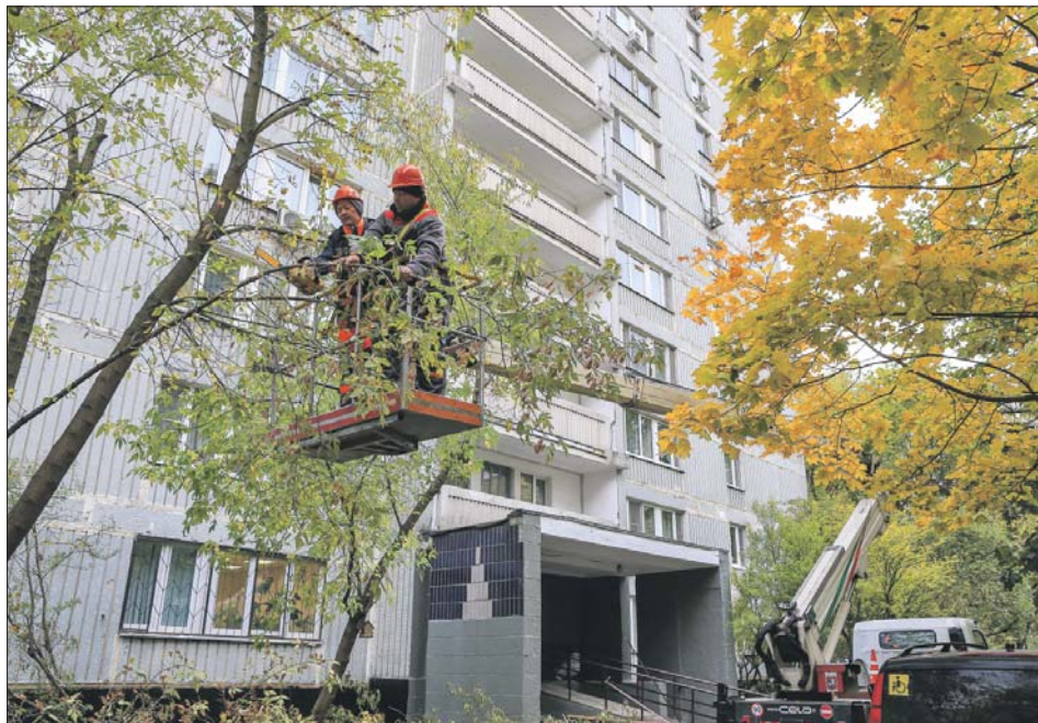
Сотрудники «Жилищника» оперативно провели работы у дома 17 в Зубаревом переулке

Ответить на заявку коммунальщики должны в течение 10 дней