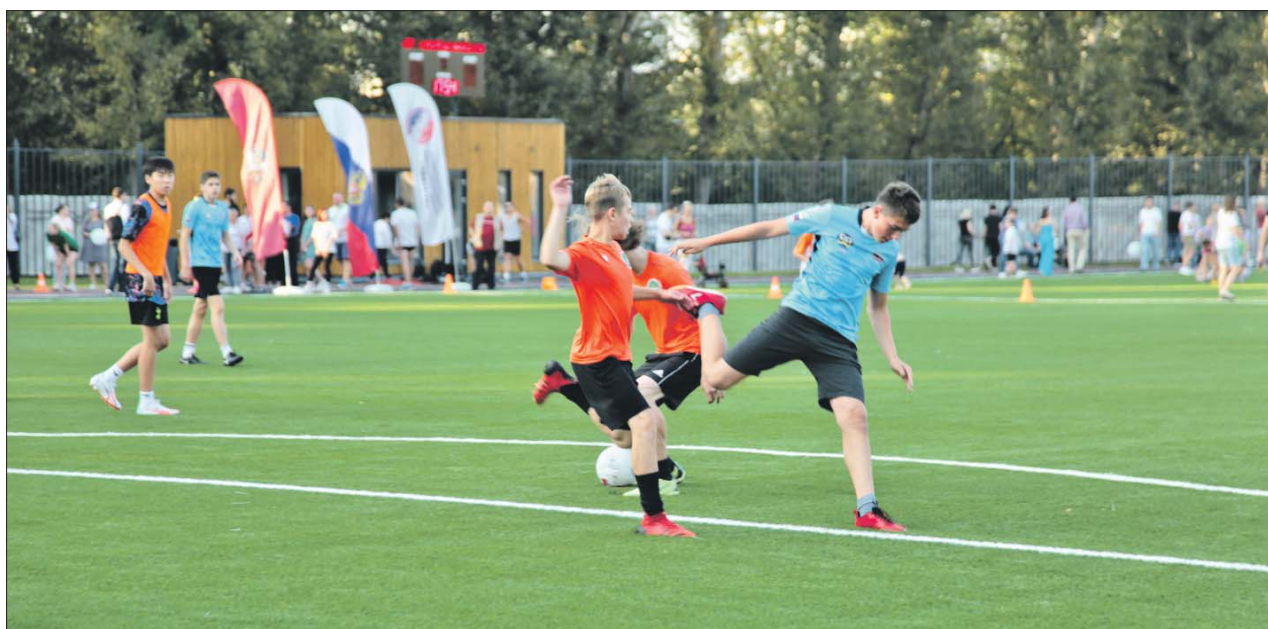
В этом году преобразился стадион в Свиблове, в скором будущем там планируют возвести ещё и крытую ледовую арену