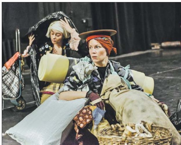
Действие спектакля «Зверь» разворачивается на руинах цивилизации

В Московском Новом драматическом театре премьера — спектакль «Зверь» по пьесе Михаила Гиндина и Владимира Синакевича (12+). Действие происходит на руинах цивилизации, погибшей в результате то ли мировой войны, то ли ядерной катастрофы. Главные герои — отец, мать и дочь — те немногие, кто смог уцелеть. Они скитаются по выжженной пустыне, ночуют в развалинах, питаются чем придётся. Всё меняется с появлением странного, покрытого шерстью существа — Зверя. По мнению художественного руководителя театра и ре-