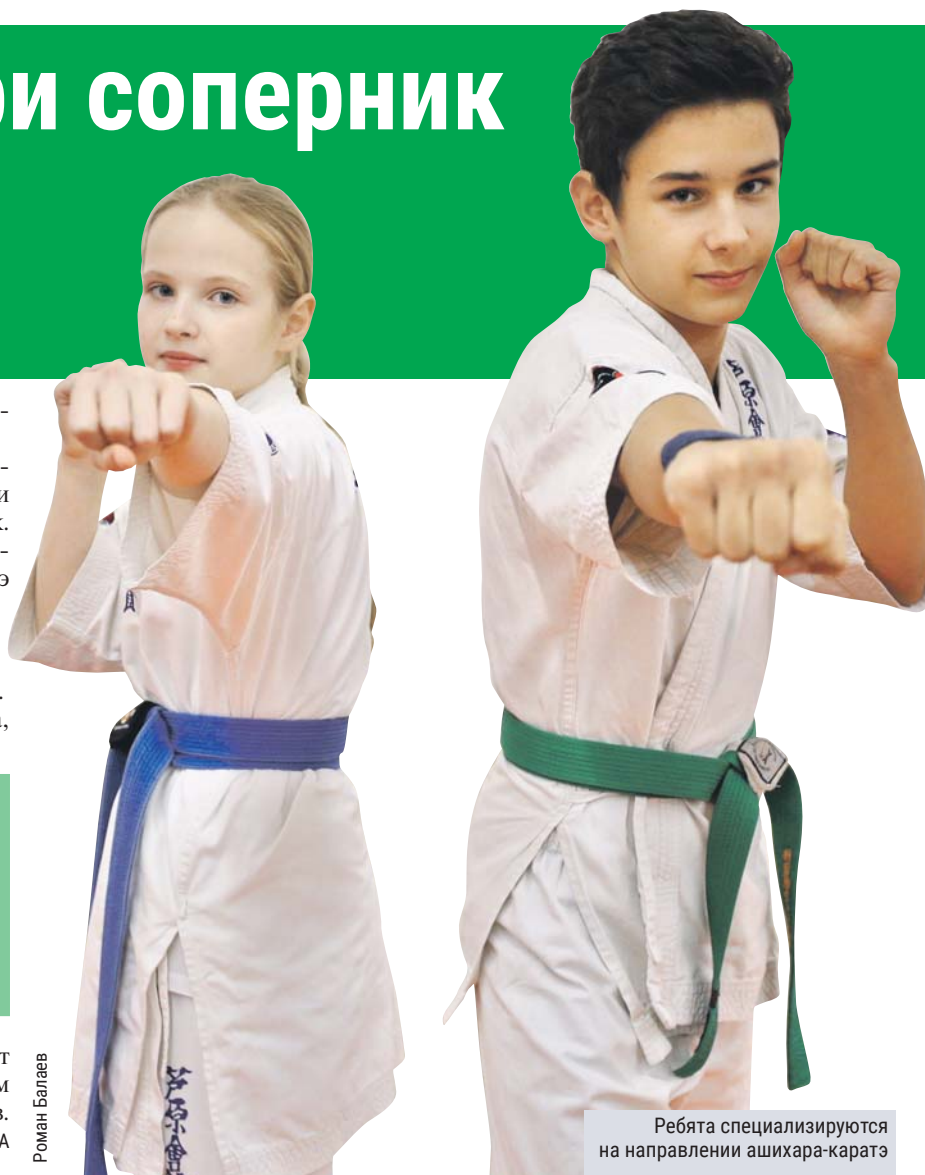
Ребята специализируются на направлении ашихара-каратэ