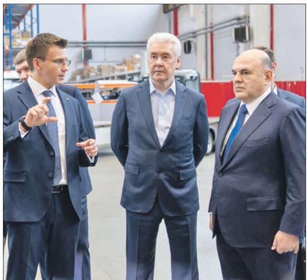
В технопарке «Калибр» — два предприятия лёгкой промышленности. Производственные площадки компаний-резидентов Сергей Собянин и Михаил Мишустин посетили 29 мая 2023 года

Напомним, «Калибр» сегодня — одна из крупнейших площадок высокотехнологичной промышленности, созданная при поддержке города. Среди резидентов технопарка компании, которые специализируются на развитии информационных технологий, беспилотном транспорте, приборостроении, металлообработке, креативных индустриях.