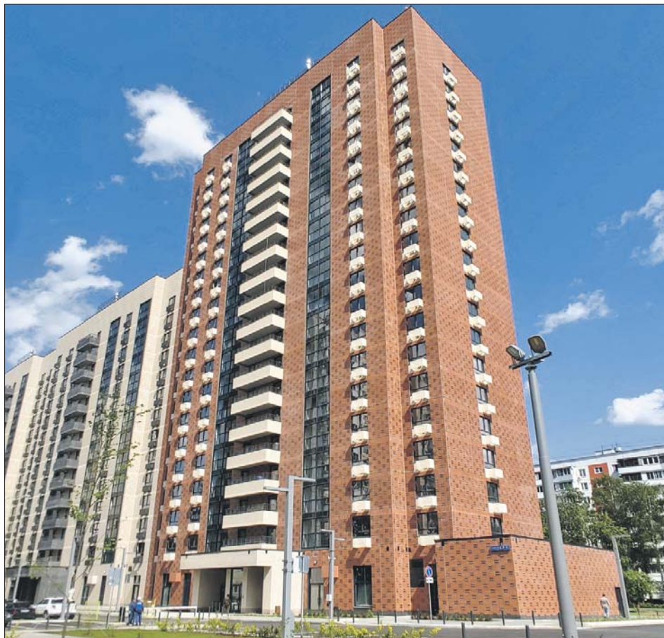
Осенью участники программы реновации в Лосиноостровском районе начали переезжать в новый дом на Тайнинской улице

— В Департаменте капремонта я как раз отвечал за часть работ, связанных с модернизацией поликлиник. За четыре года реализации программы мы накопили уникальный опыт максимально быстрого и безболезненного обновления поликлиник. Сформированы эффективные команды реконструкции в медицинском сообществе и в Комплексе городского хозяйства, который отвечает за строи-