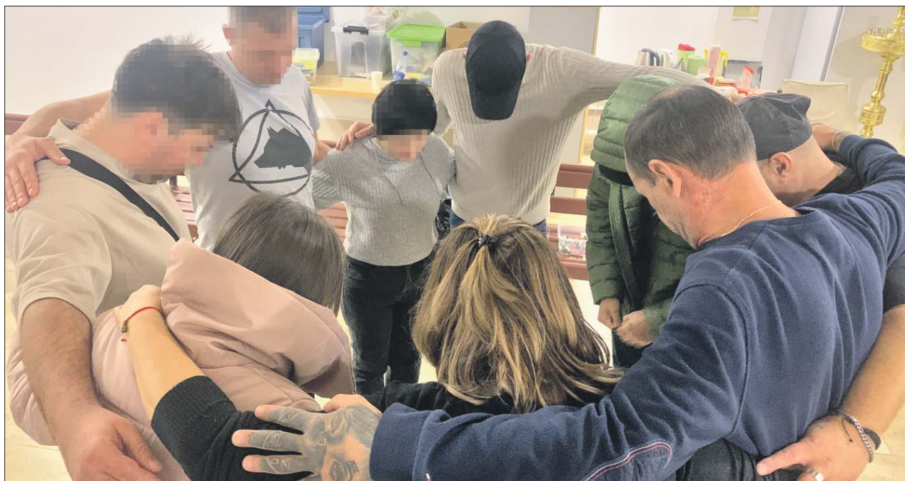
Сообщество химически зависимых, как и другие анонимные группы, опирается на программу «12 шагов»

В Марьиной роще людям помогают бороться с зависимостью от токсичных веществ