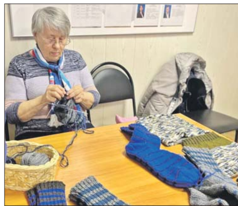
Волонтеры также вяжут для солдат шерстяные носки