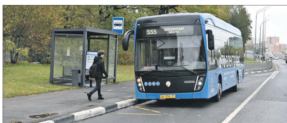
Электробус курсирует между станцией метро «Физтех» и МФТИ. Для студентов проезд бесплатный

«Бесшумные, экологичные, надёжные электробусы идеально подходят для такого динамичного мегаполиса, как Москва. Поэтому количество электробусных маршрутов будет только расти», — подытожил мэр.