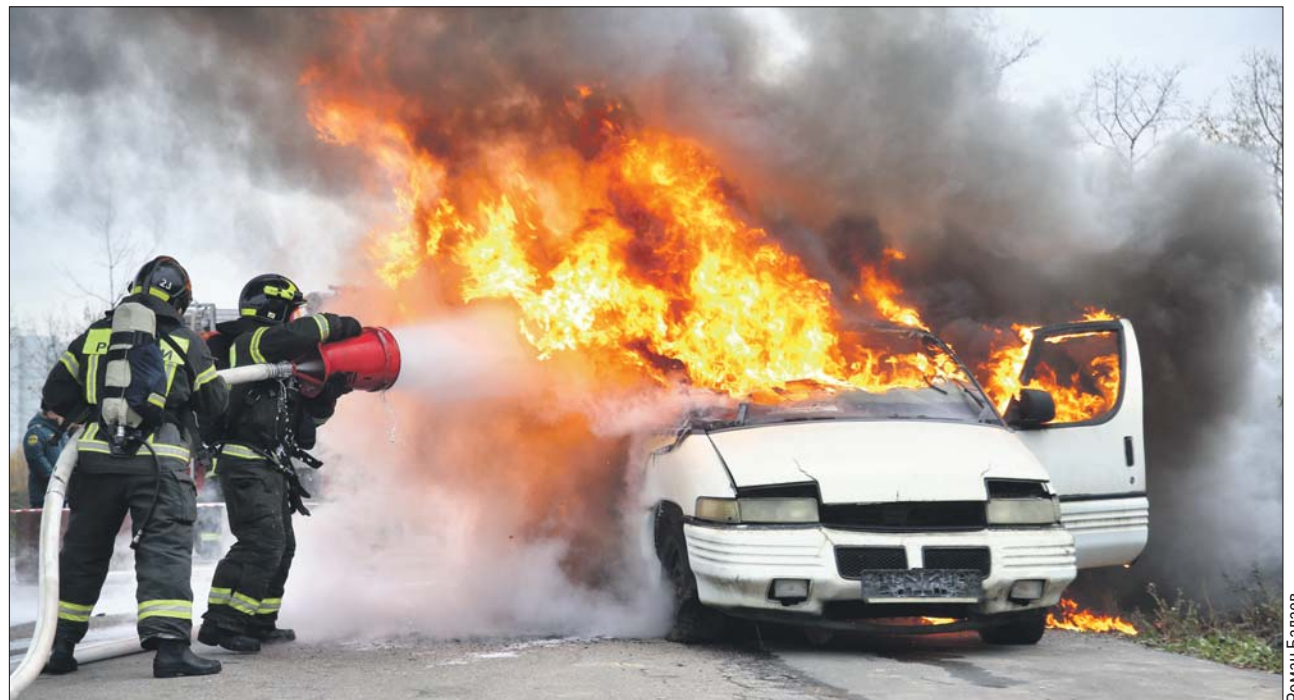
Тренировка сотрудников МЧС прошла на Джемгаровской улице

Такие учения проводят регулярно: аварии с возгоранием на дорогах и пожары в стоящих на парковке машинах случаются нередко. Например, не так давно жительница Холмогорской