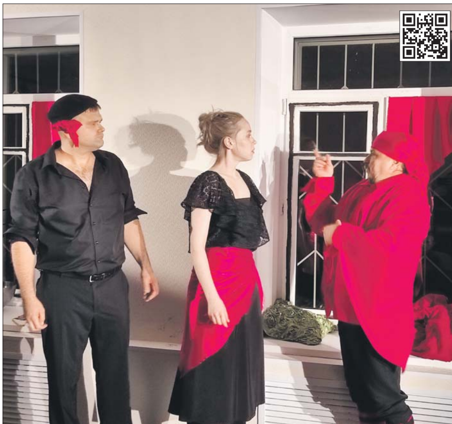
Театр-студия «Гротеск»: сцена из постановки по рассказам А.П.Чехова

На бесплатные спектакли приглашает театр-студия «Гротеск» при филиале «Норд» спортивно-досугового центра «Кентавр».