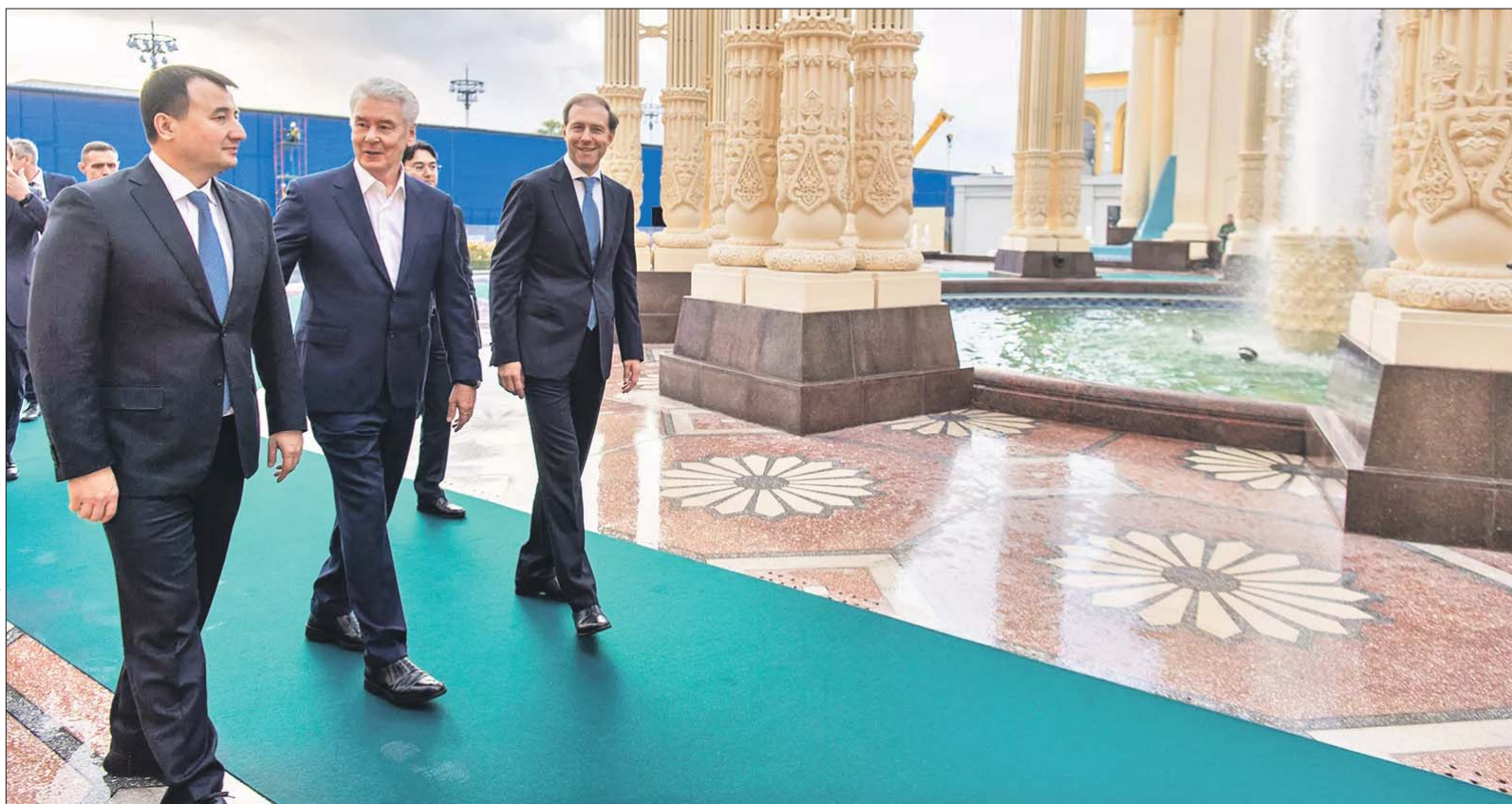
Недавно на ВДНХ открылся отреставрированный «Узбекистан»