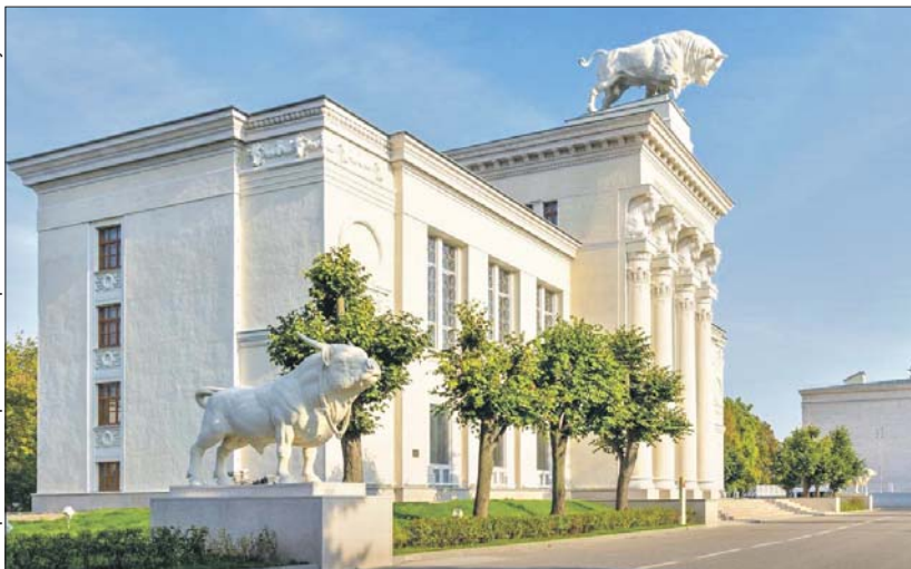
В павильоне №51 воссоздали первоначальный вид парадного входа

Телеграм-канал мэра Москвы Сергея Собянина t.me/mos_sobyanin