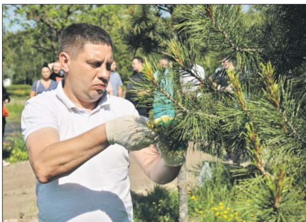
Хвойные растения требуют особого подхода

Коммунальщики также задавали вопросы о конкретных случаях из своей практики. К примеру, садовник из Отрадного поинтересовался, что могло стать причиной загнивания корней после мульчирования (мульча — мелкая щепа,