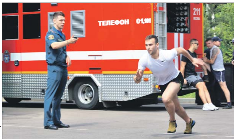
Оценивались практические навыки, физподготовка, знание теории

4 июня на учебной базе Департамента по делам гражданской обороны, чрезвычайных ситуаций и пожарной безопасности столицы состоялся финал ежегодного конкурса «Московские мастера» по профессии «пожарный». На площадке в Апаринках встретились сильнейшие пожарные из всех округов столицы.