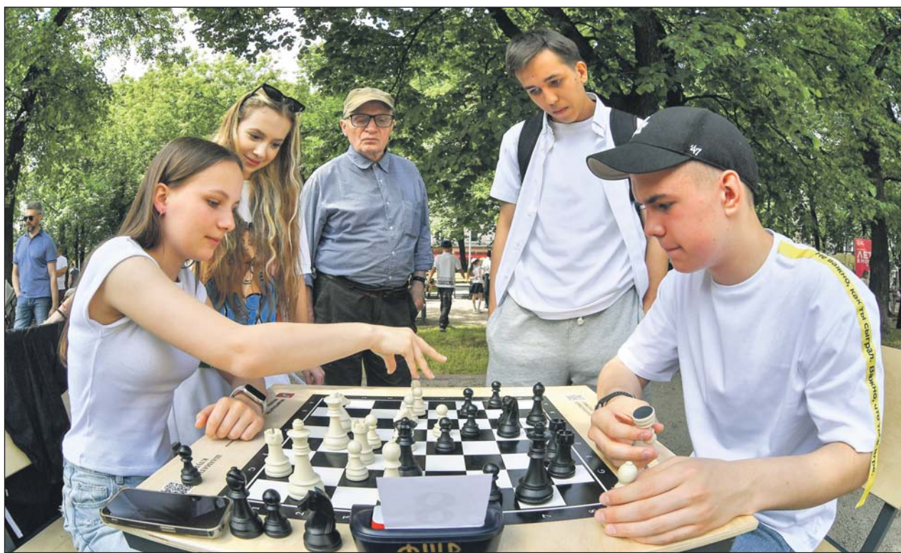
На Гоголевском бульваре открылся летний шахматный клуб

➤ Полная программа доступна на сайте go.mos.ru . Здесь также можно выбрать площадку, чтобы самому организовать мероприятие.