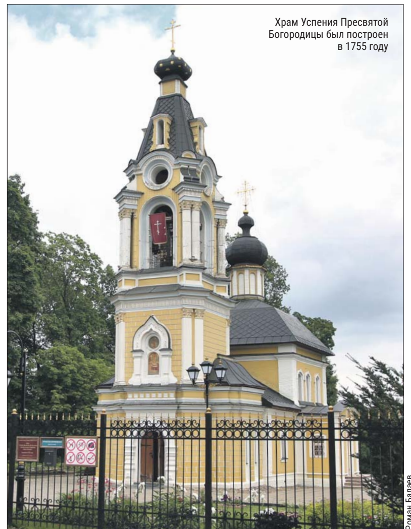
Храм Успения Пресвятой Богородицы был построен в 1755 году

ют машину у этого дуба, выходят, гуляют, Клаус восхищается природой, философствует, как вдруг раздаётся выстрел, и он падает в пруд, — объясняет экскурсовод. — А Челобитьевское шоссе играло роль дороги из Берлина в Берн. Когда Штирлиц прогуливается с фрау Заурих (её играет Эмилия Мильтон), за ними виднеется колокольня церкви Успения Пресвятой Бо-