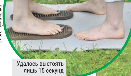
Удалось выстоять лишь 15 секунд

Но через пару часов вдруг ощущаю небывалый при-