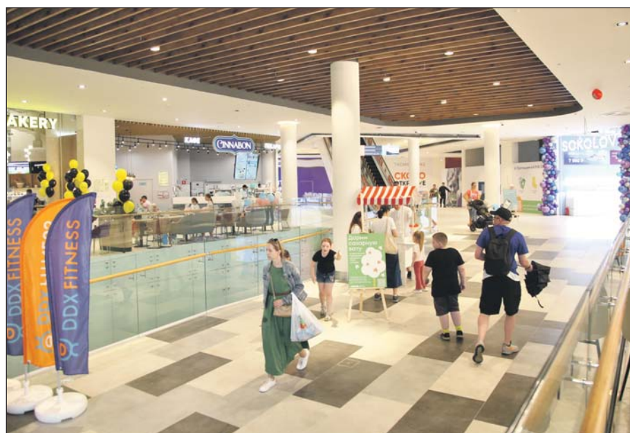
На первом этаже разместились магазины и фуд-холл