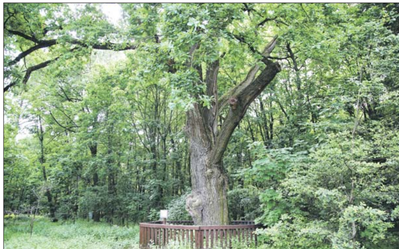
Этому дубу около 350 лет

— В конце 2-й серии «Семнадцати мгновений весны» Штирлиц, которого играет Вячеслав Тихонов, с агентом Клаусом в исполнении Льва Дурова едут в лес. Оставля-