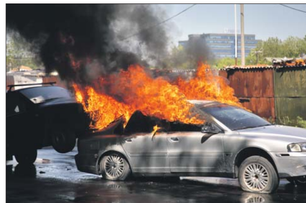
По сценарию после аварии загорелись «Вольво» и «Москвич»...

На спасение людей ушли считанные минуты. Значит, и при реальном ДТП бойцы окружного МЧС не рас-