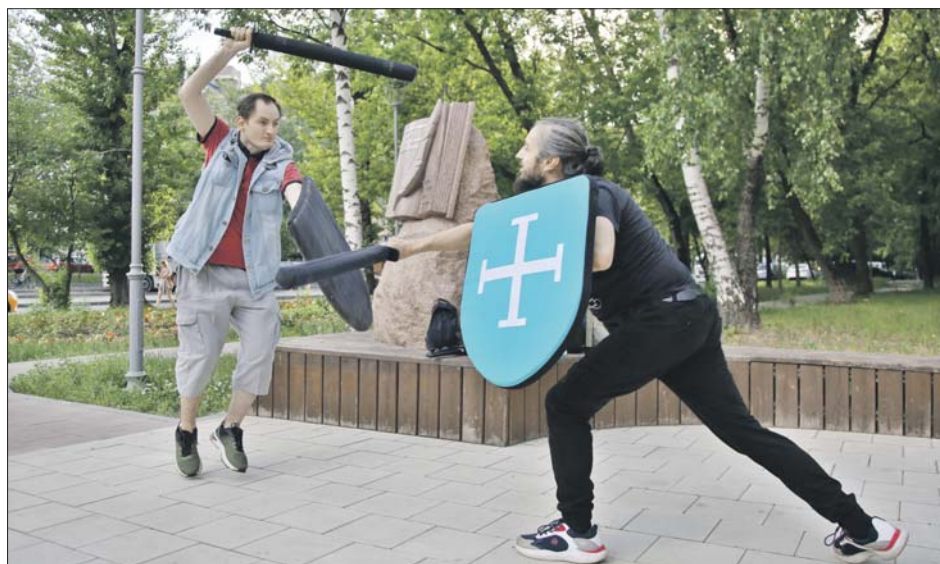
Разные исторические программы и мастер-классы устраивают почти каждый день

В нашем округе тоже много интересного. Тех, кто любит делать что-то своими руками, 12 июня в 12.00 ждут на фестивальной площадке в сквере на улице Хачатуряна. Здесь пройдёт мастер-класс по авиамоделирова-