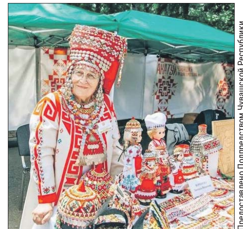
Гостей познакомят с национальными обычаями