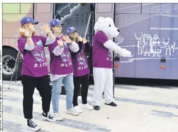
Посетителей необычного музея ждёт интерактивная программа

На экомарафон «Каникулы в Арктике» приглашает парк «Яуза» и одноимённый экоцентр (Юрловский пр., 10/4). С 12 по 14 июня здесь можно посетить первый в России арктический автобус-музей.