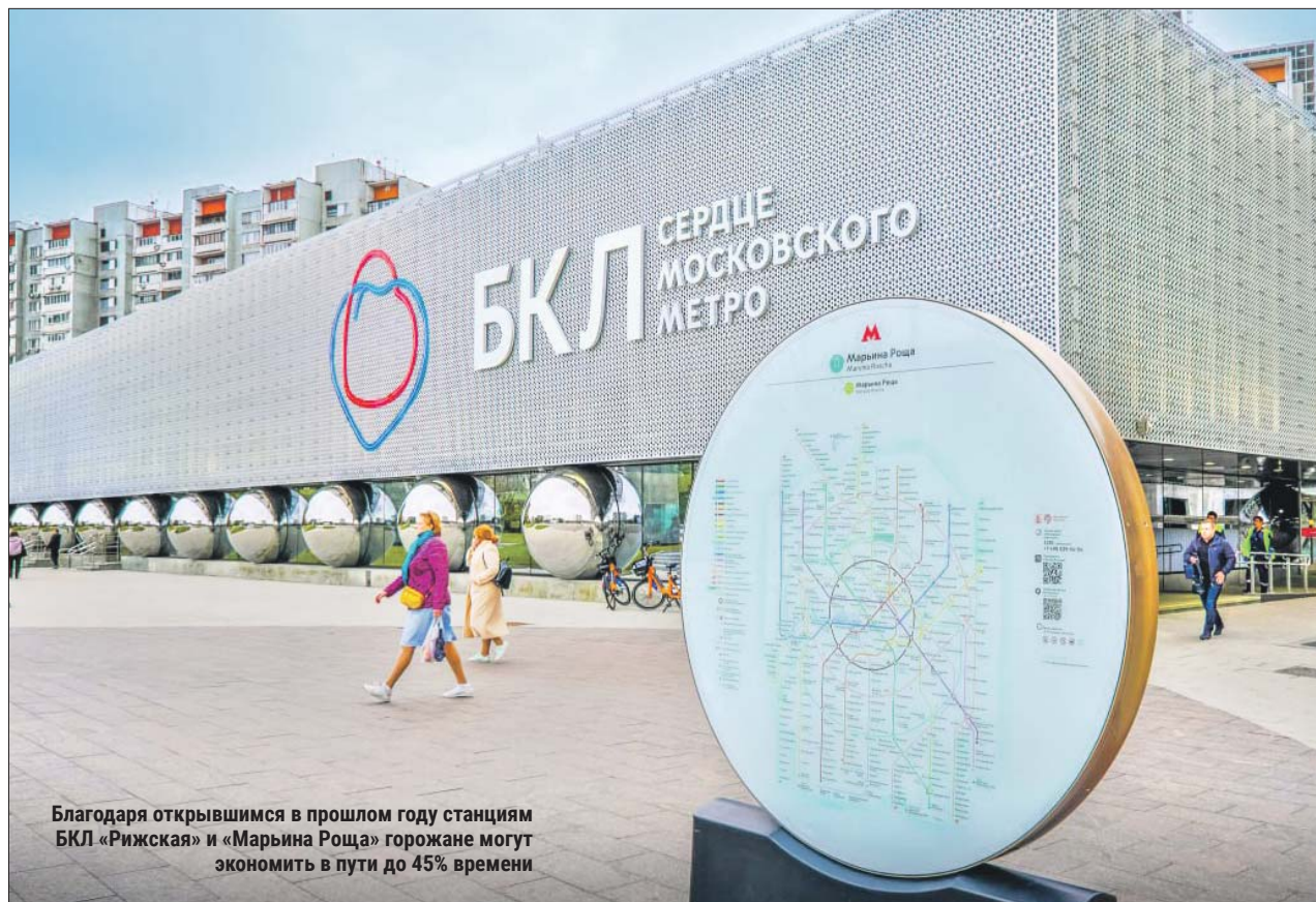
Благодаря открывшимся в прошлом году станциям БКЛ «Рижская» и «Марьиная Роща» горожане могут экономить в пути до 45% времени

Поликлинику оснастят новейшей медтехникой, включая цифровую рентгенологическую систему, аппараты УЗИ экспертного класса, ЛОР-установку.