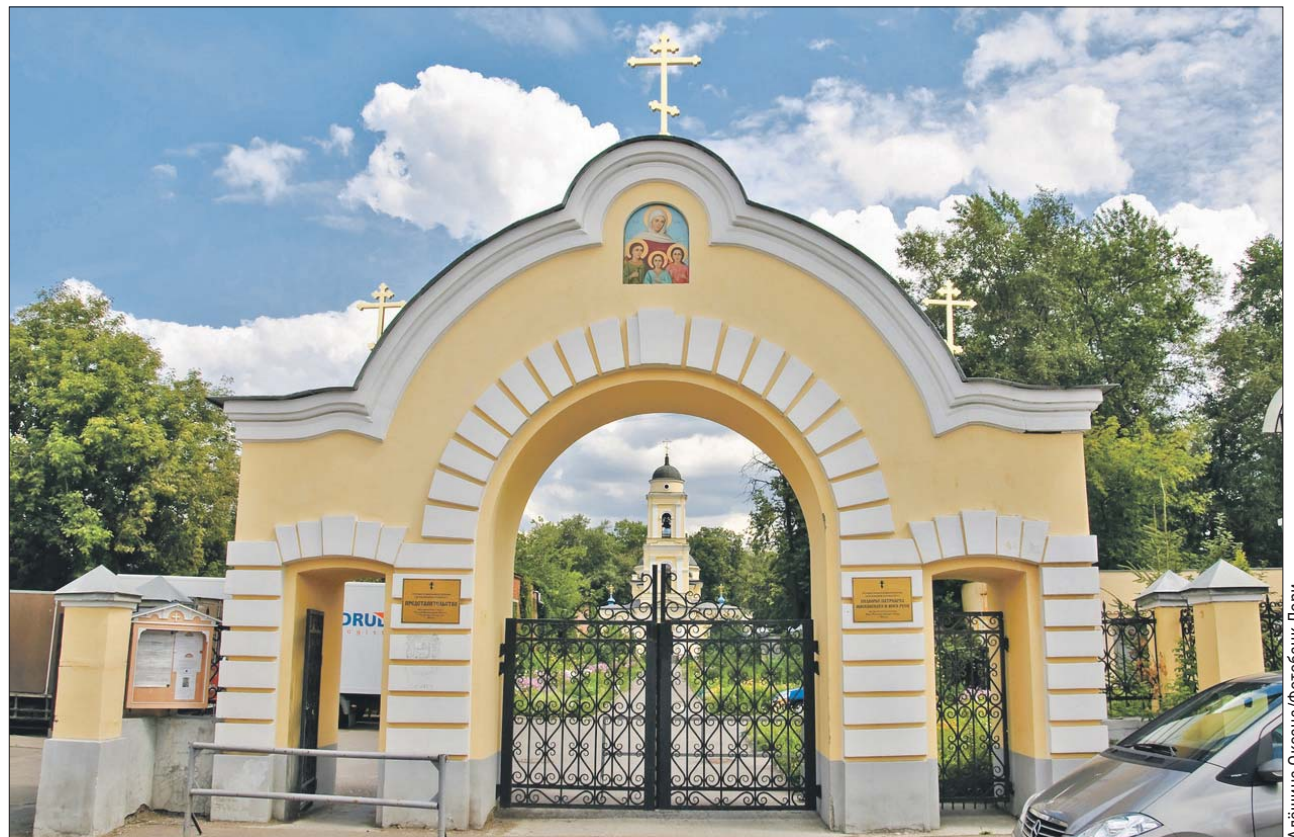
Миусское кладбище было основано в 1771 году во время эпидемии чумы

Могилка легендарного мультипликатора Александра Татарского, сделавшего переворот в отечественной мультипликации, также поражает своей скромностью. Маленькая фотография на гранитной доске. Корявое изображение вороны. Единственный искусственный цветочек. А ведь его «Пластилиновую ворону», «Следствие ведёт колобки», «Падал прошлогодний снег» знают все (под мелодию из последнего мультфильма хоронили Александра Михайловича). Он категорически отказался уехать в США, хотя ему предлагали огромные деньги. Ведь Родину нельзя увезти на подошвах своих сапог. На мультфиках Татарского выросло не одно поколение детей. Его за-