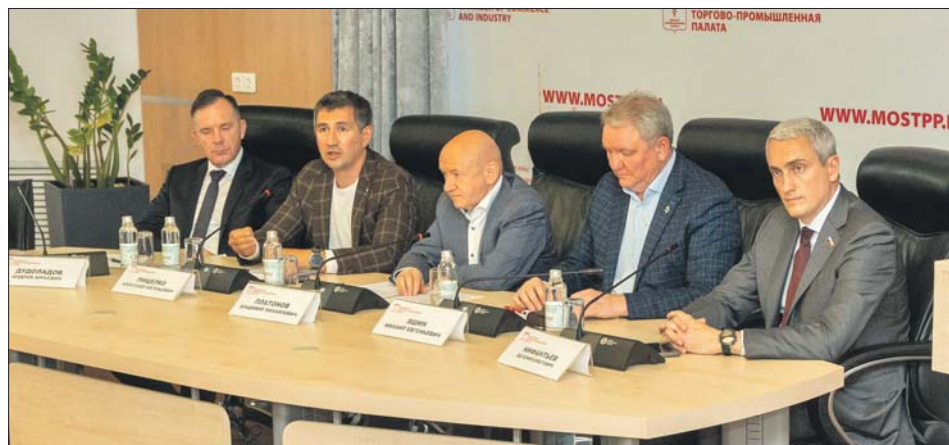
На пресс-конференции в ТПП Москвы сообщили, что участниками акции станут все проголосовавшие онлайн

С 20 августа по 8 сентября надо будет зарегистрироваться