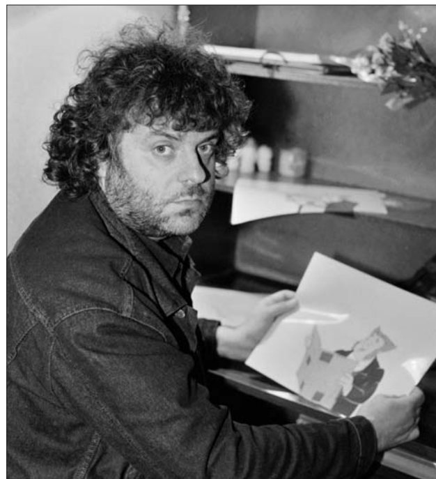
Легендарный мультипликатор Александр Татарский

— Да, особенно в выходные дни. Когда много на-