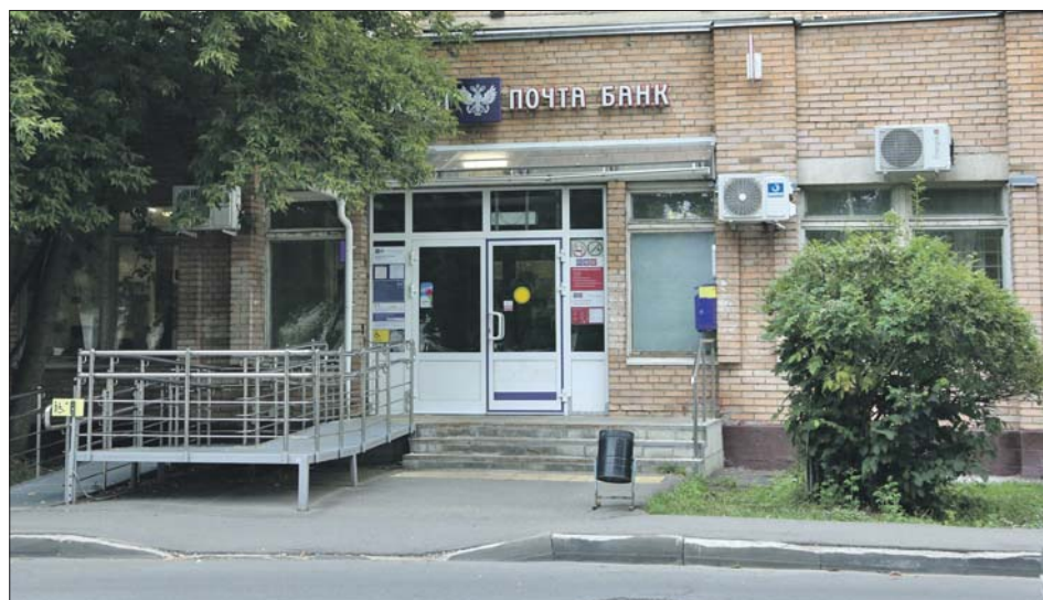
Двор, где в 2017 году совершилось нападение на инкассаторов

Ответным огнём один из грабителей был убит. Двое его поодельников скрылись с места преступления. При этом завладеть деньгами — 10,7 млн рублей — им не