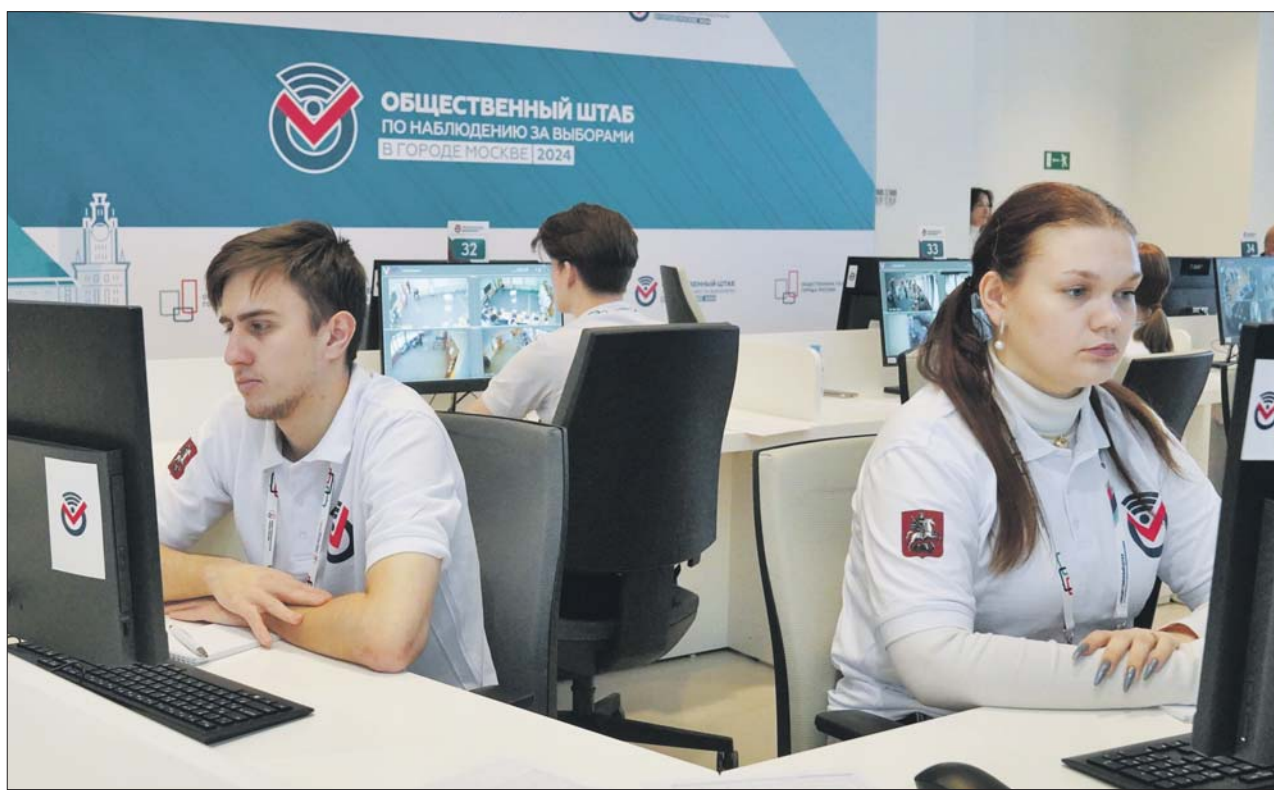
Общественный штаб по наблюдению за выборами принял решение протестировать систему ДЭГ во второй половине августа

— Современный пользователь электронных сервисов очень разборчив. Москвичи имеют возможность сравнивать качество и удобство десятков электронных продуктов. Есть функции, без которых современное приложение представить сложно