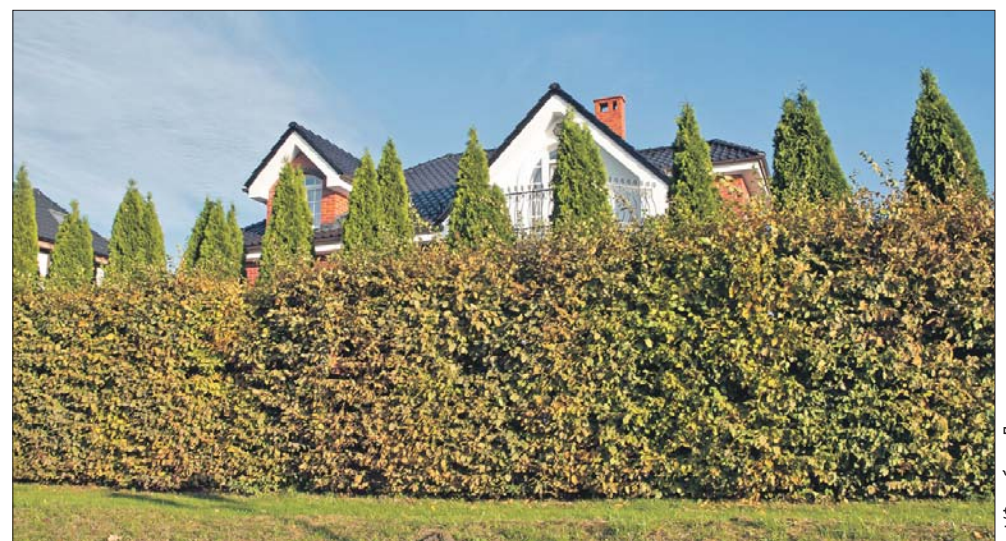
Высокие живые изгороди можно сделать из рябины, калины, лещины и туи

нуждаются в более внимательном подходе, в дополнительной обрезке с учётом старения. Если мы хотим получить плотную полутора-двухметровую изгородь, скажем, из боярышника, то стрижку кустарников нужно начинать, когда они достигли 50-70 сантиметров. Делают это в середине лета. Высокие изгороди можно сделать из рябины, калины, лещины, туи. Деревца при этом высаживают на расстоянии примерно 60 сантиметров друг от друга. Ирина КОЛПАКОВА