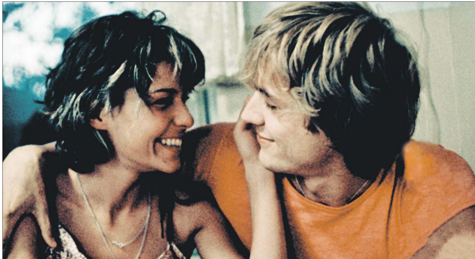
Роли в «Маленькой Вере» сделали Наталью Негоду и Андрея Соколова знаменитыми

Для съёмок знаменитой сцены с дракой на дискотеке в Жданов приехал известный каскадёр и поста-