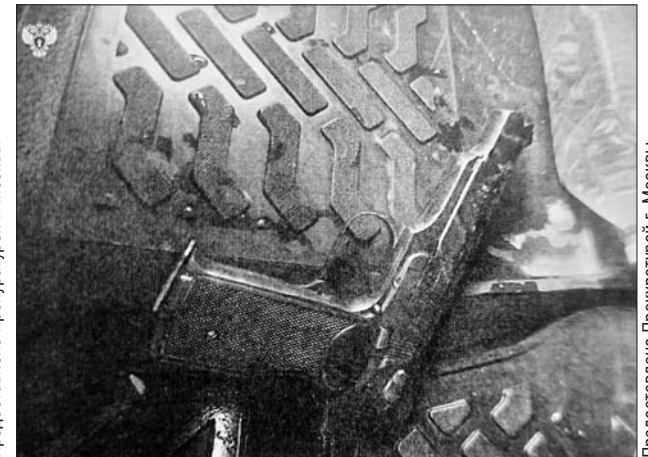
Пистолет нападавшего остался на месте преступления

Утром 14 февраля во дворе дома у почтового отделения снег чистили мужчины в оранжевых жилетах. В 10.00 на место приехала машина «Спецсвязи», остановилась ненадолго, и оттуда стал выходить инкассатор с сумкой, в которой лежало больше 1,5 млн рублей. Вдруг с двух сторон к спецмашине бросились те самые «дворники», побро-