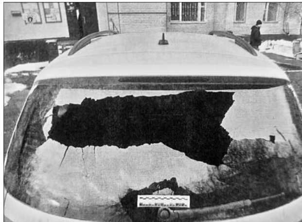
Машина, в которую во время перестрелки попала пуля

— Пару дней они наблюдали за машиной инкассаторов, установили их маршрут передвижения, график и состав сотрудников, а потом выбрали удобное для нападения место рядом с почтовым отделением, — сообщили «ЗБ» в пресс-службе Прокуратуры г. Москвы.