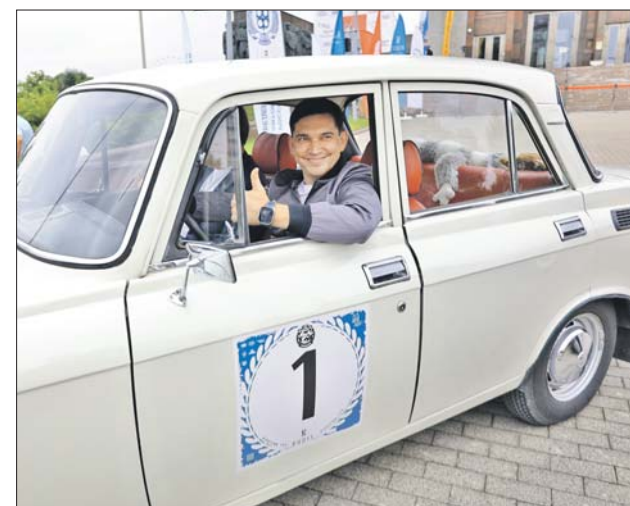
Префект СВАО Сергей Мельников дал старт гонке на «Москвиче-2140»

3 августа на ВДНХ стартовало ралли ретроавтомобилей «Подмосковье RODIS Классик Тур», в котором приняли участие более 60 машин. Внимание привлёк автомобиль «Победа» 1949 года.