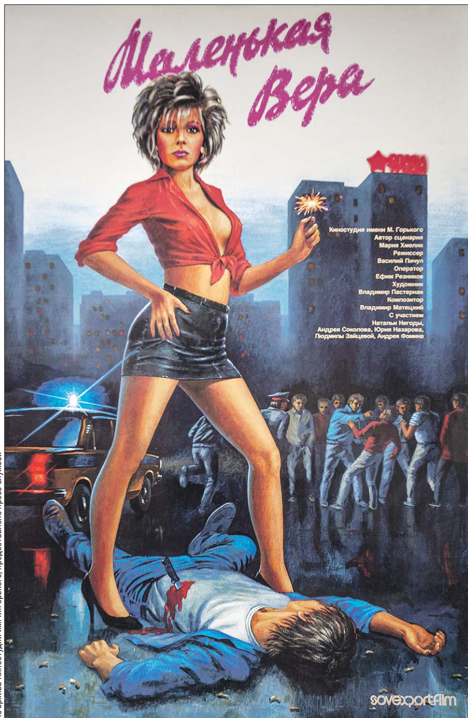
В конце 1980-х было выпущено множество постеров, рекламирующих картину

ВГИКа Василий Пичул. А курировать «Маленькую Веру» решила сама Татьяна Лиознова. Небольшой промышленный город, который Мария Хмелик описала в сценарии, очень напоминал родину её мужа — Мариуполь, который в те времена назывался Жданов. Именно там и решили снимать кино. Для съёмки арендовали обычную тесную квартирку на окраине города.