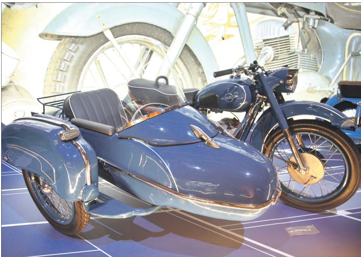
Иж «Юпитер» — мечта советских охотников и рыбаков

О некоторых мотоциклах сняты документальные фильмы