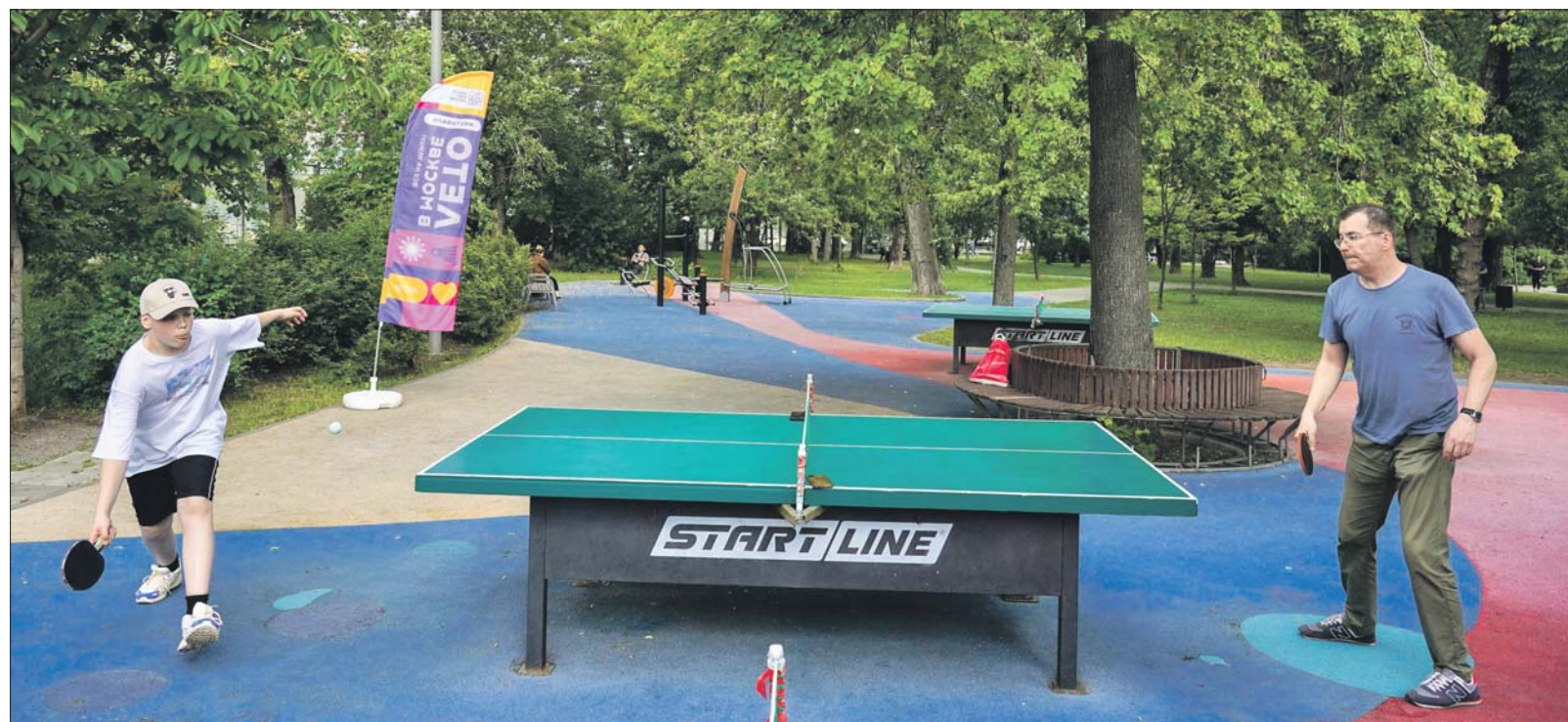
8 августа в Фестивальном парке состоится турнир по настольному теннису. А пока можно потренироваться

8 августа в 18.00 в сквере на Ярославском ш., вл. 111, выступают ведущие коллективы Московского многофункционального культурного центра.