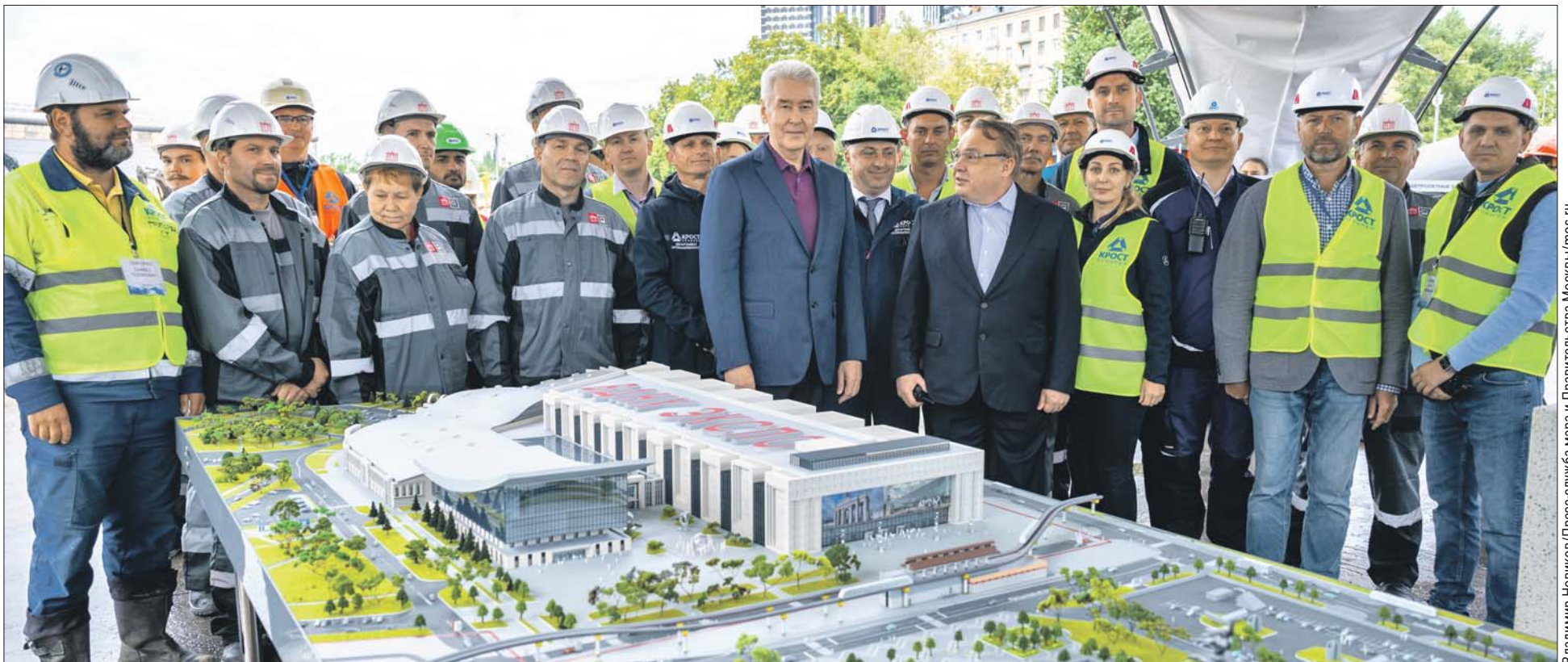
Сергей Собянин со строителями будущего конгресс-центра

Это будет единый комплекс: павильоны №70, 75 и новый